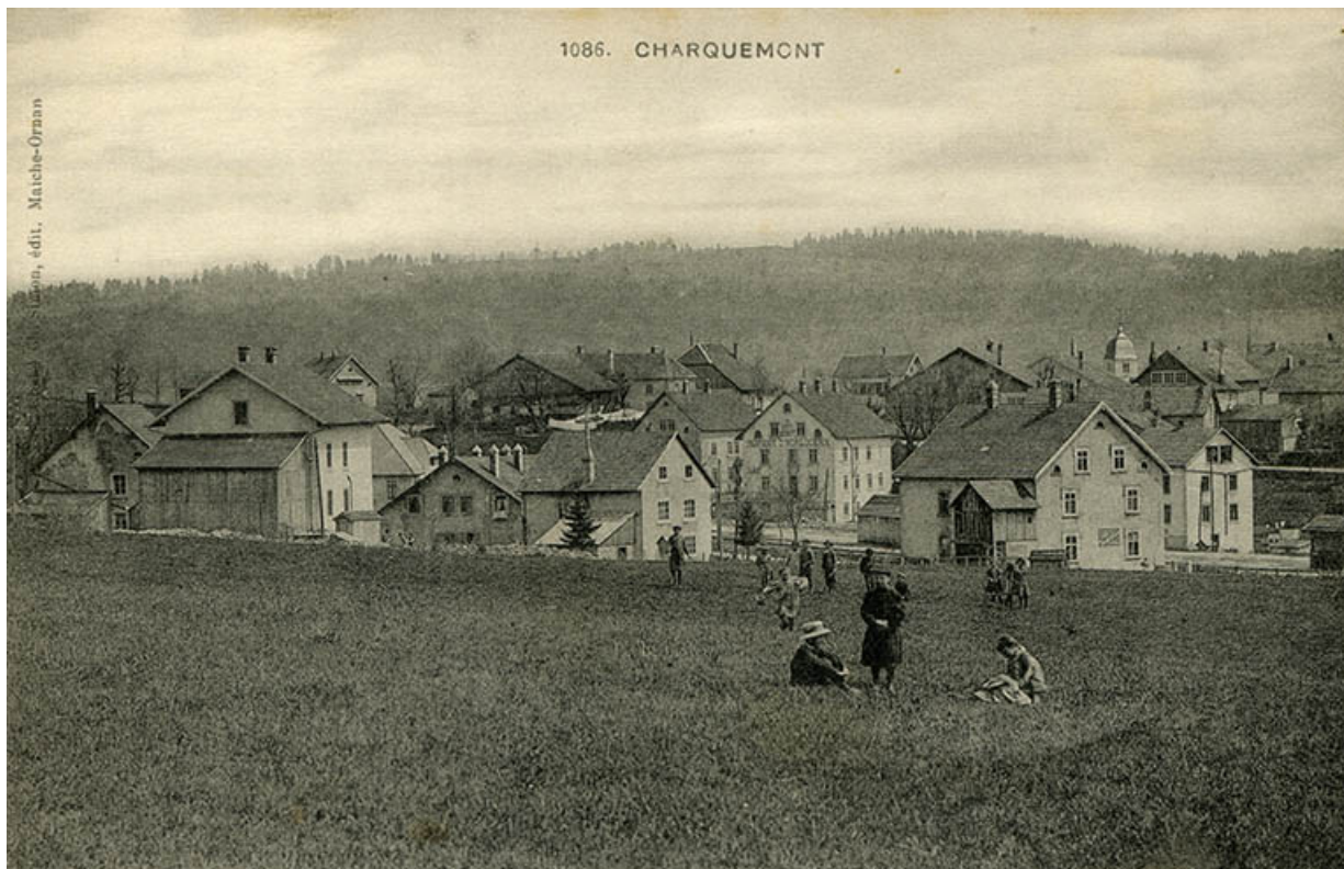
1086. Charquemont [carrefour des rues de Besançon et Victor Hugo, et de la Grande Rue, depuis le nord-ouest], 1er quart 20e siècle.