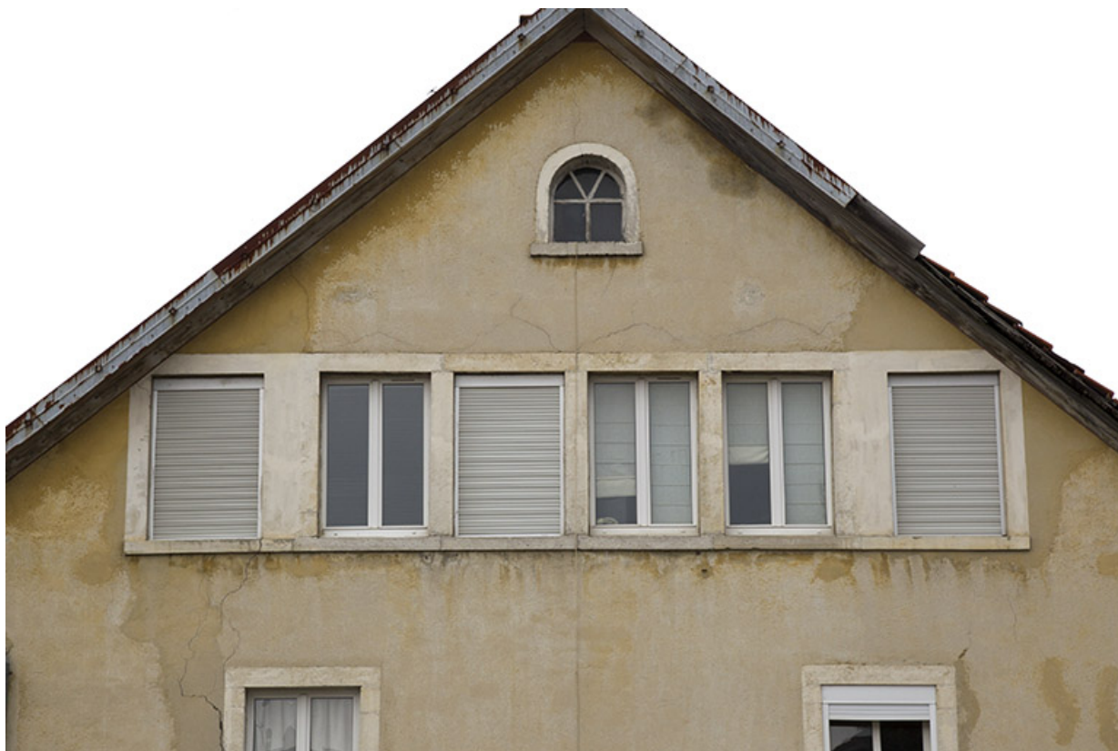
Façade postérieure en 2012 (avant rénovation) : fenêtres multiples. 25, Charquemont, 1 rue de la Gare