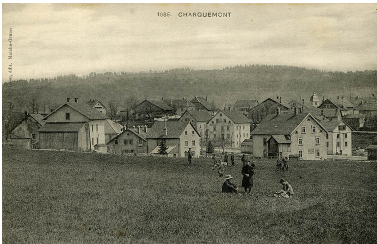
1086. Charquemont [carrefour des rues de Besançon et Victor Hugo, et de la Grande Rue, depuis le nord-ouest], 1er quart 20e siècle.