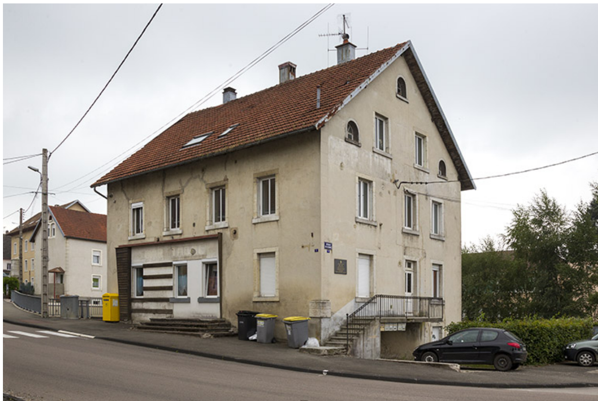
Façades antérieure et latérale gauche, en 2012 (avant rénovation). 25, Charquemont, 1 rue de la Gare