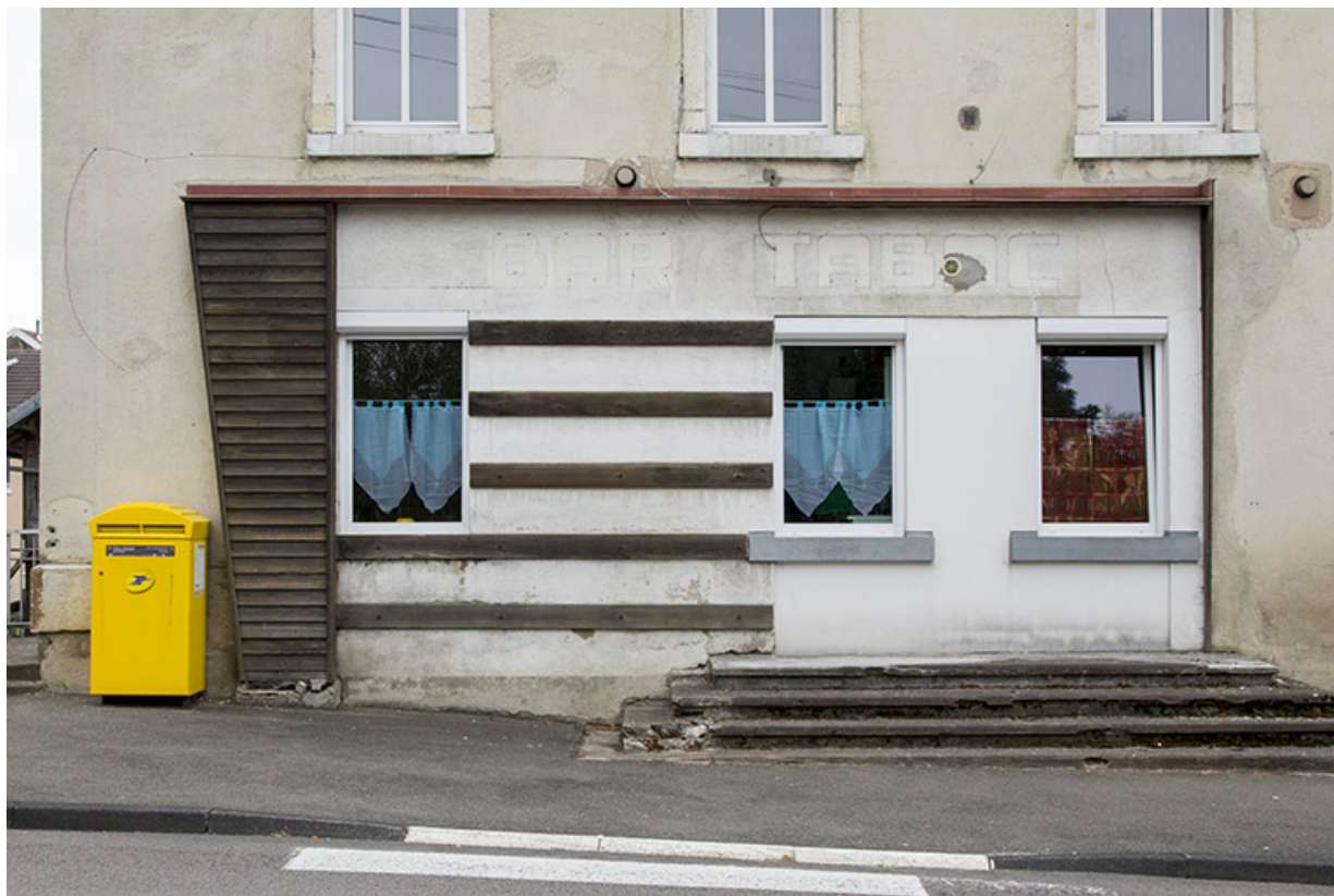
Façade latérale gauche en 2012 (avant rénovation) : ancienne devanture de commerce. 25, Charquemont, 1 rue de la Gare