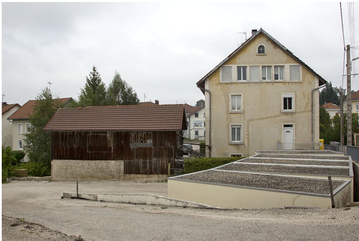
Vue d'ensemble depuis le sud (façade postérieure), en 2012 (avant rénovation). 25, Charquemont, 1 rue de la Gare