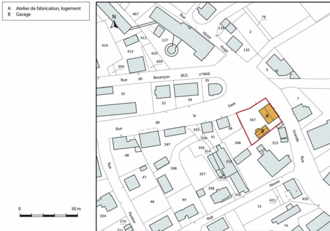
Plan-masse et de situation. Extrait du plan cadastral, 2015, section AI. 25, Charquemont, 1 rue de la Gare