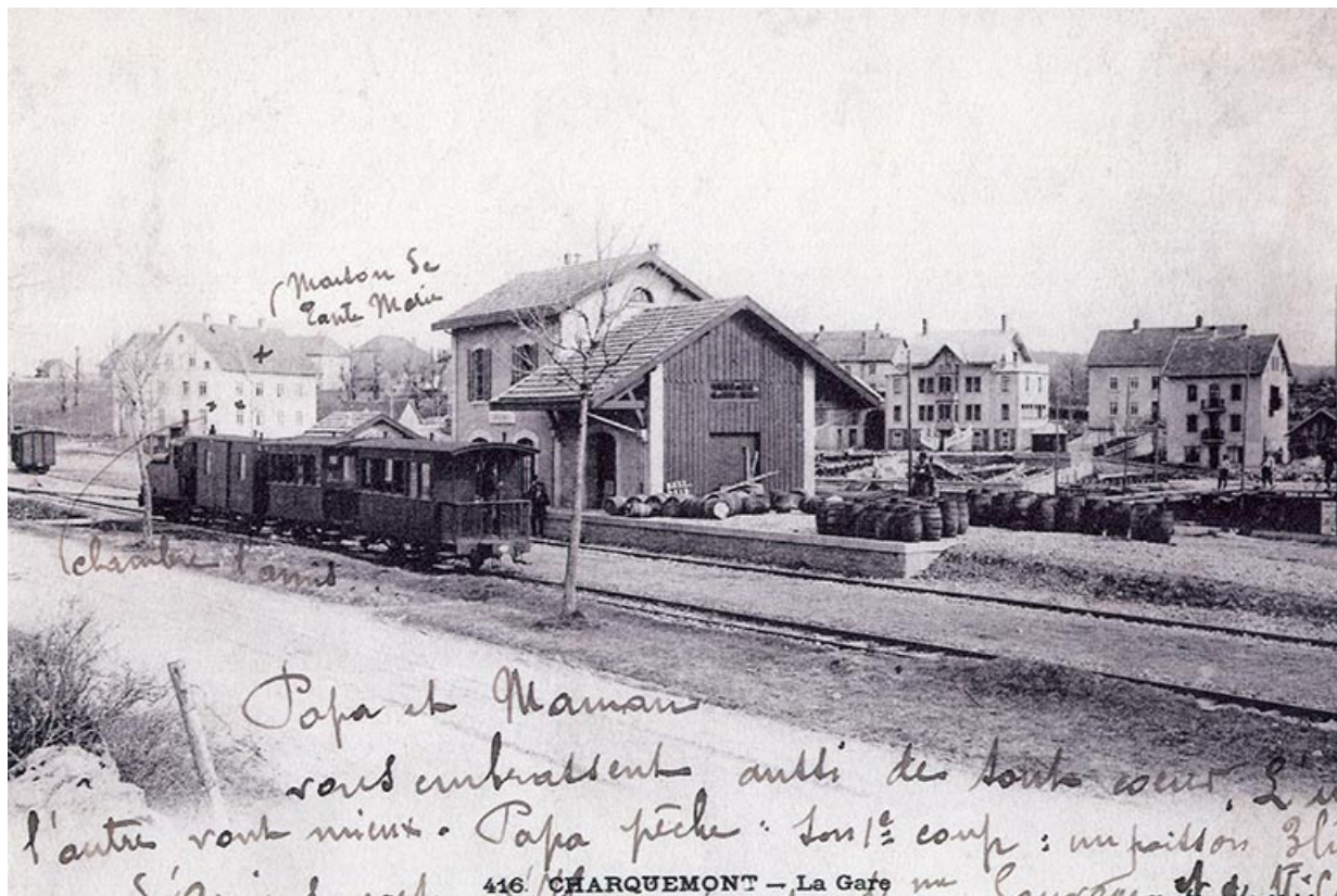
416. Charquemont - La Gare, 1er quart 20e siècle. Le bâtiment correspond à la " maison de tante Marie ". 25, Charquemont, 1 rue de la Gare