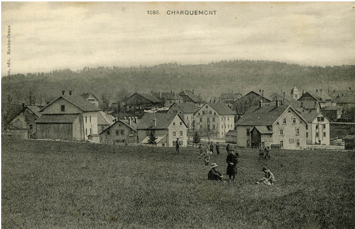
1086. Charquemont [carrefour des rues de Besançon et Victor Hugo, et de la Grande Rue, depuis le nord-ouest], 1er quart 20e siècle.