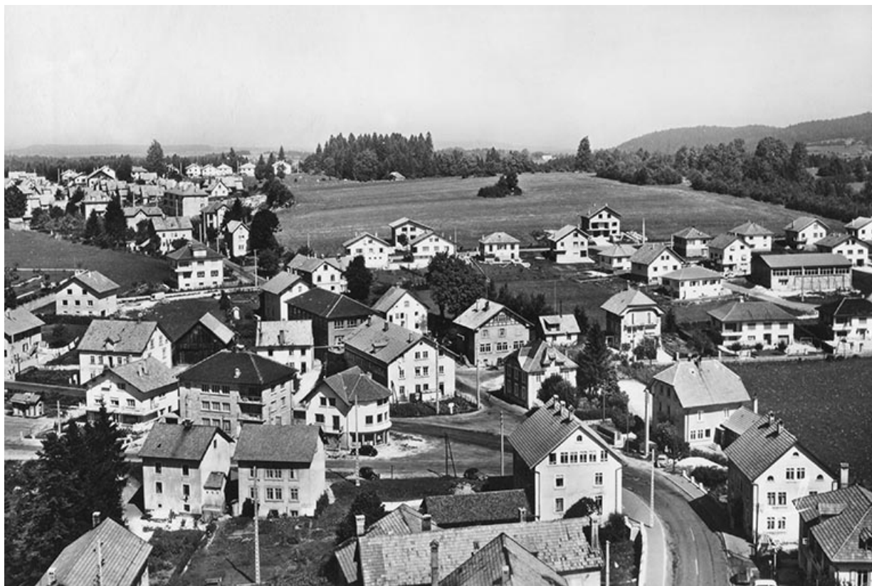
En avion au-dessus de... 7. Charquemont (Doubs) [vue aérienne des rues de la Gare, Victor Hugo et des Villas depuis le sud], entre 1958 et 1967.