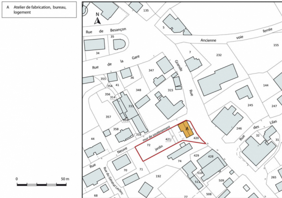
Plan-masse et de situation. Extrait du plan cadastral, 2015, section AI. 25, Charquemont, 8 Grande Rue