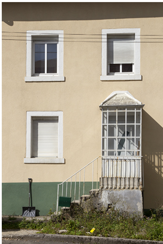
Façade antérieure : entrée.