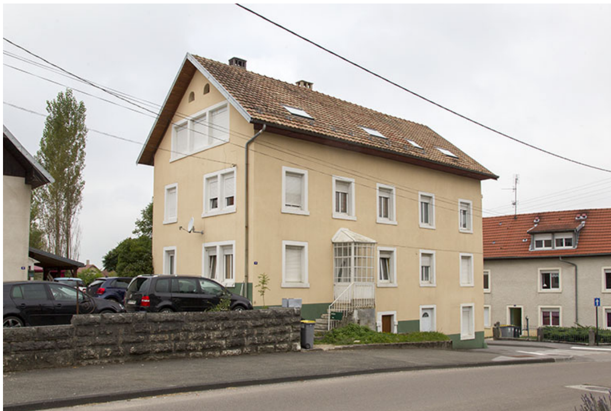
Un immeuble de 1887 : immeuble Bulle, café Rième et atelier d'horlogerie Cailler-Rougnon, puis usine de fournitures pour l'horlogerie puis de décolletage Quenot (8 Grande Rue).