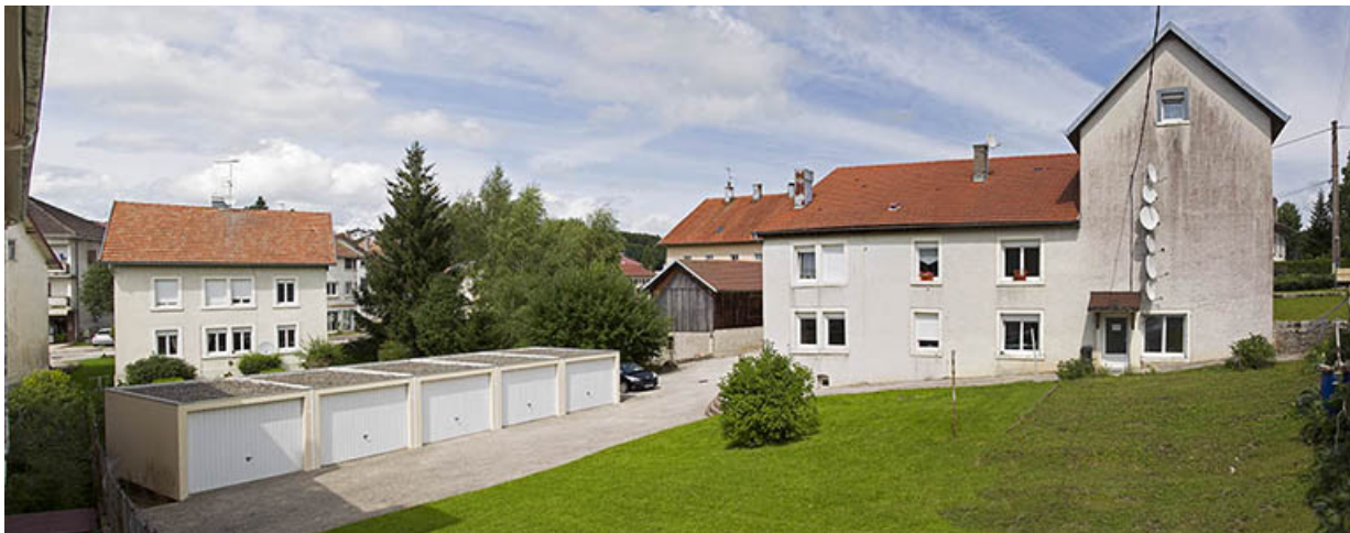
Vue d'ensemble, depuis l'ouest. De gauche à droite : garages, aile en retour et bâtiment principal (mur pignon). 25, Charquemont, 2 Rue Neuve

N° de l'illustration : 20142501873NUC4AQ