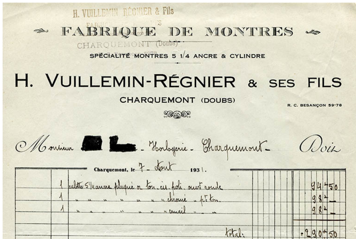
Papier à en-tête de la fabrique de montres H. Vuillemin-Régner & ses Fils, 7 août 1931. 25, Charquemont, 17 et 19 rue Victor Hugo