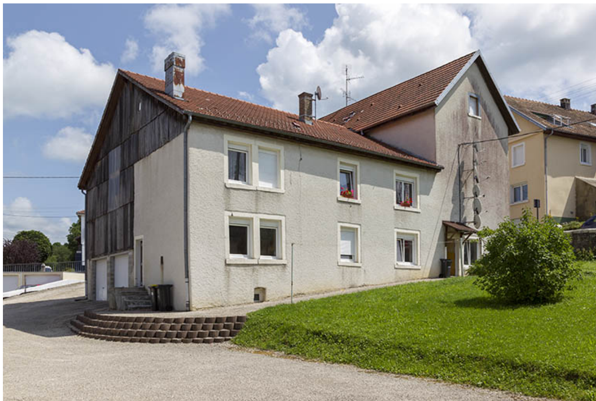
Aile en retour : façades nord et ouest.