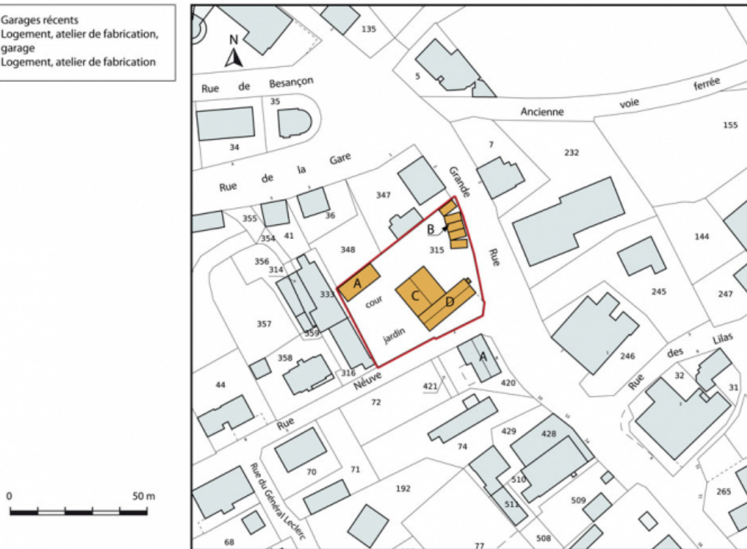
Plan-masse et de situation. Extrait du plan cadastral, 2015, section AI. 25, Charquemont, 2 Rue Neuve