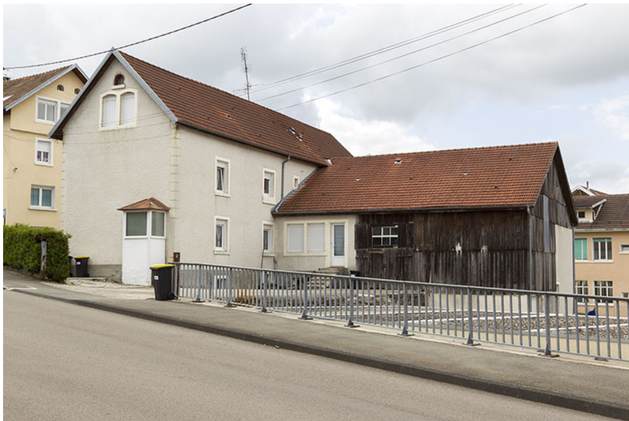
Bâtiment principal (façades postérieure et latérale droite) et aile en retour, depuis le nord. 25, Charquemont, 2 Rue Neuve