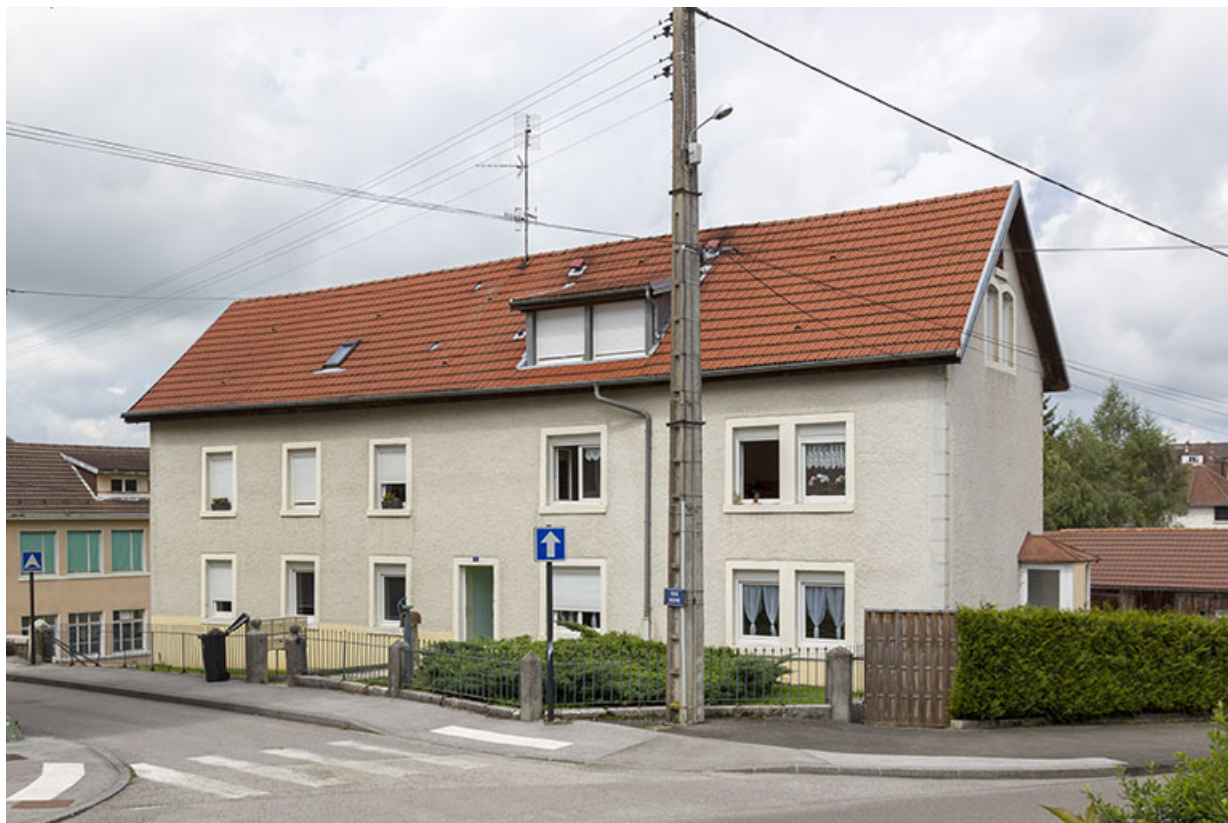
Bâtiment principal : façade antérieure (sud), de trois quarts droite.