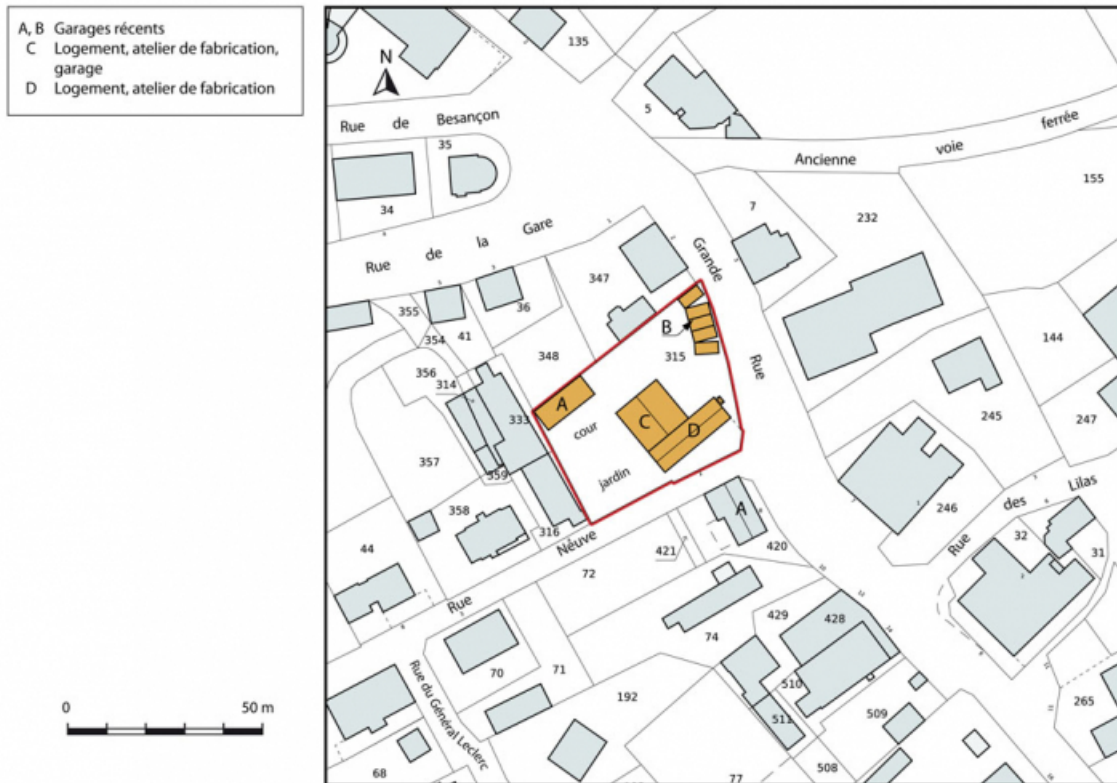
Plan-masse et de situation. Extrait du plan cadastral, 2015, section AI. 25, Charquemont, 2 Rue Neuve