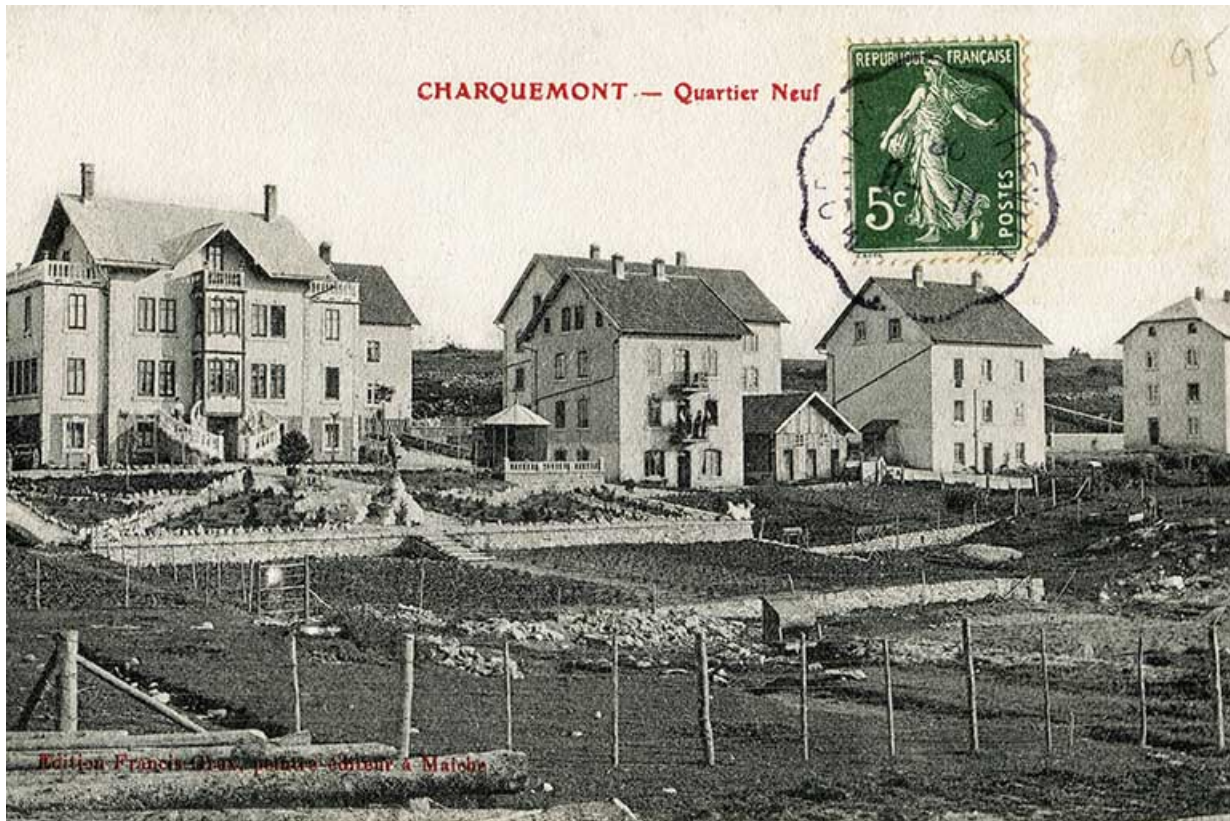
La Rue Neuve (rue des horlogers), avec de gauche à droite les ateliers de l'Union ouvrière (n° 6), Gigandet-Bernard (n° 8), Erard (n° 10) et Donzé (n° 12) : Charquemont - Quartier Neuf, entre 1903 et 1918 ?