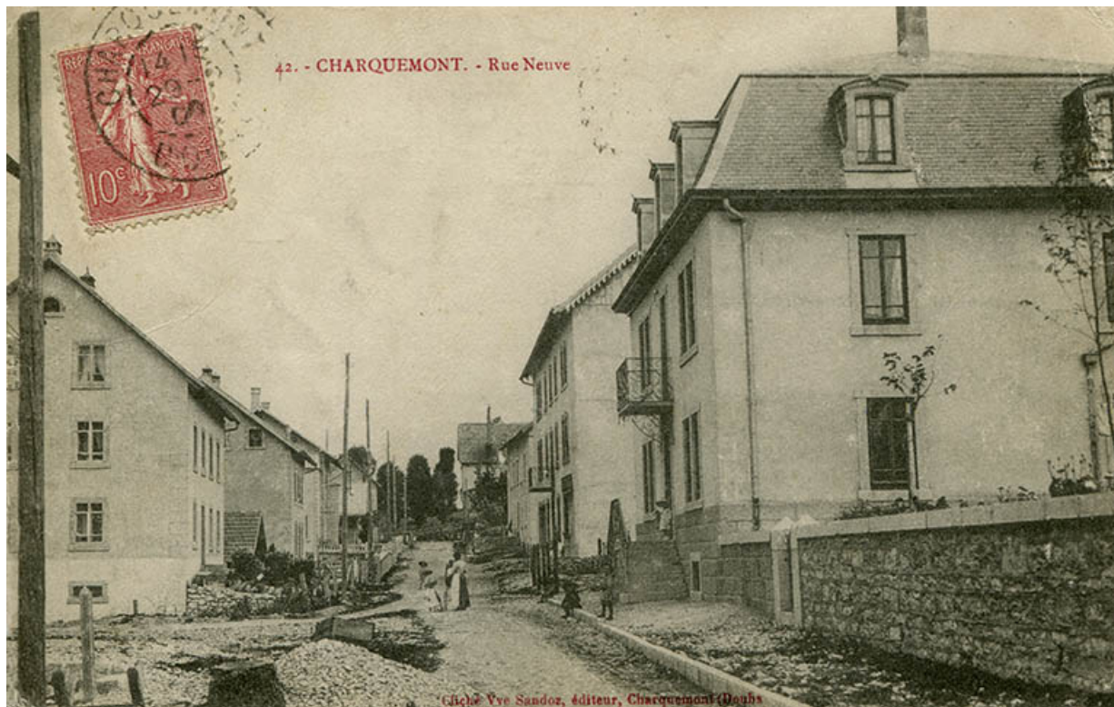
42. - Charquemont. - Rue Neuve [depuis le carrefour avec la rue Pasteur], décennie 1900 (avant 1908). 25, Charquemont, 10 Rue Neuve