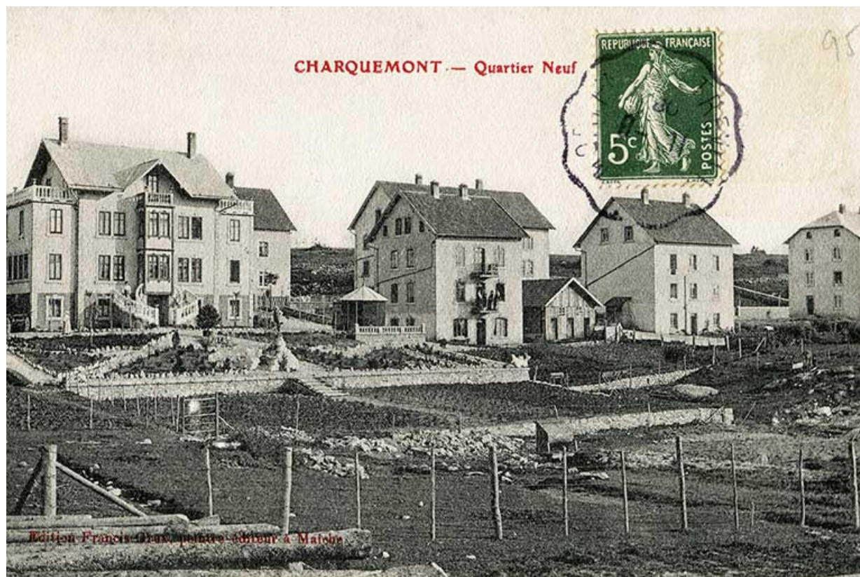
La Rue Neuve (rue des horlogers), avec de gauche à droite les ateliers de l'Union ouvrière (n° 6), Gigandet-Bernard (n° 8), Erard (n° 10) et Donzé (n° 12) : Charquemont - Quartier Neuf, entre 1903 et 1918 ?