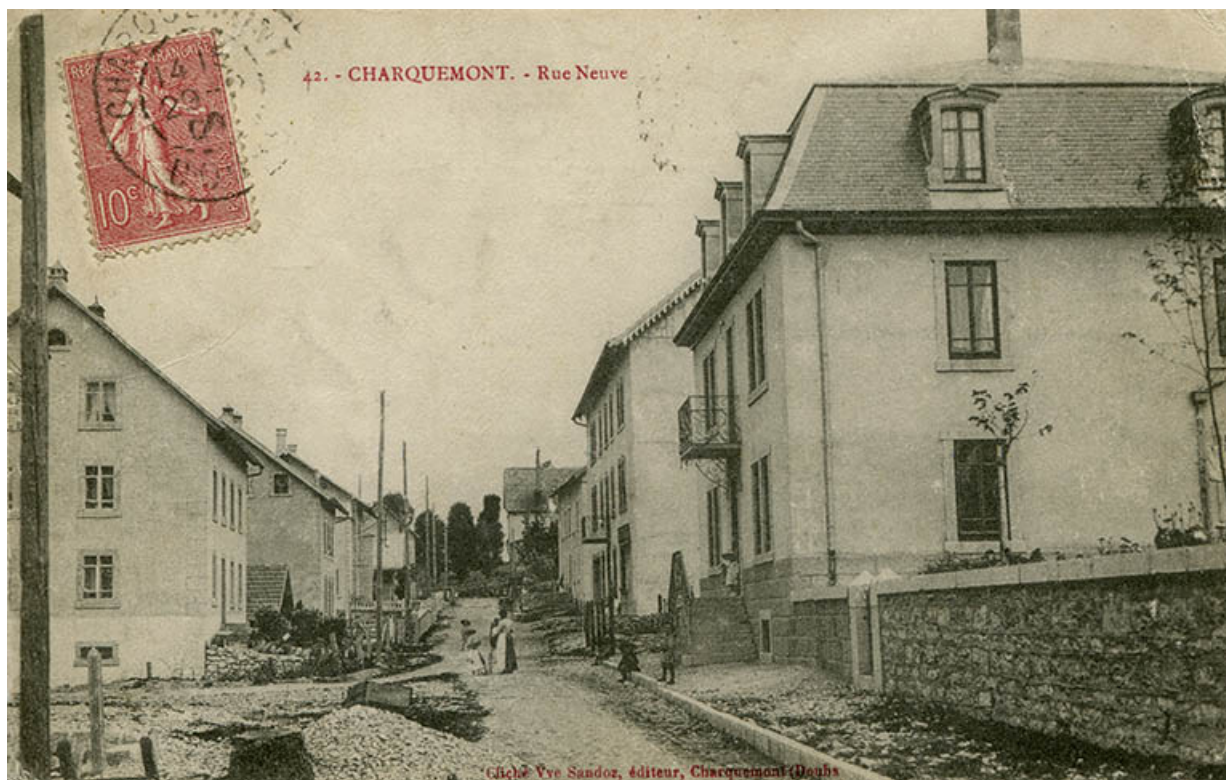
42. - Charquemont. - Rue Neuve [depuis le carrefour avec la rue Pasteur], décennie 1900 (avant 1908). 25, Charquemont, 10 Rue Neuve