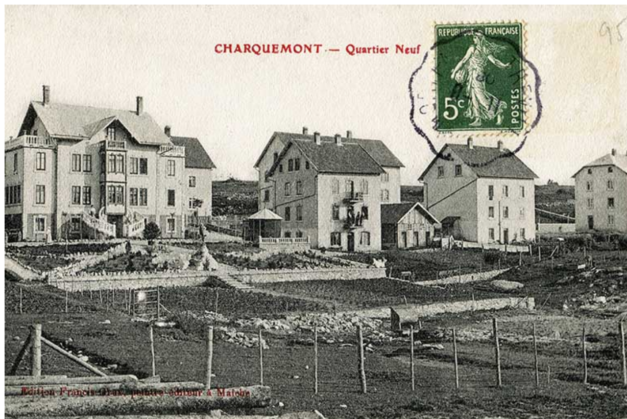
La Rue Neuve (rue des horlogers), avec de gauche à droite les ateliers de l'Union ouvrière (n° 6), Gigandet-Bernard (n° 8), Erard (n° 10) et Donzé (n° 12) : Charquemont - Quartier Neuf, entre 1903 et 1918 ? 25, Charquemont