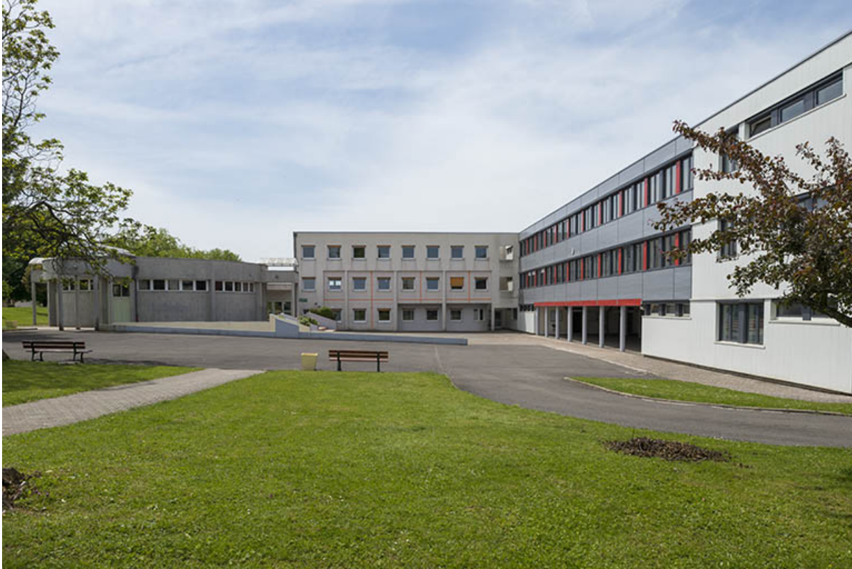
Vue d'ensemble des externats depuis l'est.