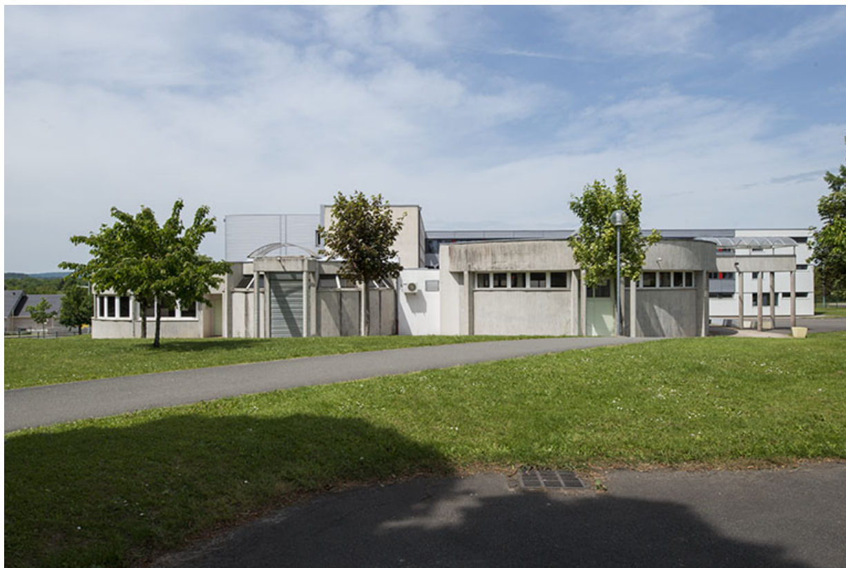
Depuis le sud, vue sur les façades sud de l'externat (la salle polyvalente et le centre de documentation et d'information.) 25, Bethoncourt impasse Camus