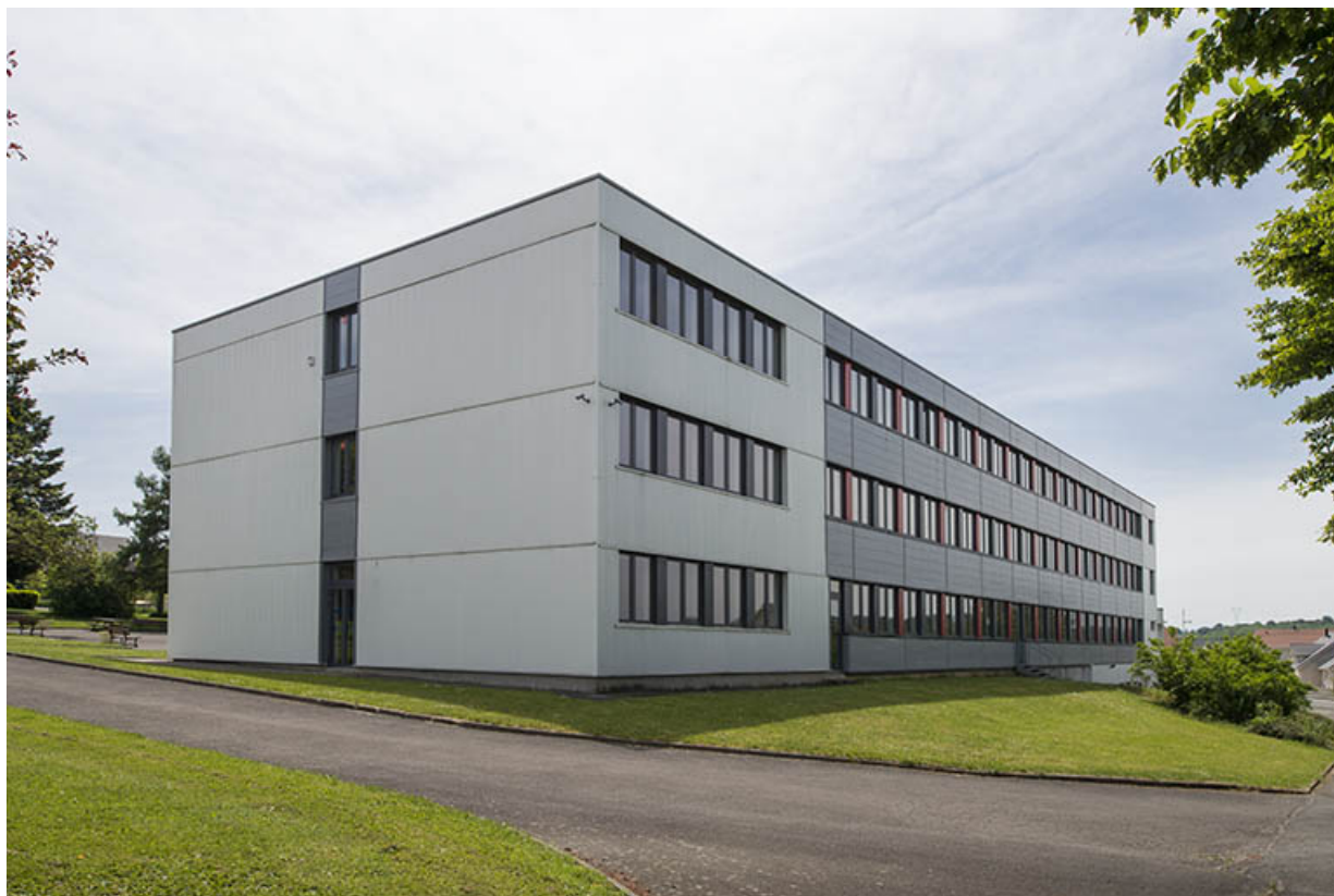
Angle nord-est, pignon est et façade postérieure nord de l'externat nord. 25, Bethoncourt impasse Camus