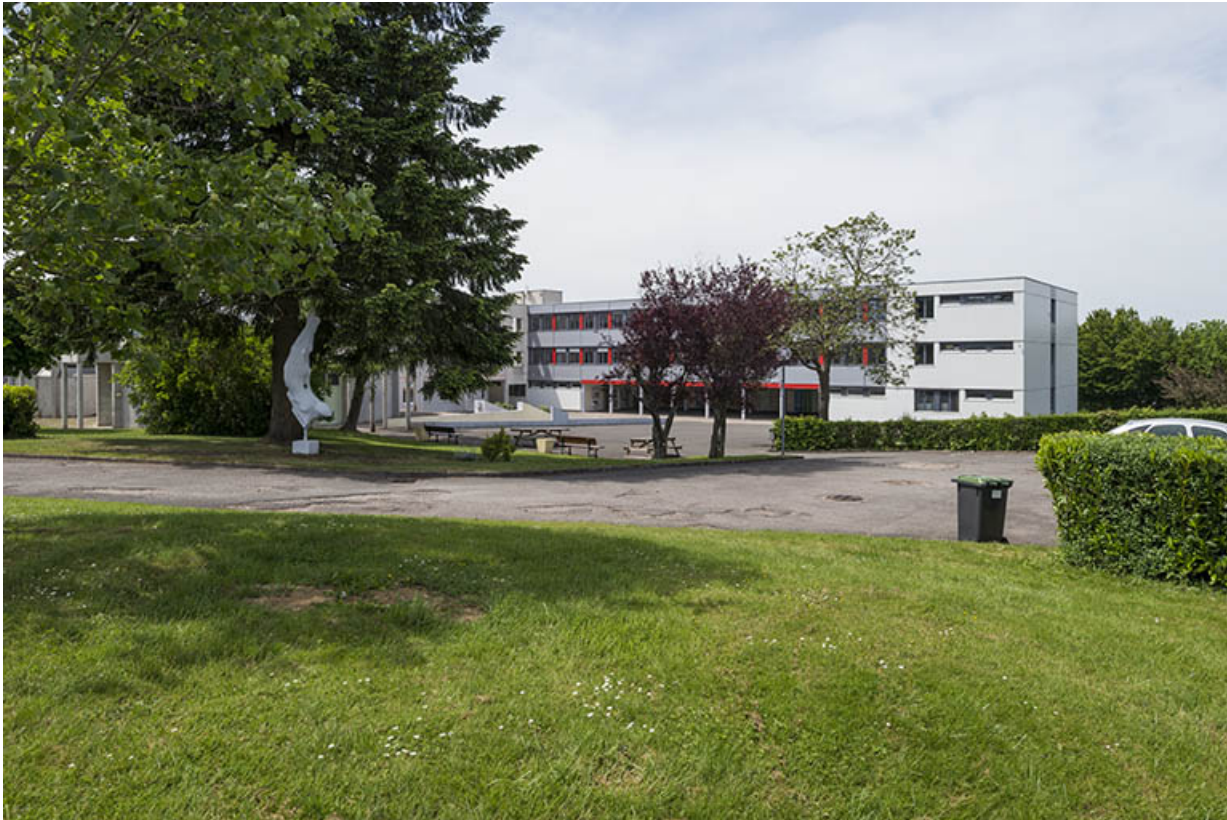
Vue d'ensemble depuis le sud : la cour et la sculpture d'Oudot.