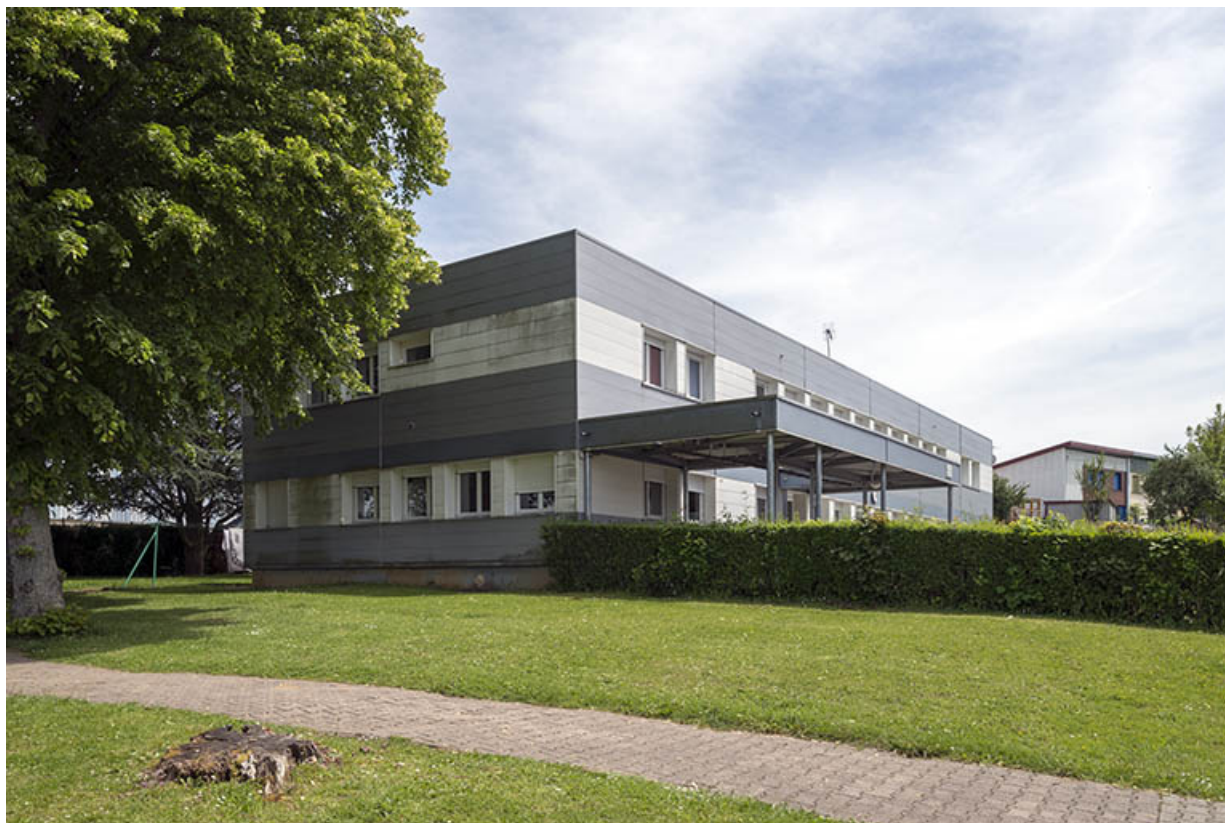
Angle nord-ouest, pignon nord et façade ouest de l'administration. 25, Bethoncourt impasse Camus