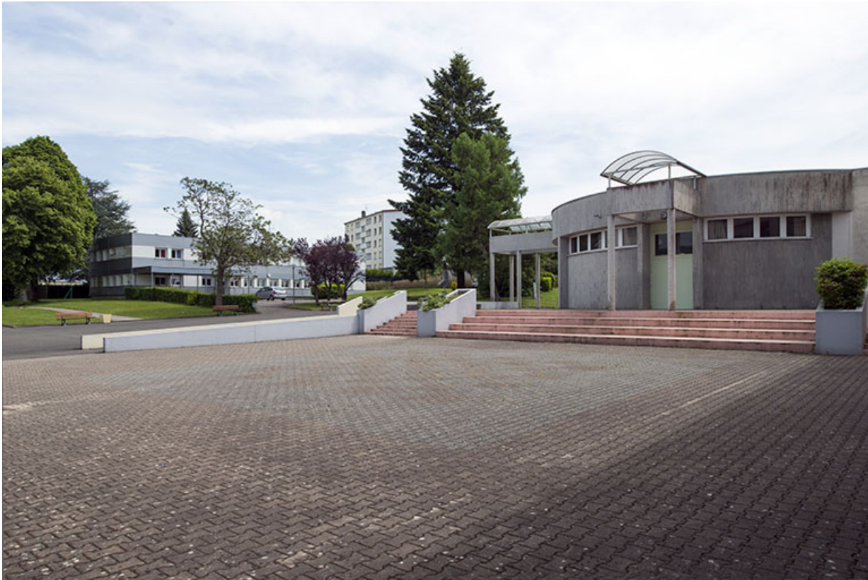
La cour et vue sur l'administration à l'est.