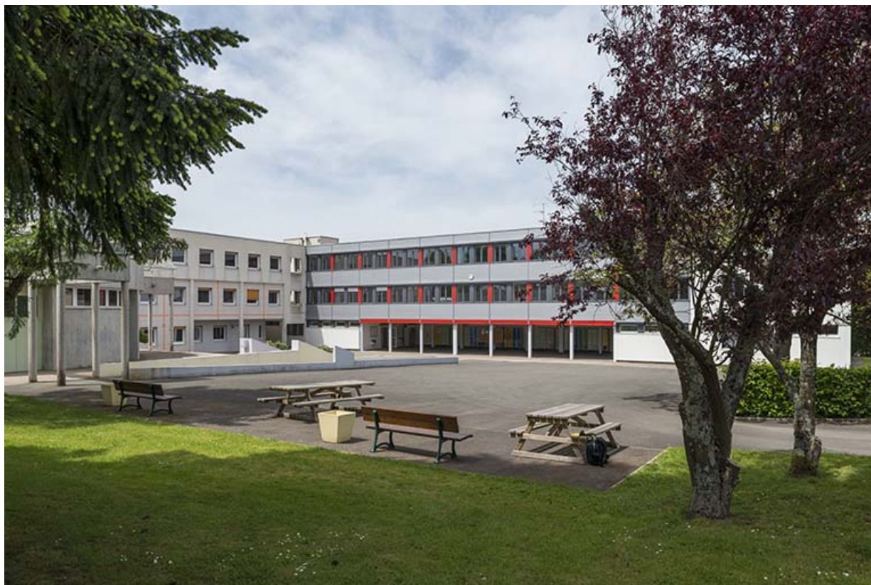
La cour, bordée par les externats au nord et à l'ouest.