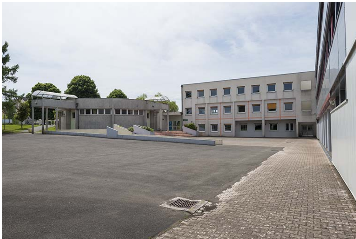
La cour vue du nord-est.