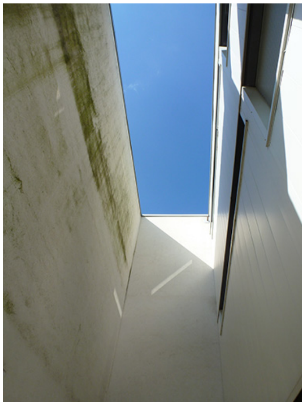
Détail architectural à la jonction des externats.