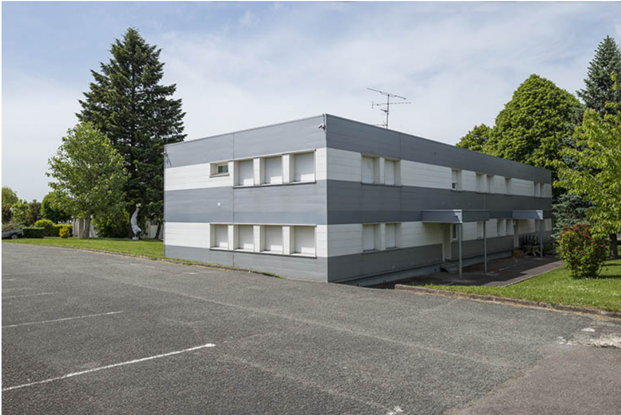
Angle sud-est, façade postérieure est, pignon sud de l'administration. 25, Bethoncourt impasse Camus