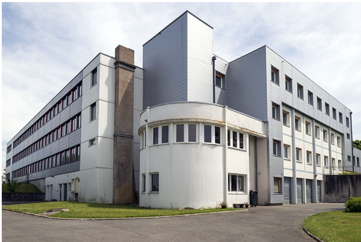
Bethoncourt, site Camus du lycée des Huisselets : externat et cafétéria.