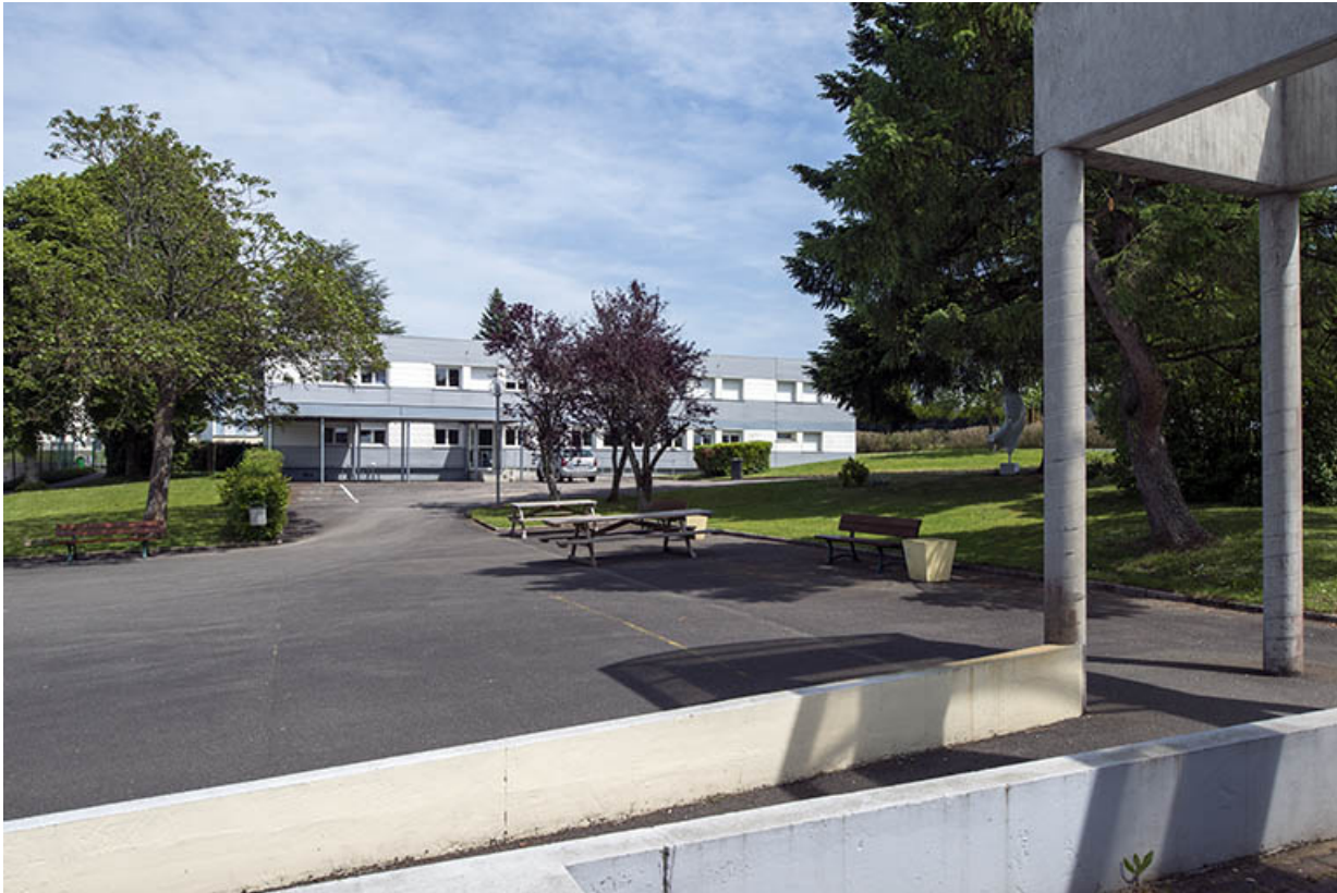
Face à l'administration, depuis l'ouest. 25, Bethoncourt impasse Camus