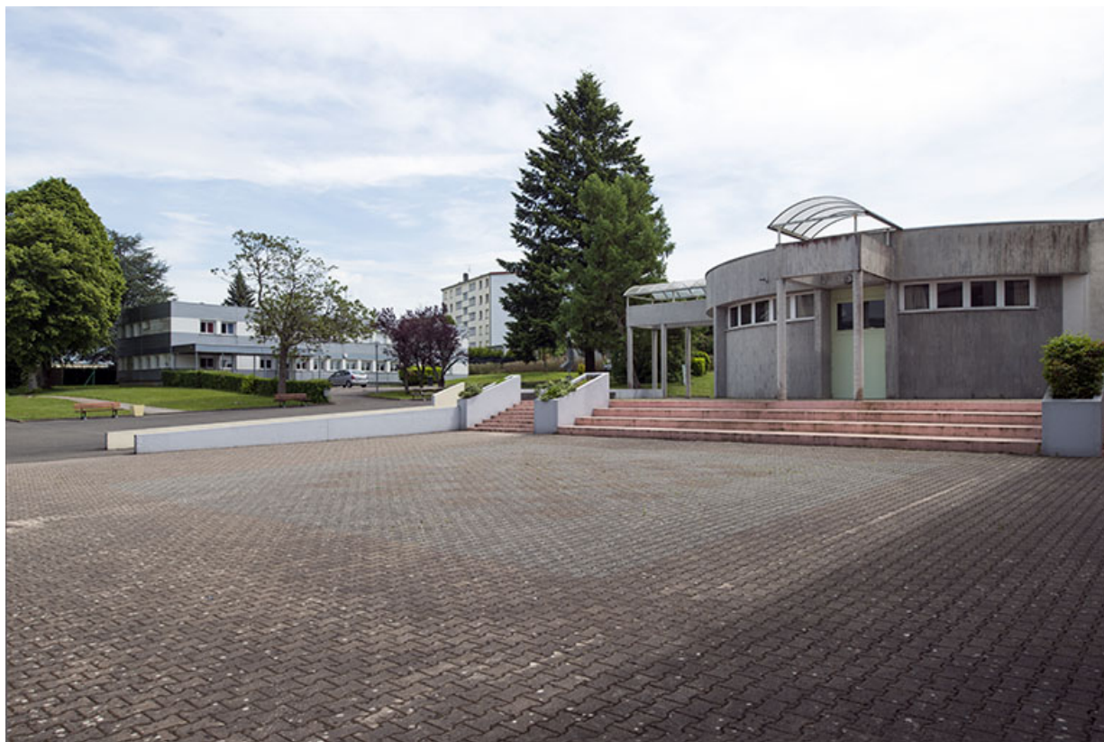
La cour et vue sur l'administration à l'est. 25, Bethoncourt impasse Camus