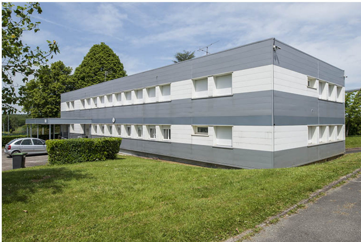
Angle sud-ouest, façade antérieure ouest d'entrée, pignon sud de l'administration. 25, Bethoncourt impasse Camus