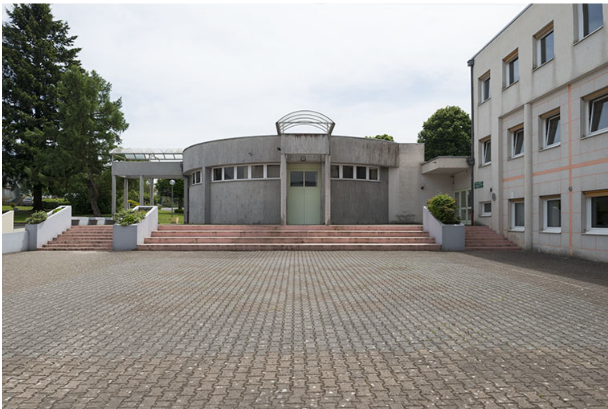
La cour, face à la façade nord de la salle polyvalente.