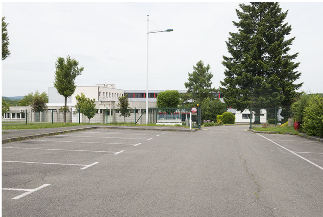
Entrée des véhicules, façades sud donnant sur la placette.