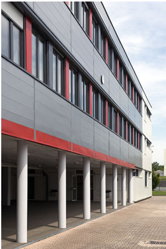
Vue sur le préau et l'externat fermant la cour au nord. 25, Bethoncourt impasse Camus