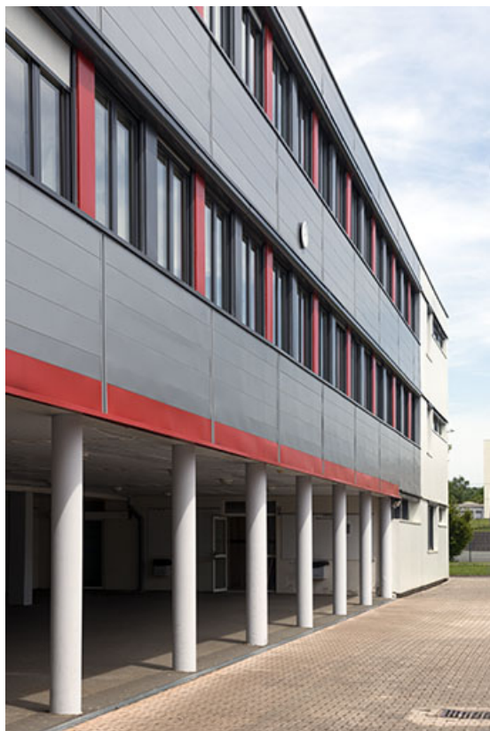
Vue sur le préau et l'externat fermant la cour au nord. 25, Bethoncourt impasse Camus