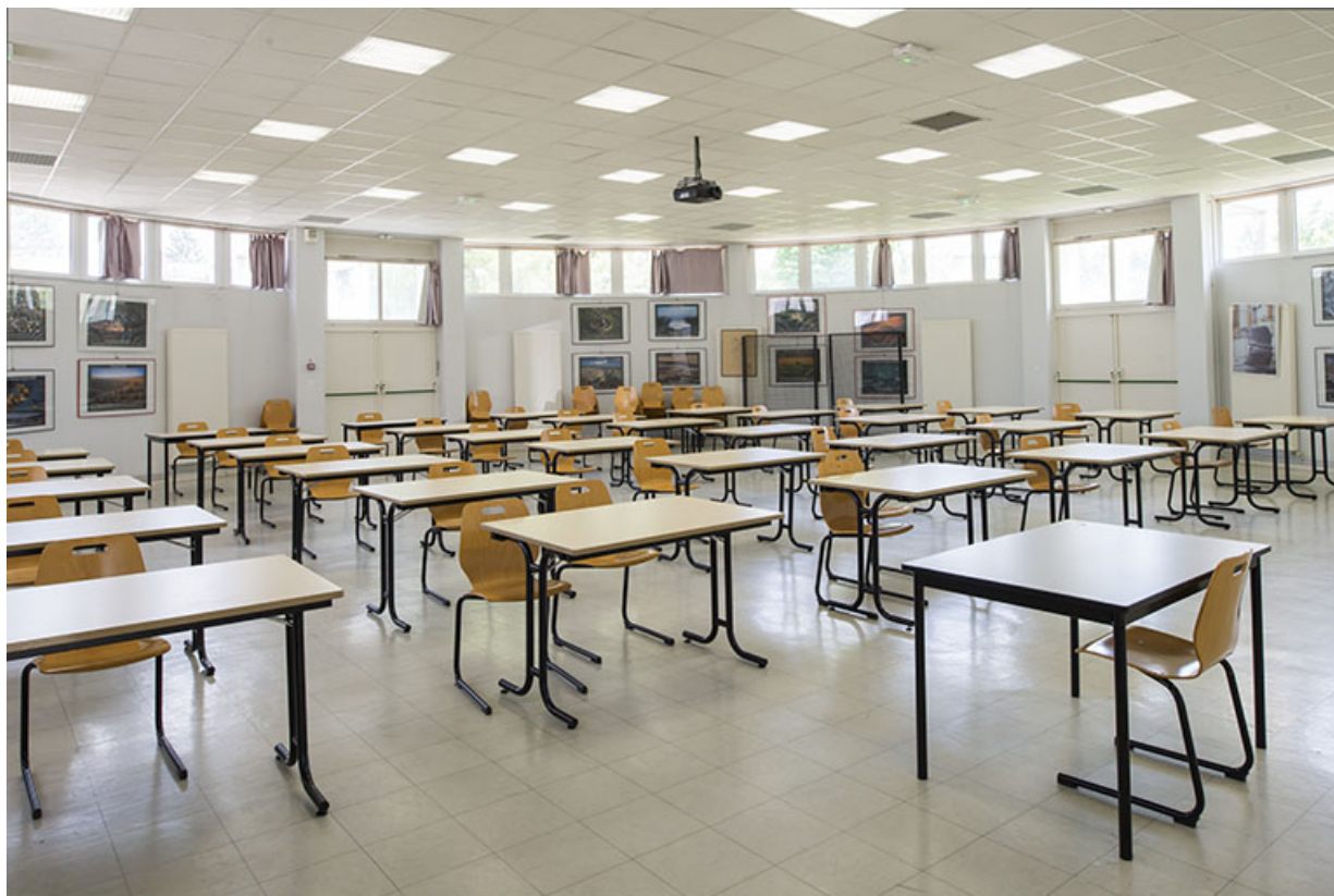
Dans la salle polyvalente.