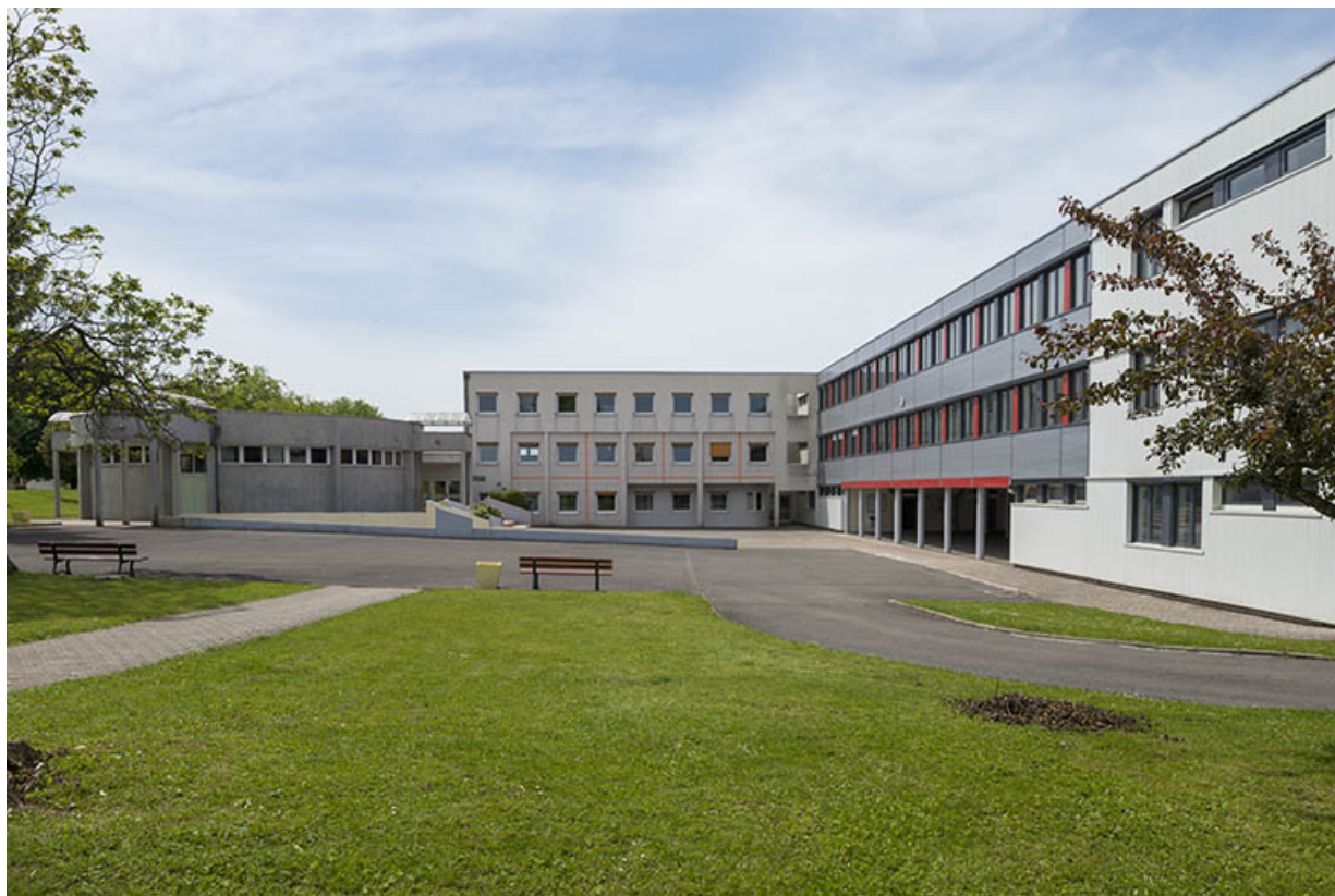
Vue d'ensemble des externats depuis l'est.