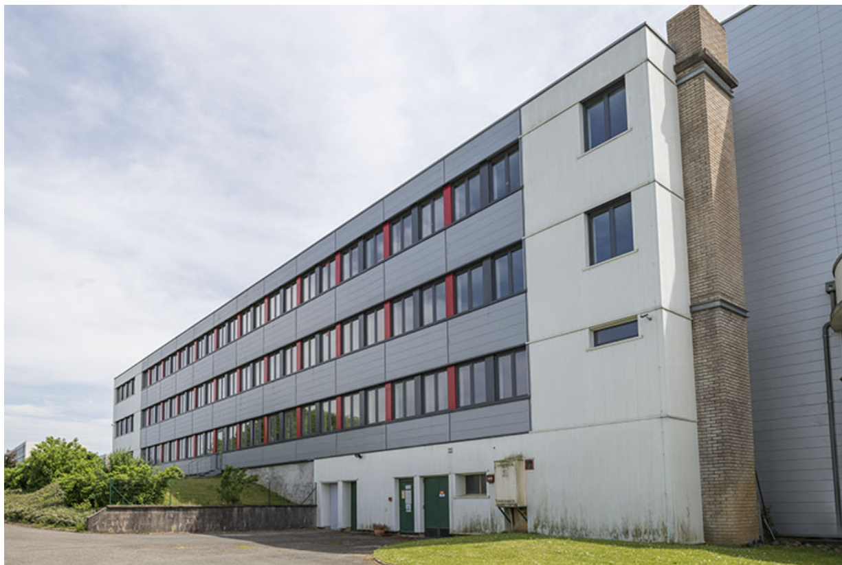
Façade postérieure nord de l'externat nord. 25, Bethoncourt impasse Camus