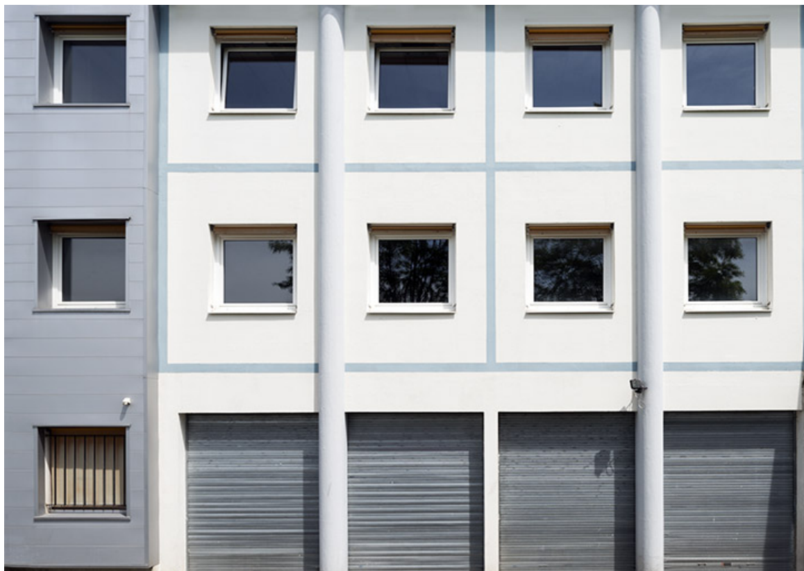
Détail de façade postérieure ouest de l'externat ouest.