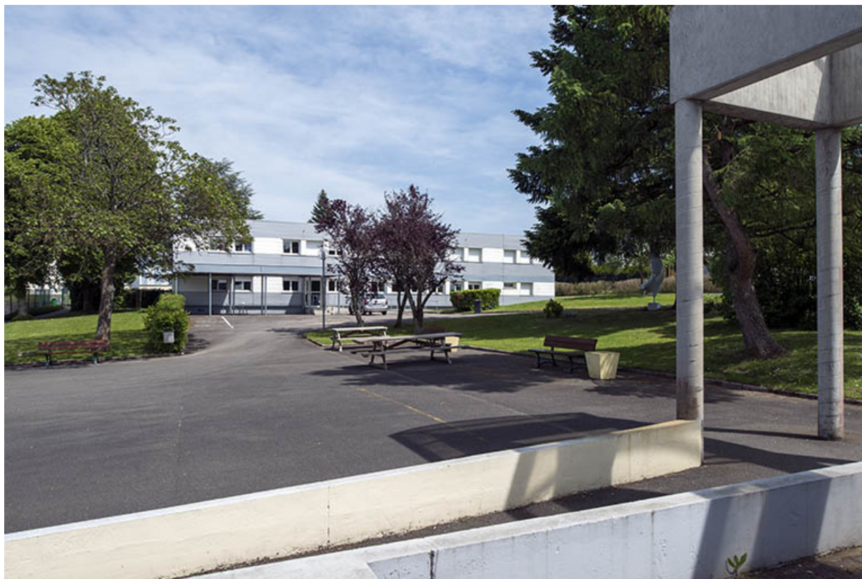
Face à l'administration, depuis l'ouest. 25, Bethoncourt impasse Camus