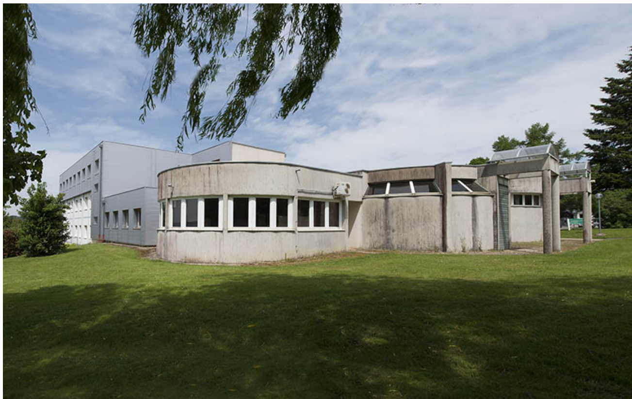
Extrémité sud-ouest des bâtiments d'externat et façade ouest.