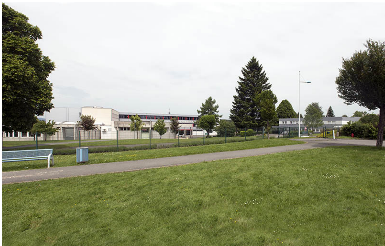
Vue d'ensemble depuis la placette au sud. 25, Bethoncourt impasse Camus