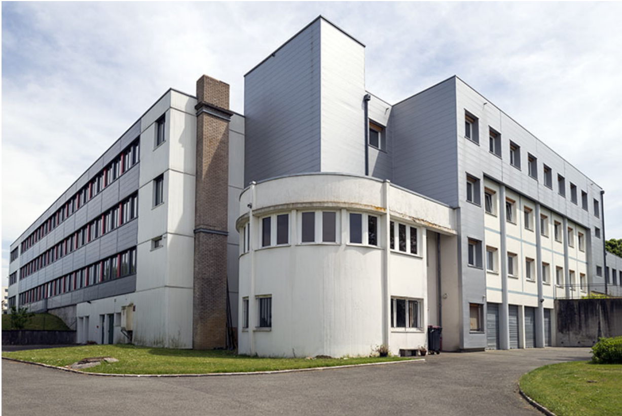
Bethoncourt, site Camus du lycée des Huisselets : externat et cafétéria.