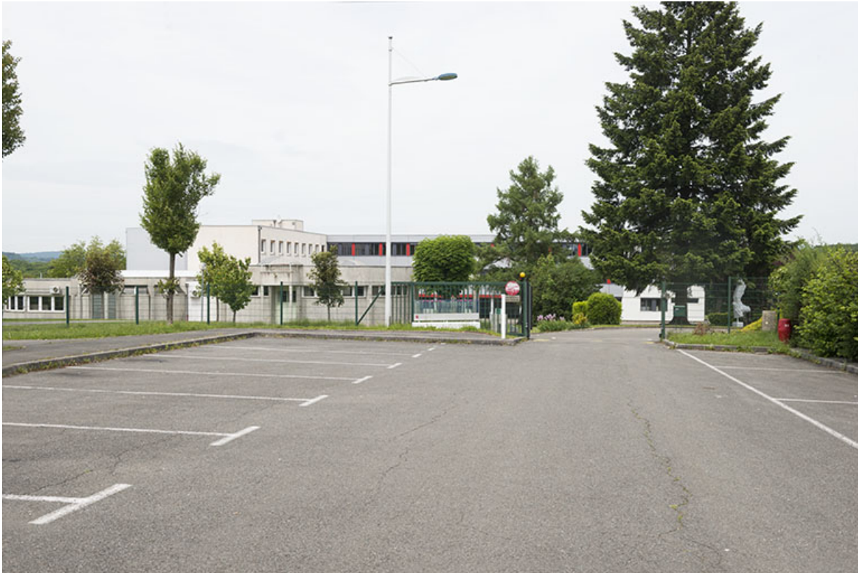
Entrée des véhicules, façades sud donnant sur la placette.