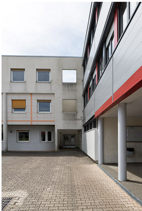
Angle intérieur nord-ouest de la cour. 25, Bethoncourt impasse Camus