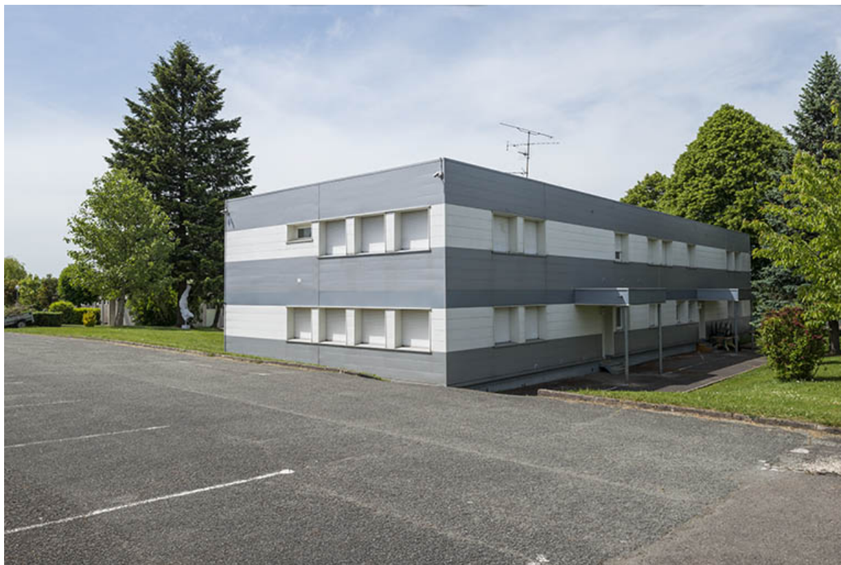
Angle sud-est, façade postérieure est, pignon sud de l'administration. 25, Bethoncourt impasse Camus