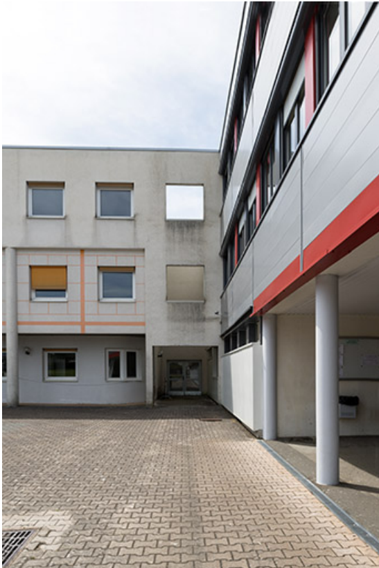
Angle intérieur nord-ouest de la cour.