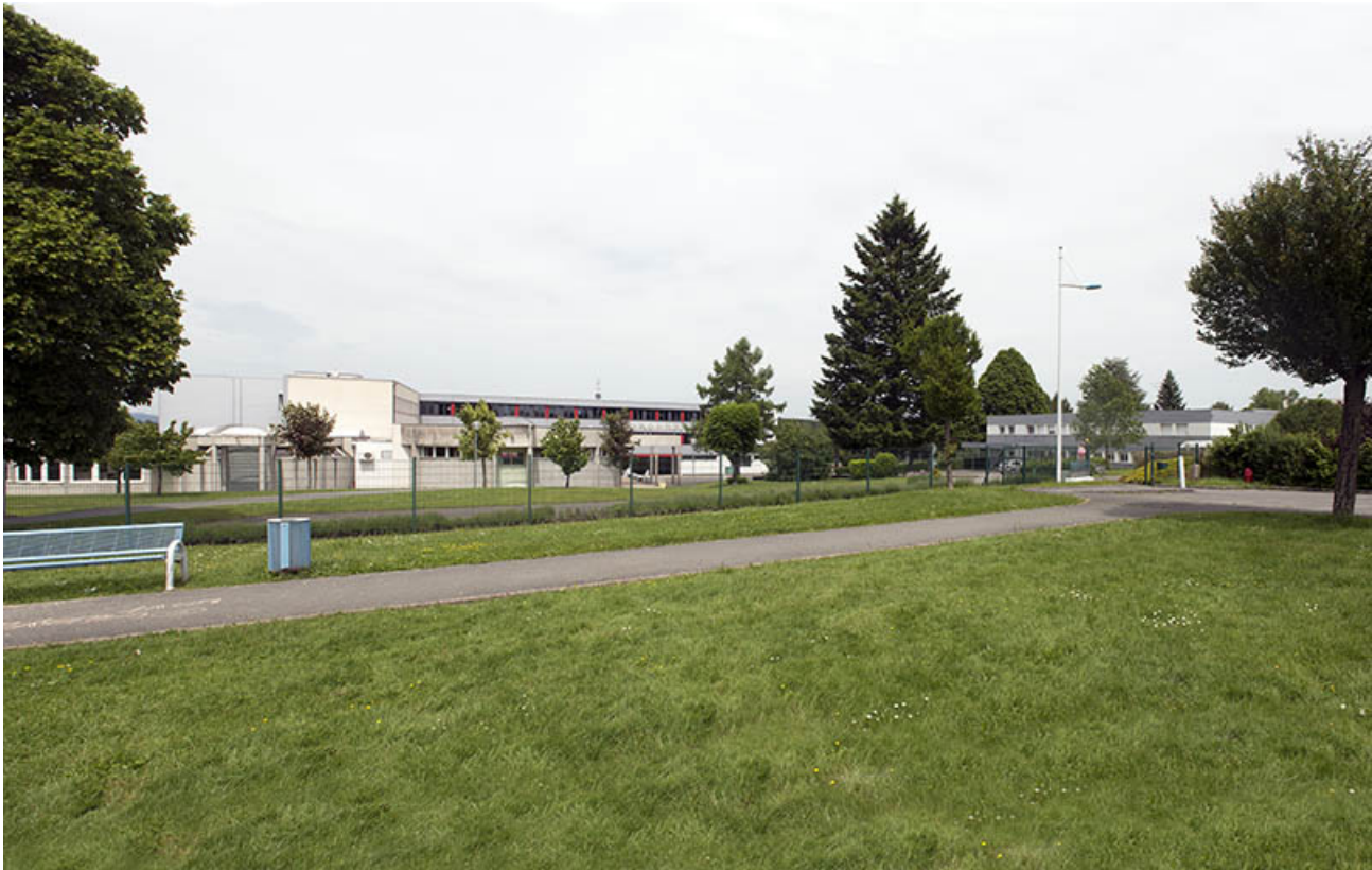
Vue d'ensemble depuis la placette au sud.