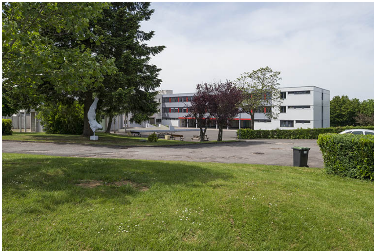
Vue d'ensemble depuis le sud : la cour et la sculpture d'Oudot. 25, Bethoncourt impasse Camus