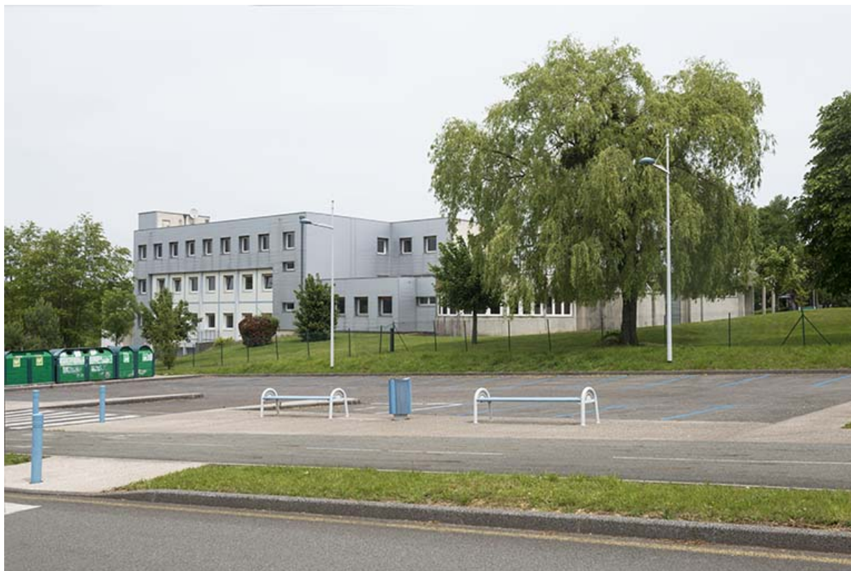
Vues depuis la placette, les façades ouest de l'externat.