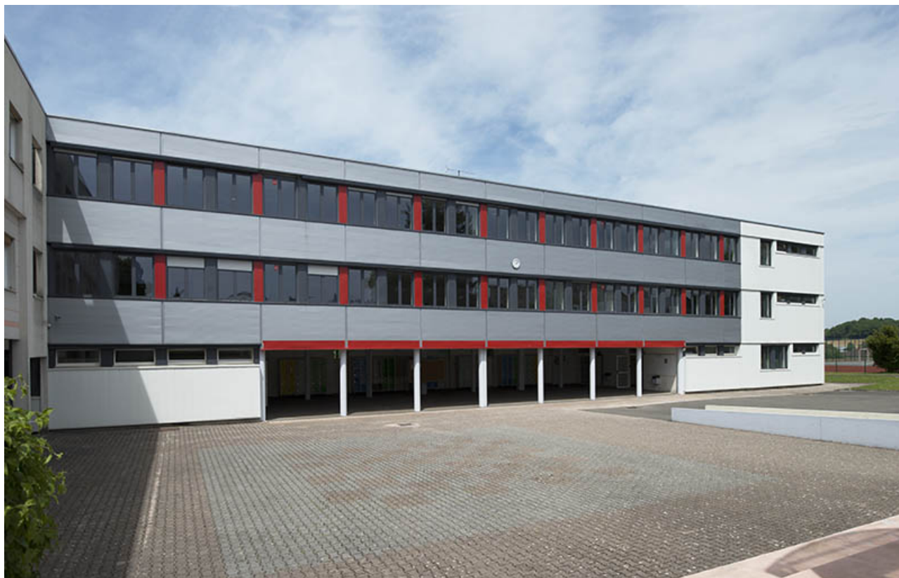
La cour, l'externat nord et le préau.