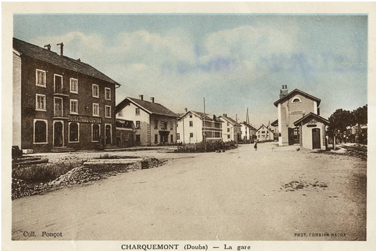
Charquemont (Doubs) - La Gare [vue d'ensemble de la rue de la Gare], 2e quart 20e siècle 25, Charquemont, 11 rue de la Gare