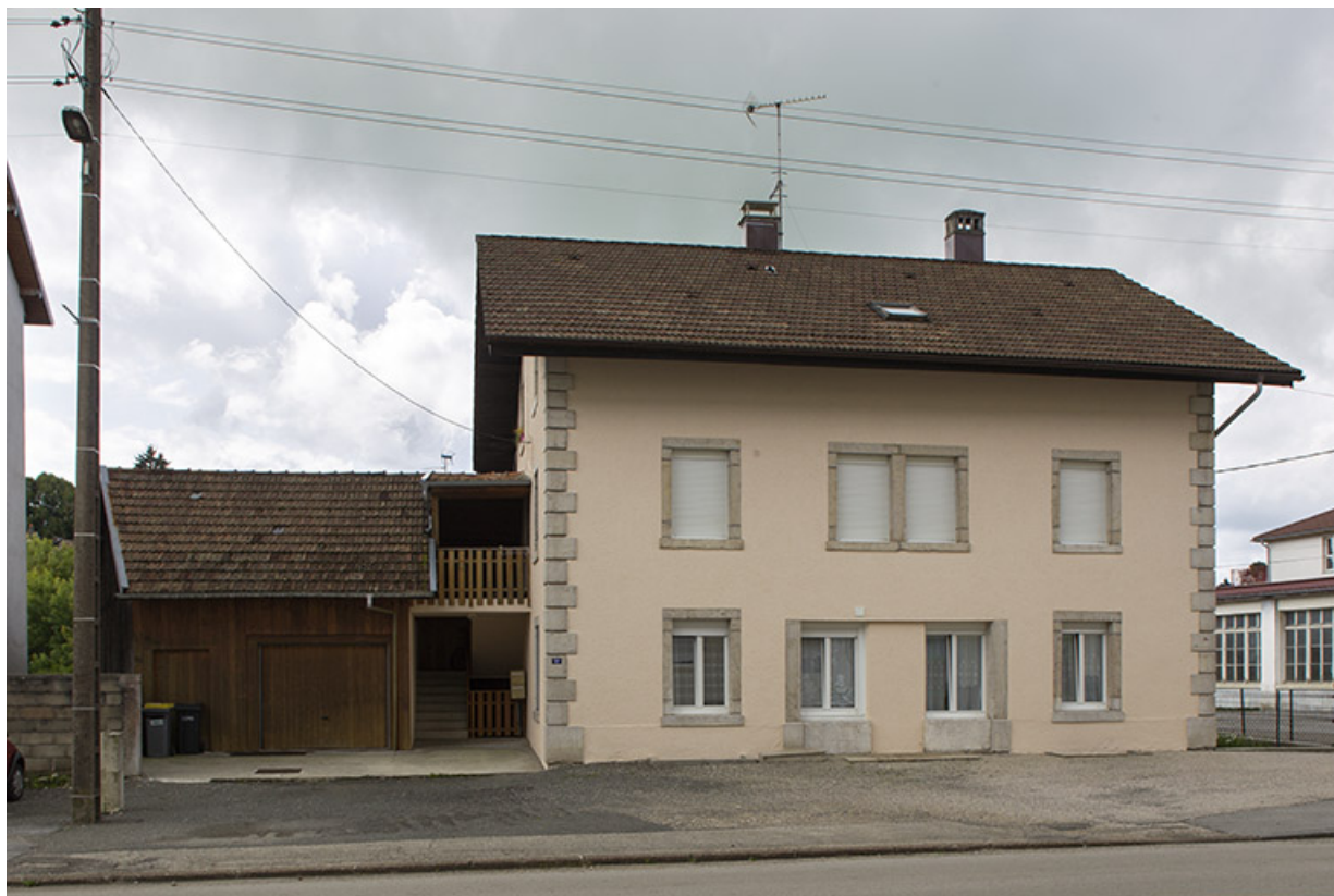
Une maison du quartier de la gare du début du 20e siècle (vers 1907) : Café Parisien et comptoir d'horlogerie Demangelle (11 rue de la Gare).