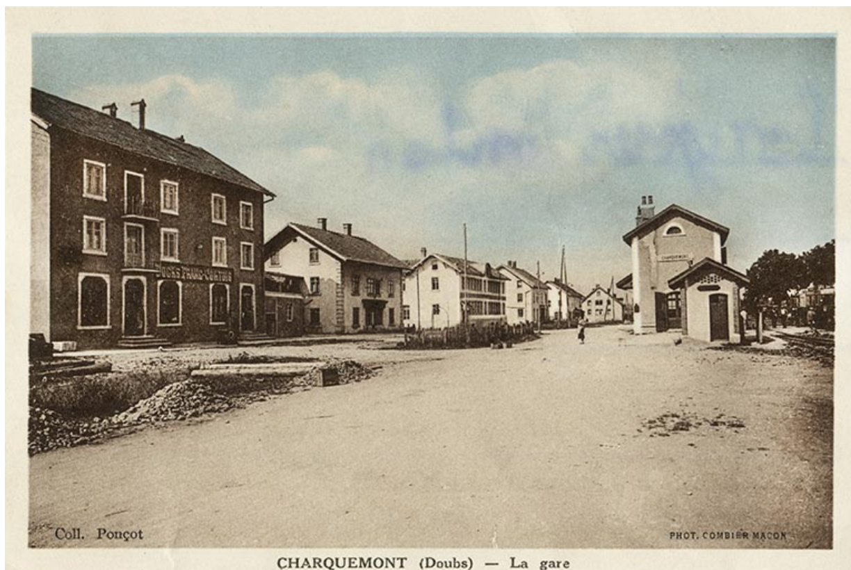
Charquemont (Doubs) - La Gare [vue d'ensemble de la rue de la Gare], 2e quart 20e siècle 25, Charquemont, 13 rue de la Gare