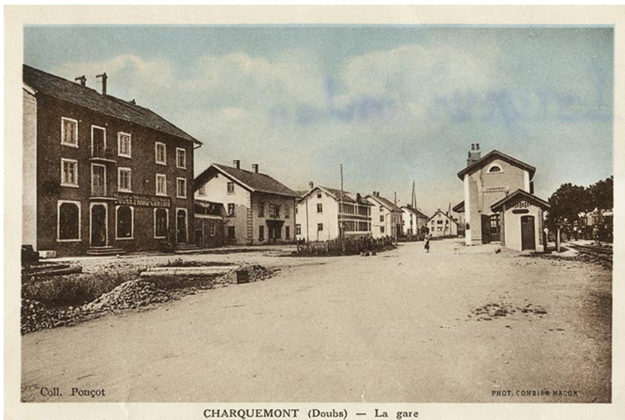
Charquemont (Doubs) - La Gare [vue d'ensemble de la rue de la Gare], 2e quart 20e siècle 25, Charquemont, 13 rue de la Gare