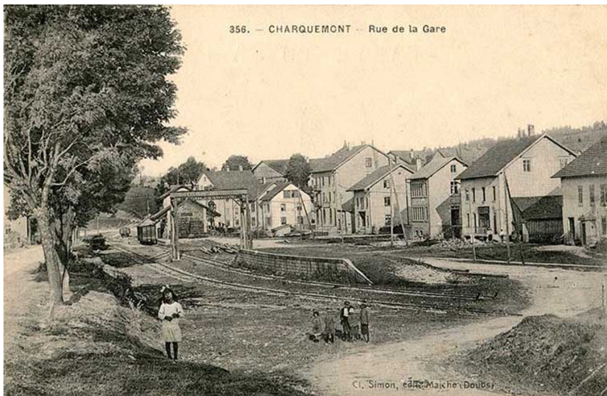
356. - Charquemont - Rue de la Gare, entre 1910 et 1922. Le Café Parisien se trouve entre le grand bâtiment et l'usine Pagès. 25, Charquemont, 13 rue de la Gare