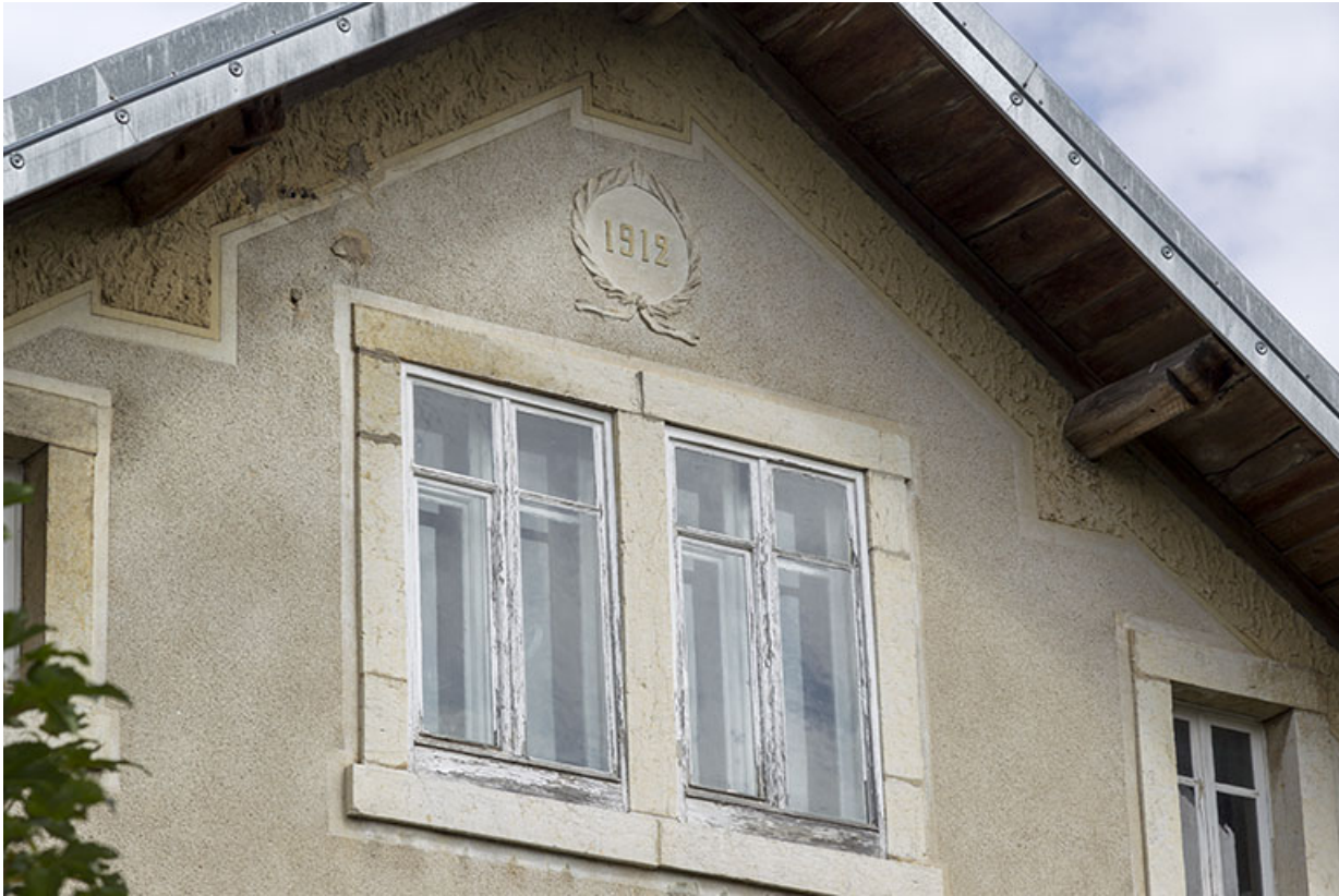
Façade latérale droite : date et fenêtre horlogère sur le pignon.