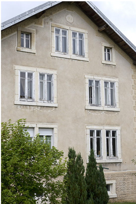
Façade latérale droite, de trois quarts gauche.