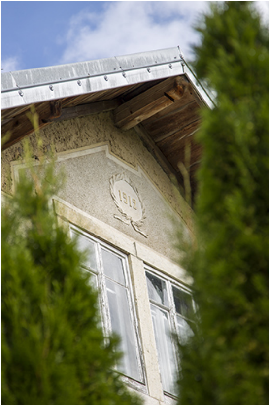
Façade latérale droite : date et fenêtre horlogère sur le pignon, vues en contre-plongée. 25, Charquemont, 2 rue Pasteur