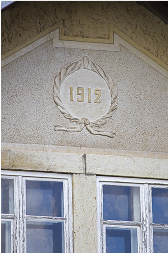
Façade latérale droite : date sur le pignon.