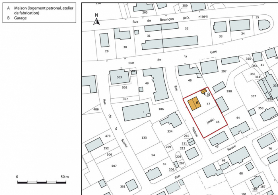
Plan-masse et de situation. Extrait du plan cadastral, 2015, section AI.