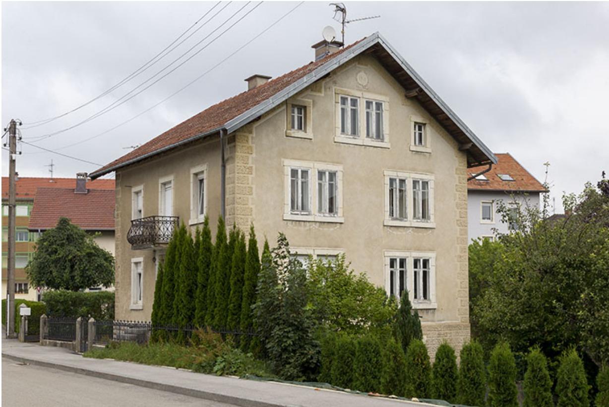
Vue d'ensemble, depuis le sud (façades antérieure et latérale droite). 25, Charquemont, 2 rue Pasteur