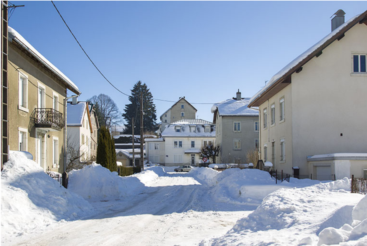
Vue d'ensemble en hiver, depuis la rue Pasteur.