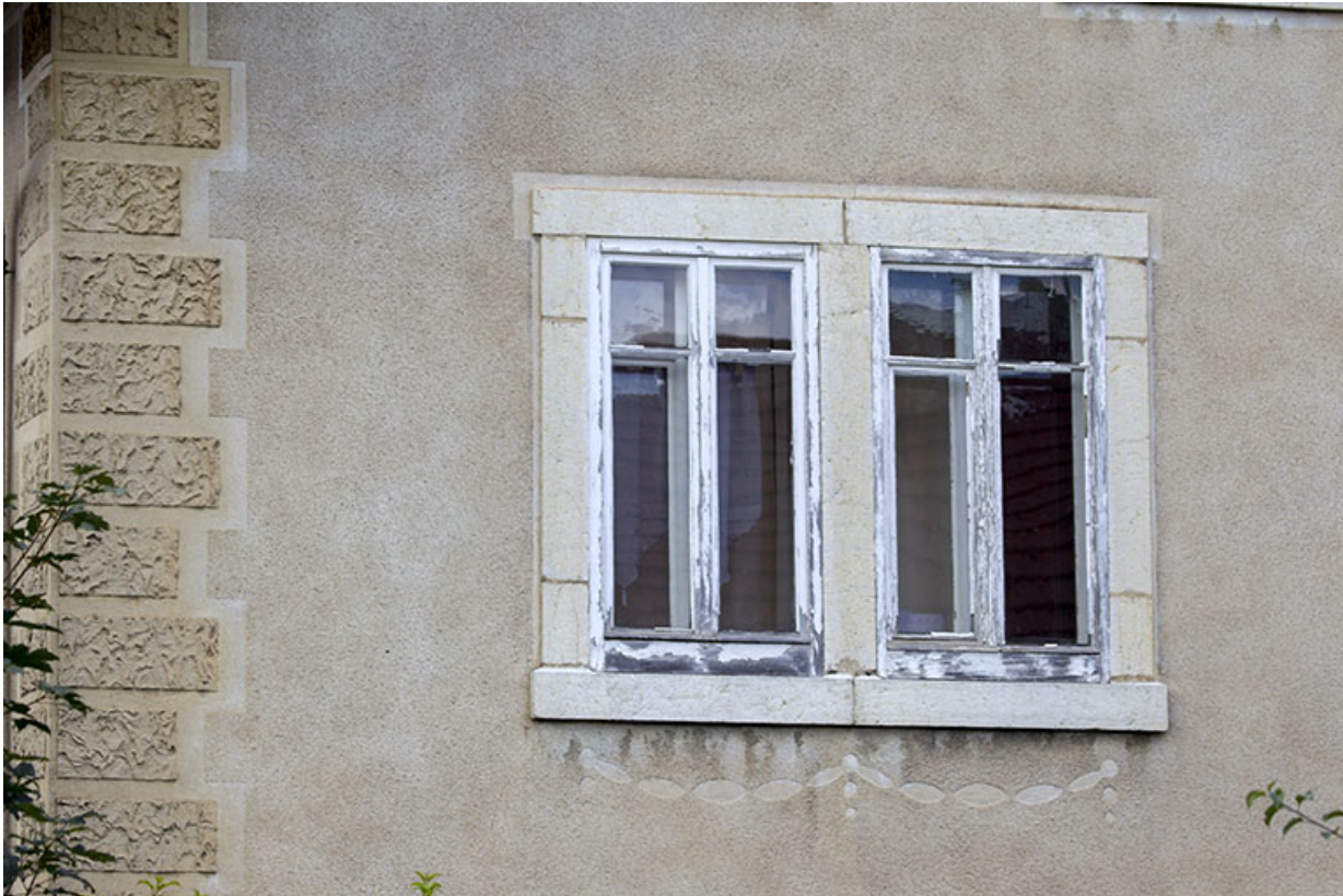
Façade latérale droite : fenêtre horlogère et décor.