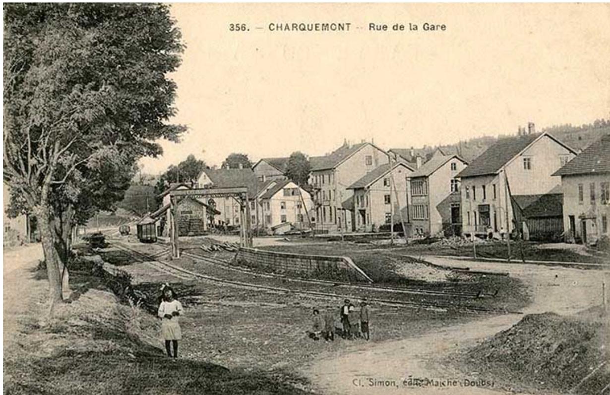
356. - Charquemont - Rue de la Gare, entre 1910 et 1922. Le Café Parisien se trouve entre le grand bâtiment et l'usine Pagès. 25, Charquemont, 13 rue de la Gare