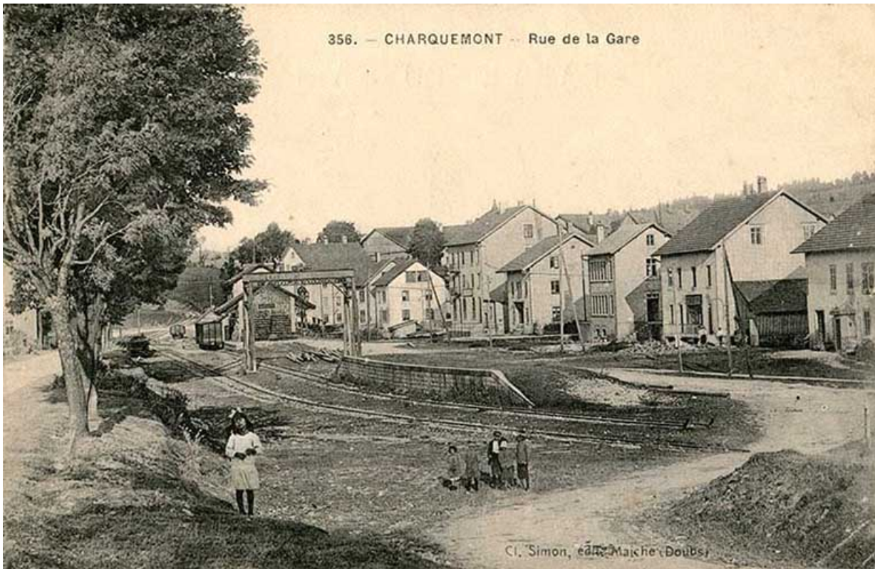
356. - Charquemont - Rue de la Gare, entre 1910 et 1922. Le Café Parisien se trouve entre le grand bâtiment et l'usine Pagès. 25, Charquemont, 13 rue de la Gare