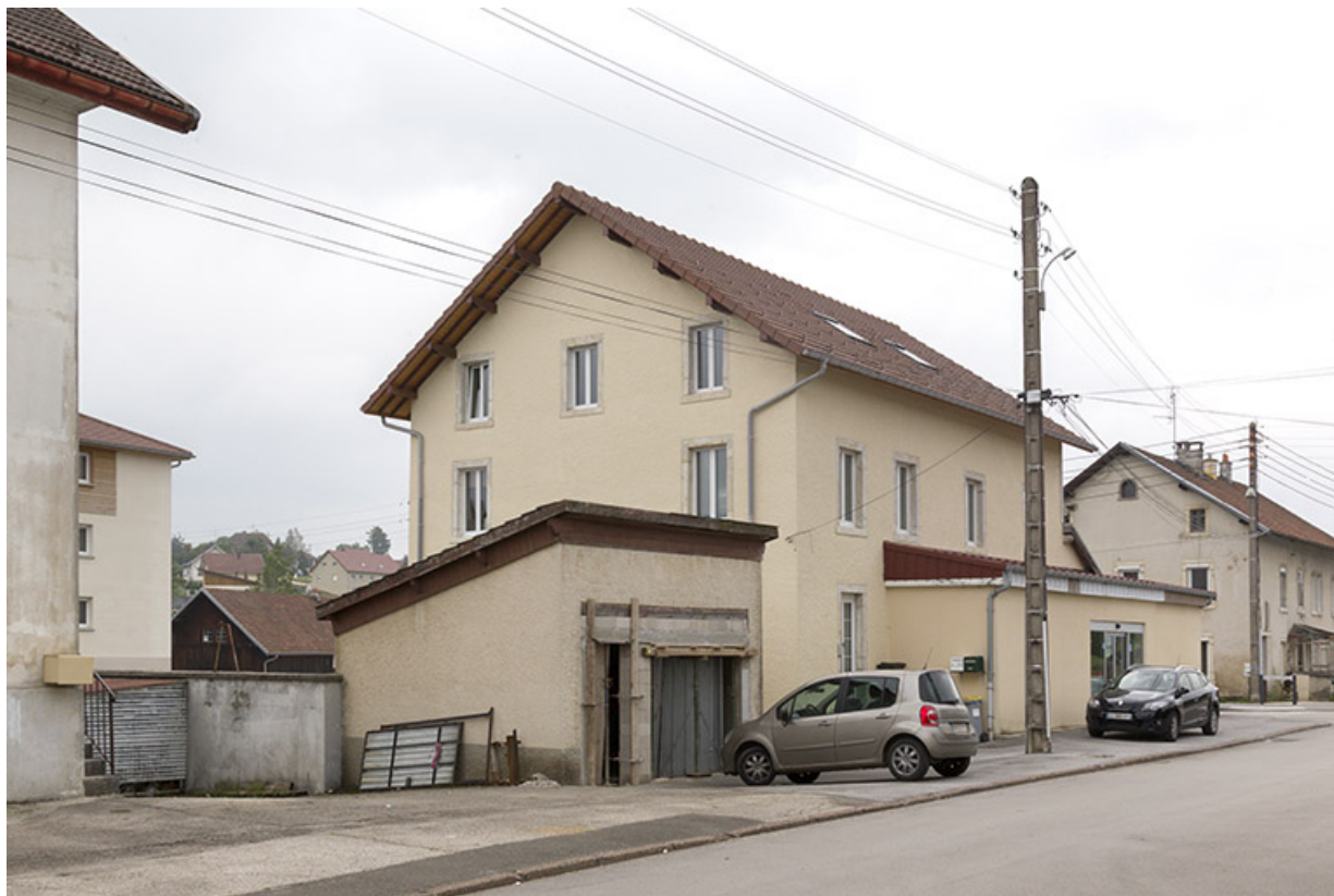
Vue d'ensemble, depuis le nord-est (façades antérieure et latérale droite). 25, Charquemont, 15 rue de la Gare