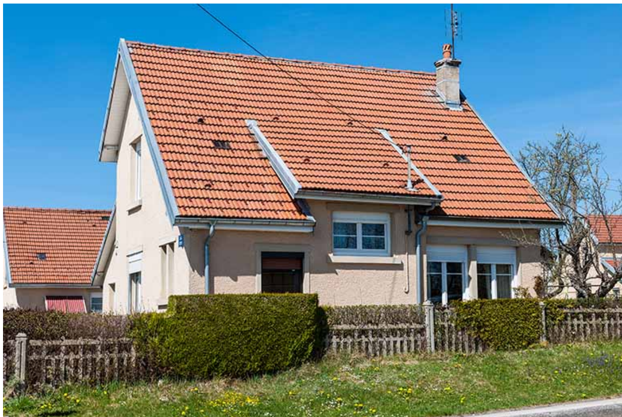
Une maison HBM de 1929 : atelier d'horlogerie Courtet Frères et Cie (2 rue des Cités). 25, Charquemont, 2 rue des Cités