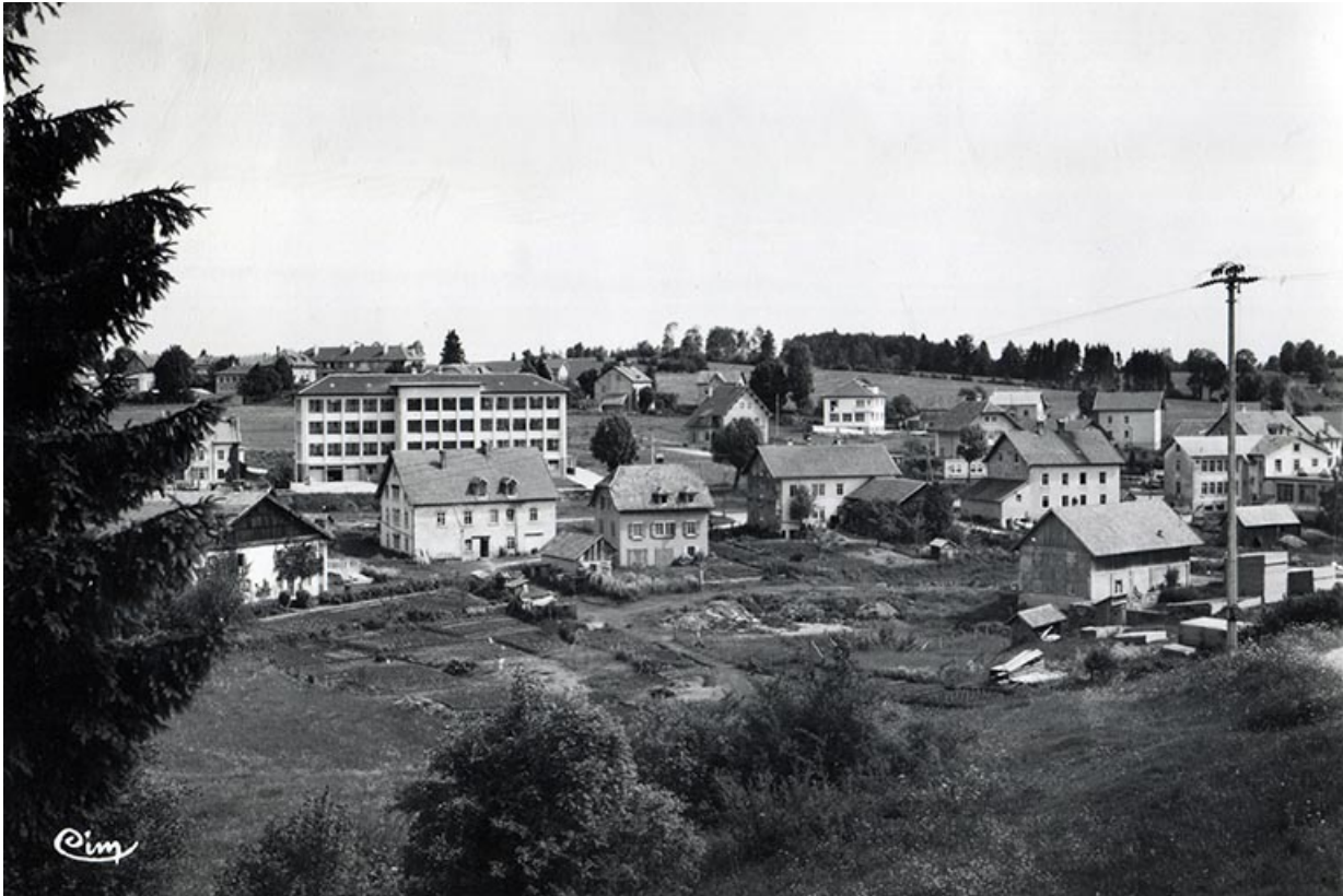
Charquemont (Doubs). Quartier de la Gare et les Cités, entre 1951 et 1958 25, Charquemont, 18 rue de Besançon