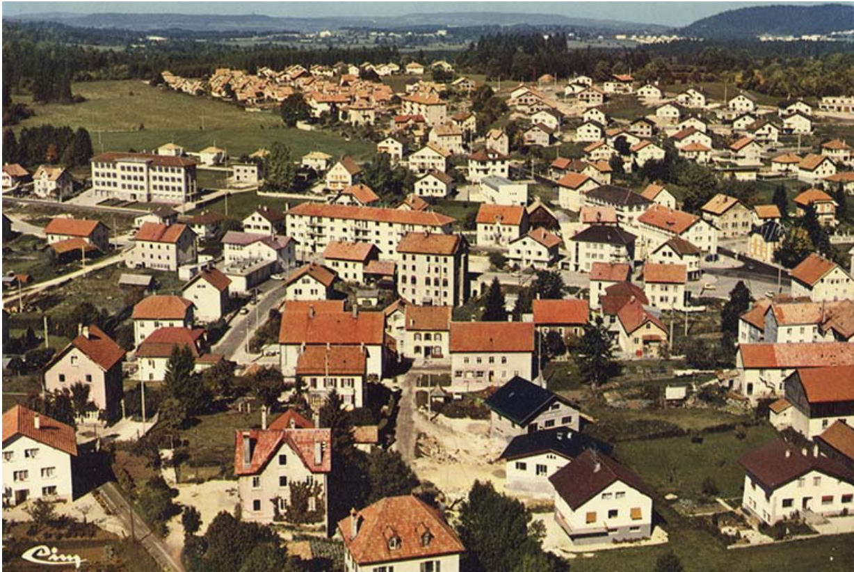
Vue aérienne du quartier de la gare, de la Rue Neuve et des Cités, depuis le sud : Charquemont (Doubs). Vue aérienne, entre 1968 et 1975.