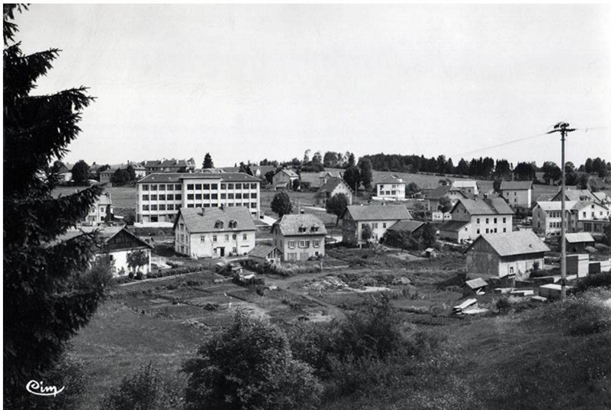
Charquemont (Doubs). Quartier de la Gare et les Cités, entre 1951 et 1958 25, Charquemont, 18 rue de Besançon