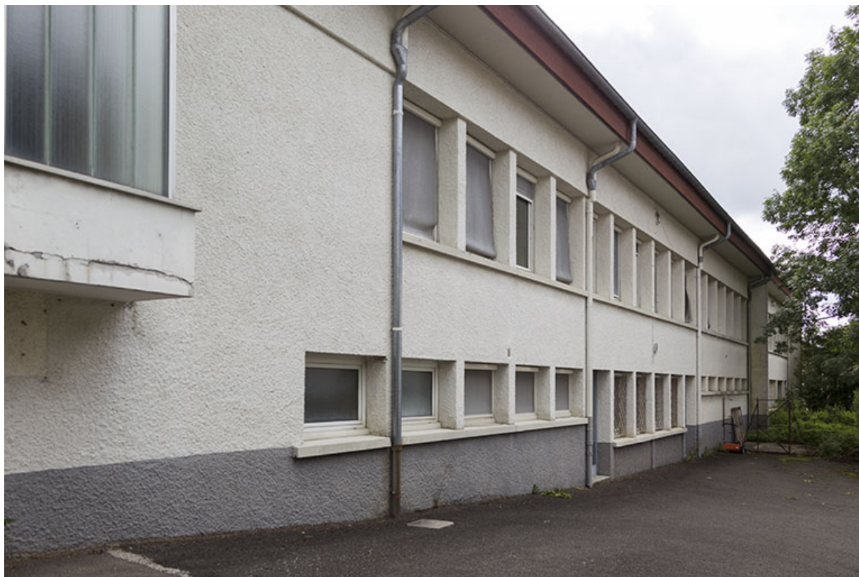
Usine, corps de bâtiment ancien : façade latérale droite.