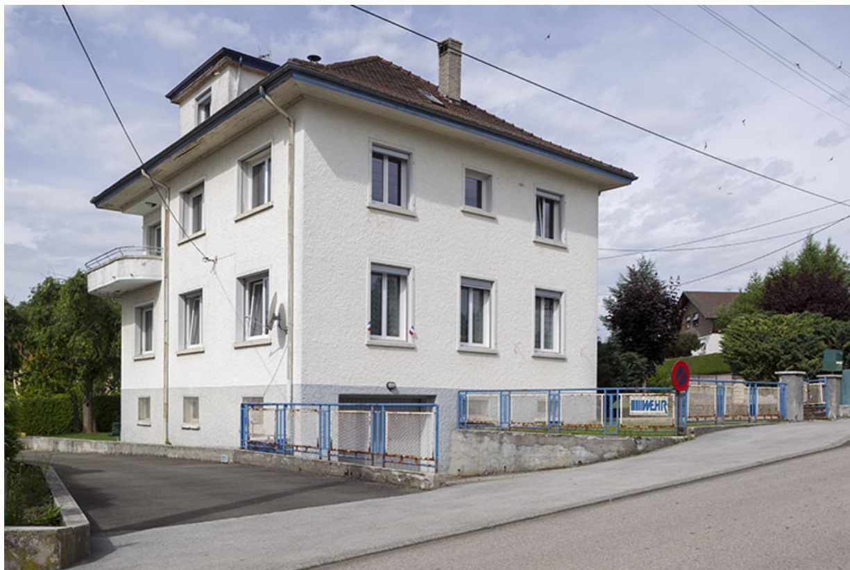
Logement patronal, vu de l'est (façades antérieure et latérale gauche).