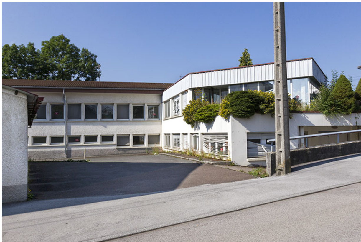
Usine, vue de l'est : corps de bâtiment ancien à gauche, récent à droite.