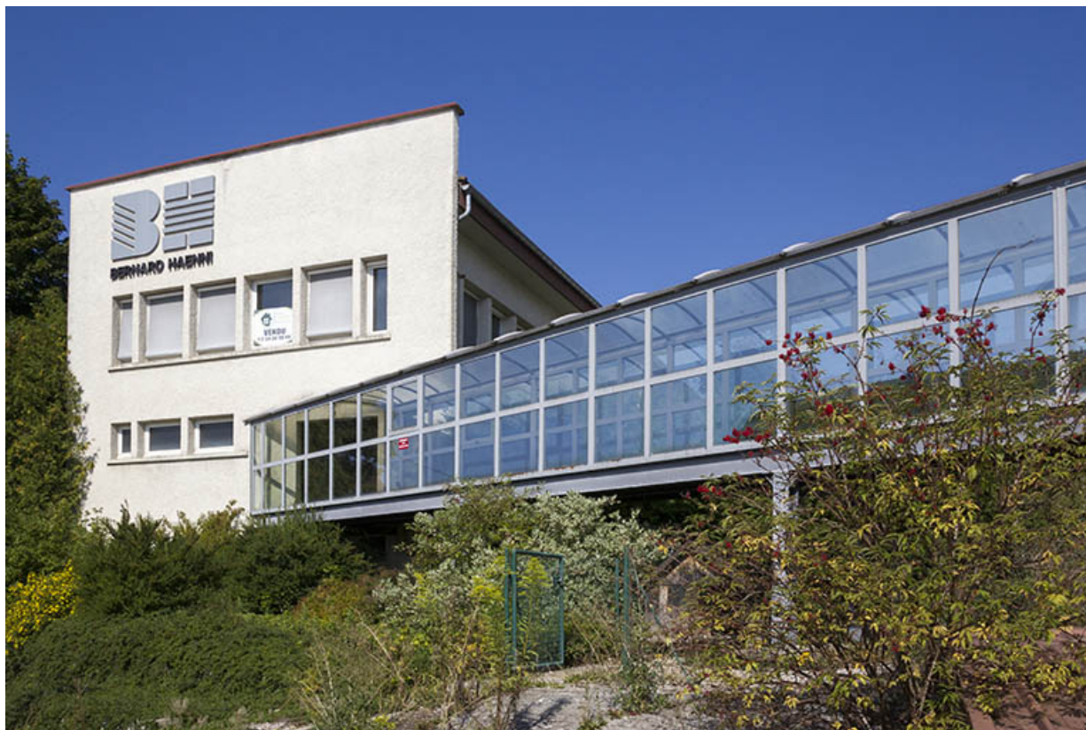
Usine, corps de bâtiment ancien : extrémité sud et passerelle de liaison avec le site Bernard Haenni. 25, Charquemont, 7 et 9 rue Victor Hugo