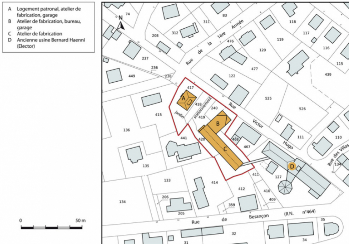
Plan-masse et de situation. Extrait du plan cadastral, 2015, section AB. 25, Charquemont, 7 et 9 rue Victor Hugo