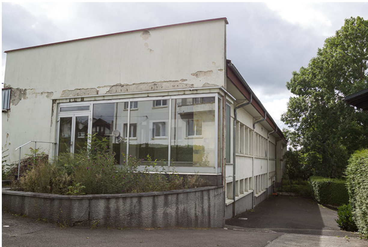
Usine, corps de bâtiment ancien : façades antérieure et latérale droite.