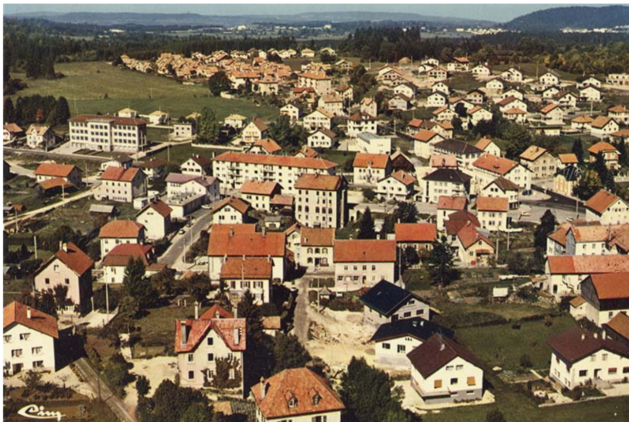
Vue aérienne du quartier de la gare, de la Rue Neuve et des Cités, depuis le sud : Charquemont (Doubs). Vue aérienne, entre 1968 et 1975.