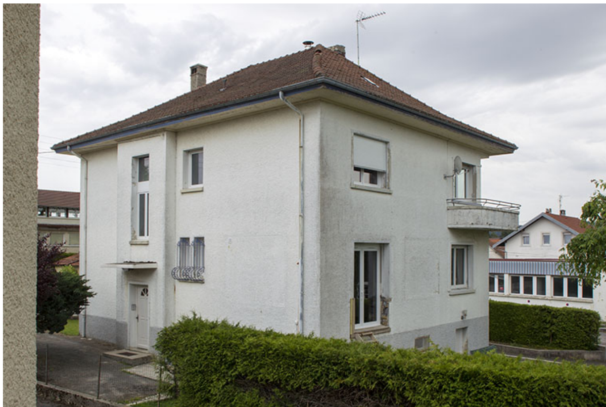
Logement patronal, vu de l'ouest (façades postérieure et latérale droite). 25, Charquemont, 7 et 9 rue Victor Hugo