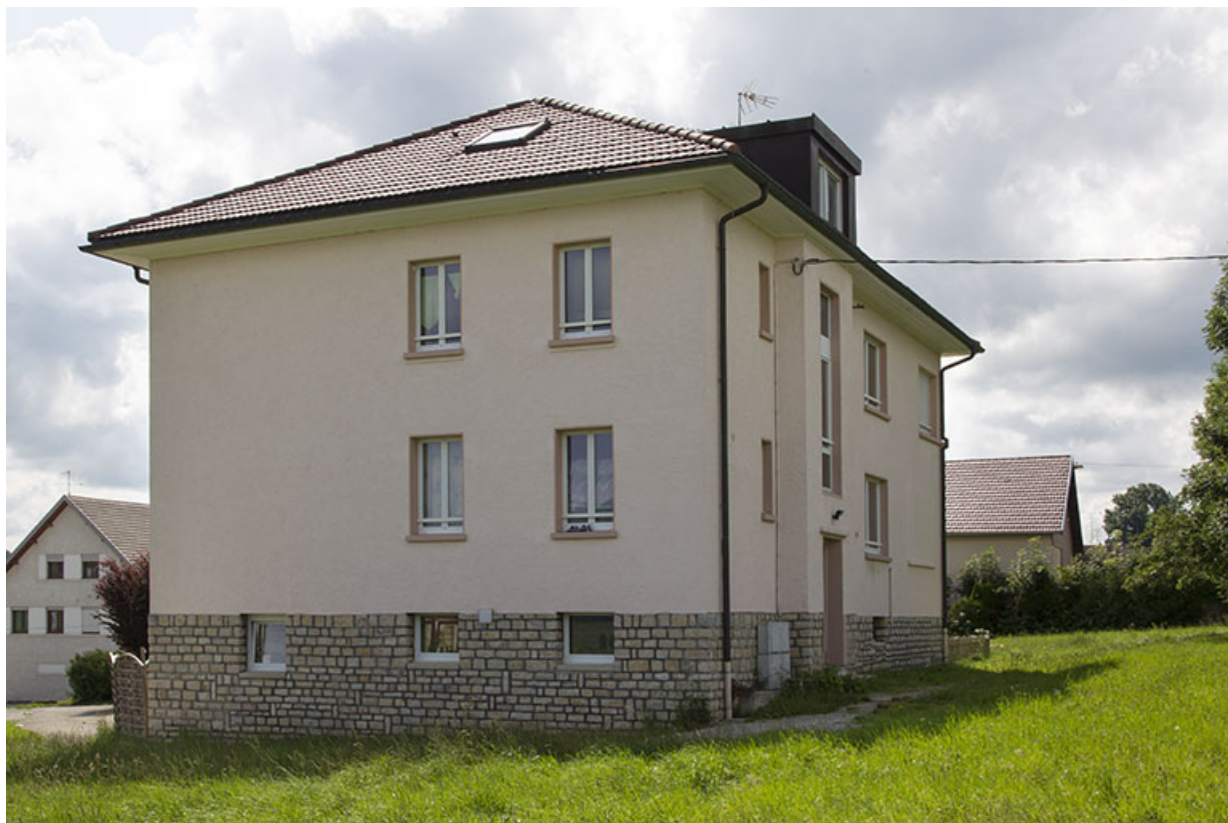
Façades latérale droite et postérieure.