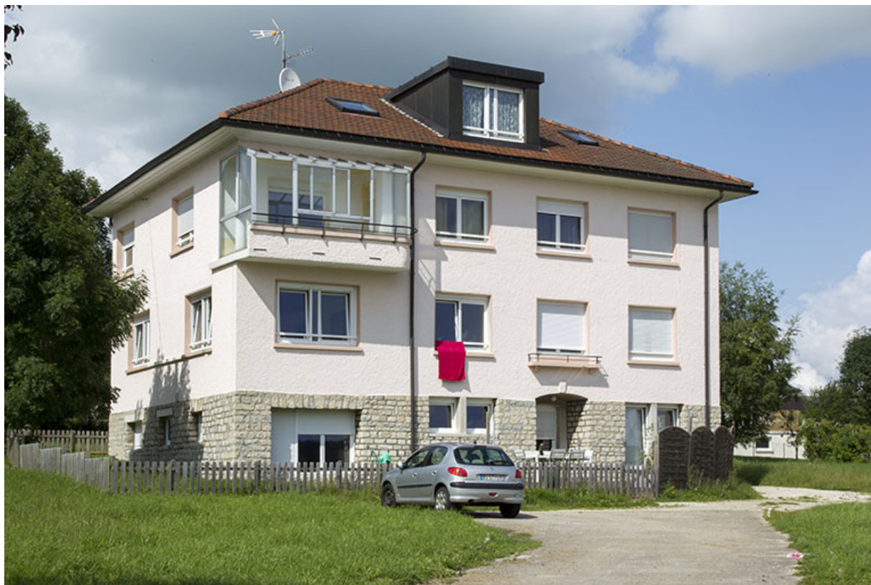
Vue d'ensemble, depuis le sud.