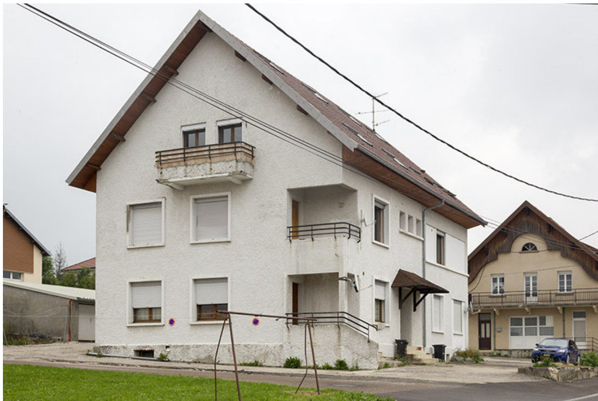
Façades latérale gauche et antérieure.