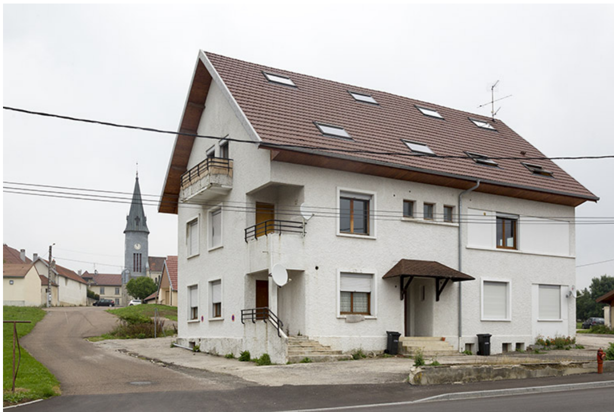
Vue d'ensemble, de trois quarts gauche.