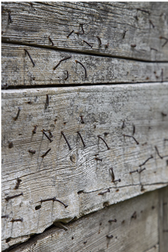
Façade postérieure : support de l'essentage de tavaillons, sans tavaillon. 25, Charquemont, 48 Grande Rue