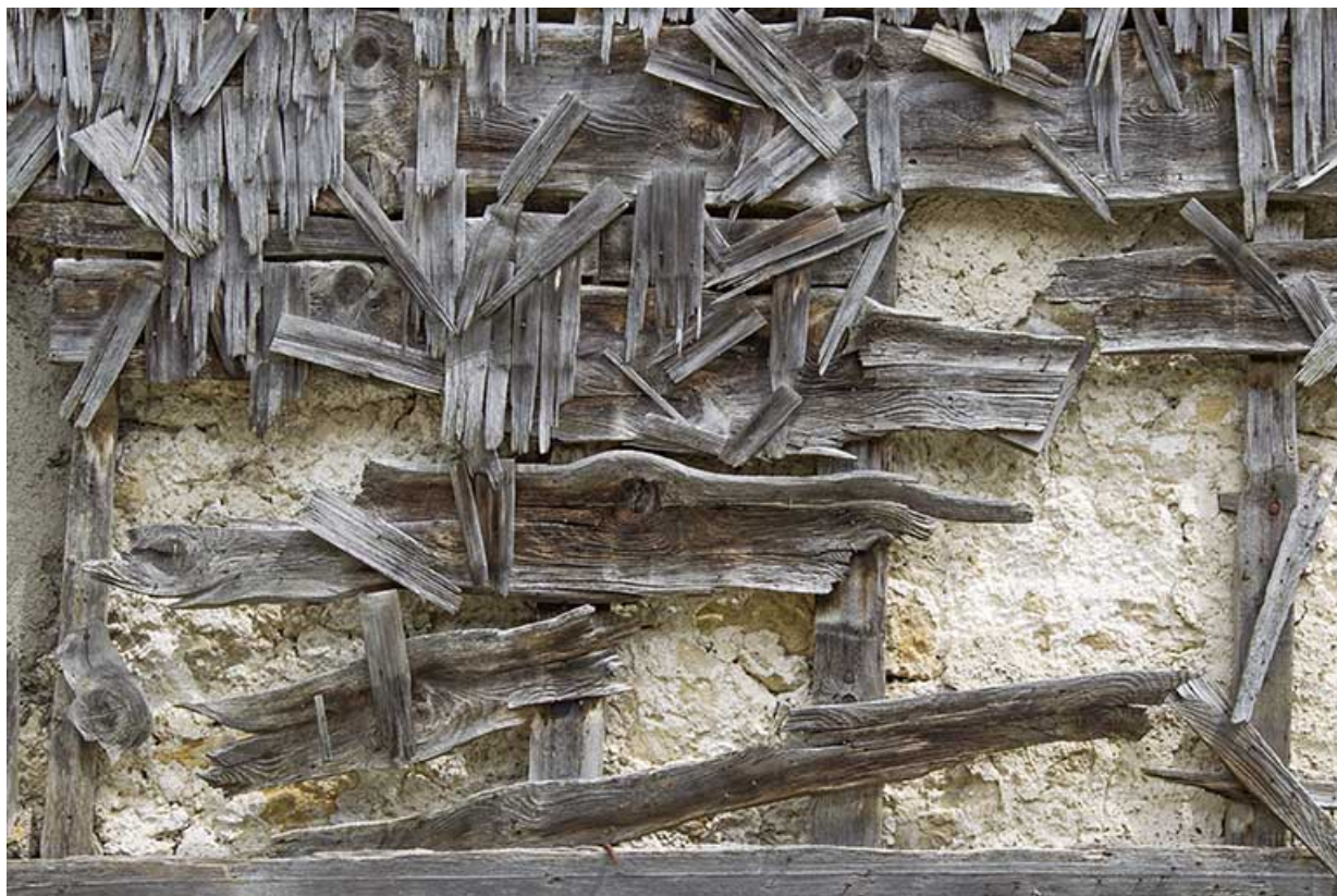
Façade postérieure : vestiges de l'essentage de tavillons.