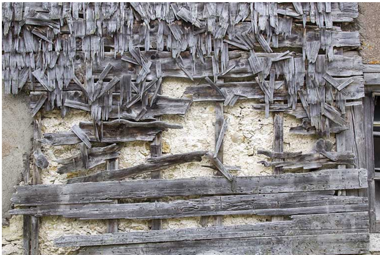
Façade postérieure : vestiges de l'essentage de tavaillons.