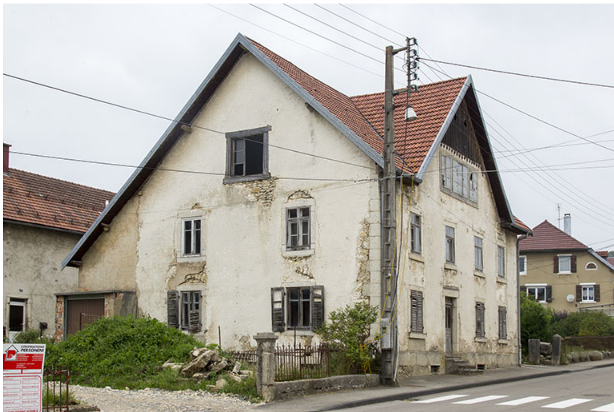
Vue d'ensemble, depuis le sud (façades antérieure et latérale gauche). 25, Charquemont, 48 Grande Rue