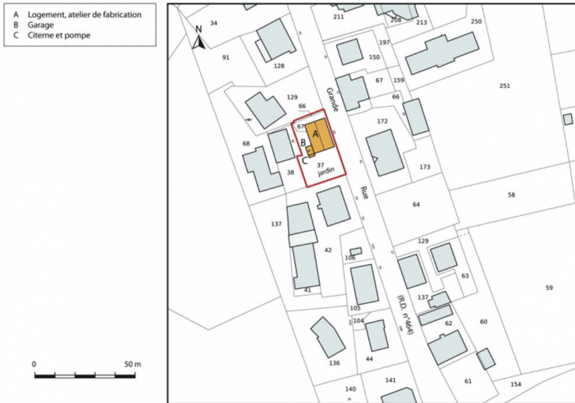
Plan-masse et de situation. Extrait du plan cadastral, 2015, section AH. 25, Charquemont, 48 Grande Rue