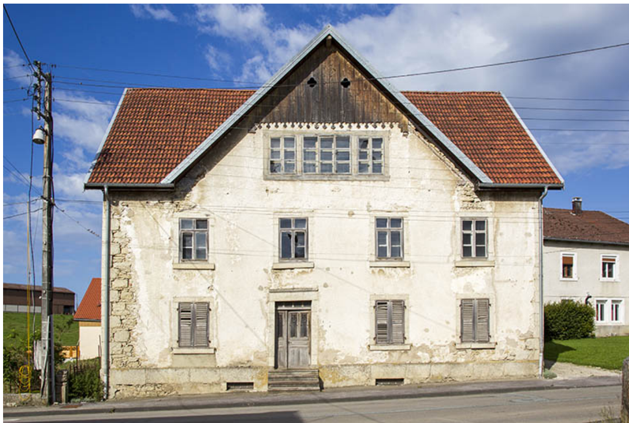
Une maison de la deuxième moitié du 19e siècle (1873) et son atelier d'horlogerie : maison Pillot puis Fierobe (48 Grande Rue).