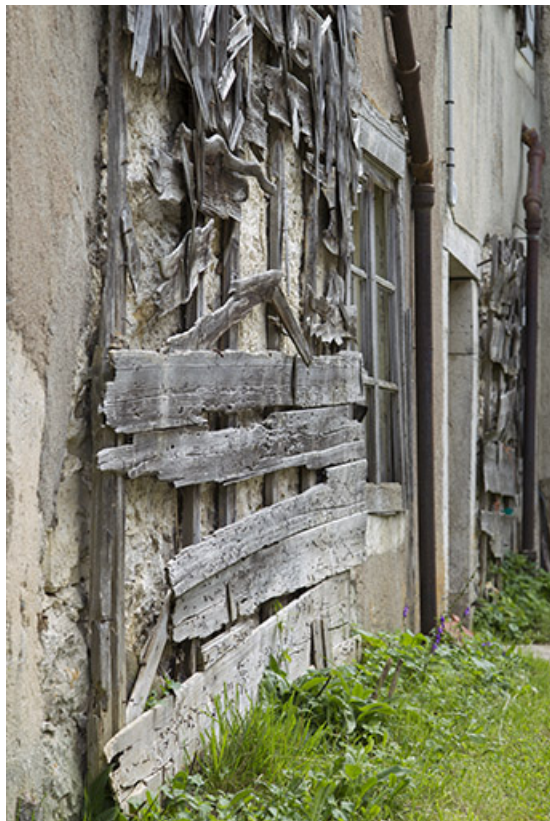
Façade postérieure : support de l'essentage de tavaillons, vu en enfilade. 25, Charquemont, 48 Grande Rue