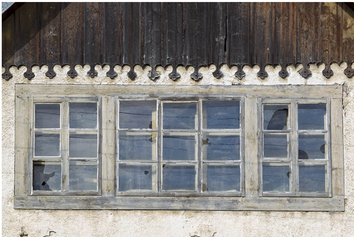
Façade antérieure : fenêtres multiples sur le pignon.