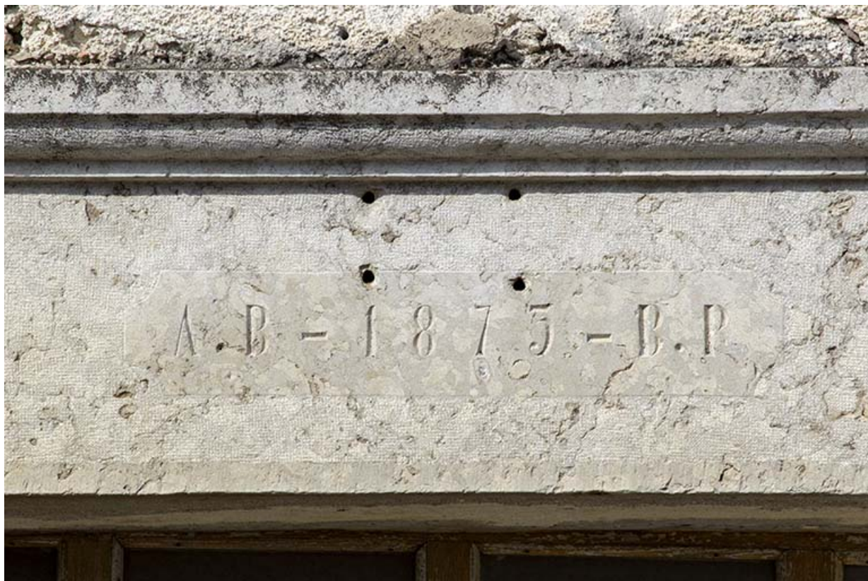
Façade antérieure : date et initiales sur le linteau de la porte.