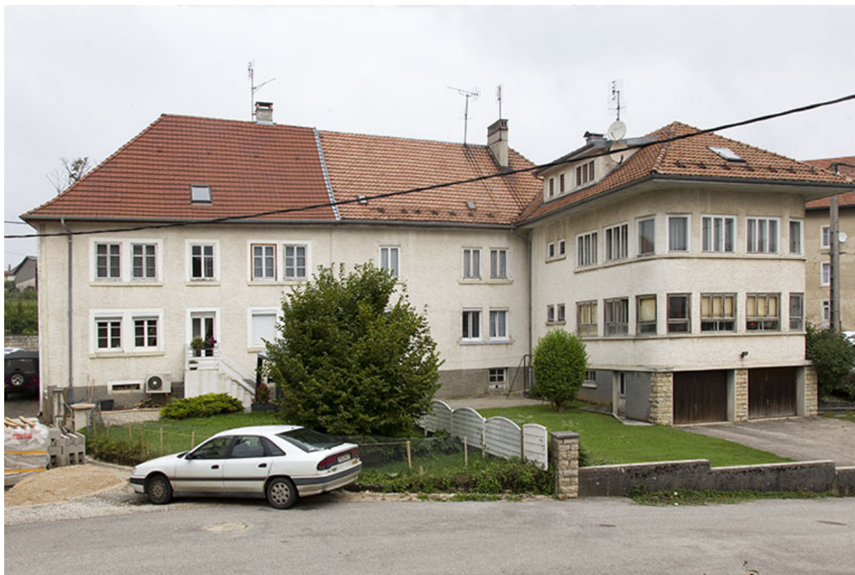
Façade postérieure. A droite le corps de bâtiment de 1965.