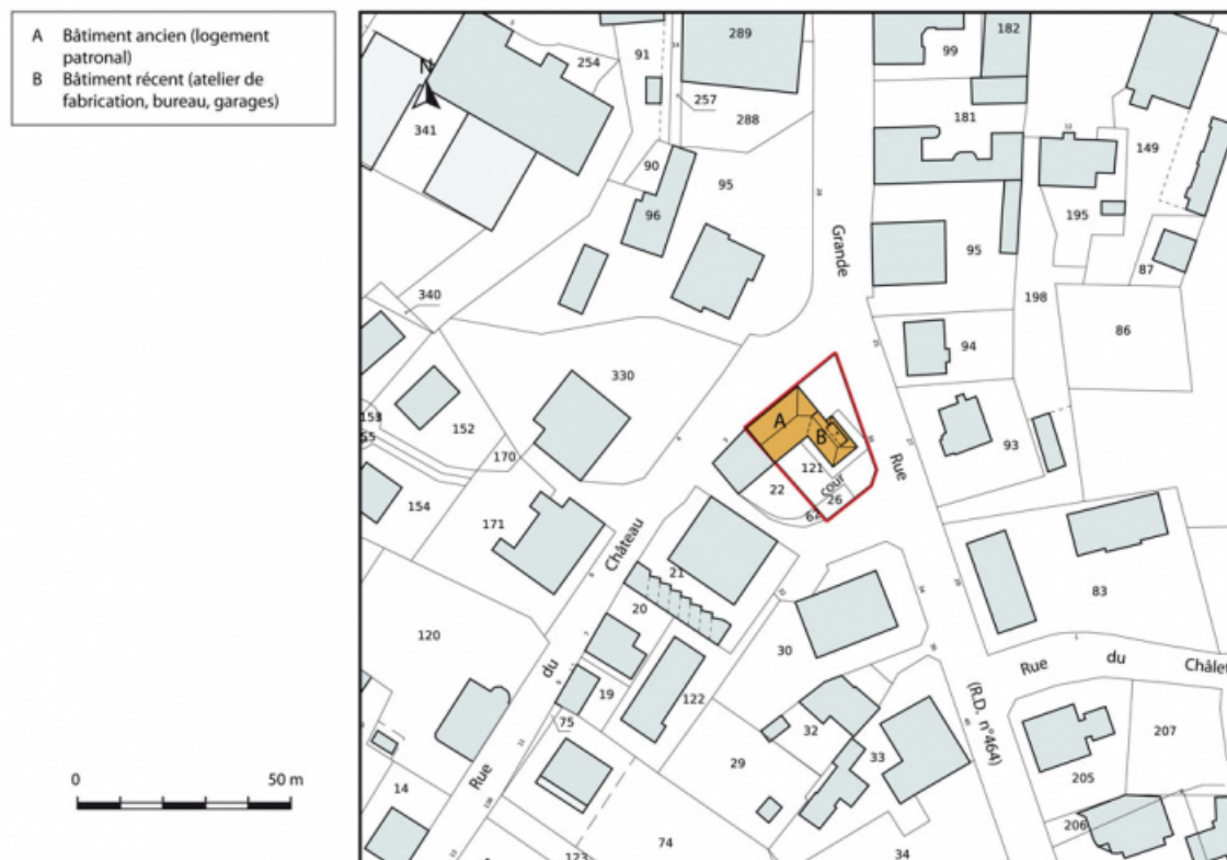
Plan-masse et de situation. Extrait du plan cadastral, 2015, section AH. 25, Charquemont, 30 Grande Rue