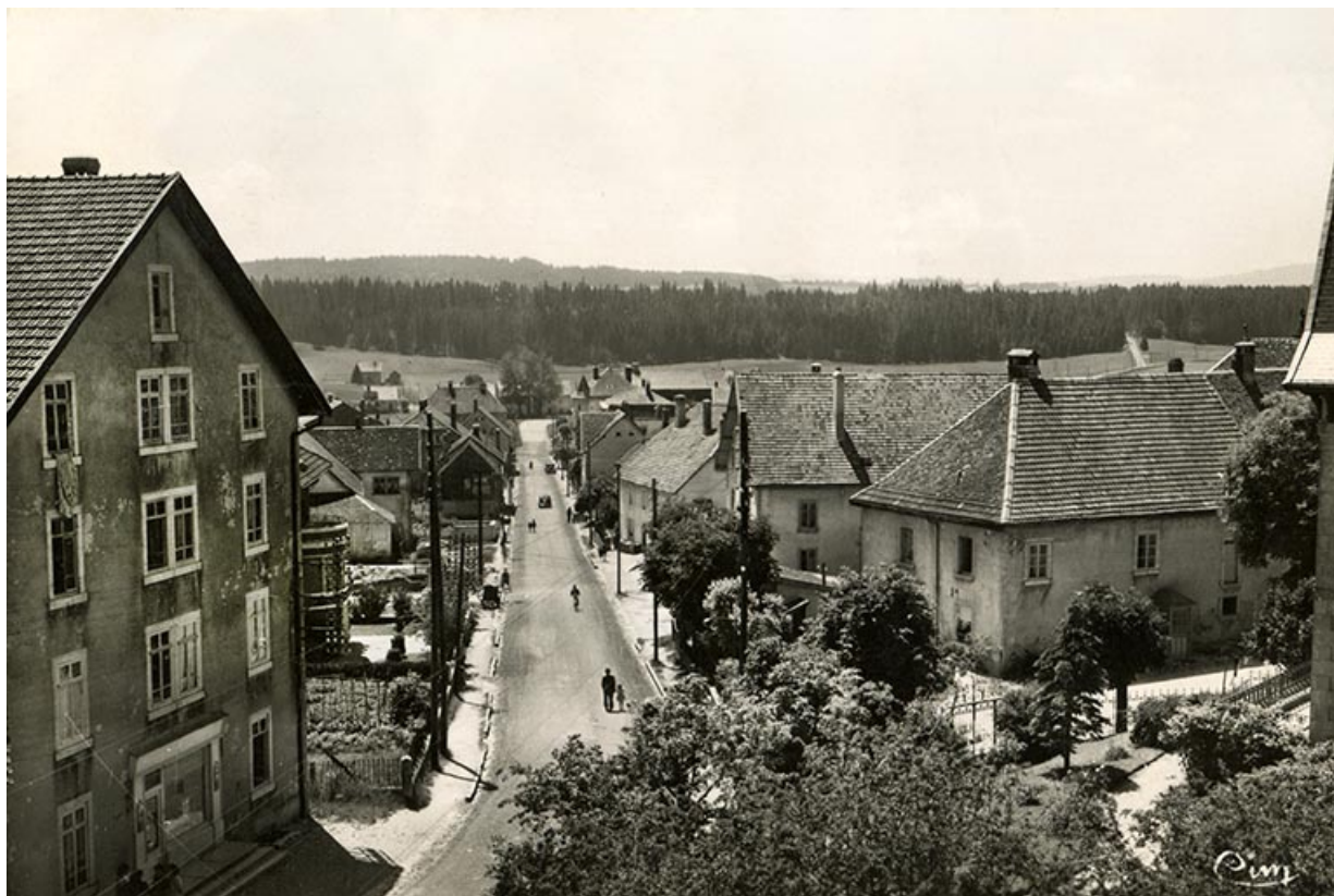
Charquemont (Doubs) - Grande Rue [le bas du village depuis la place de l'Hôtel de Ville], 2e quart 20e siècle (avant 1952). 25, Charquemont, 23 Grande Rue