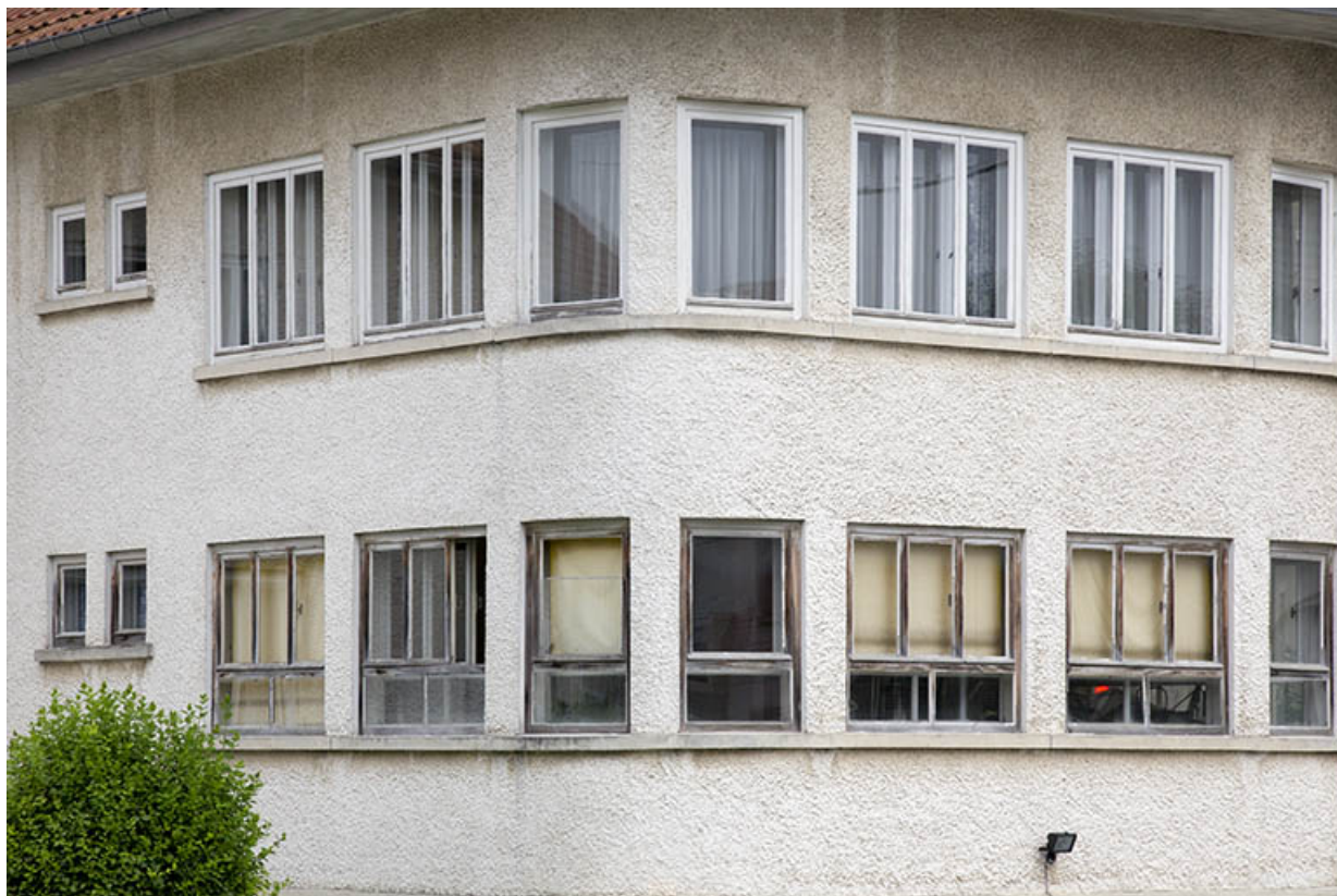
Fenêtres du corps de bâtiment de 1965.