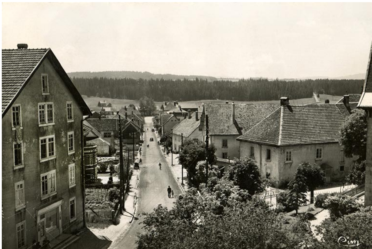
Charquemont (Doubs) - Grande Rue [le bas du village depuis la place de l'Hôtel de Ville], 2e quart 20e siècle (avant 1952). 25, Charquemont, 30 Grande Rue