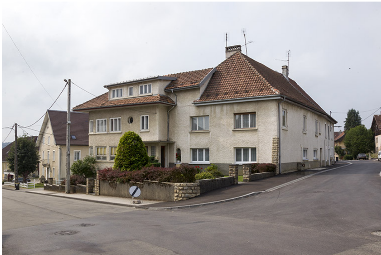
Façades antérieure et latérale gauche, vues du nord.