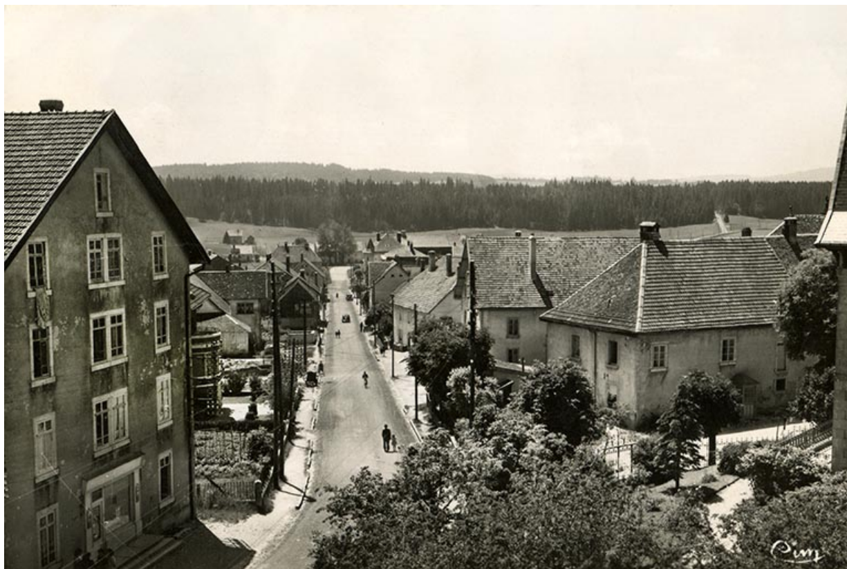
Charquemont (Doubs) - Grande Rue [le bas du village depuis la place de l'Hôtel de Ville], 2e quart 20e siècle (avant 1952). 25, Charquemont, 30 Grande Rue