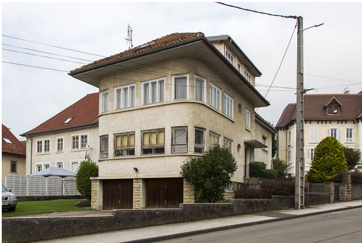
Corps de bâtiment de 1965 : atelier de fabrication et bureau.