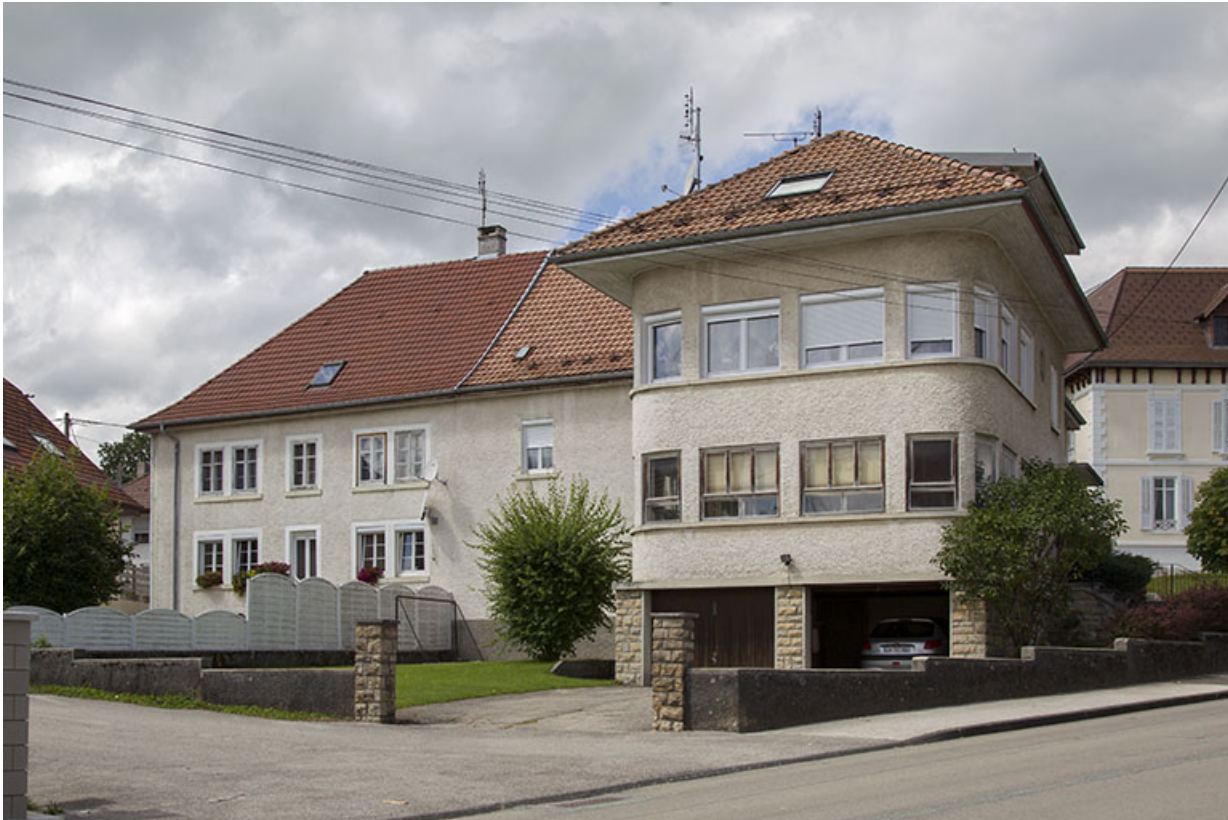
Un atelier de 1965 : usine de montres Briot-Amstutz (30 Grande Rue). 25, Charquemont, 30 Grande Rue