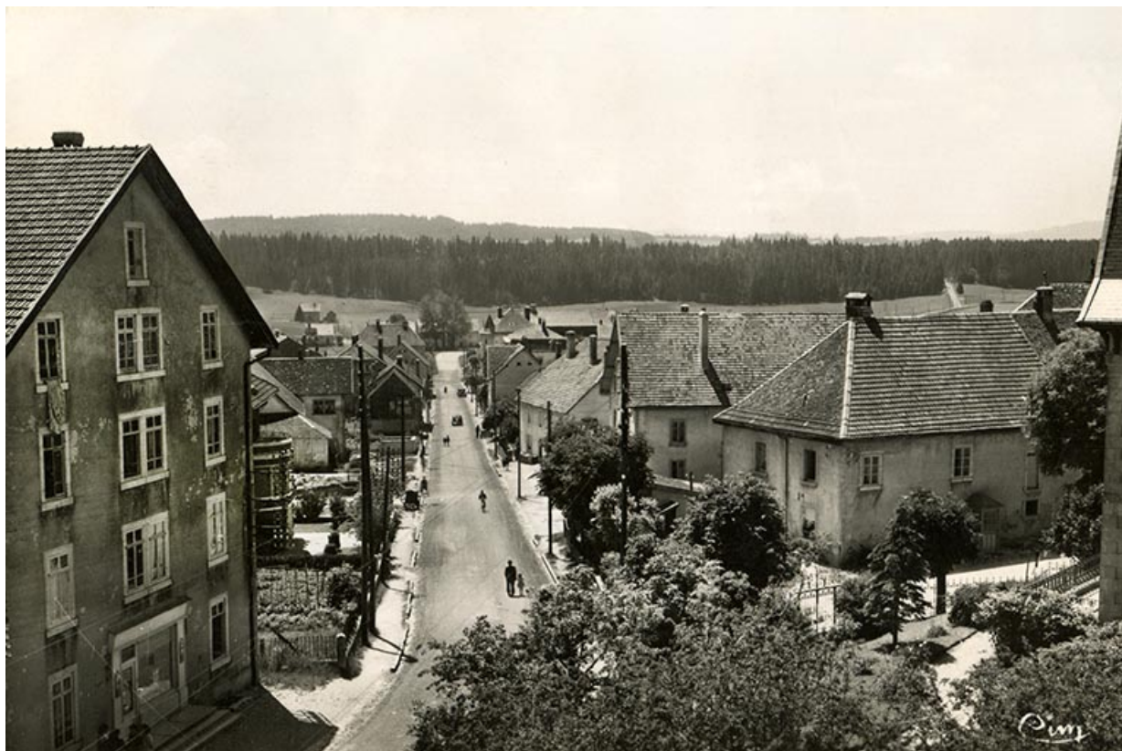
Charquemont (Doubs) - Grande Rue [le bas du village depuis la place de l'Hôtel de Ville], 2e quart 20e siècle (avant 1952). 25, Charquemont, 23 Grande Rue