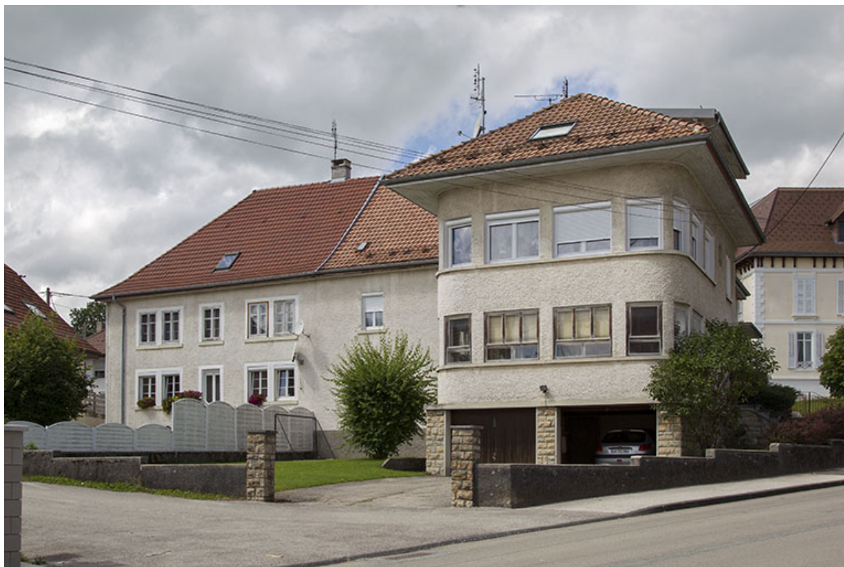
Un atelier de 1965 : usine de montres Briot-Amstutz (30 Grande Rue). 25, Charquemont