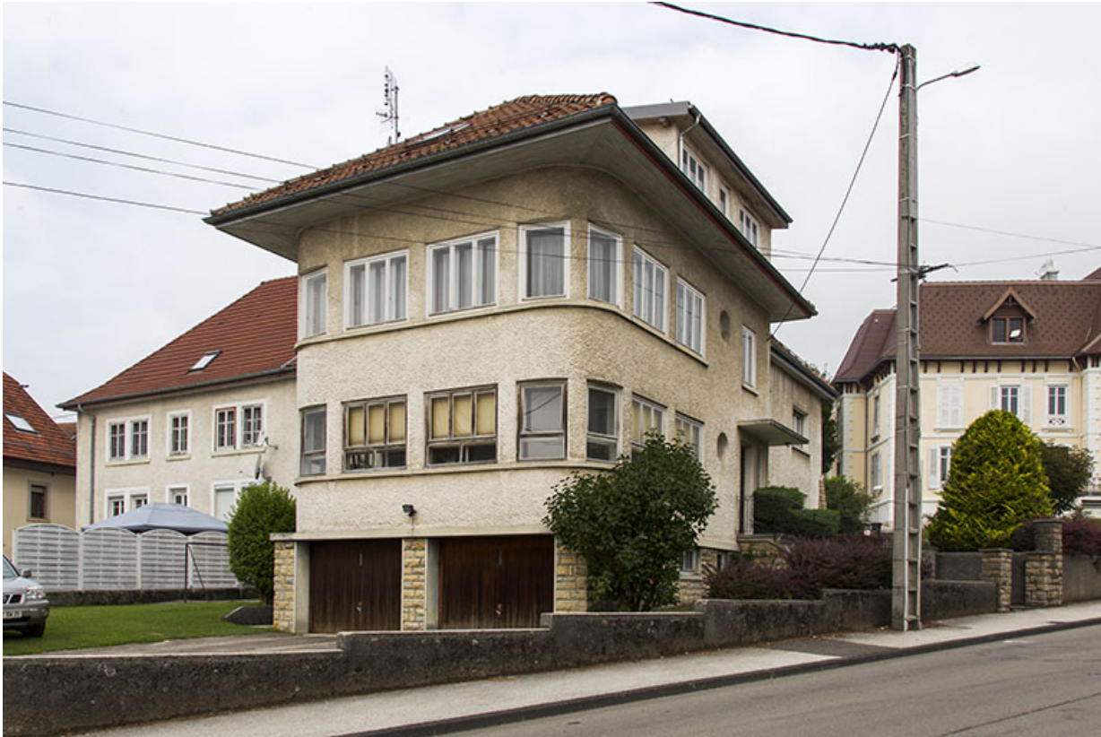
Corps de bâtiment de 1965 : atelier de fabrication et bureau.