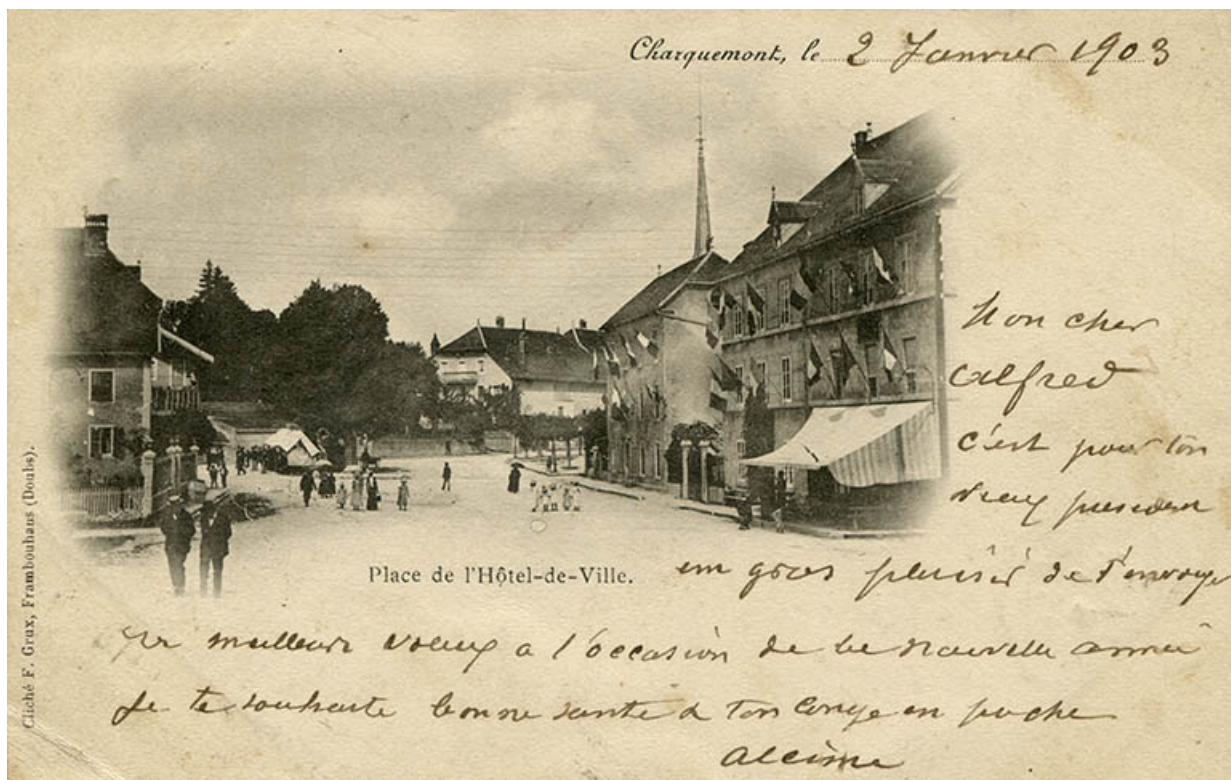
Charquemont. Place de l'Hôtel-de-Ville, 4e quart 19e siècle (avant 1903).

25, Charquemont, 5 et 6 place de l' Hôtel de Ville