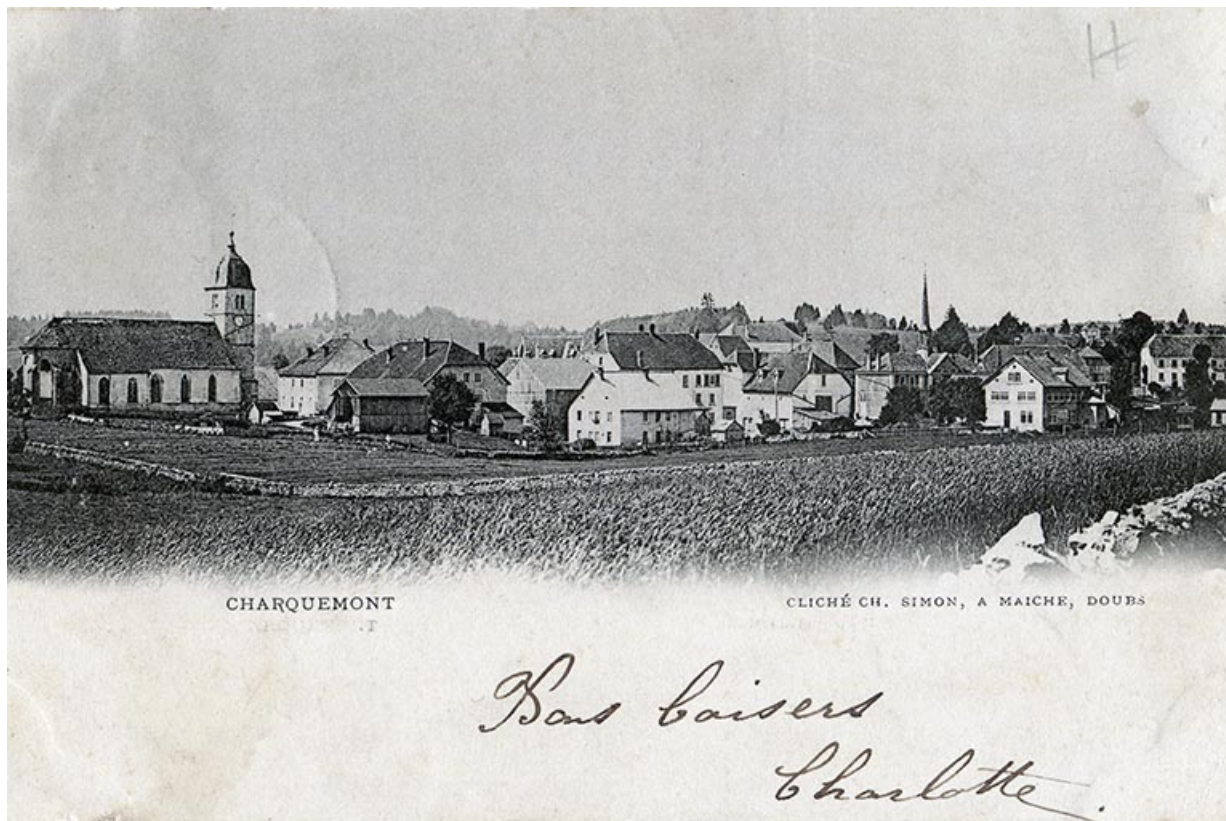
Charquemont [le quartier de l'église vu du nord], 4e quart 19e siècle (avant 1901). L'atelier de 1890 est visible à droite. 25, Charquemont, 5 et 6 place de l' Hôtel de Ville