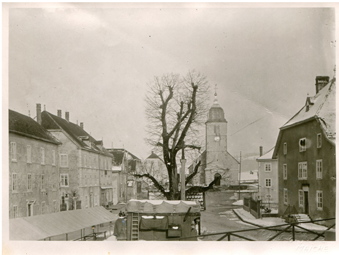
Place de Charquemont avant 1913, limite 19e siècle 20e siècle. A droite l'ancien café de la Liberté. 25, Charquemont, 5 et 6 place de l' Hôtel de Ville