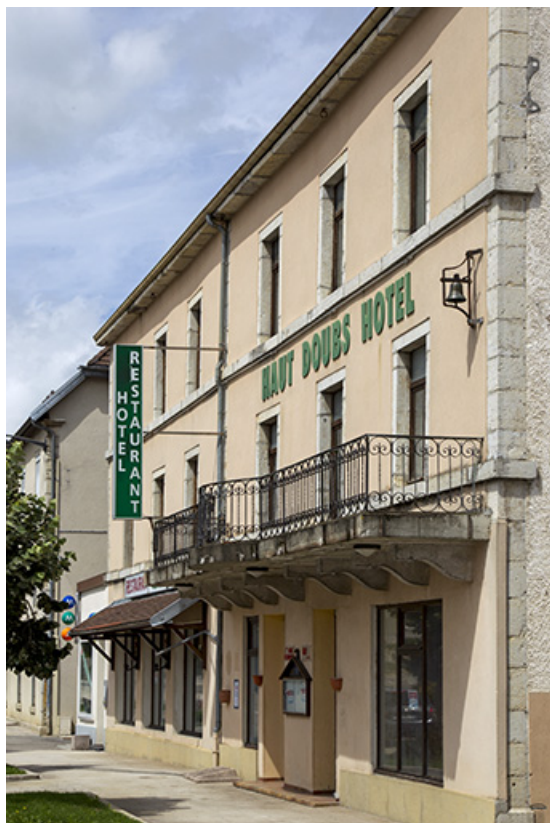
Façade antérieure, vue en enfilade.

25, Charquemont, 5 et 6 place de l' Hôtel de Ville