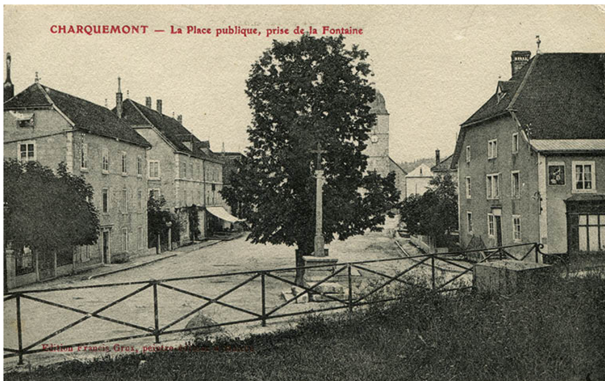
Charquemont - La place publique, prise de la fontaine, 1er quart 20e siècle (avant 1908).

25, Charquemont, 5 et 6 place de l' Hôtel de Ville