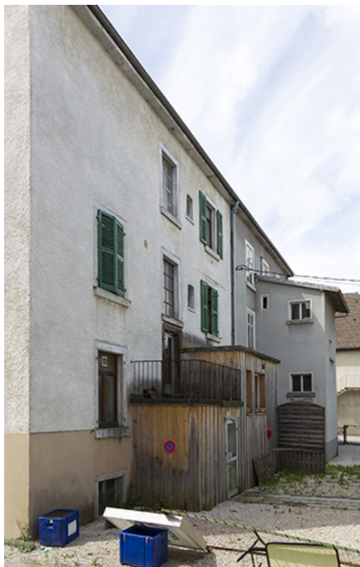
Façade postérieure, vue en enfilade.

25, Charquemont, 5 et 6 place de l' Hôtel de Ville