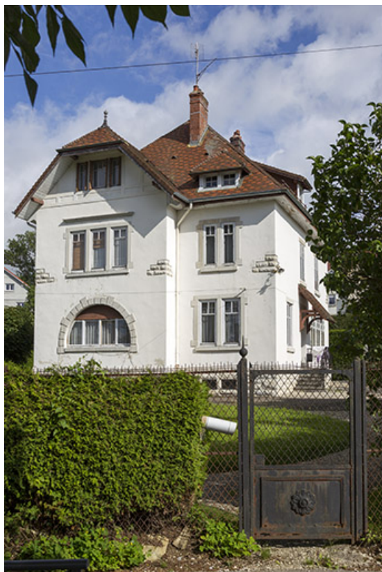
Vue d'ensemble, depuis le sud-est.