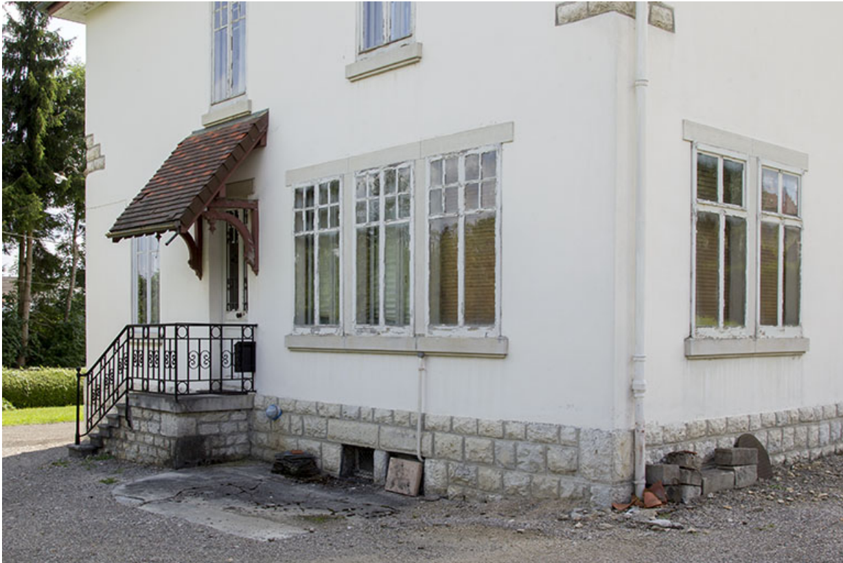
Façade latérale droite : rez-de-chaussée vu de trois quarts droite.