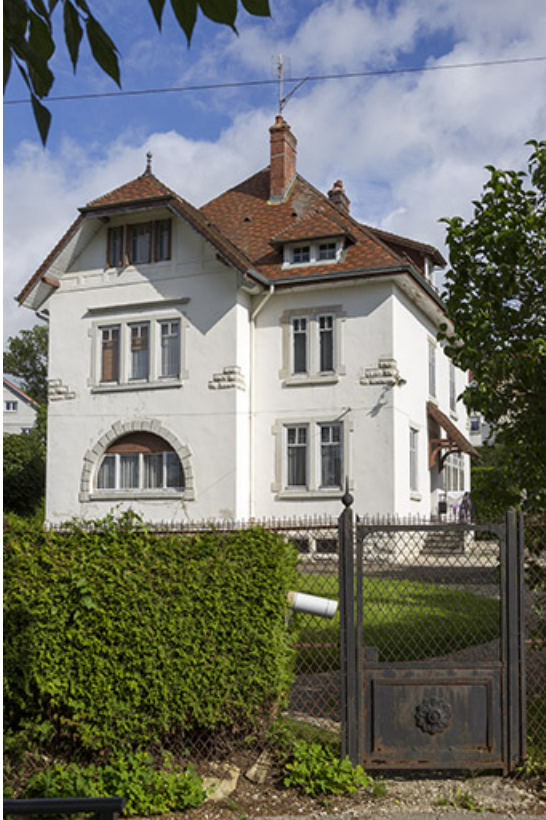
Vue d'ensemble, depuis le sud-est.