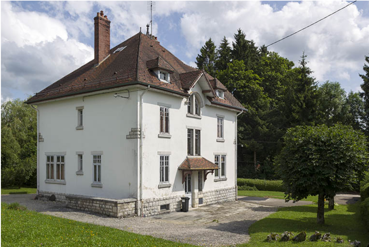
Façades postérieure et latérale gauche.