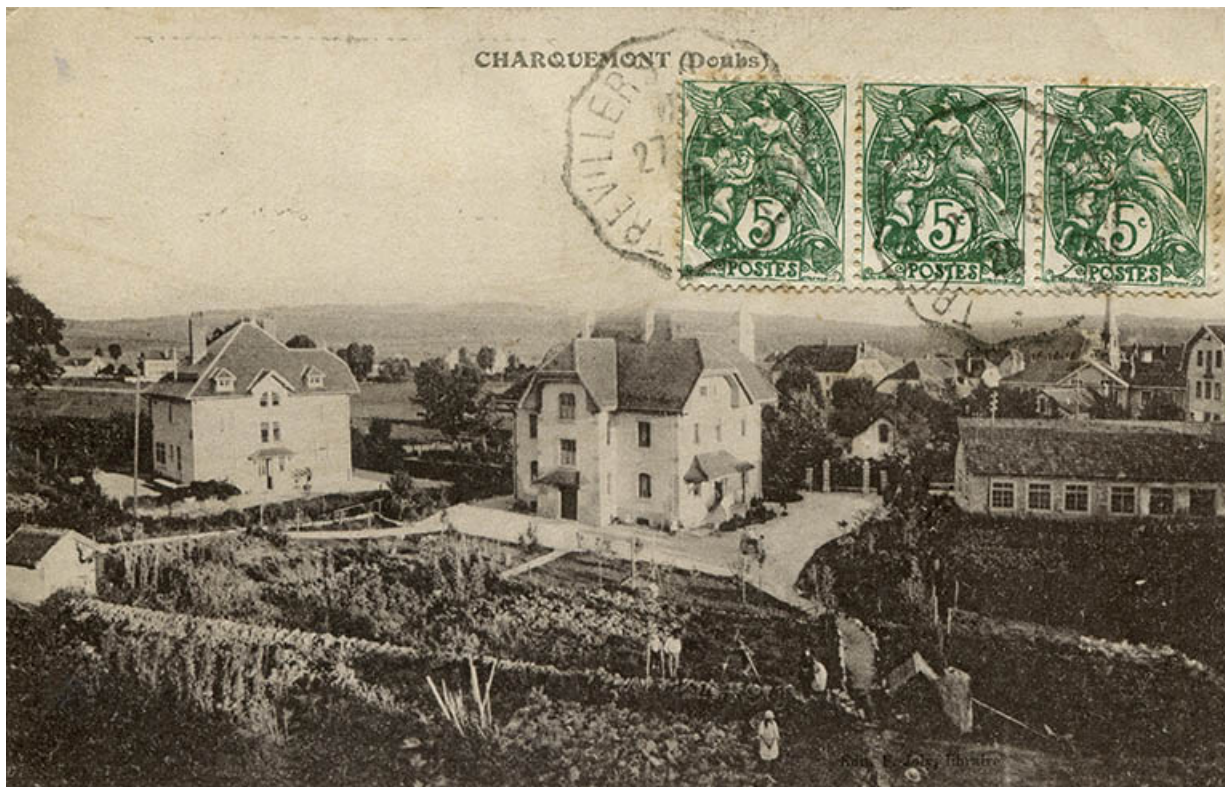
Charquemont (Doubs) [la rue Cuvier vue du nord], 1er quart 20e siècle (après 1918). 25, Charquemont, 4 rue Cuvier