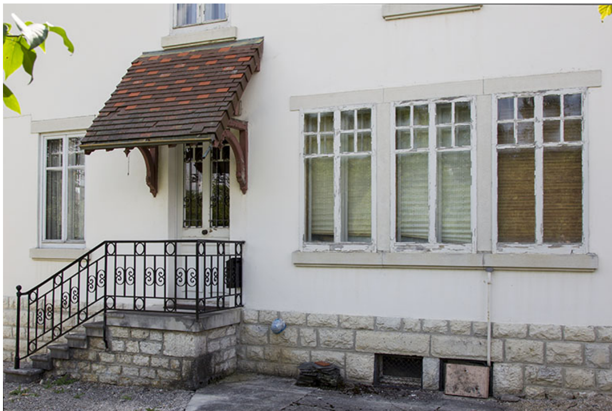
Façade latérale droite : entrée et fenêtres multiples.