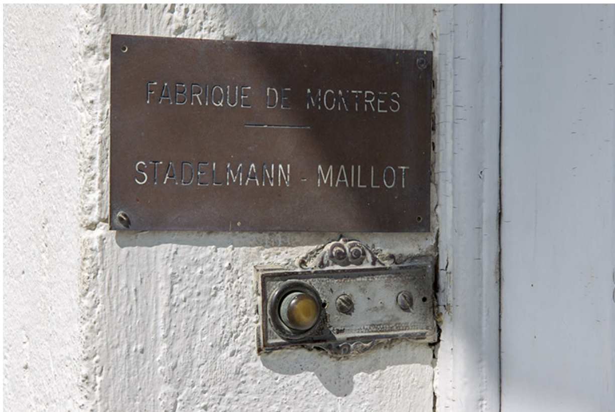
Façade latérale gauche : plaque de la fabrique de montres Stadelmann-Maillot, à l'entrée. 25, Charquemont, 6 rue Cuvier