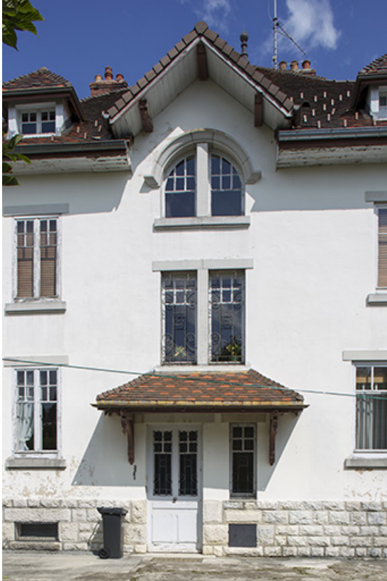
Façade latérale gauche : la travée centrale.