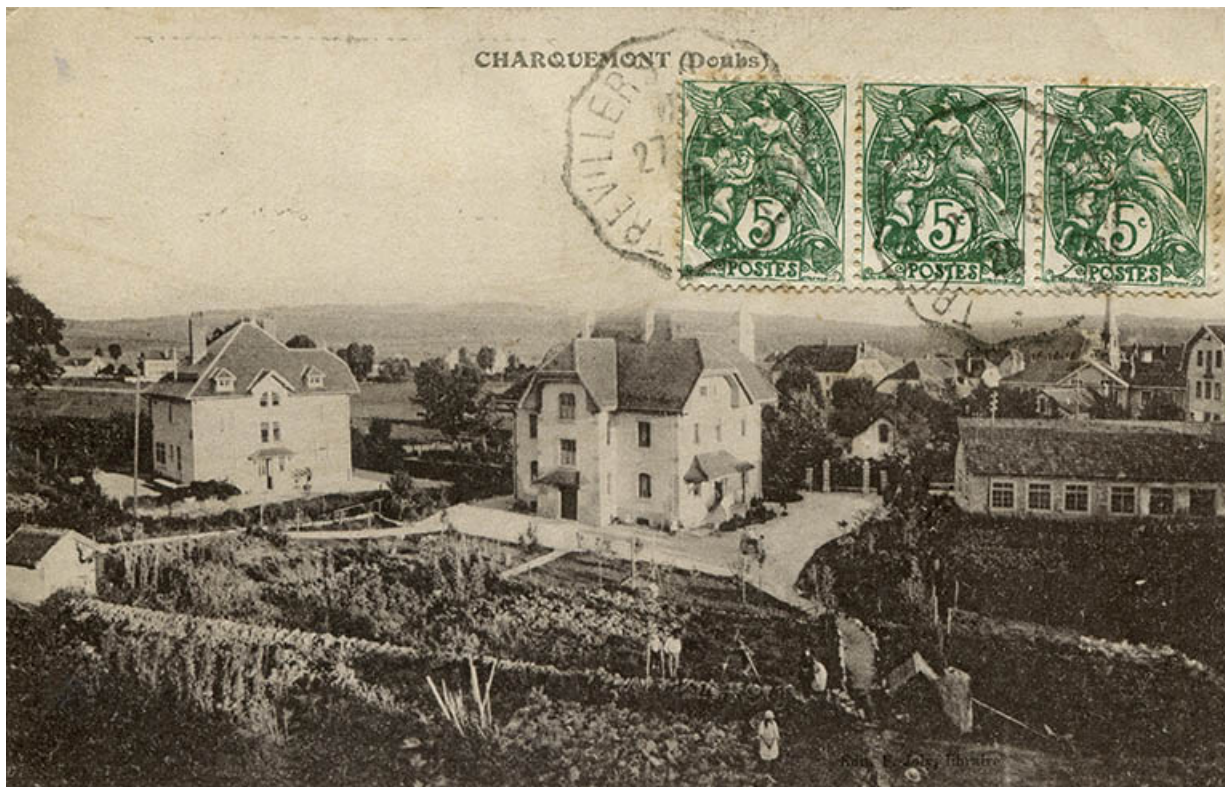
Charquemont (Doubs) [la rue Cuvier vue du nord], 1er quart 20e siècle (après 1918). 25, Charquemont, 6 rue Cuvier