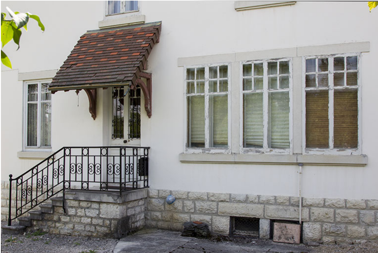
Façade latérale droite : entrée et fenêtres multiples.