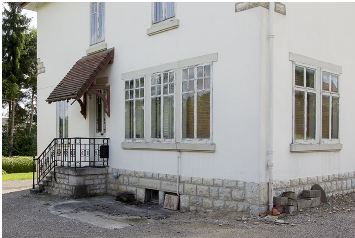
Façade latérale droite : rez-de-chaussée vu de trois quarts droite.