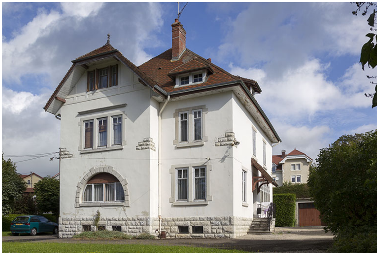
Une maison d'industriel de 1913 : atelier d'horlogerie de Gaston Maillot et comptoir horloger Cyrax (6 rue Cuvier). 25, Charquemont, 6 rue Cuvier