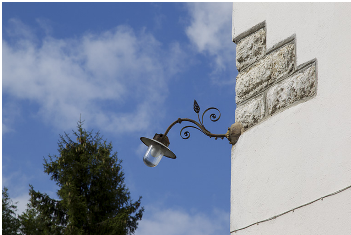
Luminaire d'applique extérieur.