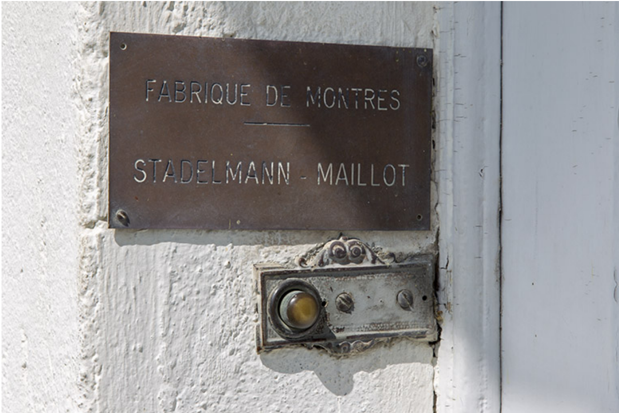
Façade latérale gauche : plaque de la fabrique de montres Stadelmann-Maillot, à l'entrée. 25, Charquemont, 6 rue Cuvier