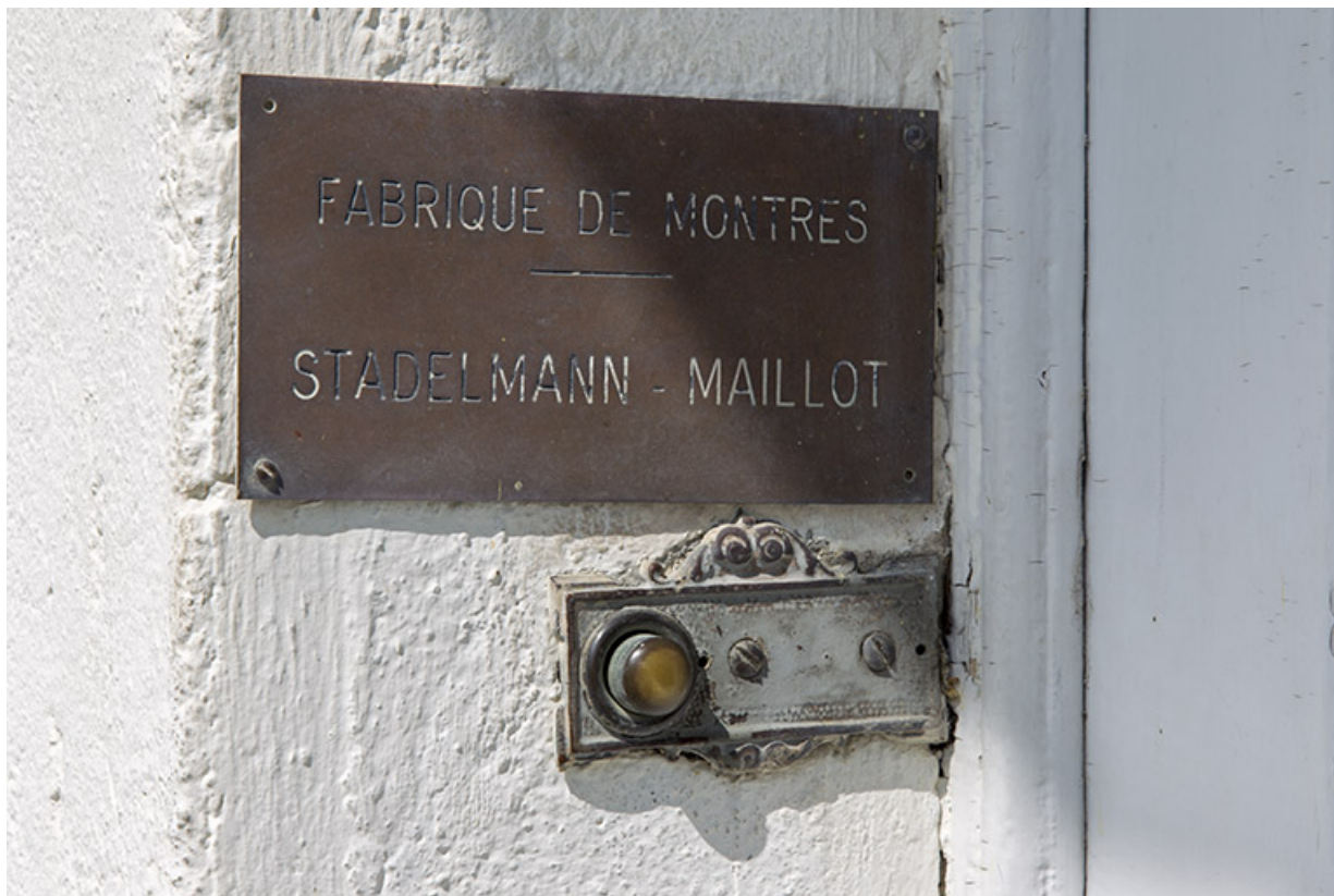
Façade latérale gauche : plaque de la fabrique de montres Stadelmann-Maillot, à l'entrée. 25, Charquemont, 6 rue Cuvier