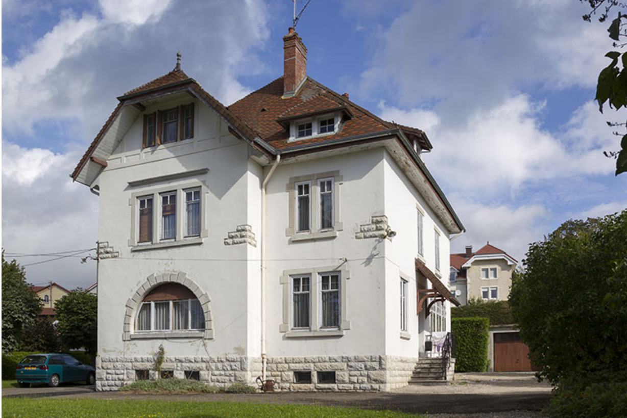
Une maison d'industriel de 1913 : atelier d'horlogerie de Gaston Maillot et comptoir horloger Cyrax (6 rue Cuvier). 25, Charquemont, 6 rue Cuvier