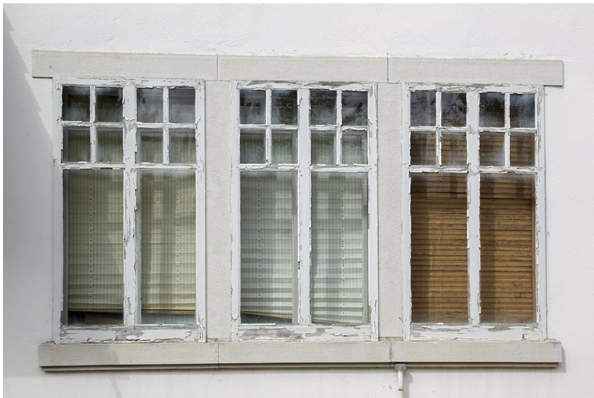
Façade latérale droite : fenêtres multiples.