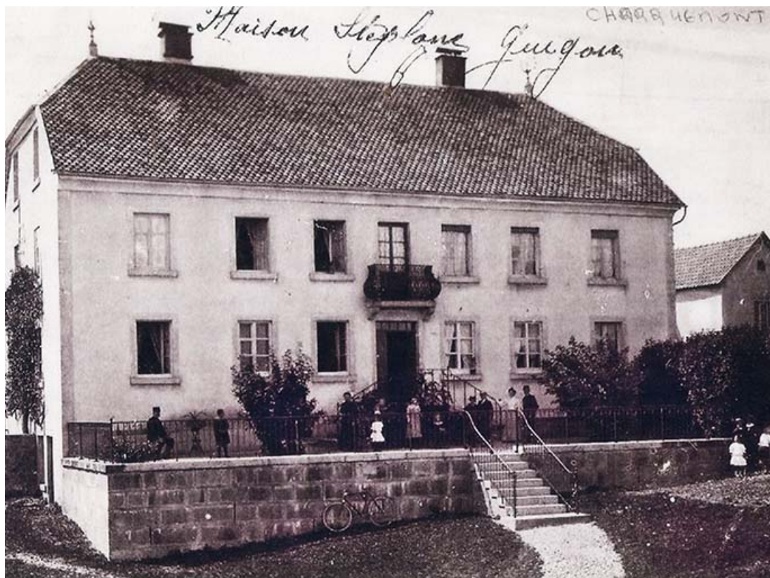
Maison Stéphane Guigon [façade antérieure], 1er quart 20e siècle ? 25, Charquemont, 18 Grande Rue