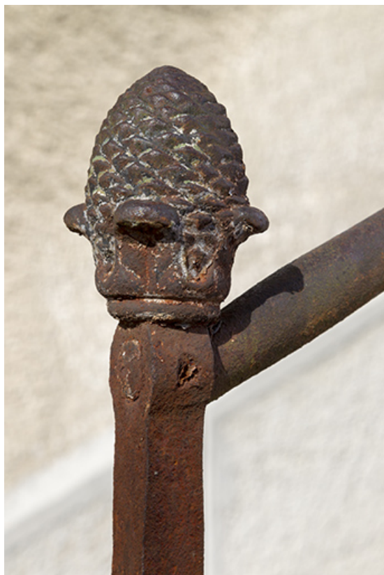
Façade antérieure : pomme de pin servant d'amortissement au garde-corps du perron. 25, Charquemont, 18 Grande Rue