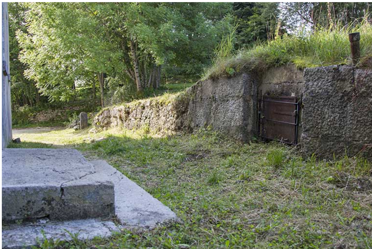
Citerne près de la façade postérieure.