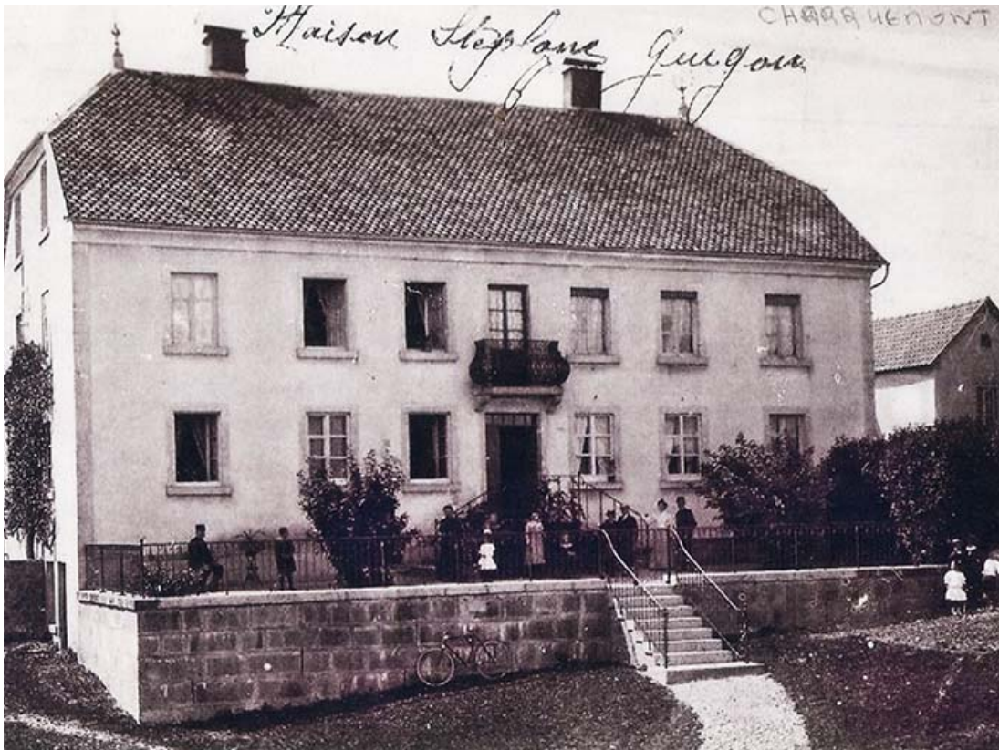
Maison Stéphane Guigon [façade antérieure], 1er quart 20e siècle ? 25, Charquemont, 18 Grande Rue