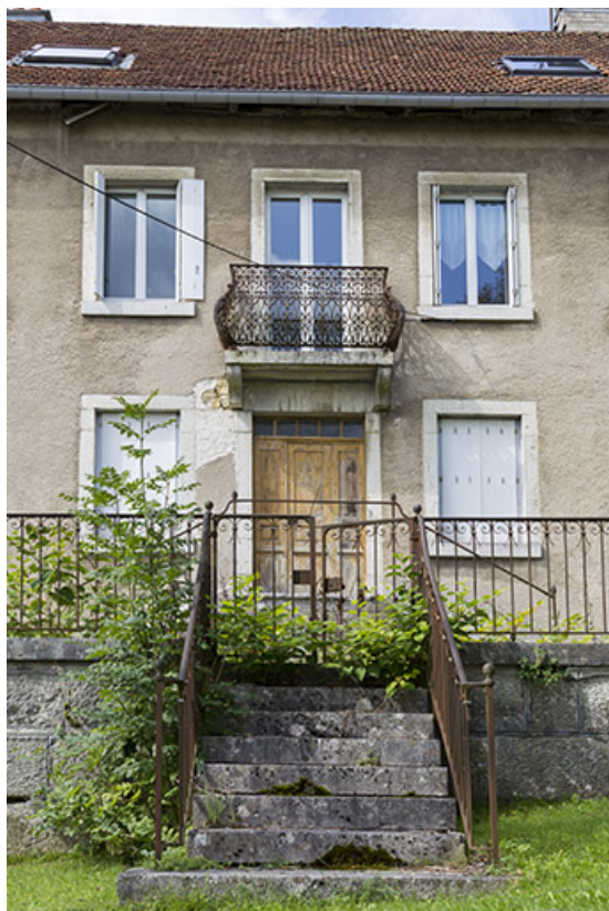
Façade antérieure : travées centrale et terrasse.