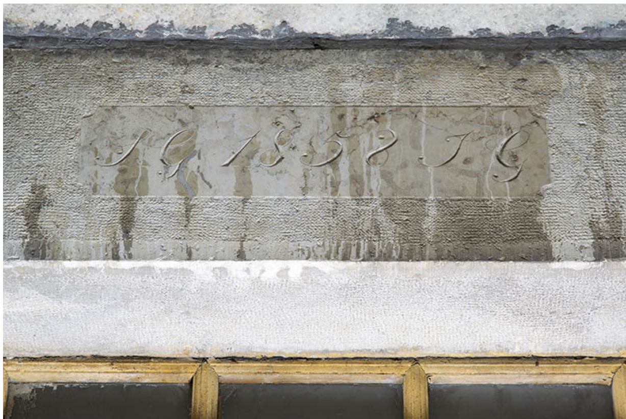
Façade antérieure : date et initiales sur le linteau de la porte.