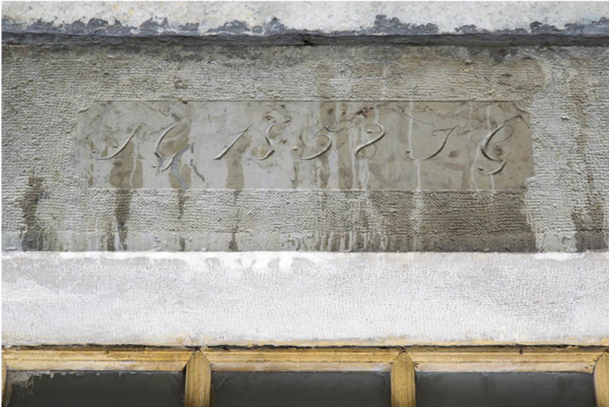
Façade antérieure : date et initiales sur le linteau de la porte.