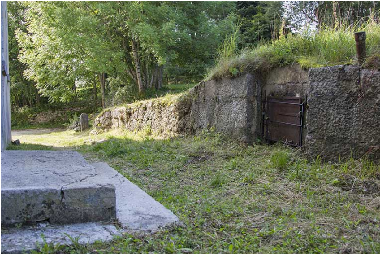
Citerne près de la façade postérieure.