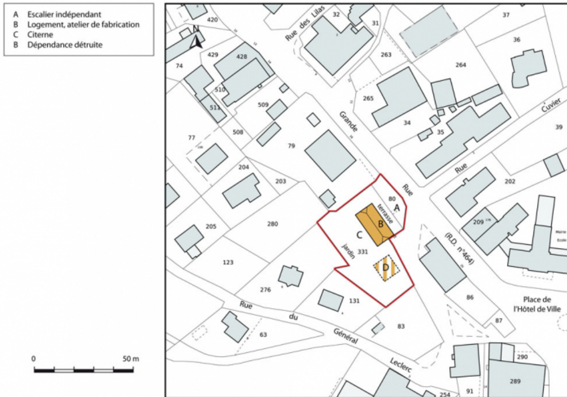
Plan-masse et de situation. Extrait du plan cadastral, 2015, section AI. 25, Charquemont, 18 Grande Rue