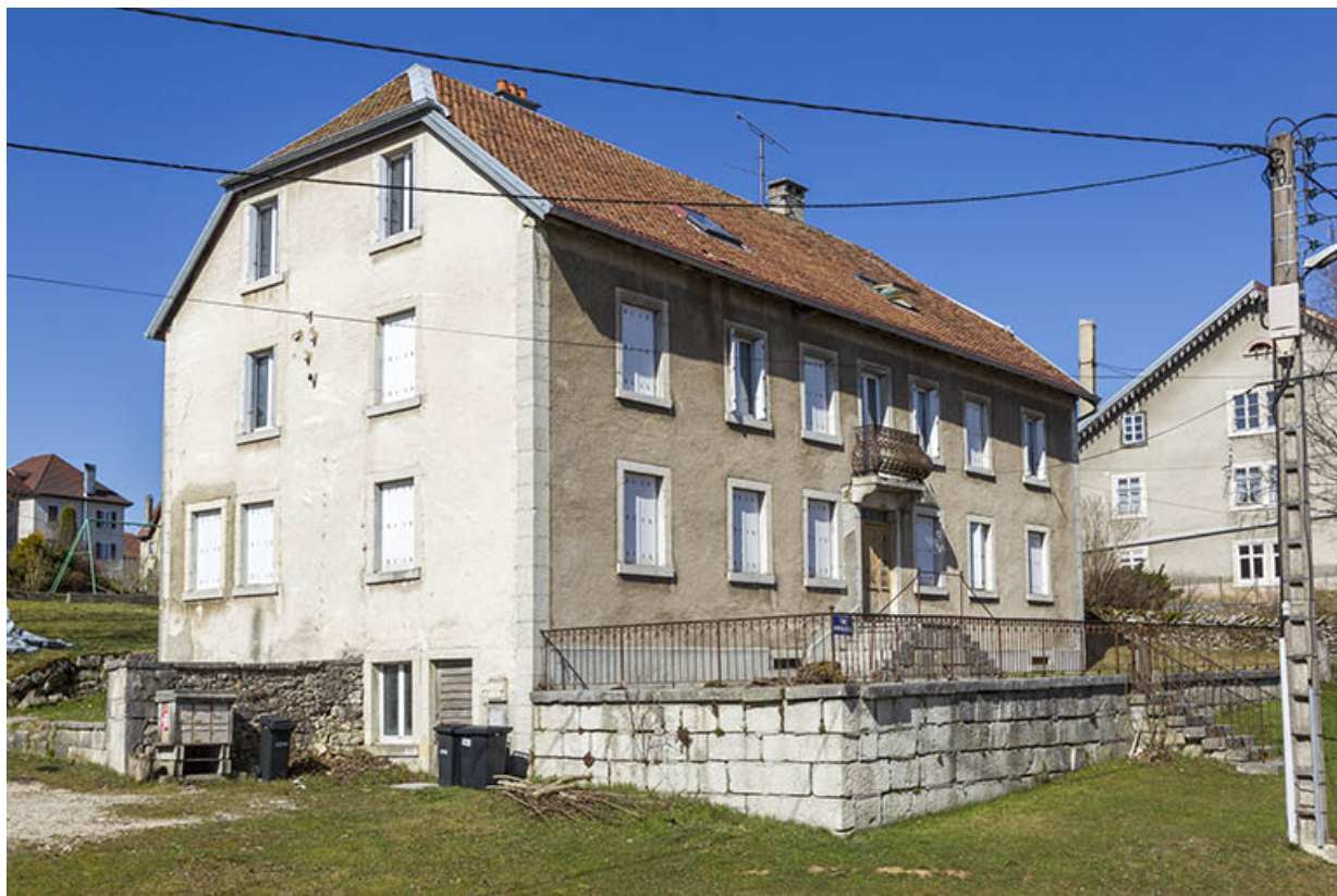
Une maison de 1858 : atelier d'horlogerie Guigon puis Léon Tirole (18 Grande Rue). 25, Charquemont