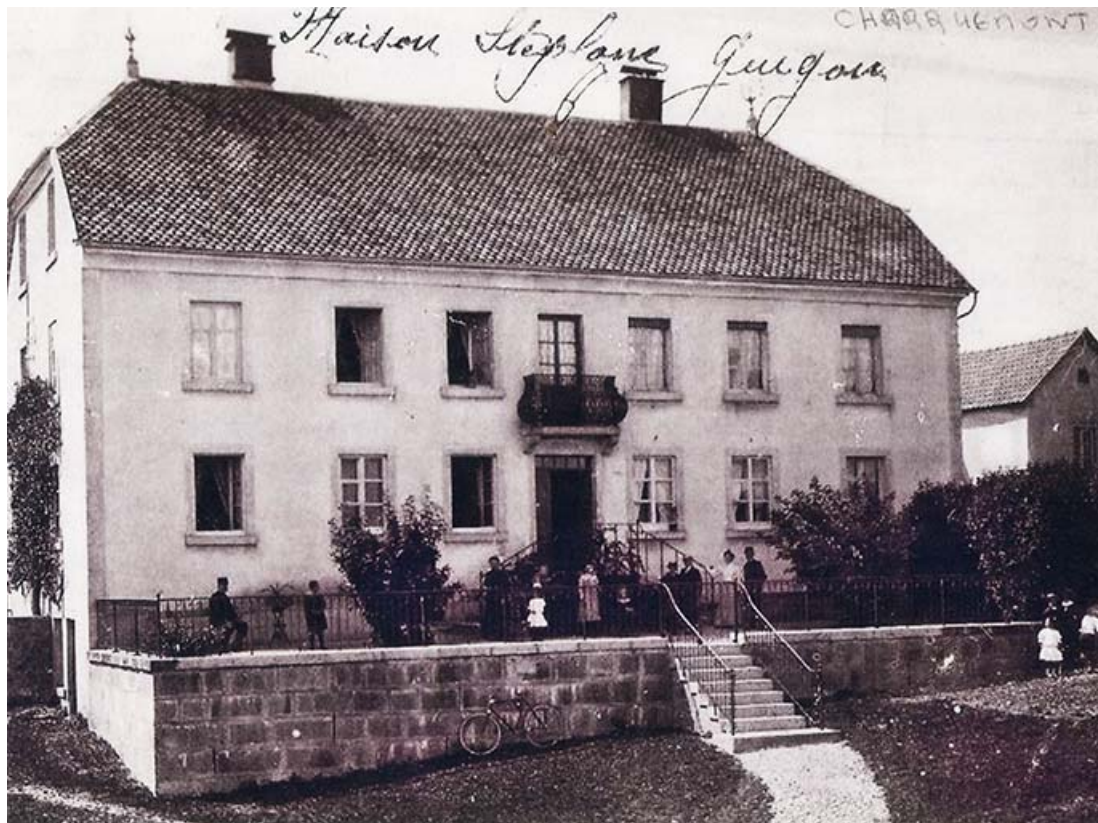
Maison Stéphane Guigon [façade antérieure], 1er quart 20e siècle ? 25, Charquemont, 18 Grande Rue