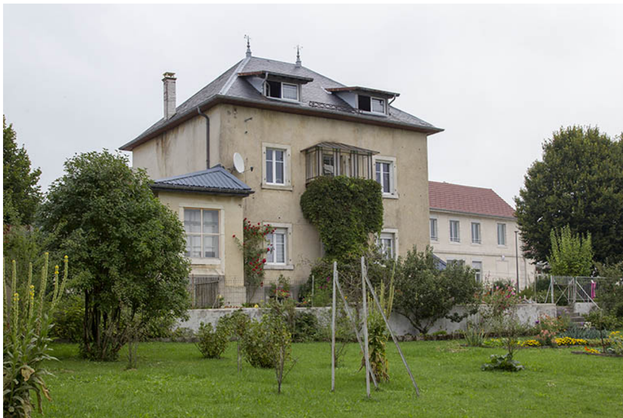
Façade postérieure, de trois quarts gauche.