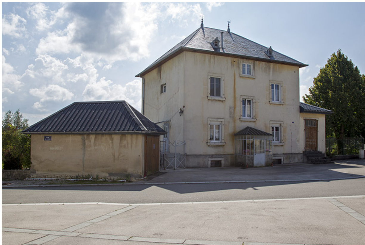
Vue d'ensemble, depuis le nord-est.