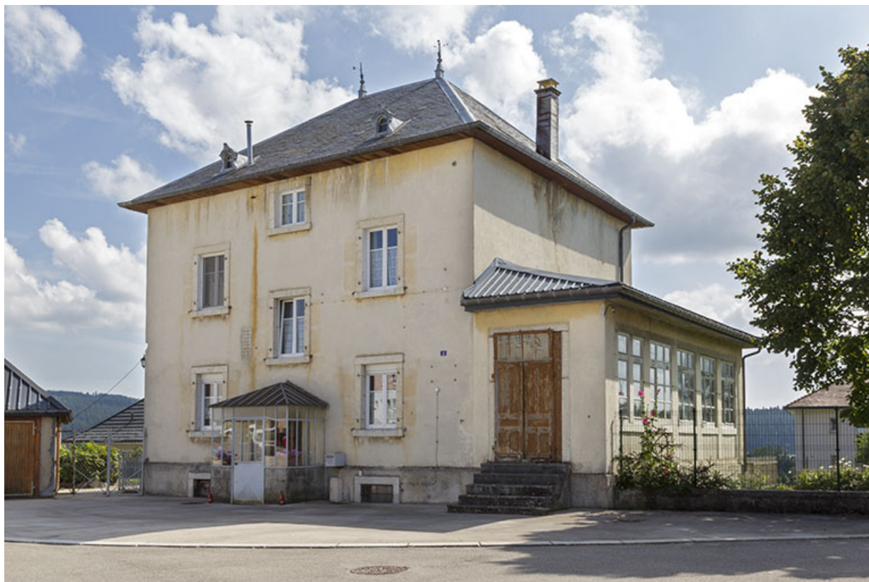
Façades antérieure et latérale droite (atelier de fabrication).