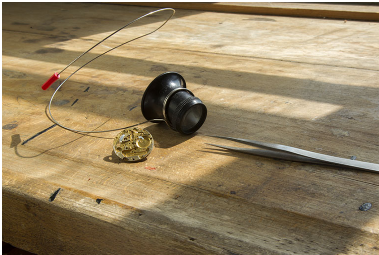
Atelier de fabrication : ébauche, brucelles et loupe d'horloger (dite "microscope" ou "micros"). 25, Charquemont