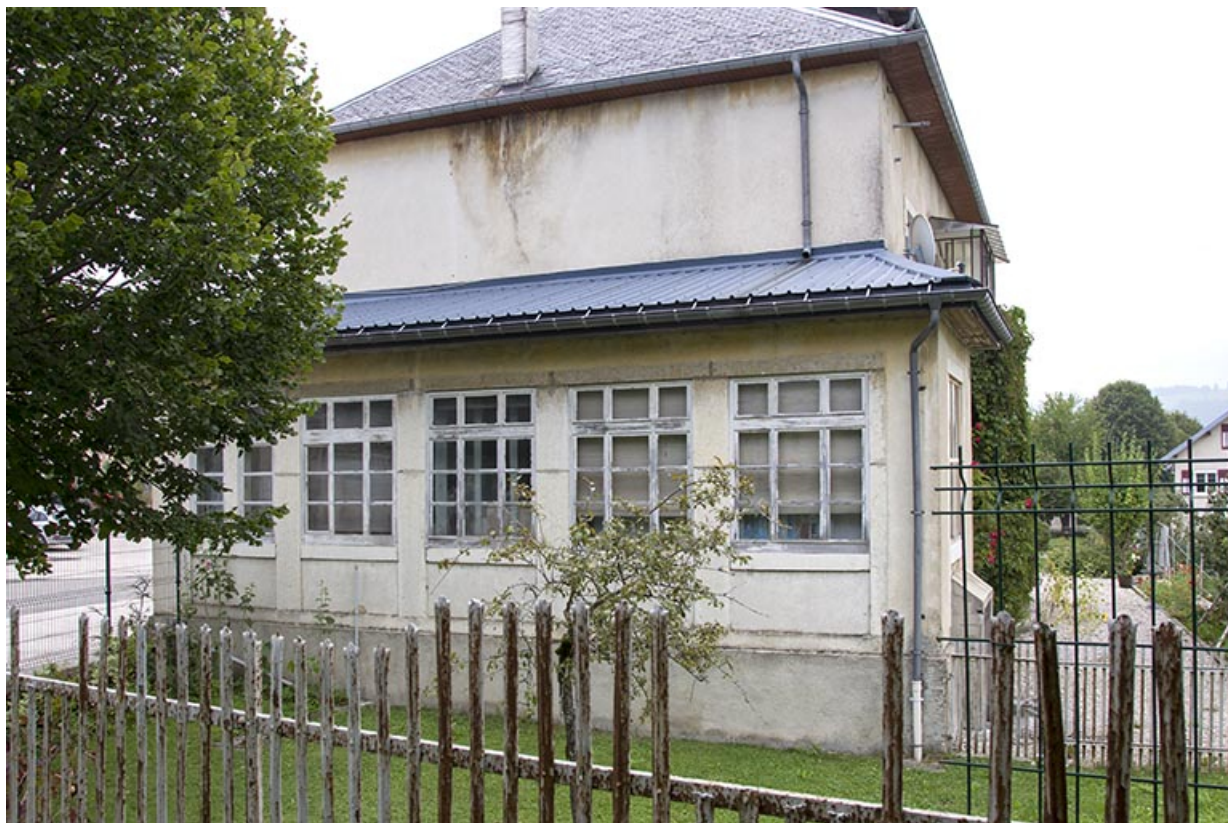
Atelier de fabrication sur la façade latérale droite.