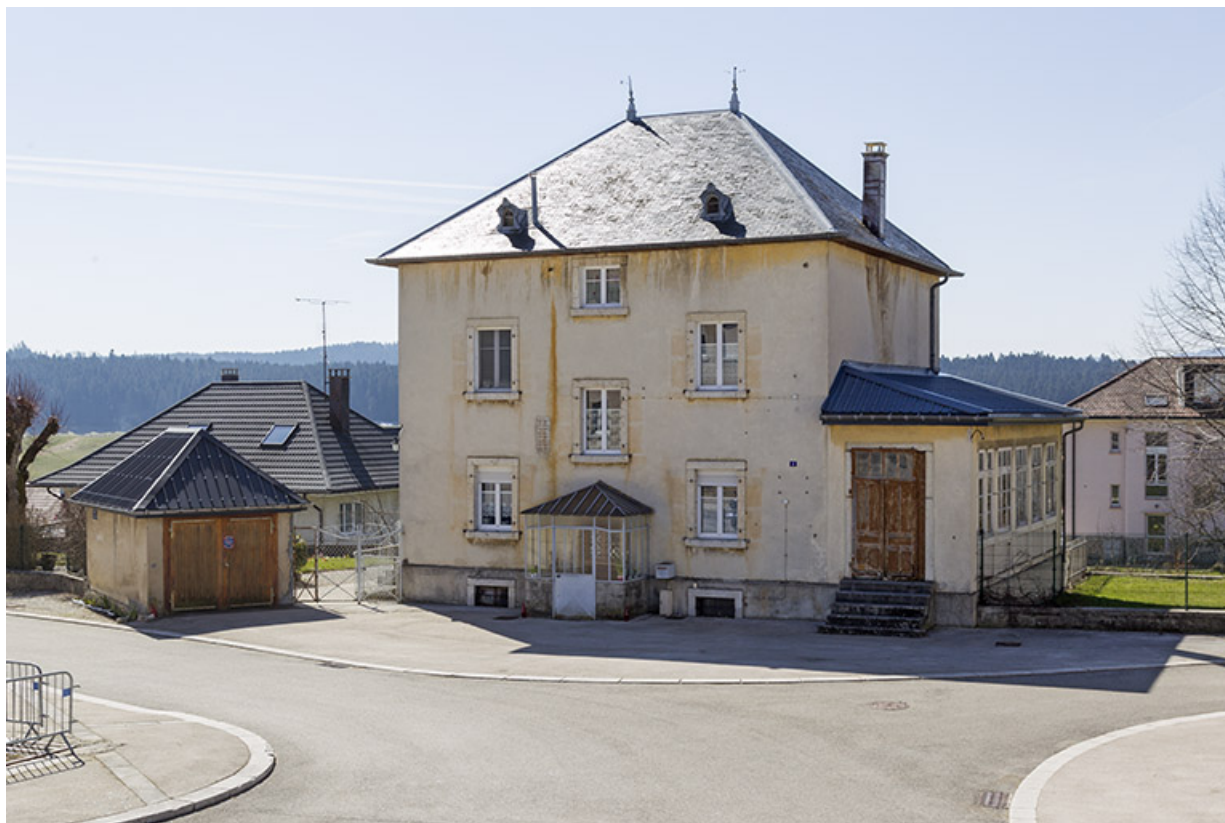
Vue d'ensemble, depuis le nord-ouest.