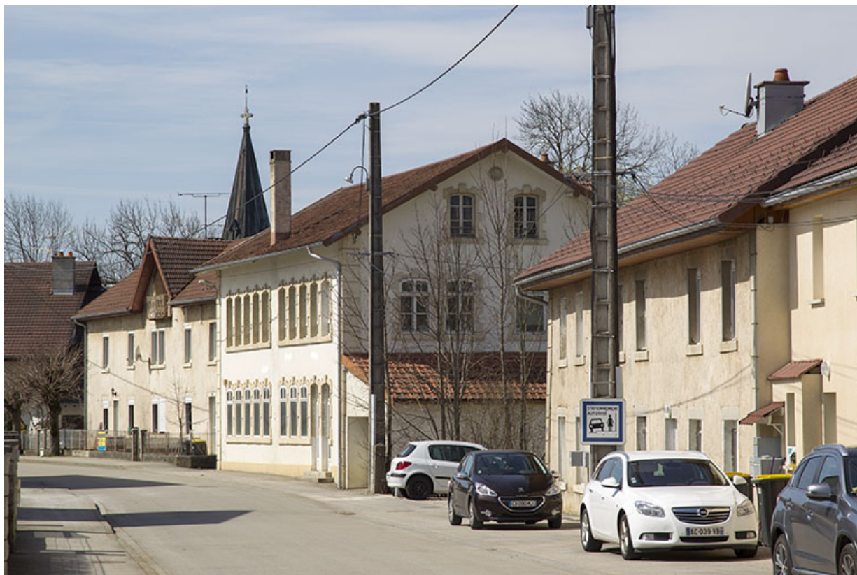
Vue d'ensemble éloignée dans la rue, depuis le nord-est. 25, Charquemont, 11 rue de l' Eglise