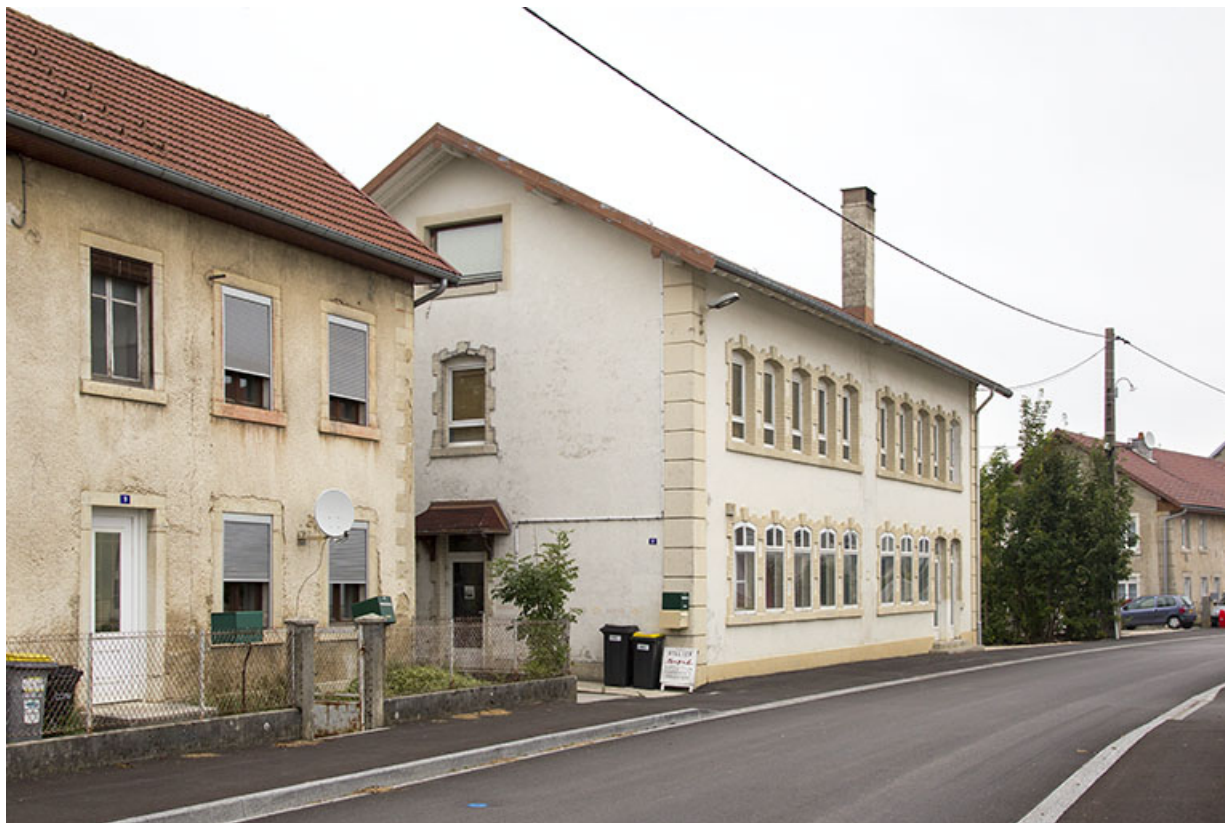
Façade antérieure, de trois quarts gauche. 25, Charquemont, 11 rue de l'Église