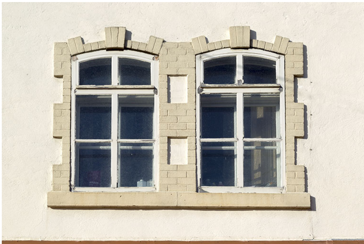
Façade latérale droite : fenêtres horlogère de l'étage carré.