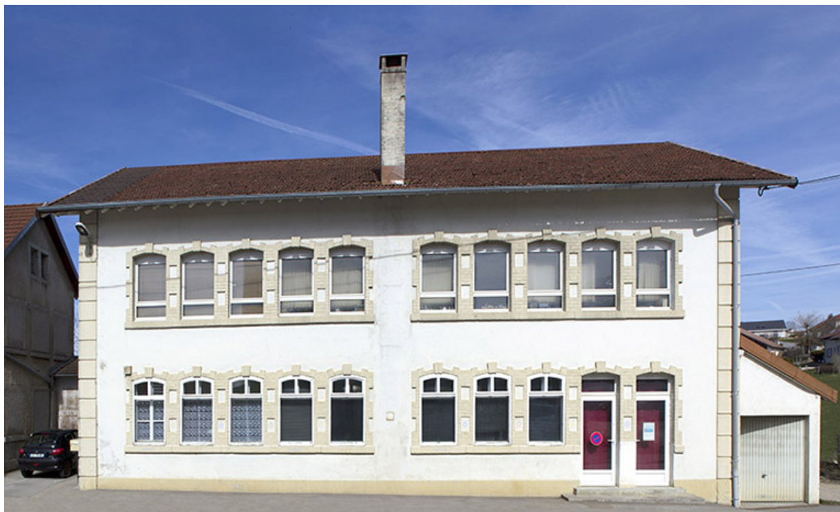
Une usine du début du 20e siècle (vers 1900-1902) : usine de montres et de roues de cylindre puis d'ancre Walcker (11 rue de l'Eglise). 25, Charquemont

N° de l'illustration : 20152500758NUC4AQ