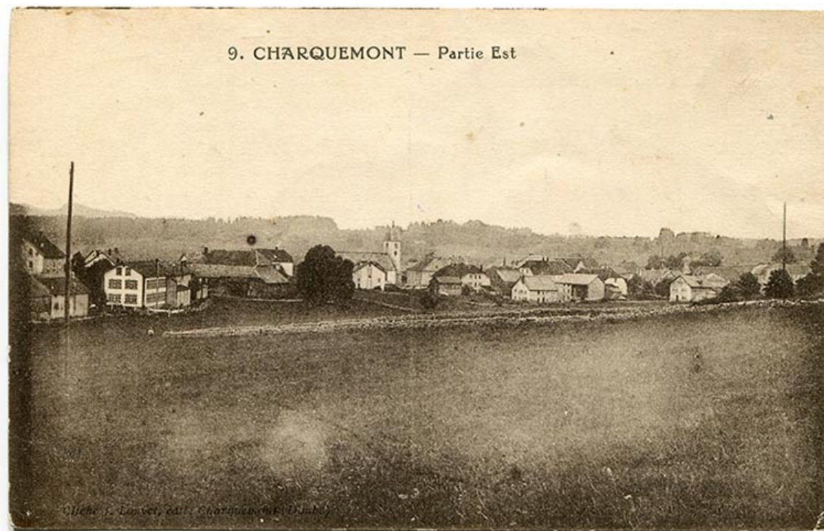
9. Charquemont - Partie Est, 1er quart 20e siècle. L'usine est visible à droite. 25, Charquemont, 11 rue de l' Eglise