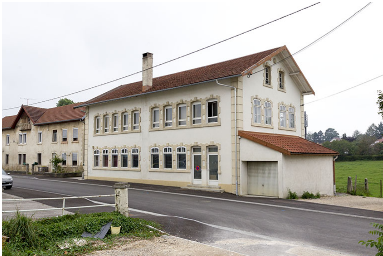
Vue d'ensemble, depuis le nord-est (façades antérieure et latérale droite). 25, Charquemont, 11 rue de l' Eglise