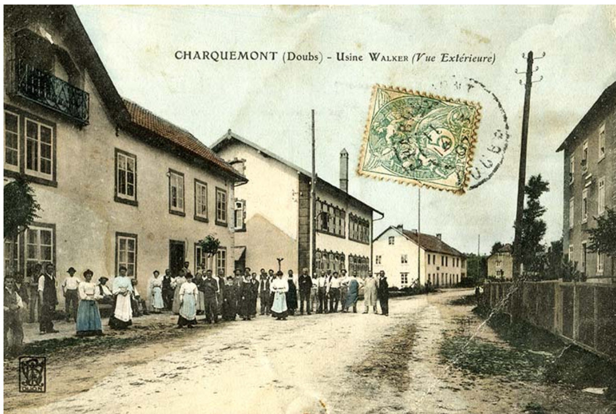
Charquemont (Doubs) - Usine Walker (vue extérieure), entre 1904 et 1907. La future usine Wasner occupe le premier plan à gauche. 25, Charquemont