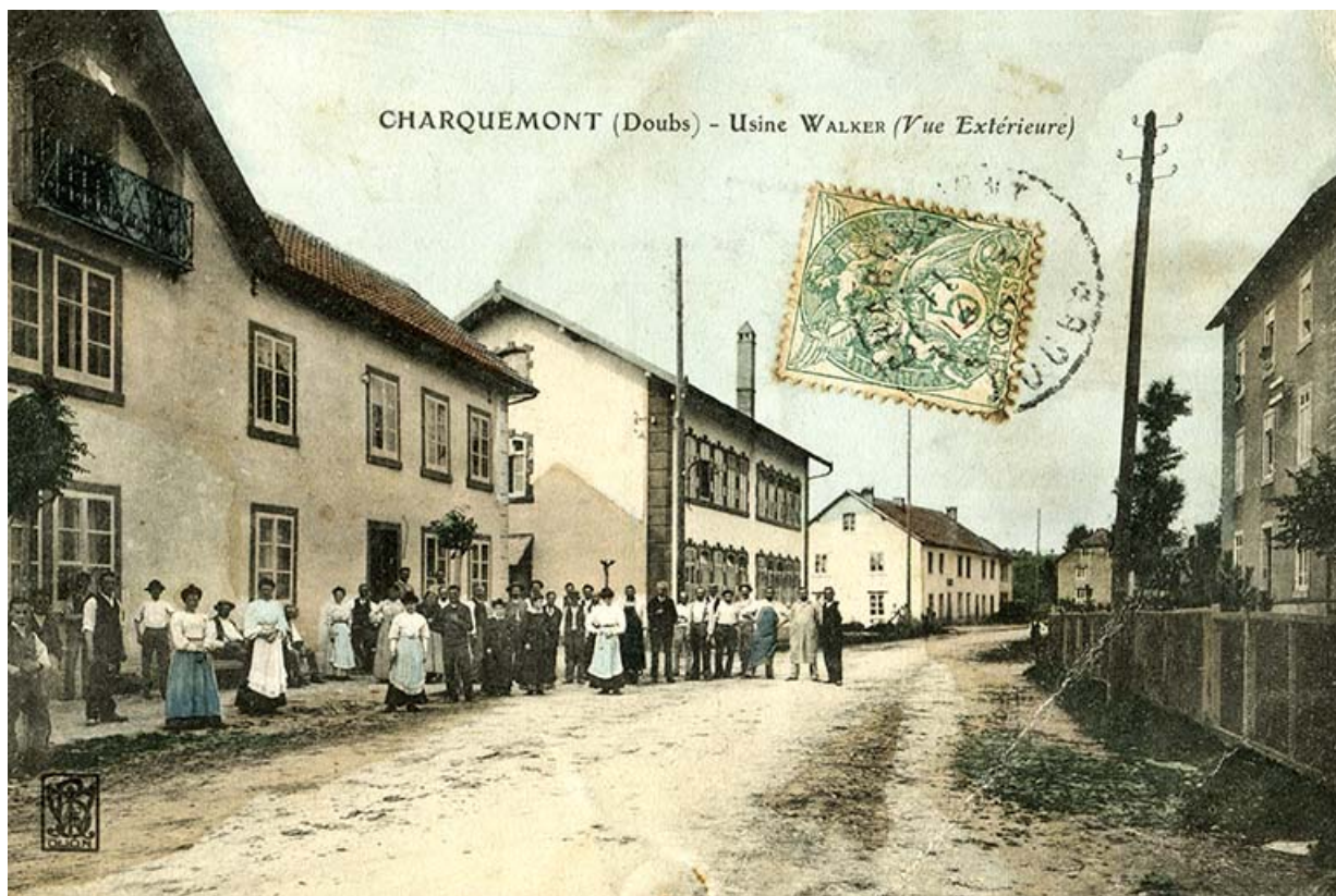
Charquemont (Doubs) - Usine Walker (vue extérieure), entre 1904 et 1907. La future usine Wasner occupe le premier plan à gauche. 25, Charquemont