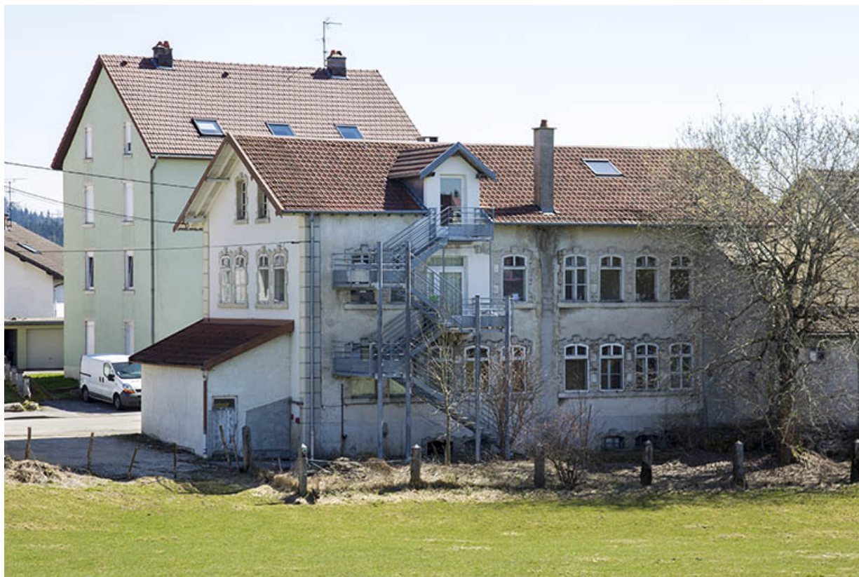
Vue d'ensemble, depuis le nord (façades postérieure et latérale droite). 25, Charquemont, 11 rue de l' Eglise