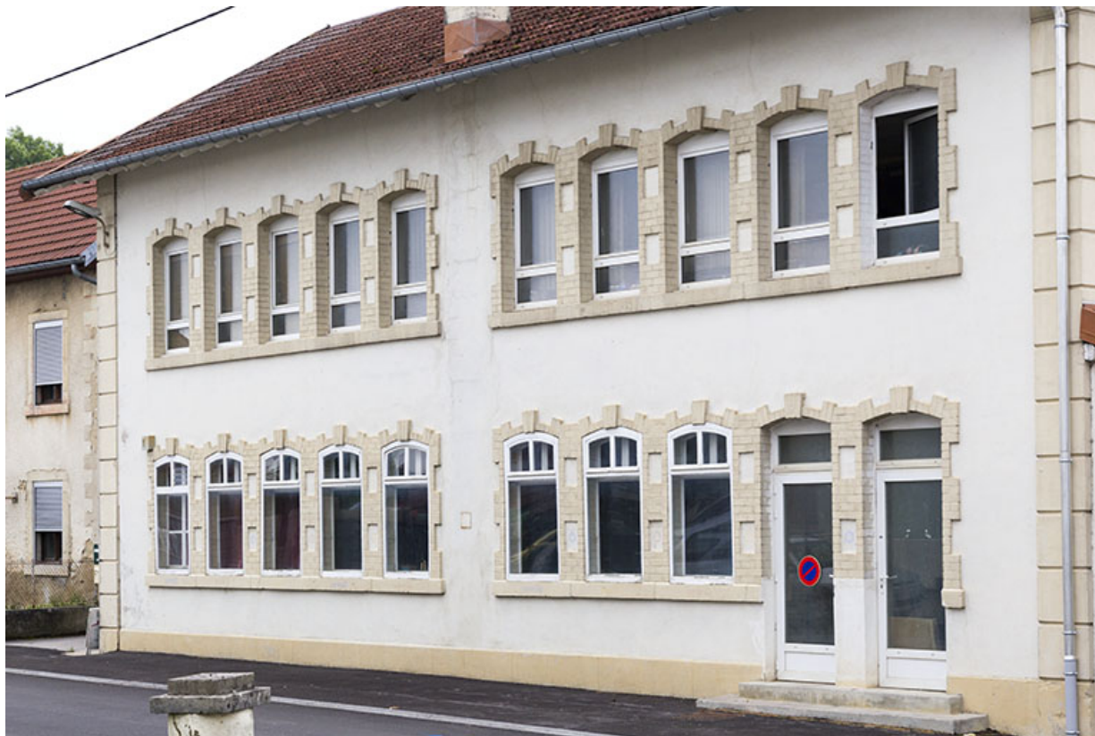
Façade antérieure, de trois quarts droite.