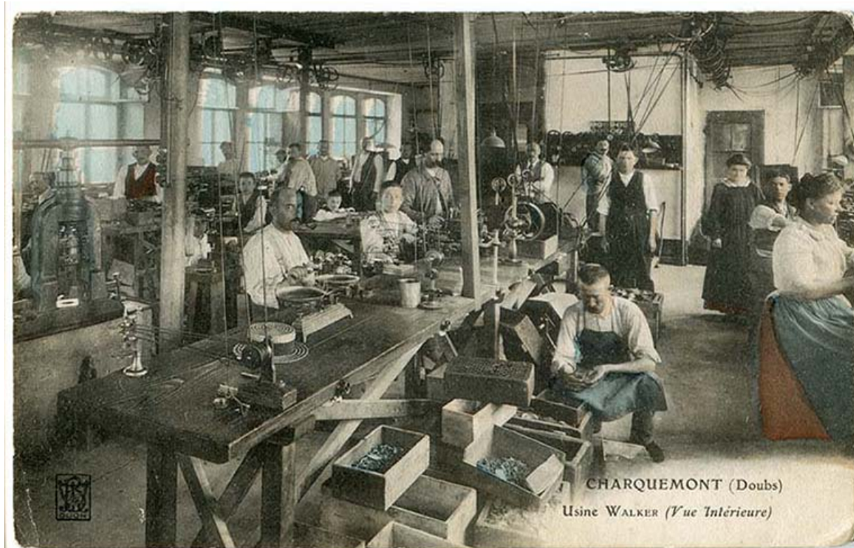
Intérieur d'une entreprise importante (usine de montres et de roues de cylindre puis d'ancre Walcker, 11 rue de l'Eglise) : Charquemont (Doubs) - Usine Walker (vue intérieure), entre 1904 et 1907.