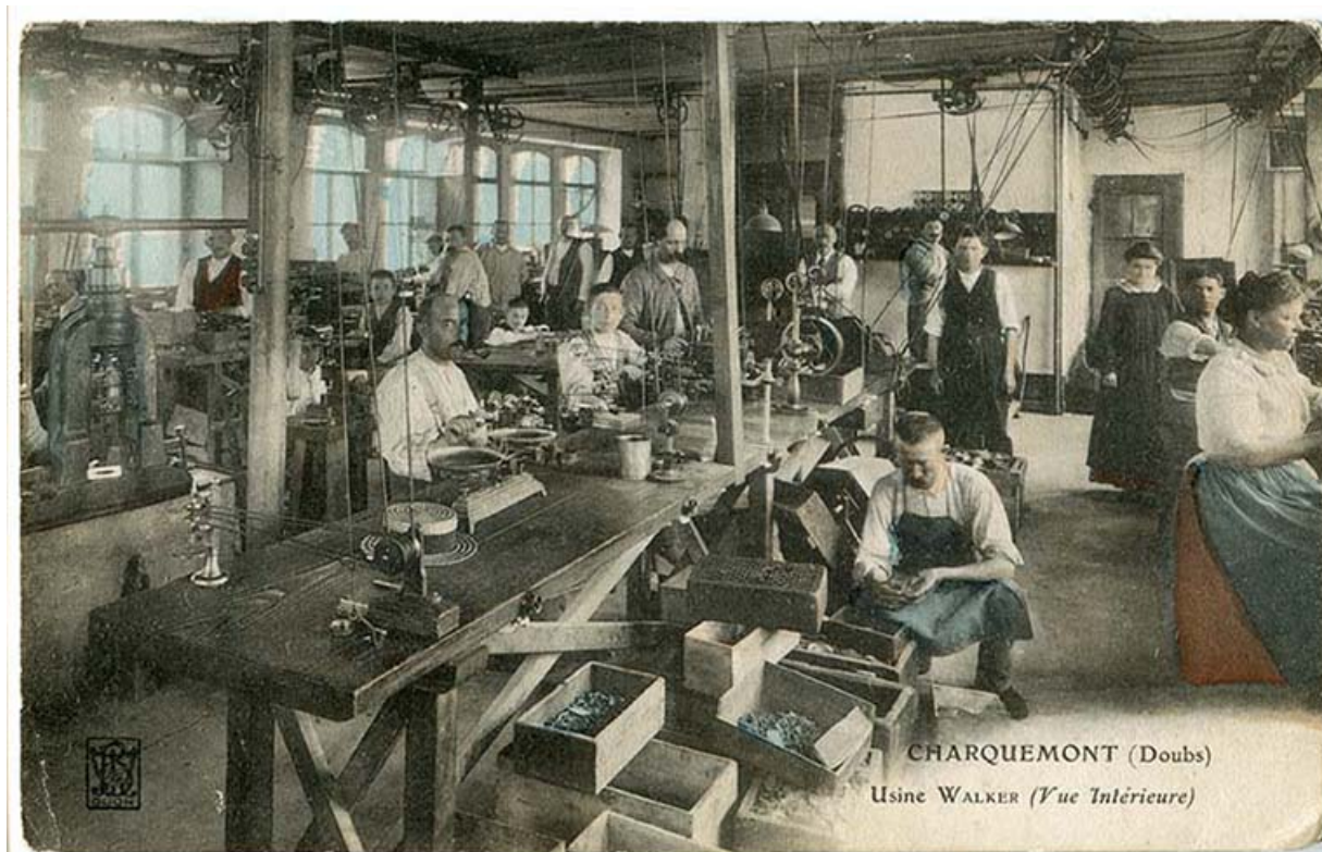
Intérieur d'une entreprise importante (usine de montres et de roues de cylindre puis d'ancre Walcker, 11 rue de l'Eglise) : Charquemont (Doubs) - Usine Walker (vue intérieure), entre 1904 et 1907.