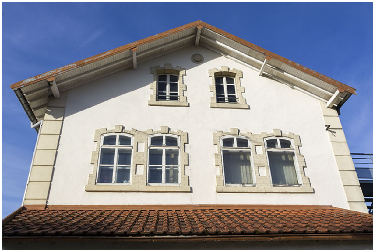
Façade latérale droite : fenêtres de niveaux supérieurs.