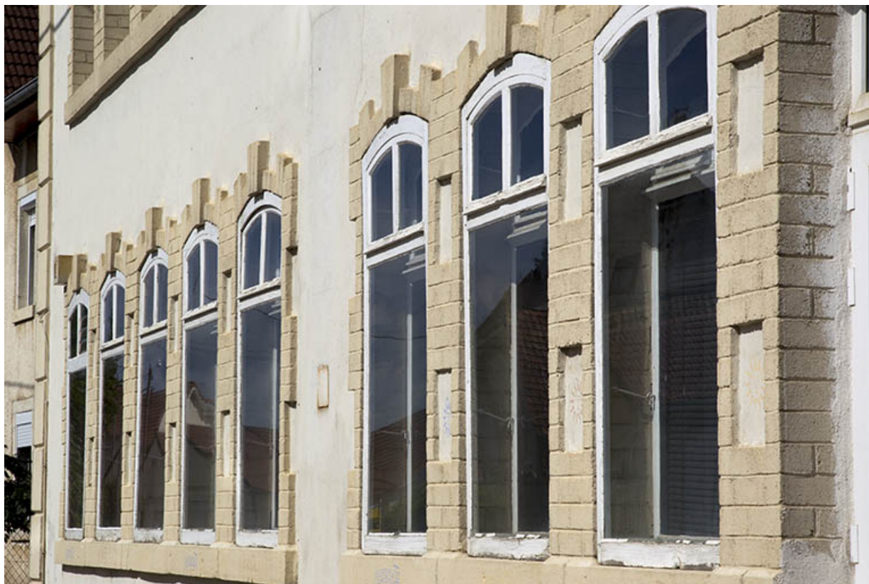
Façade antérieure : fenêtres multiples du rez-de-chaussée vue en enfilade. 25, Charquemont, 11 rue de l'Église