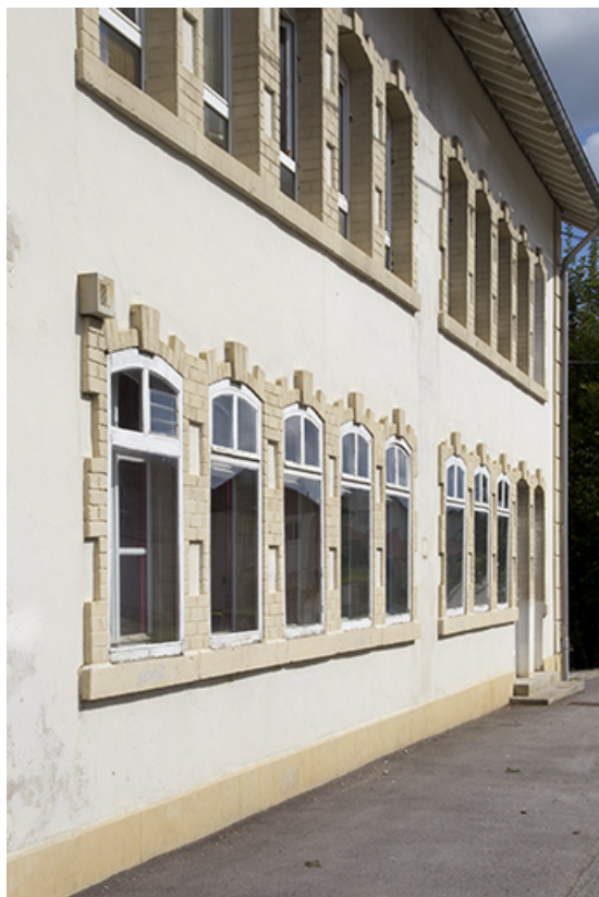
Façade antérieure : fenêtres multiples vues en enfilade.