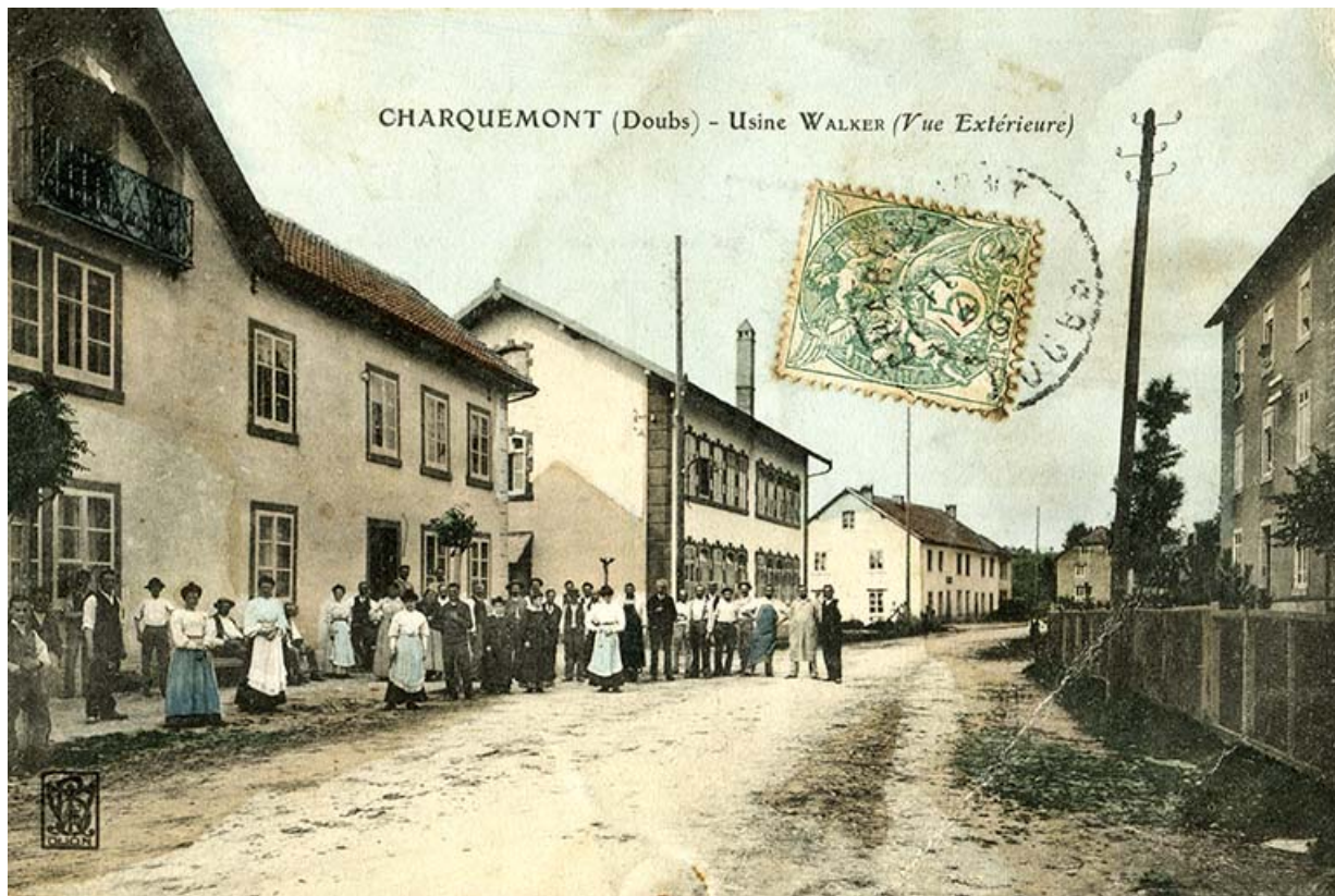
Charquemont (Doubs) - Usine Walker (vue extérieure), entre 1904 et 1907. La future usine Wasner occupe le premier plan à gauche. 25, Charquemont