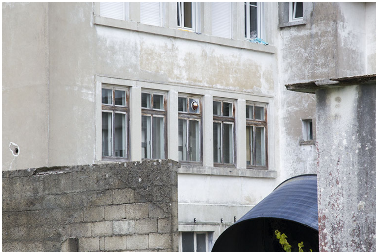
Façade postérieure : fenêtres multiples, vues de trois quarts.