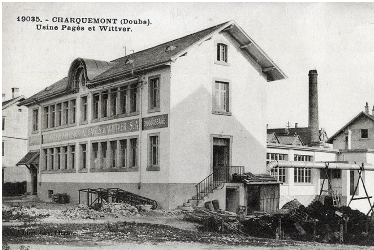
1935. - Charquemont (Doubs). Usine Pagès et Wittver, entre 1922 et 1935. 25, Charquemont, 13 rue de la Gare