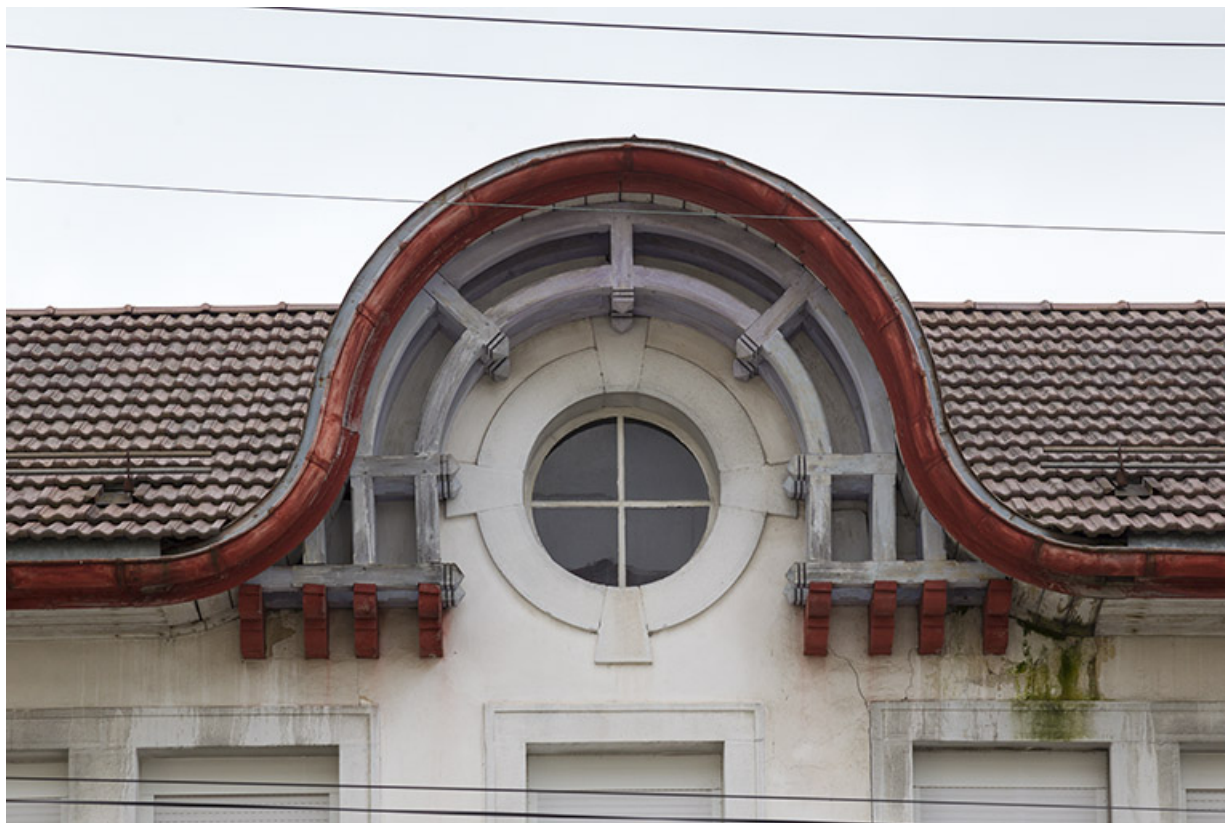
Façade antérieure : oculus éclairant le comble.