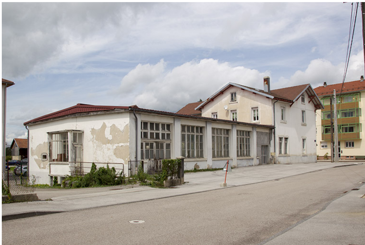
Extensions : façade sur la rue Pasteur, de trois quarts gauche.