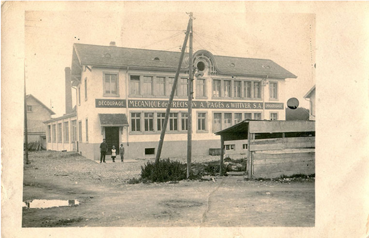
[Façade antérieure de l'usine], entre 1922 et 1935. 25, Charquemont, 13 rue de la Gare