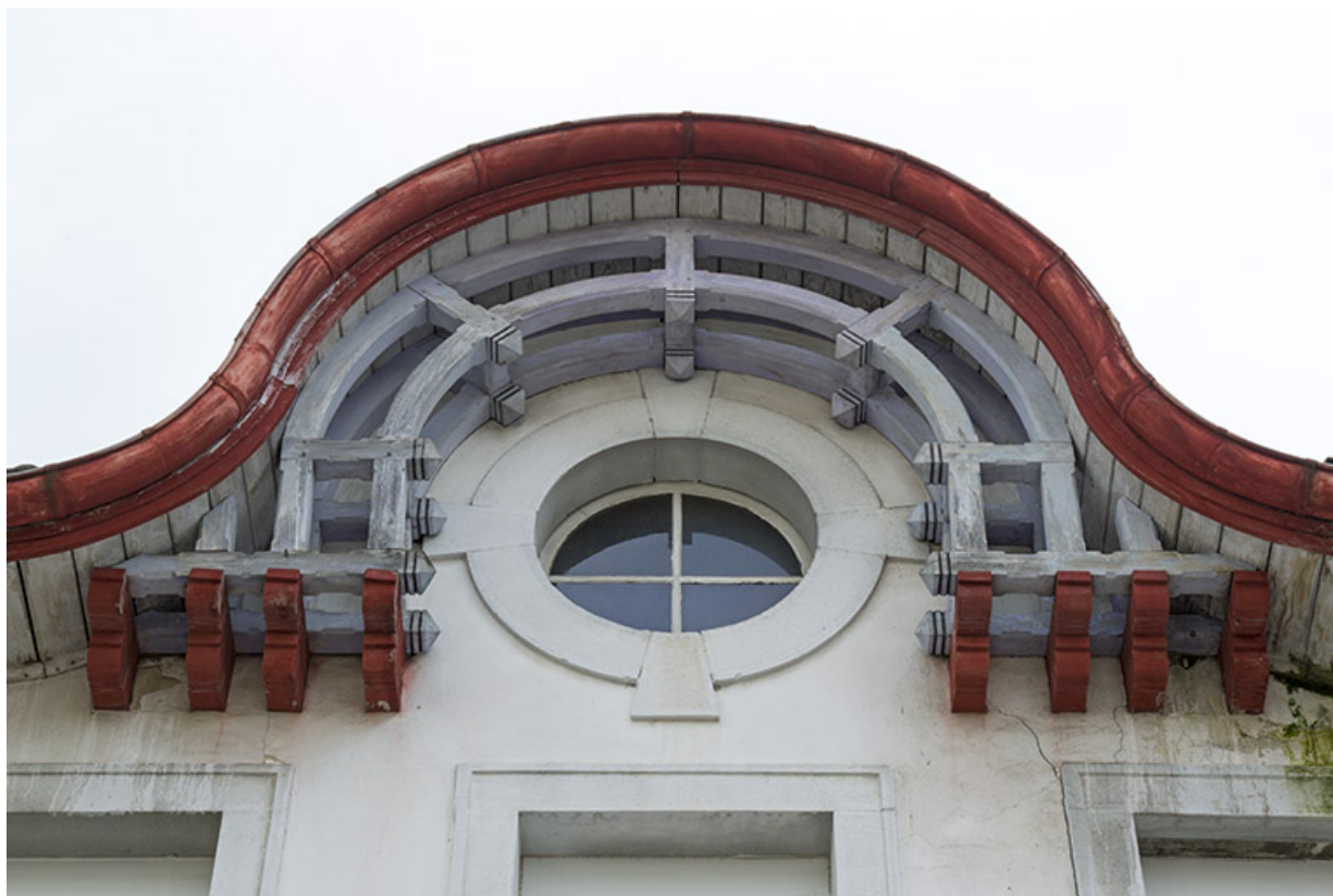
Façade antérieure : oculus vu en contre-plongée.