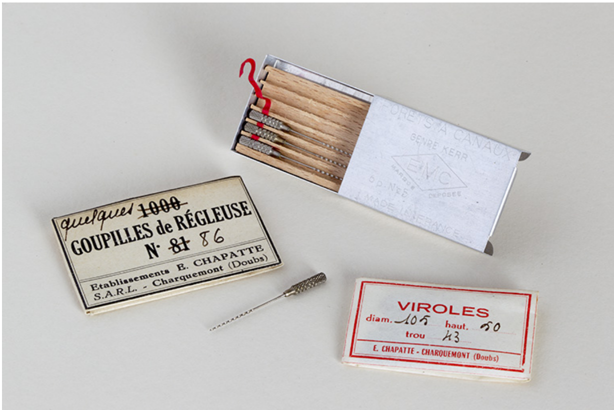
Exemples de production de la société Chapatte (collection Ets Perrenoud, rue Pierre Mendès-France). 25, Charquemont, 13 rue de la Gare