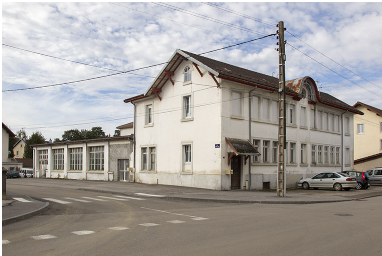
Vue d'ensemble, depuis le nord-est (façades antérieure et latérale gauche). 25, Charquemont, 13 rue de la Gare