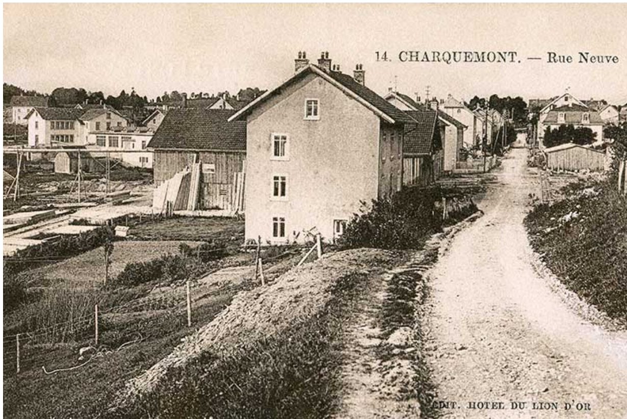
14. Charquemont. - Rue Neuve [vers la scierie], 2e quart 20e siècle 25, Charquemont, 16 Rue Neuve