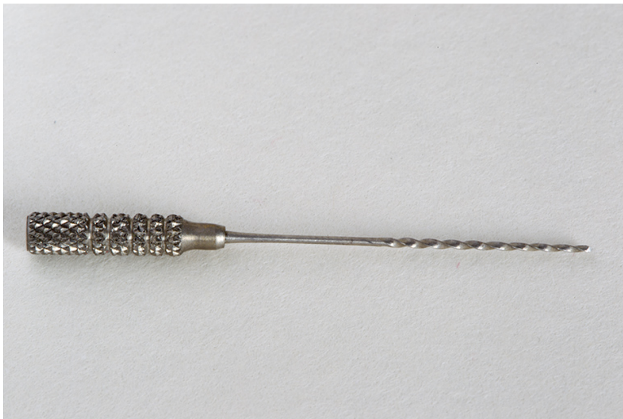
Foret à canaux de la société Chapatte (collection Ets Perrenoud, rue Pierre Mendès-France). 25, Charquemont, 13 rue de la Gare