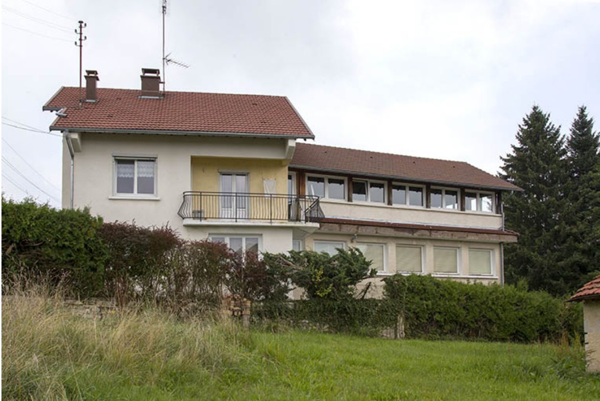
Maison et atelier de Jean Morel (au n° 2) : vue d'ensemble depuis le sud-ouest.

25, Charquemont, 2 et 4 rue de la 1ère Armée