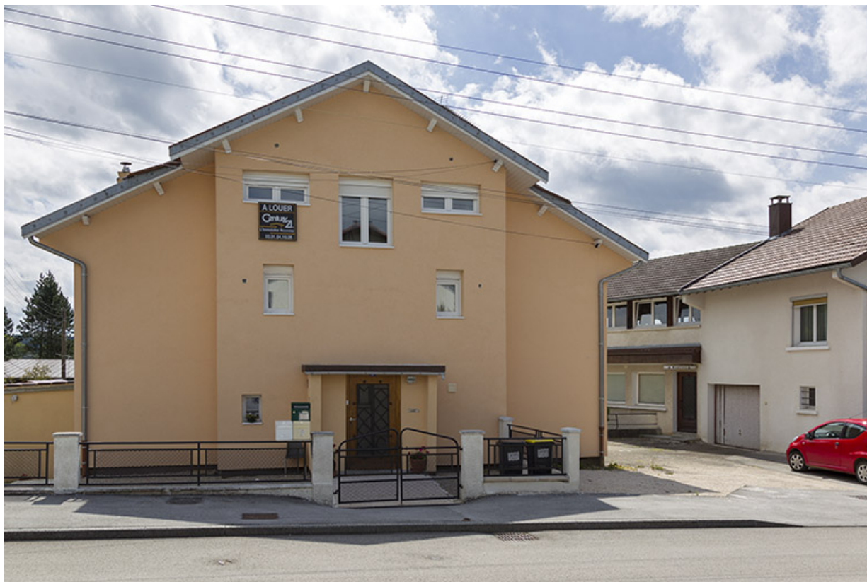
Maison et atelier de Marc Morel (au n° 4) : façade antérieure.

25, Charquemont, 2 et 4 rue de la 1ère Armée