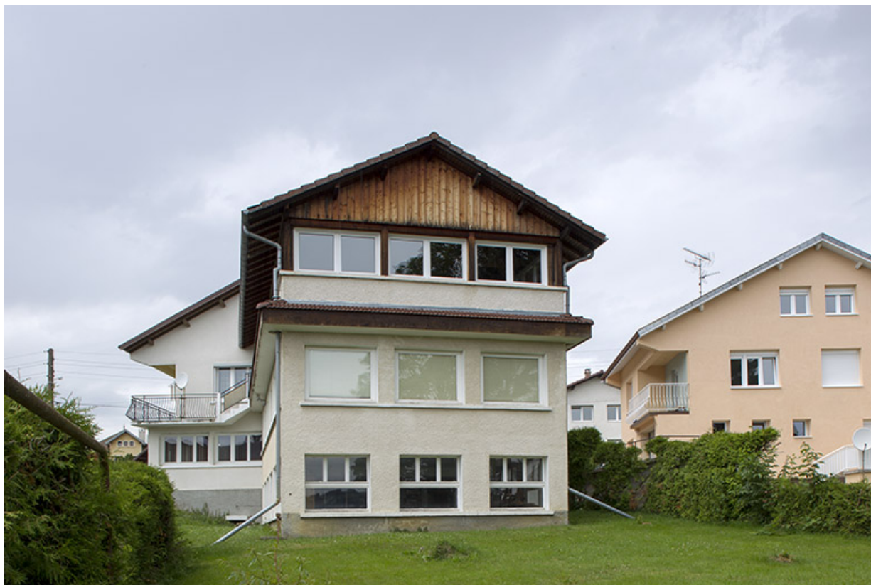
Maison et atelier de Jean Morel (au n° 2) : façade latérale gauche de l'atelier. 25, Charquemont, 2 et 4 rue de la 1ère Armée