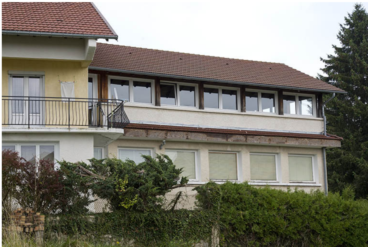
Maison et atelier de Jean Morel (au n° 2) : façade postérieure de l'atelier.

25, Charquemont, 2 et 4 rue de la 1ère Armée