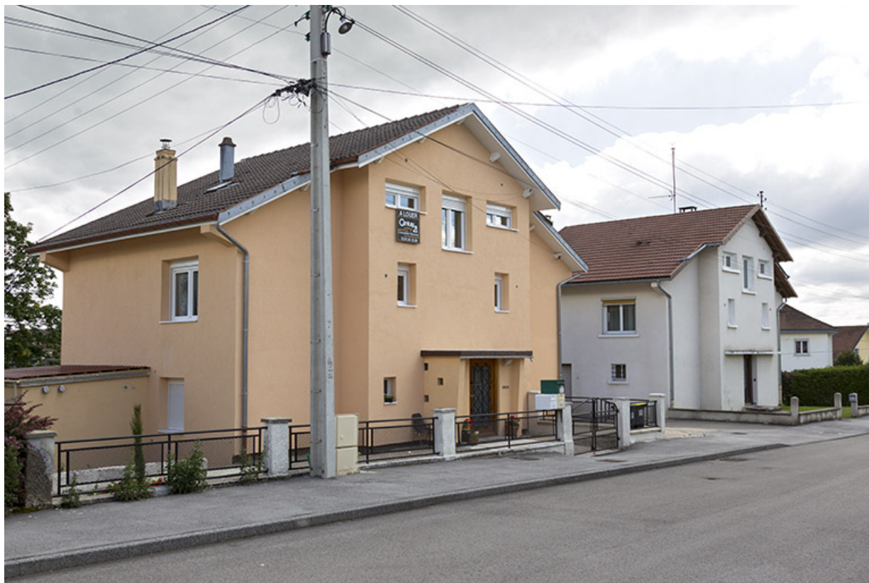
Vue d'ensemble des deux maisons, depuis le nord.

25, Charquemont, 2 et 4 rue de la 1ère Armée