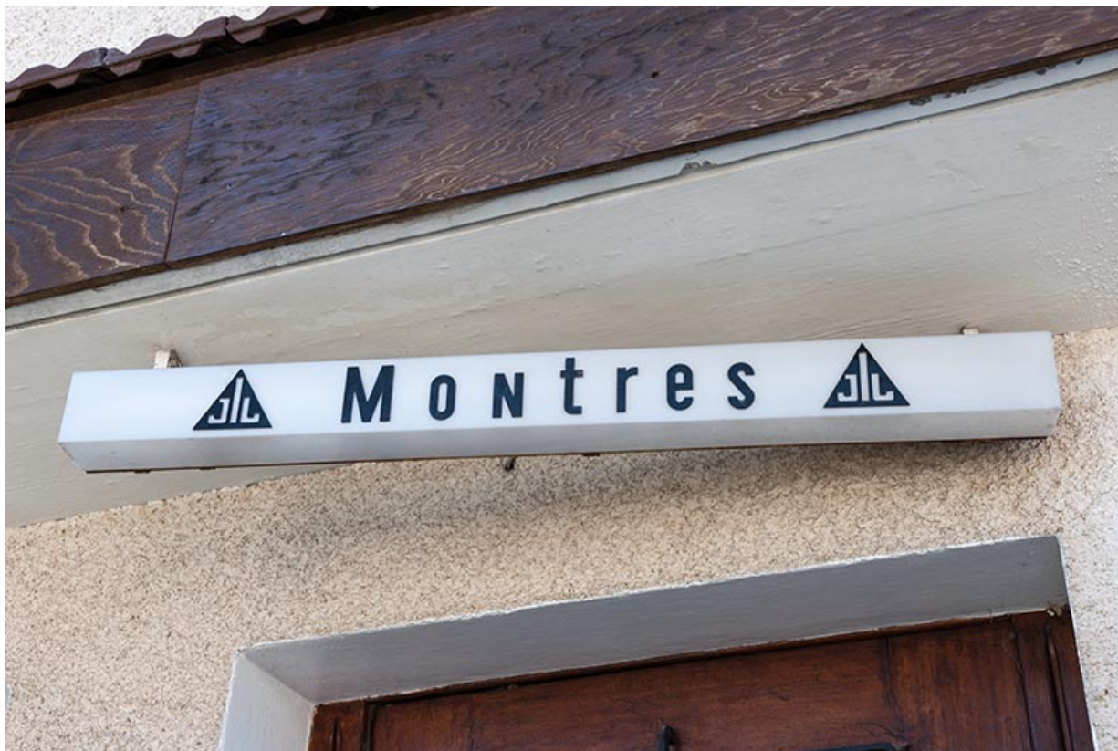
Maison et atelier de Jean Morel (au n° 2) : enseigne à la marque Jil. 25, Charquemont, 2 et 4 rue de la 1ère Armée