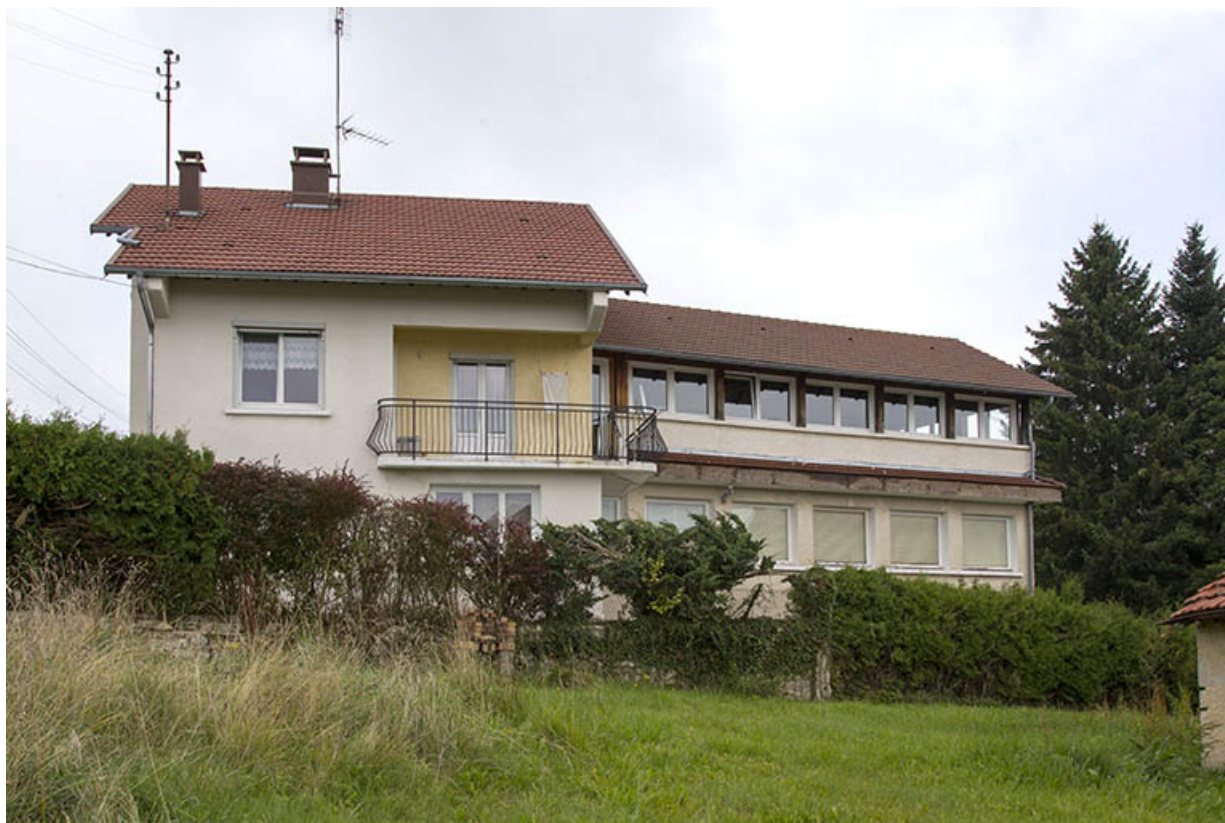
Maison et atelier de Jean Morel (au n° 2) : vue d'ensemble depuis le sud-ouest.

25, Charquemont, 2 et 4 rue de la 1ère Armée