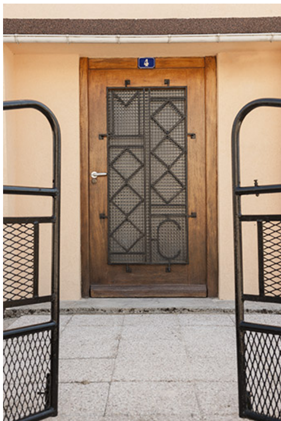
Maison et atelier de Marc Morel (au n° 4) : monogramme ornant l'entrée.

25, Charquemont, 2 et 4 rue de la 1ère Armée