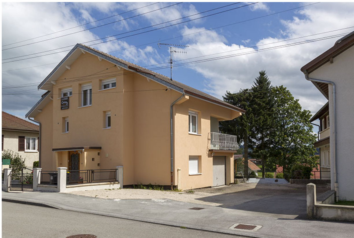
Maison et atelier de Marc Morel (au n° 4) : vue d'ensemble, depuis l'ouest.

25, Charquemont, 2 et 4 rue de la 1ère Armée