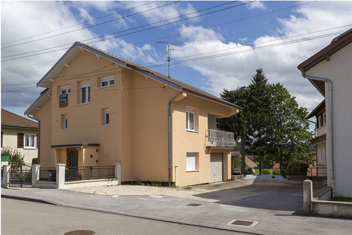
Maison et atelier de Marc Morel (au n° 4) : vue d'ensemble, depuis l'ouest.

25, Charquemont, 2 et 4 rue de la 1ère Armée