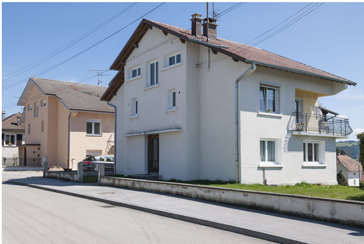
Deux maisons de 1957 avec leur atelier d'horlogerie : Jean et Marc Morel (2-4 rue de la 1ère Armée). 25, Charquemont, 2 et 4 rue de la 1ère Armée