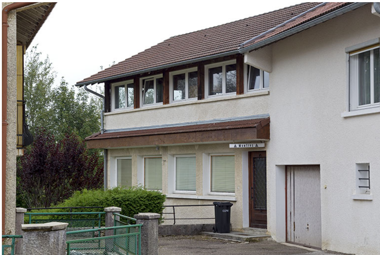
Maison et atelier de Jean Morel (au n° 2) : façade antérieure de l'atelier. 25, Charquemont, 2 et 4 rue de la 1ère Armée