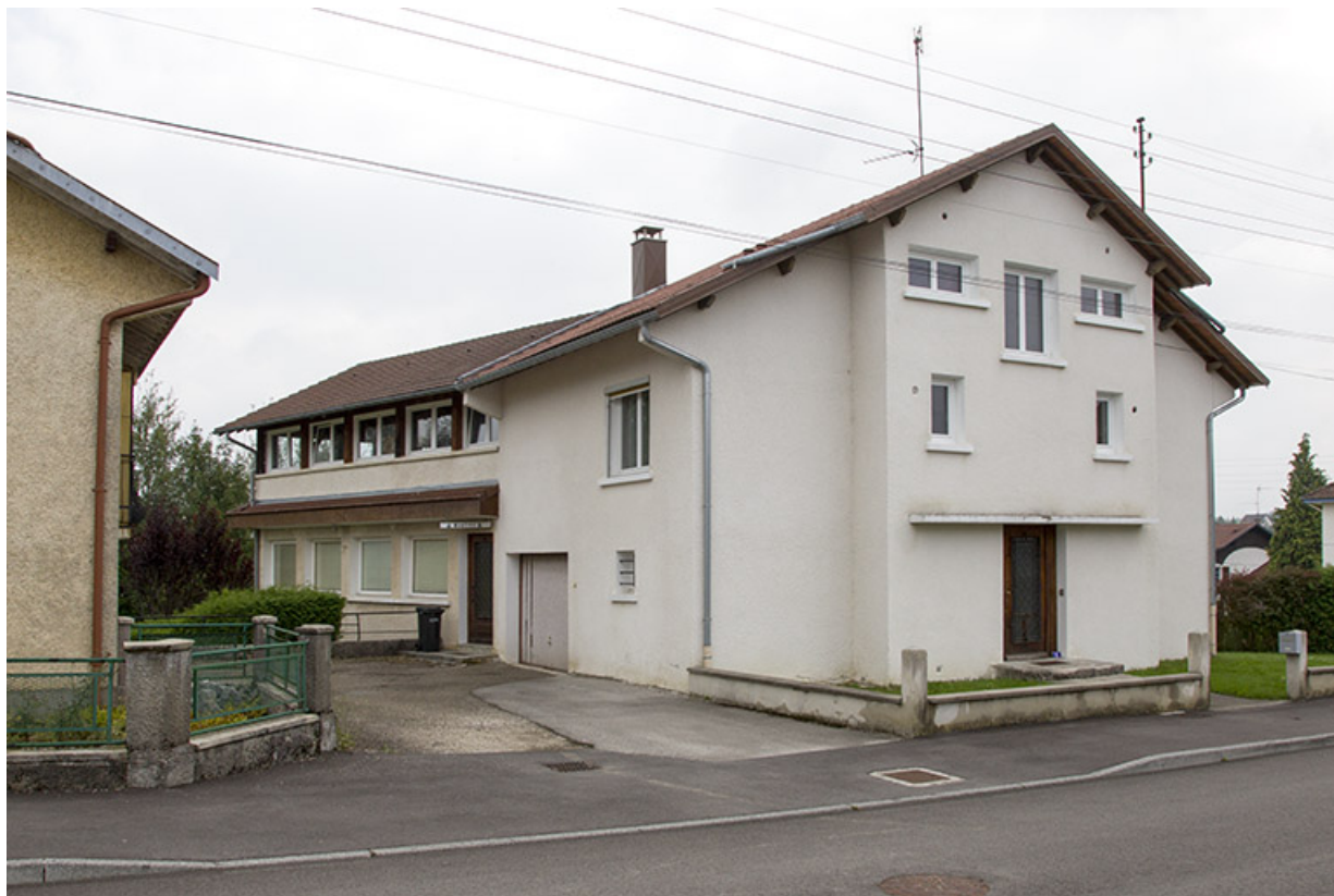
Maison et atelier de Jean Morel (au n° 2) : vue d'ensemble, depuis le nord.

25, Charquemont, 2 et 4 rue de la 1ère Armée