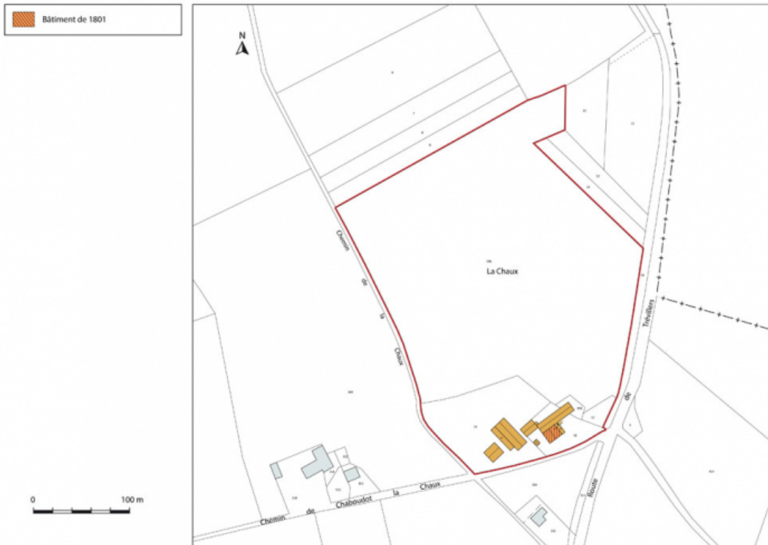
Plan de situation. Extrait du plan cadastral, 2014, section A. 25, Damprichard, lieudit : la Chaux