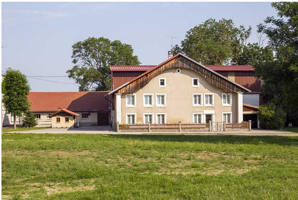
Bâtiment 19e siècle, étable et fenil des années 1960-1970.