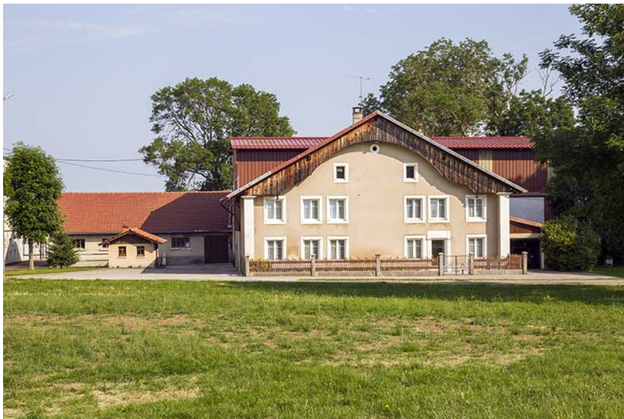
Bâtiment 19e siècle, étable et fenil des années 1960-1970.