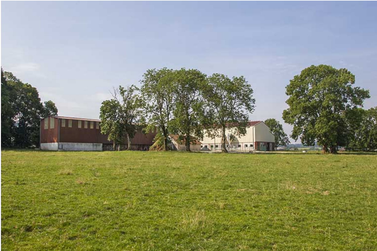
Vue d'ensemble, depuis le nord.