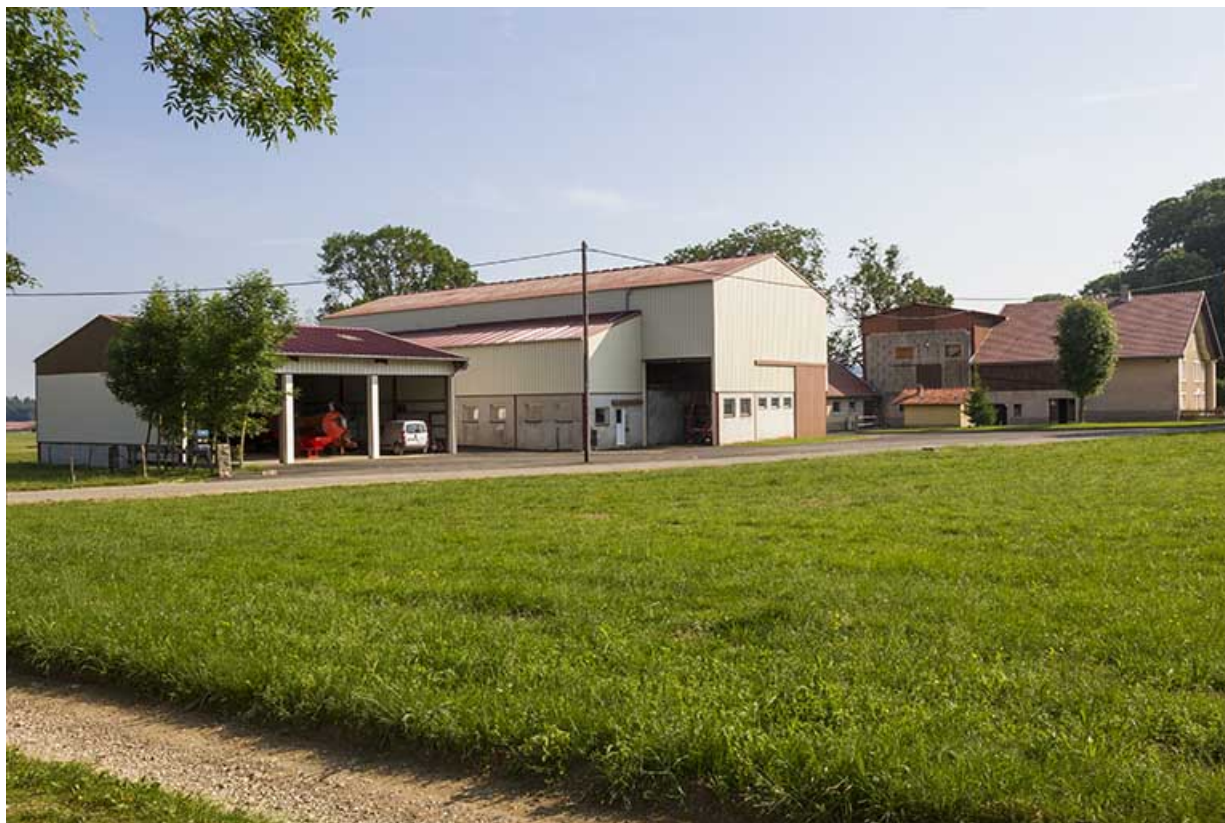
Vue d'ensemble, depuis le sud-ouest.