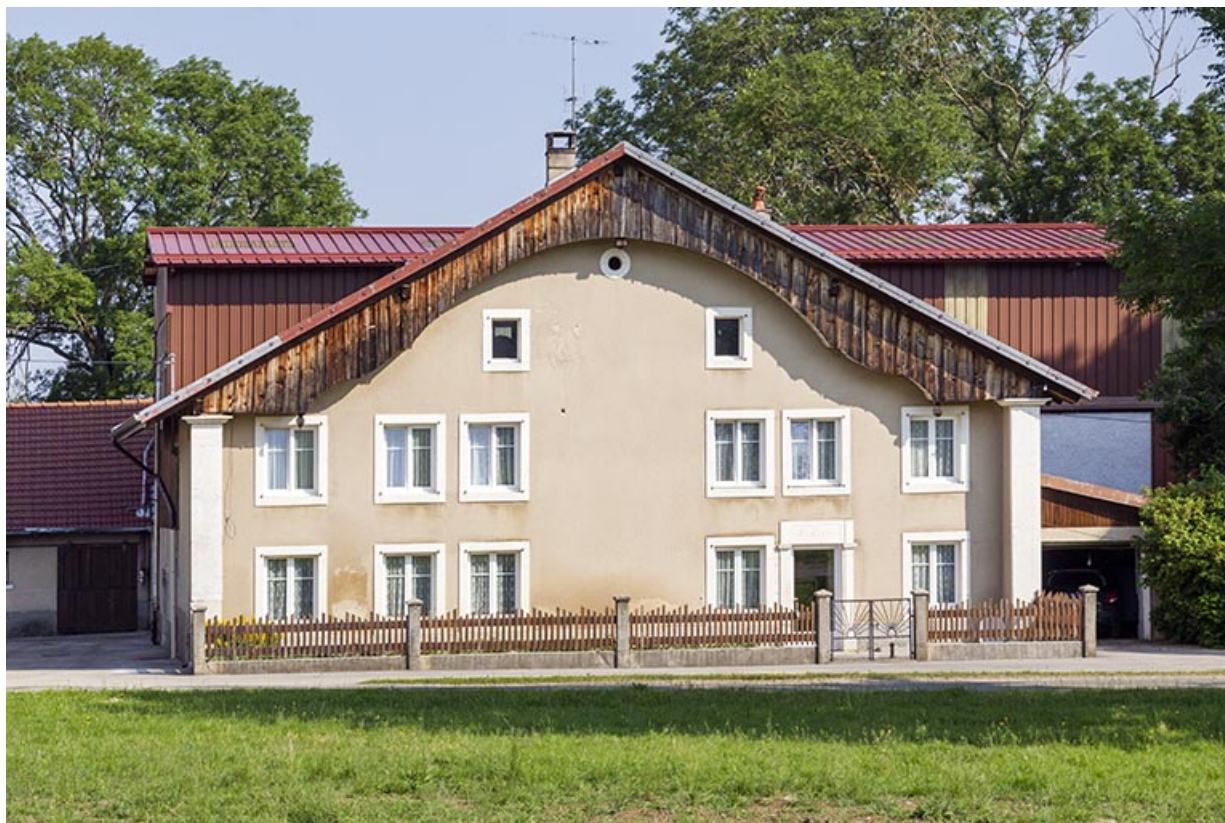
Bâtiment 19e siècle, vu de face.