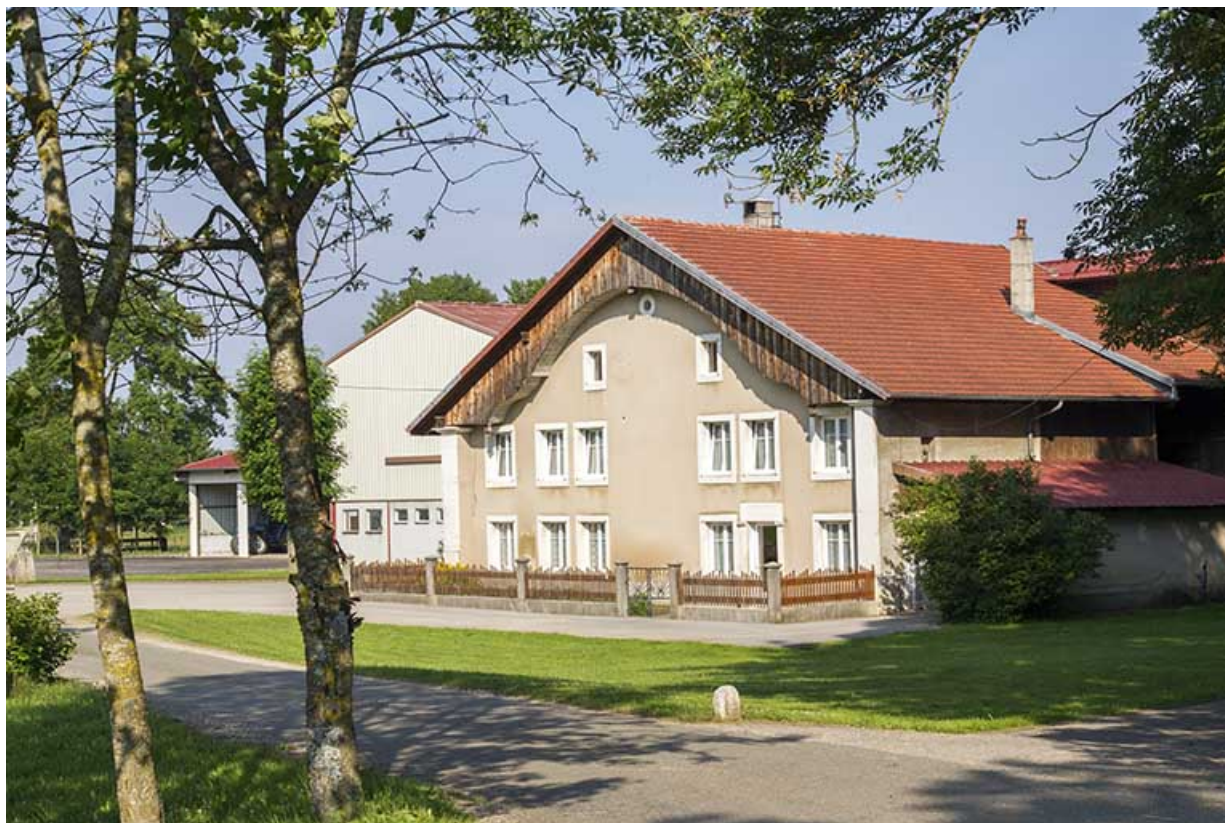
Etable des années 1990 et bâtiment 19e siècle, de trois quarts droite.