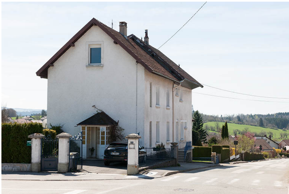
Vue d'ensemble, depuis le nord.