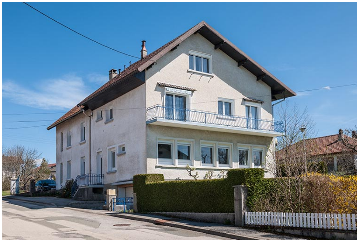
Façade antérieure, de trois quarts droite. Bâtiment d'origine à gauche, extension à droite (montrant les fenêtres horlogères de l'atelier).