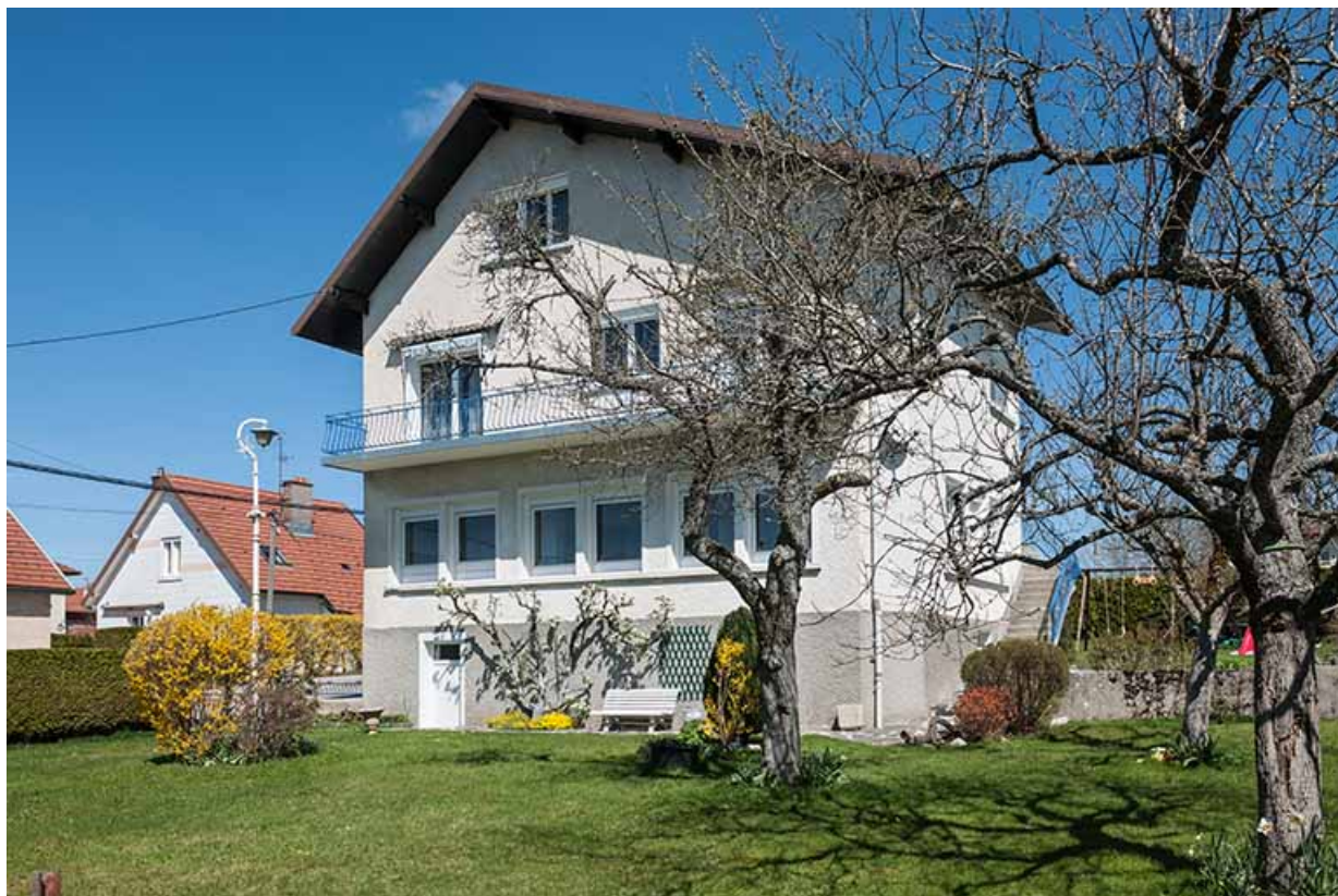
Face latérale gauche de l'extension (dont l'atelier se signale par ses fenêtres horlogères).