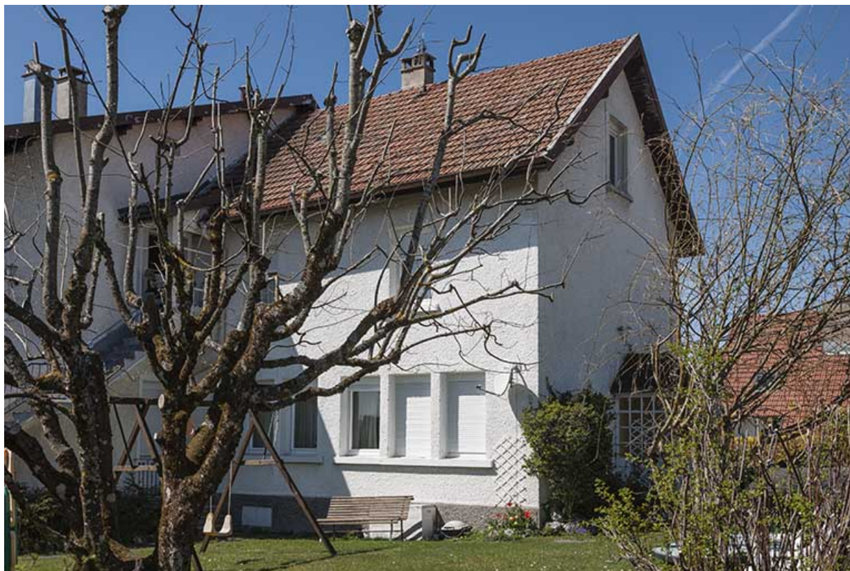
Façade postérieure du bâtiment d'origine (ouverte de fenêtres multiples), de trois quarts droite. 25, Charquemont, 21 rue Victor Hugo