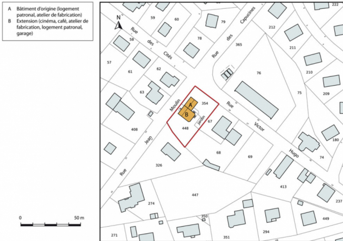
Plan-masse et de situation. Extrait du plan cadastral, 2015, section AB. 25, Charquemont, 21 rue Victor Hugo