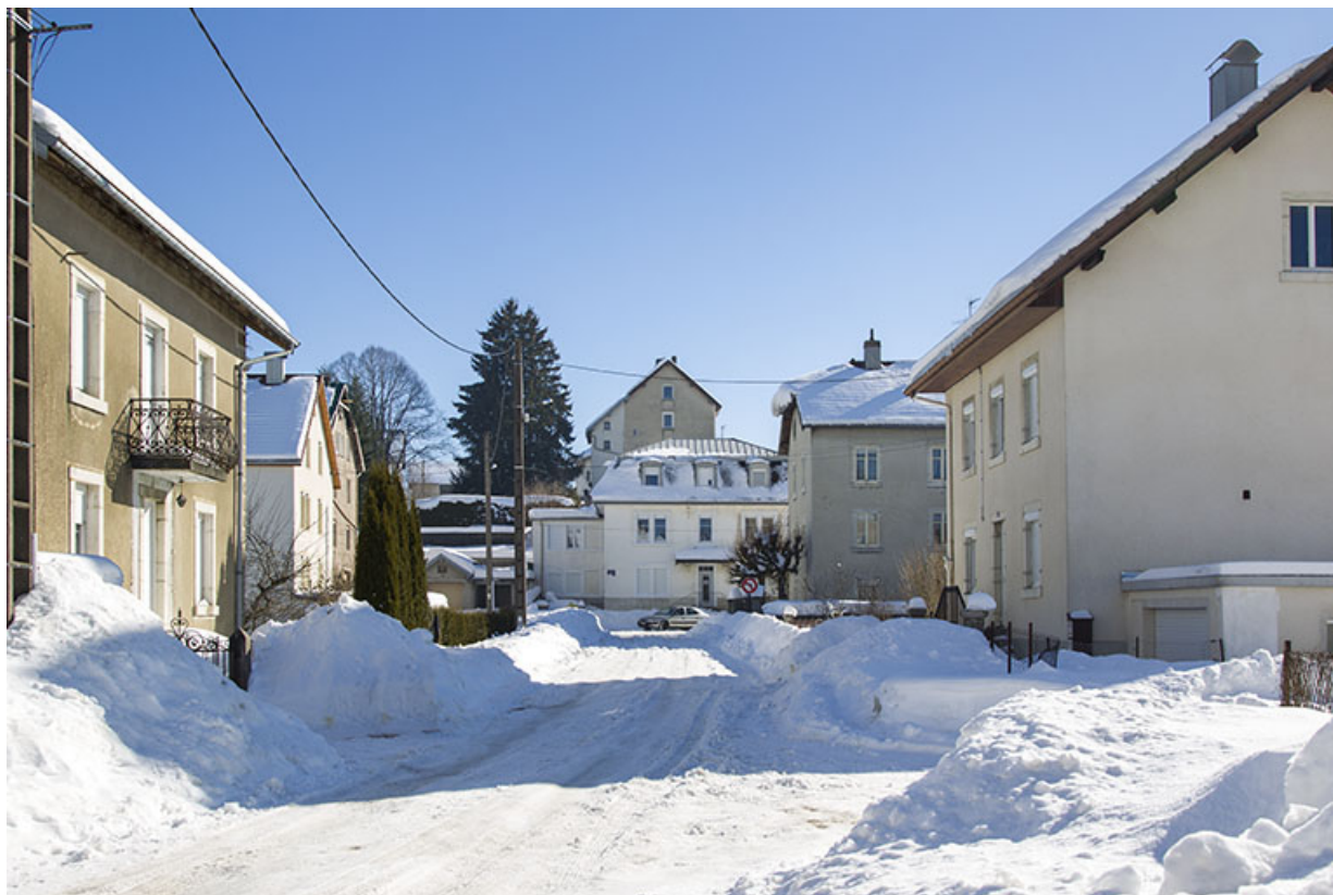
Vue d'ensemble en hiver, depuis la rue Pasteur.