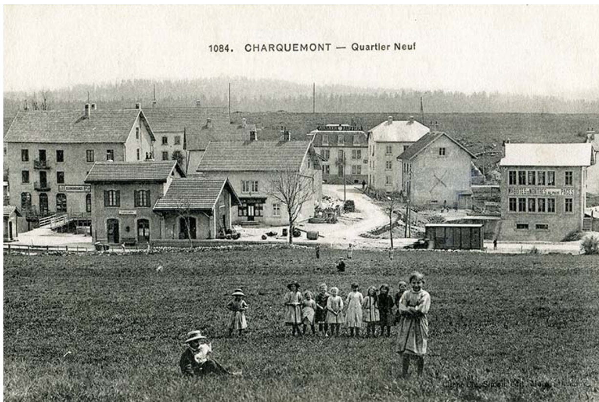
1084. Charquemont - Quartier Neuf, 1er quart 20e siècle 25, Charquemont, 13 rue de la Gare