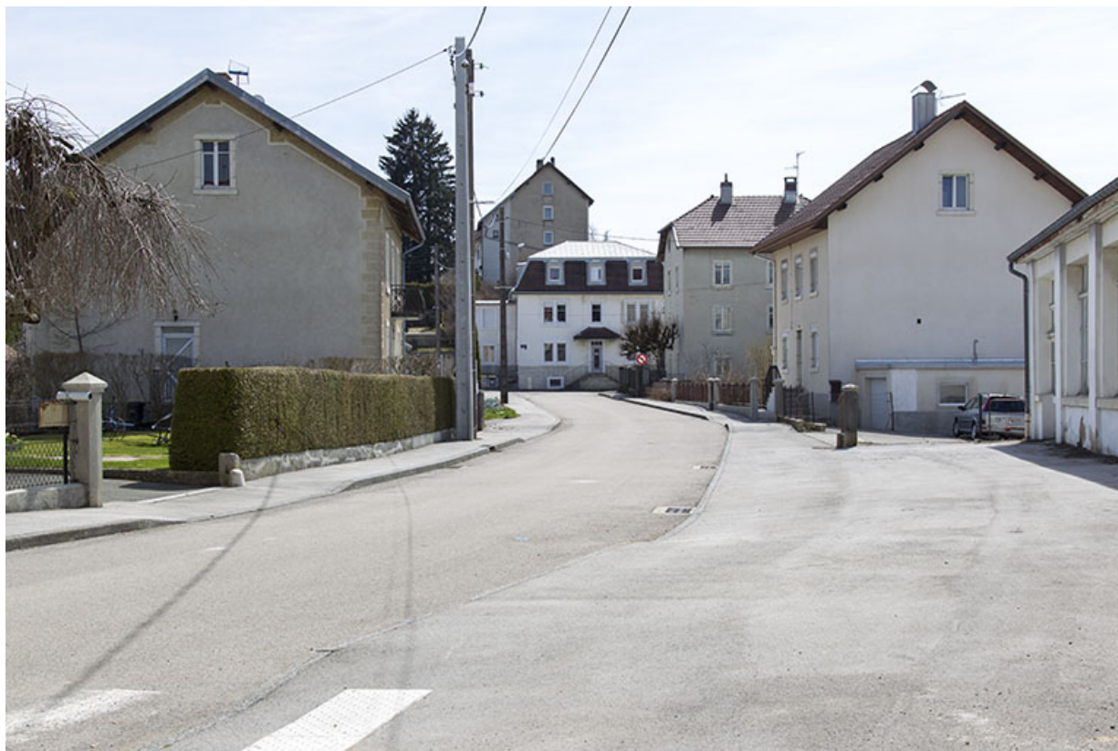
Vue d'ensemble de la rue Pasteur. Le bâtiment est visible à l'extrémité de la rue.