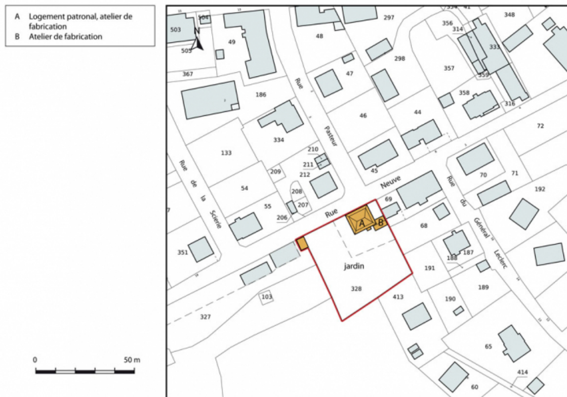
Plan-masse et de situation. Extrait du plan cadastral, 2015, section AI. 25, Charquemont, 7 Rue Neuve