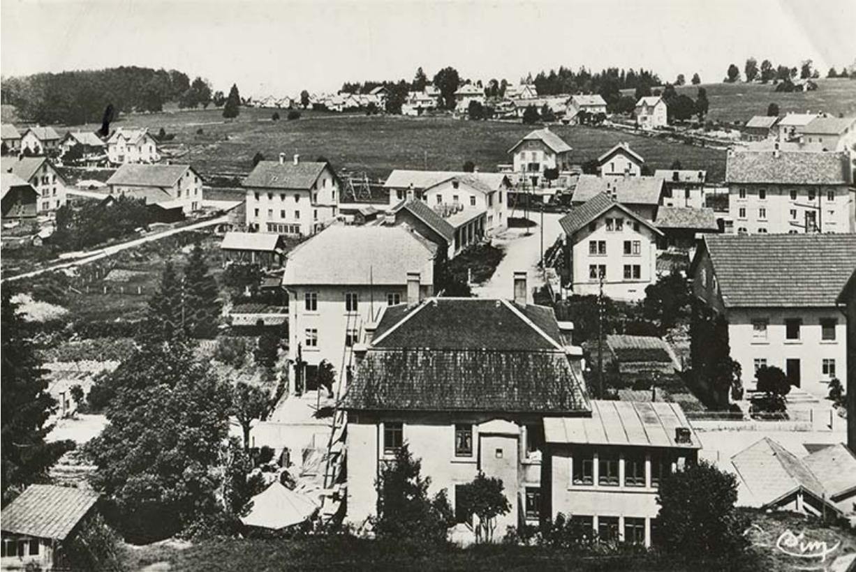
Charquemont (Doubs). Quartier de la Gare et les Cités [vus depuis l'arrière de l'usine Wasner], 2e quart 20e siècle 25, Charquemont, 13 rue de la Gare