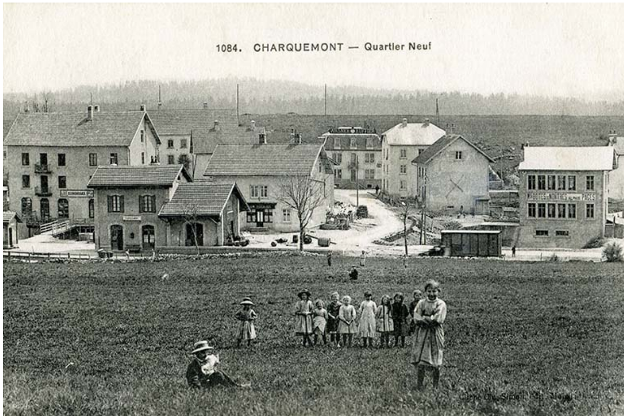
1084. Charquemont - Quartier Neuf, 1er quart 20e siècle 25, Charquemont, 13 rue de la Gare