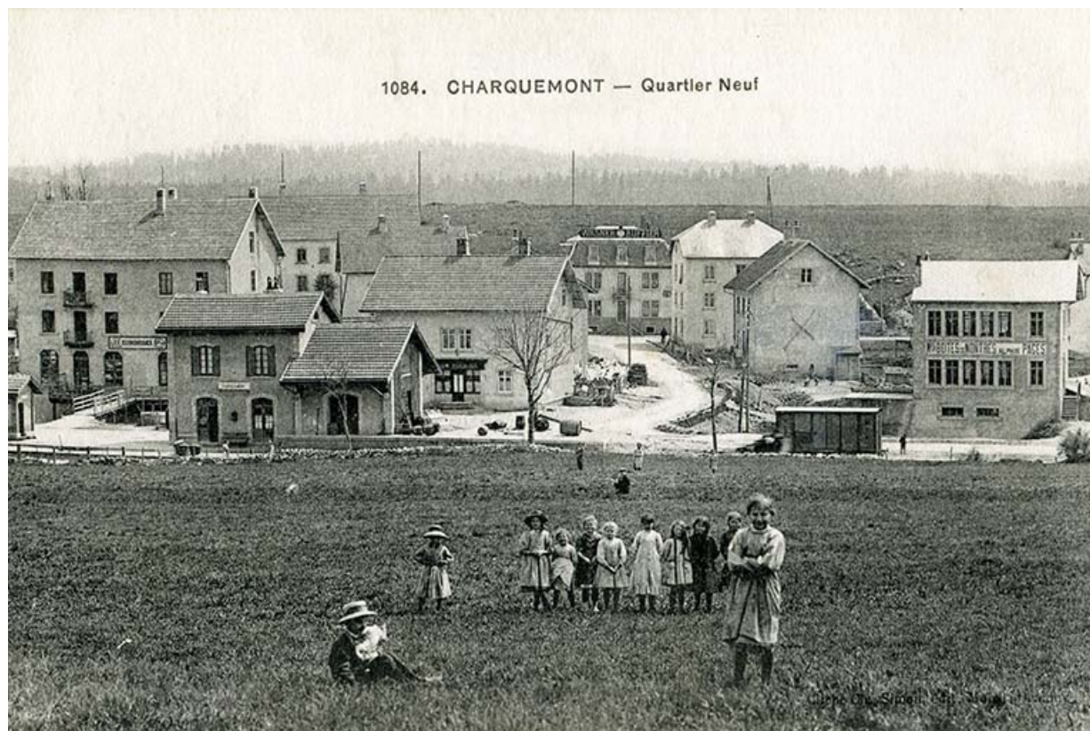
1084. Charquemont - Quartier Neuf, 1er quart 20e siècle 25, Charquemont, 13 rue de la Gare