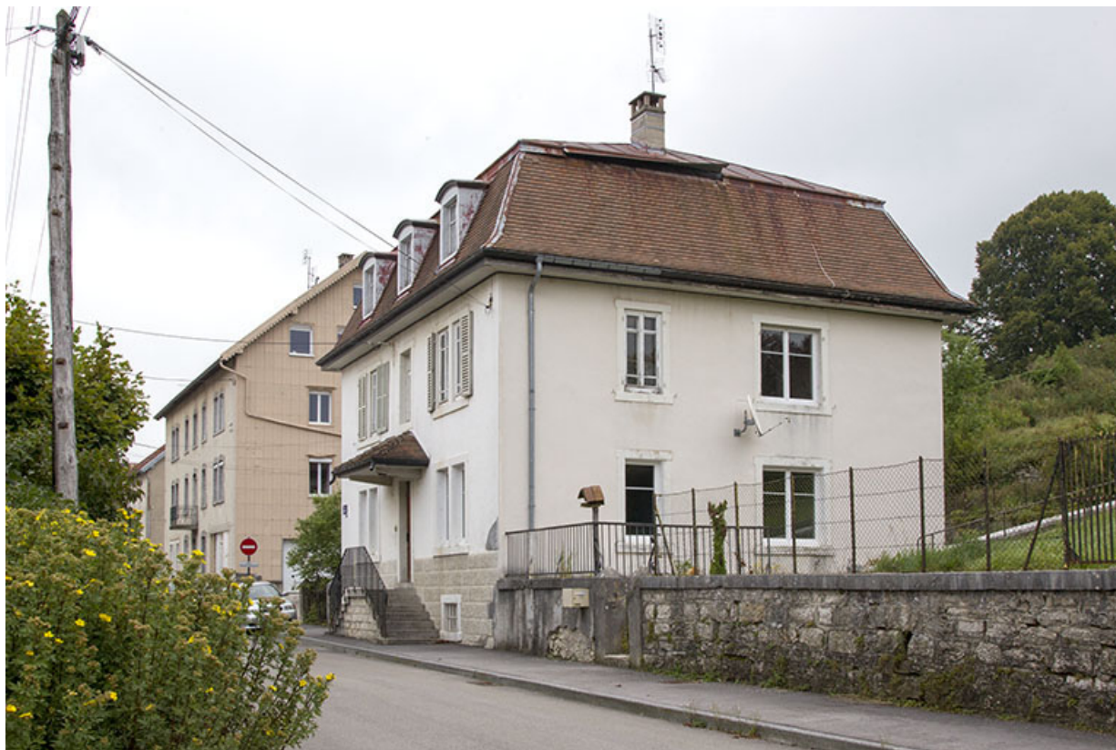
Façades antérieure et latérale droite.