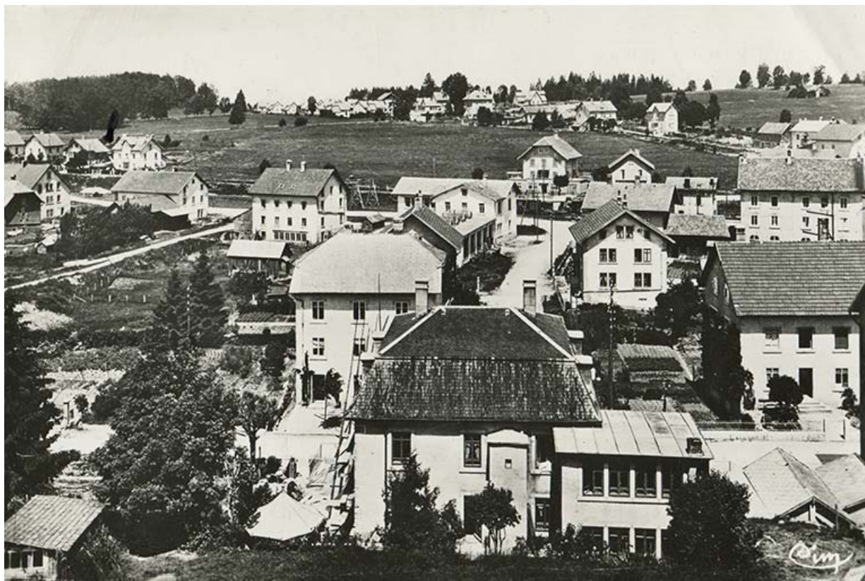
Charquemont (Doubs). Quartier de la Gare et les Cités [vus depuis l'arrière de l'usine Wasner], 2e quart 20e siècle 25, Charquemont, 13 rue de la Gare