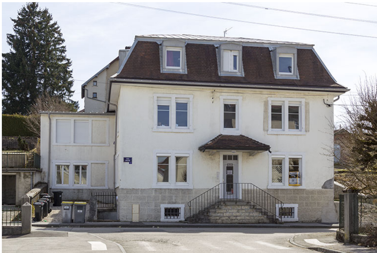
Façade antérieure. 25, Charquemont