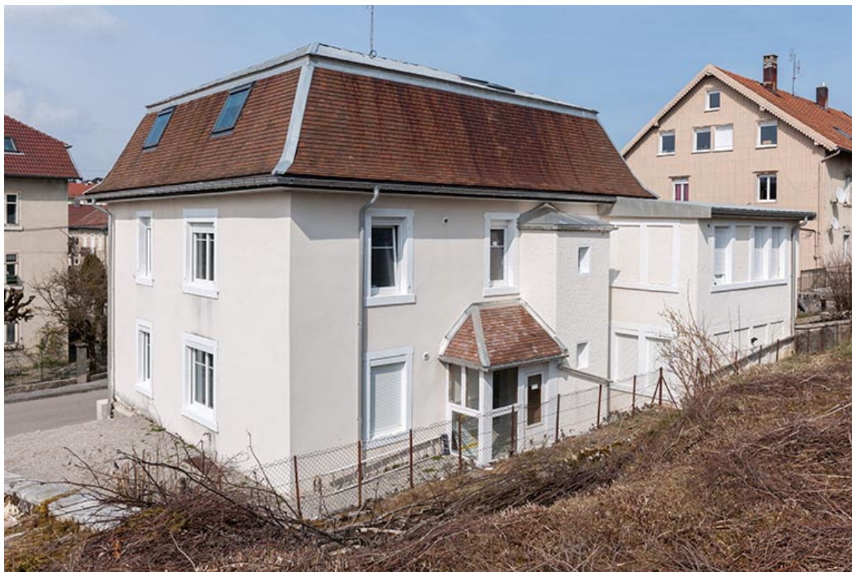
Façades postérieure et latérale droite. Atelier de fabrication à droite.