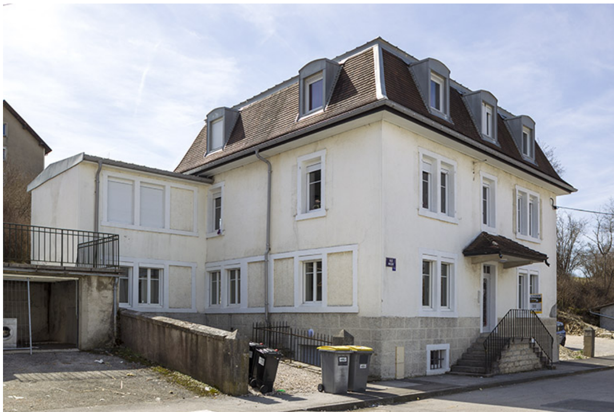
Façades antérieure et latérale gauche. Atelier de fabrication à gauche. 25, Charquemont, 7 Rue Neuve