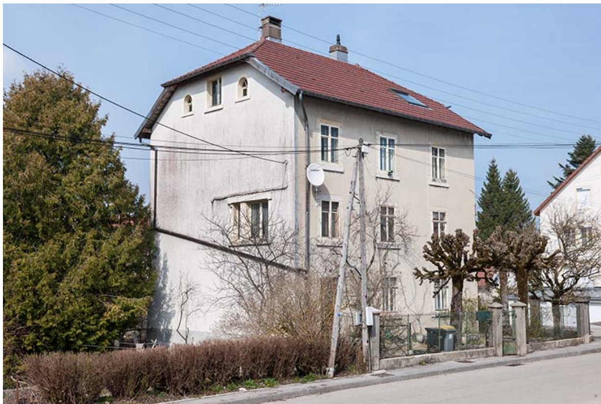
Façade antérieure, de trois quarts gauche.