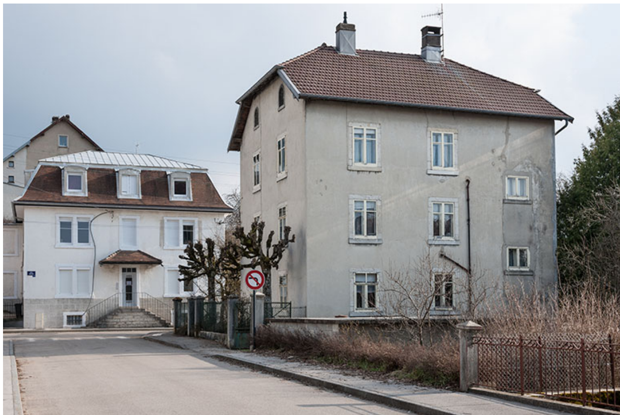
Vue d'ensemble depuis le nord (façade postérieure). A gauche, l'ancienne usine Wasner-Ruffier. 25, Charquemont, 12 Rue Neuve