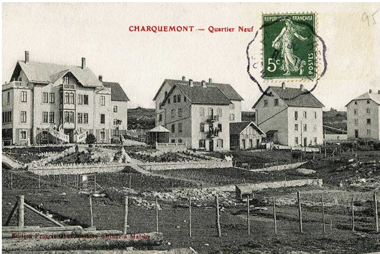
La Rue Neuve (rue des horlogers), avec de gauche à droite les ateliers de l'Union ouvrière (n° 6), Gigandet-Bernard (n° 8), Erard (n° 10) et Donzé (n° 12) : Charquemont - Quartier Neuf, entre 1903 et 1918 ?