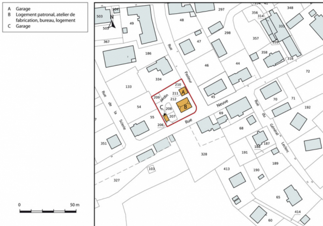
Plan-masse et de situation. Extrait du plan cadastral, 2015, section AI. 25, Charquemont, 12 Rue Neuve