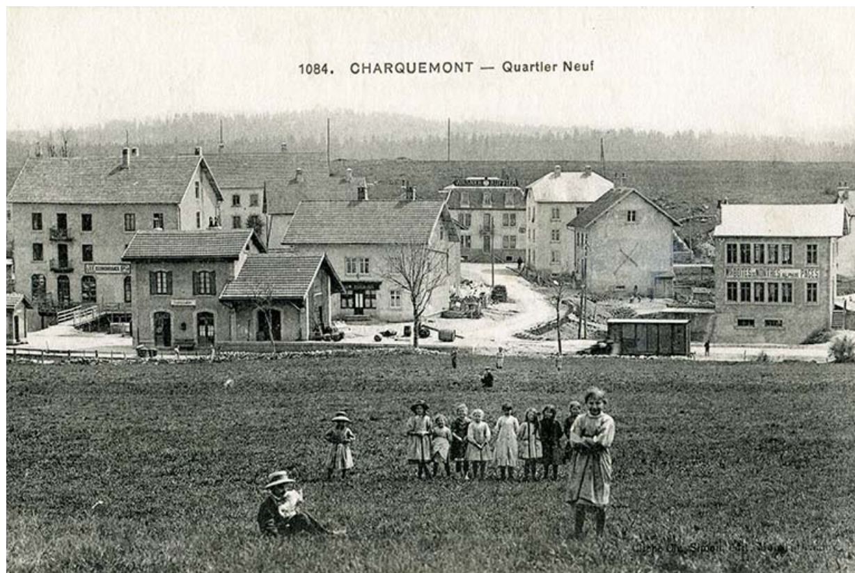
1084. Charquemont - Quartier Neuf, 1er quart 20e siècle 25, Charquemont, 13 rue de la Gare