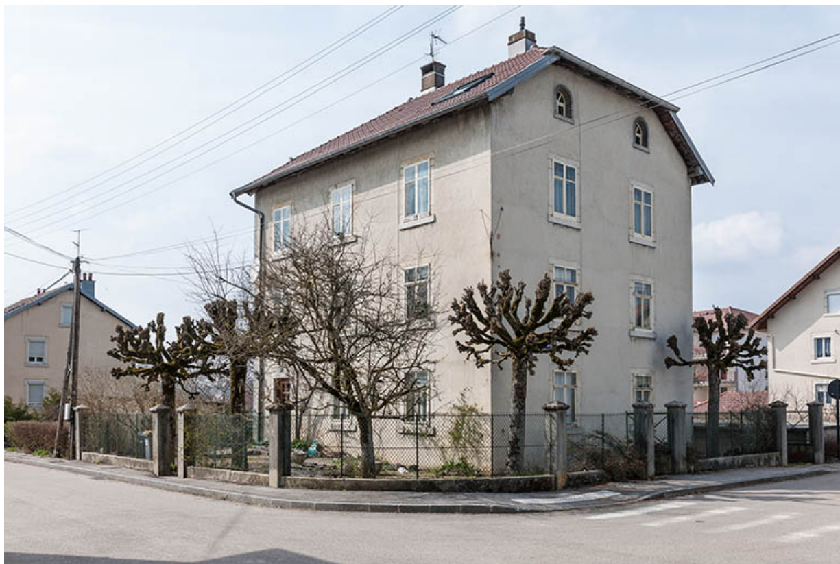
Façade antérieure, de trois quarts droite.