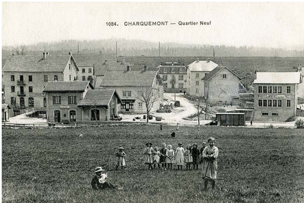
1084. Charquemont - Quartier Neuf, 1er quart 20e siècle 25, Charquemont, 13 rue de la Gare