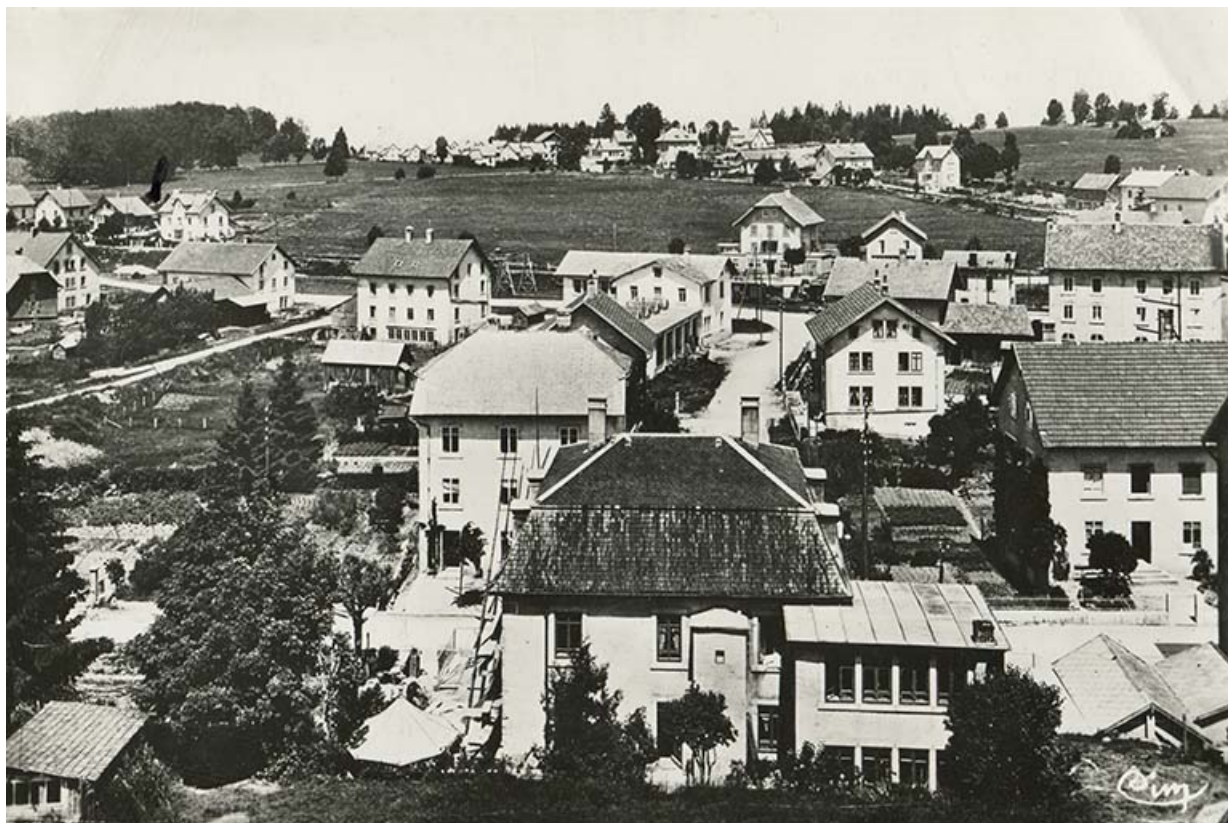
Charquemont (Doubs). Quartier de la Gare et les Cités [vus depuis l'arrière de l'usine Wasner], 2e quart 20e siècle 25, Charquemont, 13 rue de la Gare