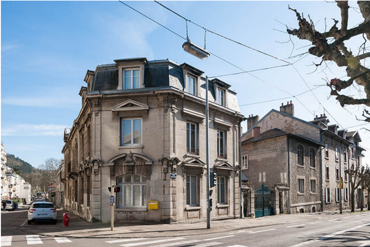
Bâtiment de l'administration : façade sur l'avenue Denfert-Rochereau, depuis le nord.

25, Besançon, 1 ter et 3 rue Victor Delavelle