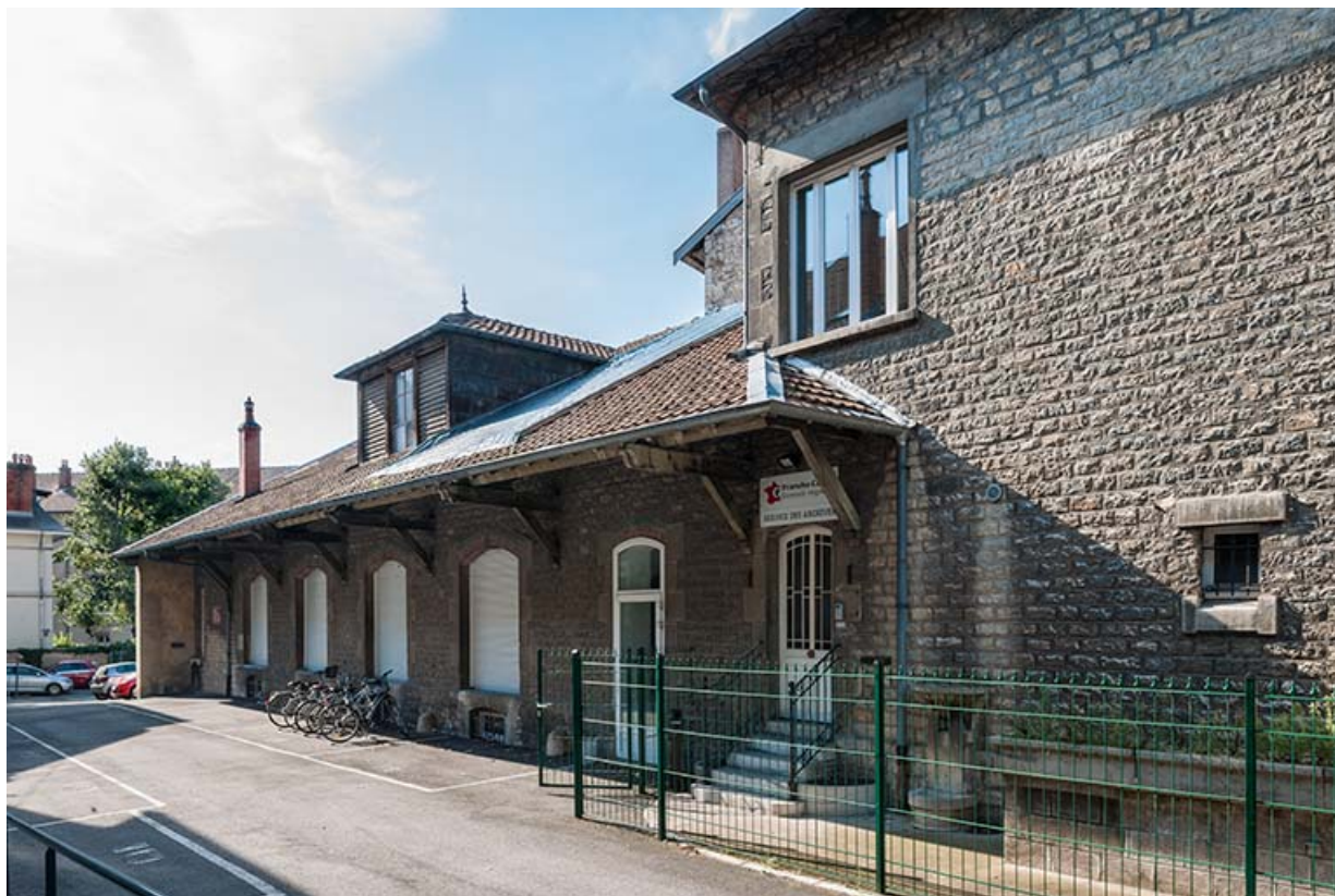
L'entrepôt avant sa surélévation en 2003 : façade antérieure de trois quarts droite.

25, Besançon, 1 ter et 3 rue Victor Delavelle