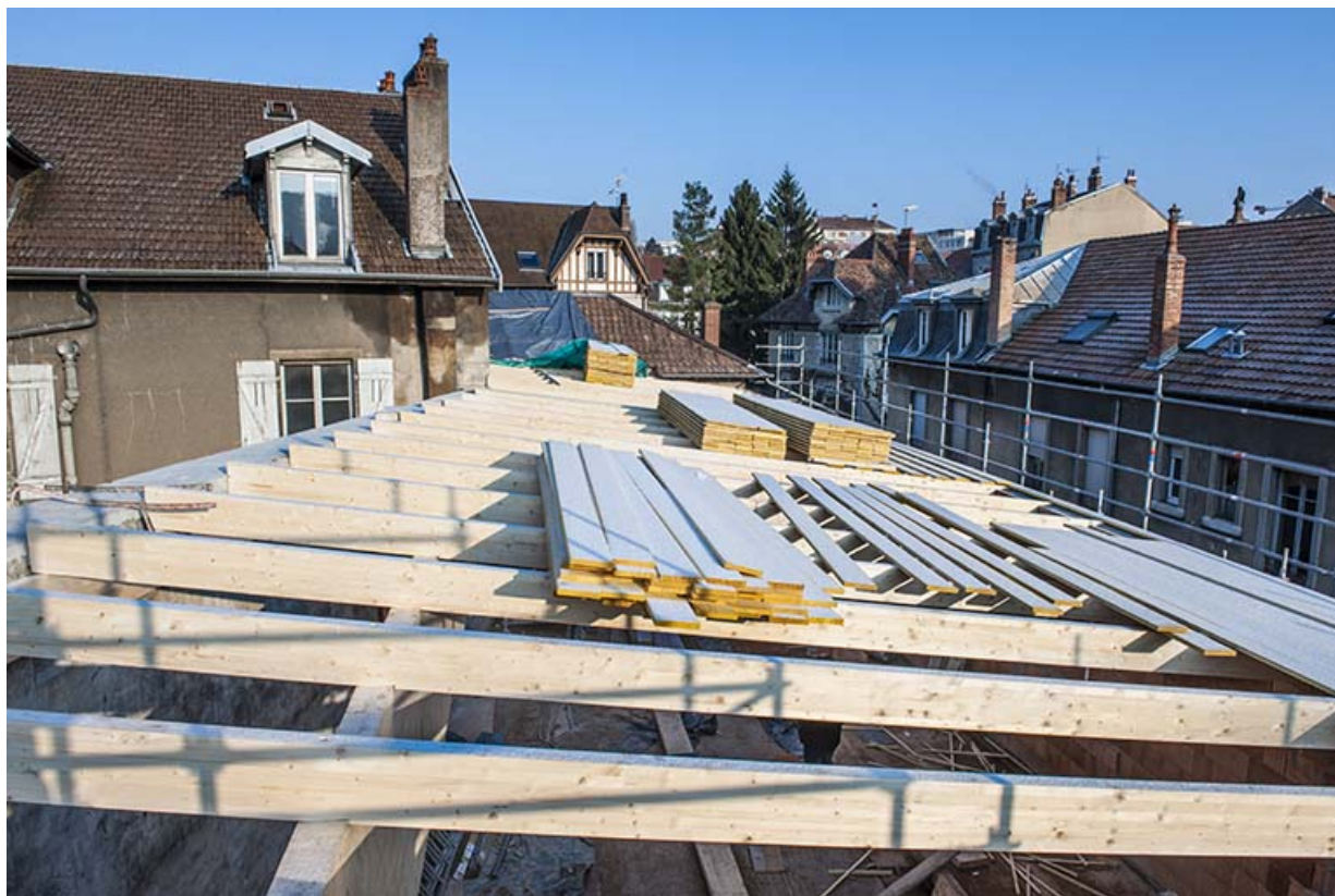
L'entrepôt en cours de surélévation en 2003 : la charpente.

25, Besançon, 1 ter et 3 rue Victor Delavelle