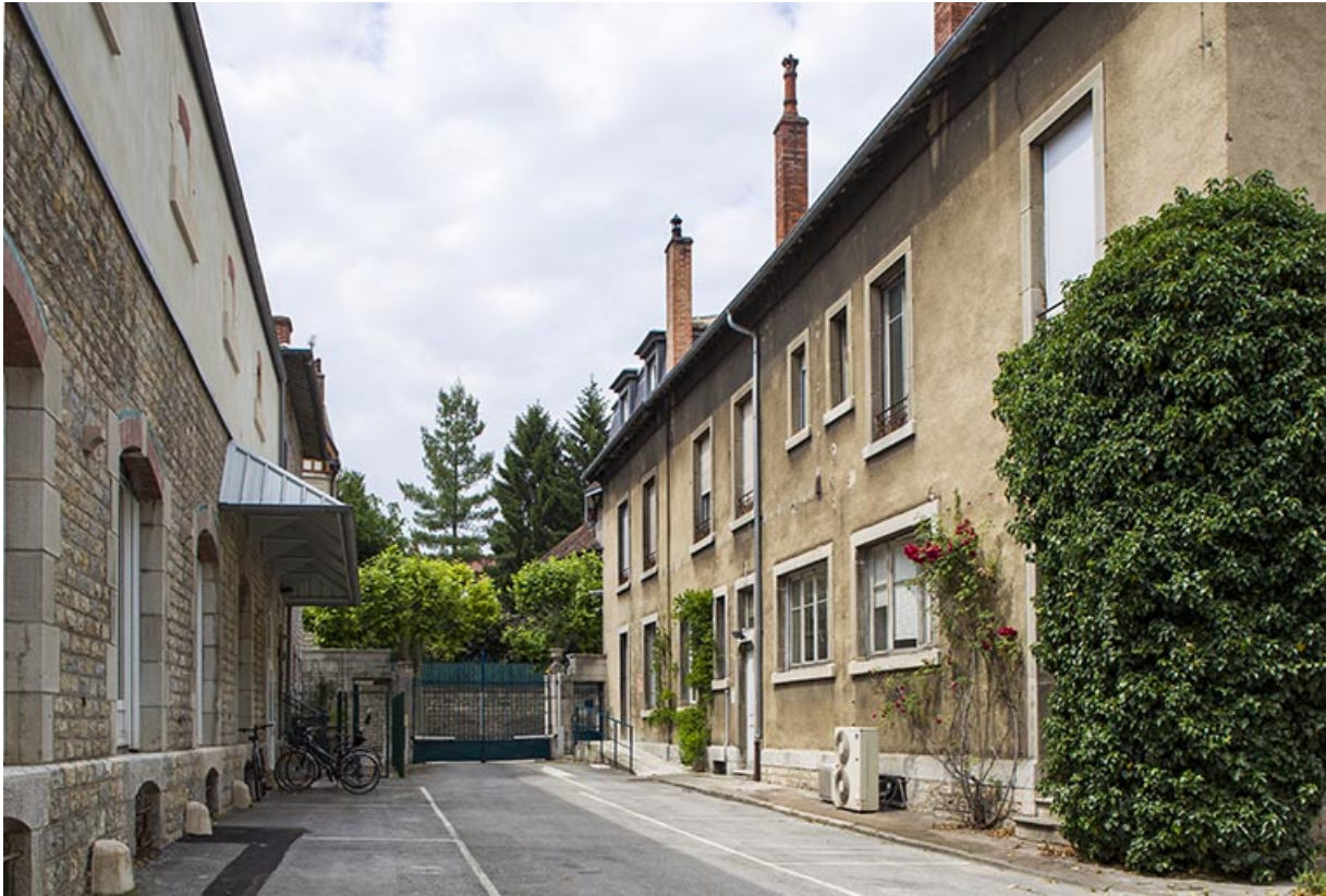
Cour entre le bâtiment de l'administration et l'entrepôt.

25, Besançon, 1 ter et 3 rue Victor Delavelle