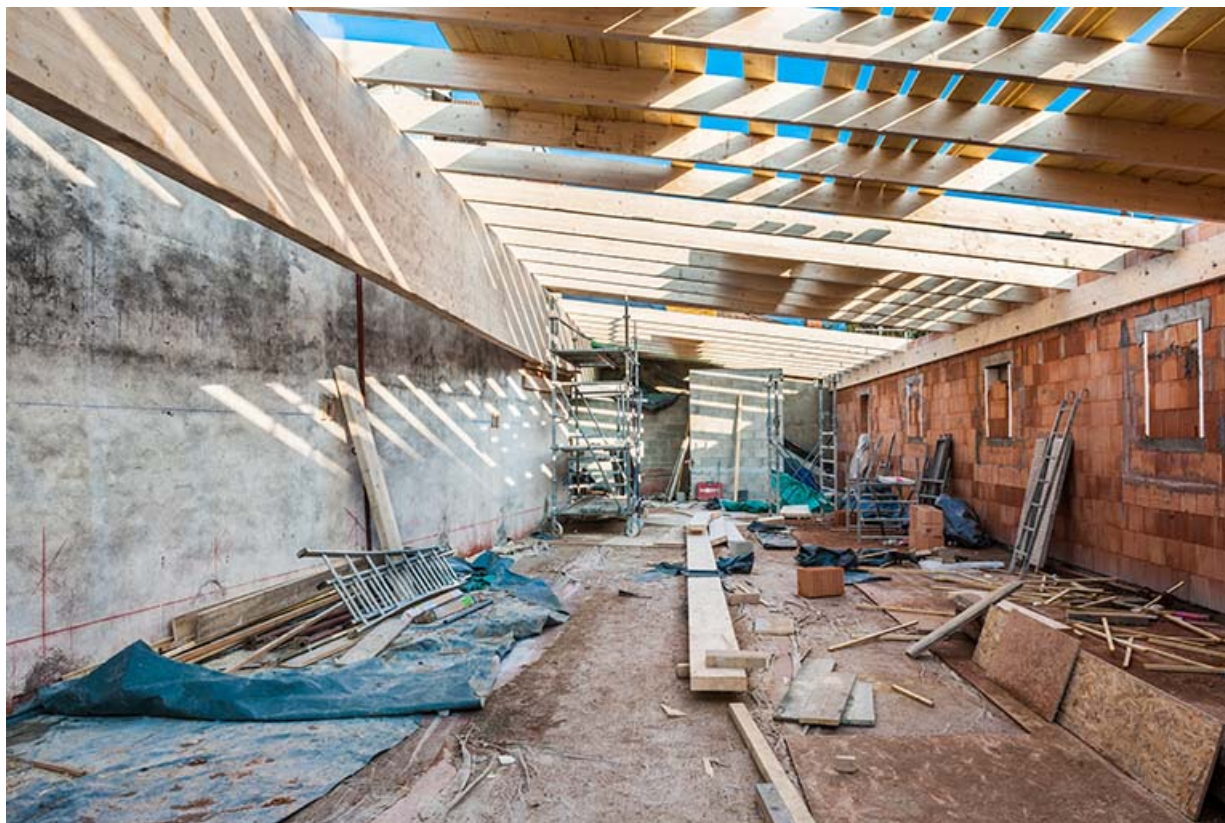
L'entrepôt en cours de surélévation en 2003 : intérieur de l'étage en surcroît depuis le fond.

25, Besançon, 1 ter et 3 rue Victor Delavelle