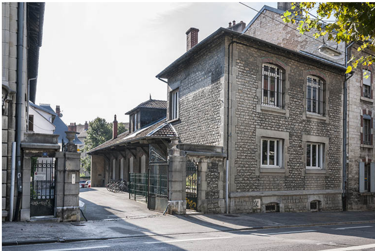
L'entrepôt avant sa surélévation en 2003 : vue d'ensemble depuis l'avenue Denfert-Rochereau.

25, Besançon, 1 ter et 3 rue Victor Delavelle