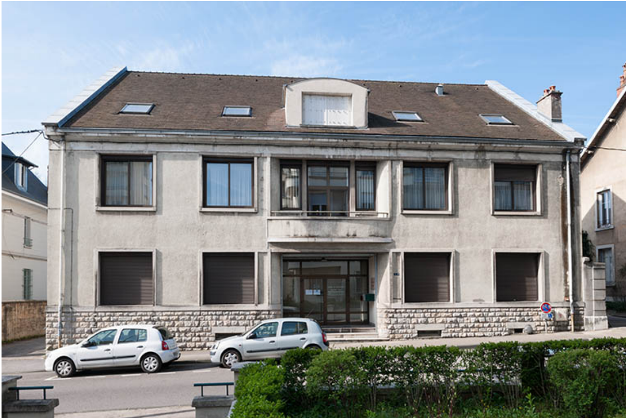
Siège de la Caisse régionale de Crédit agricole : façade antérieure (côté rue Delavelle).

25, Besançon, 1 ter et 3 rue Victor Delavelle