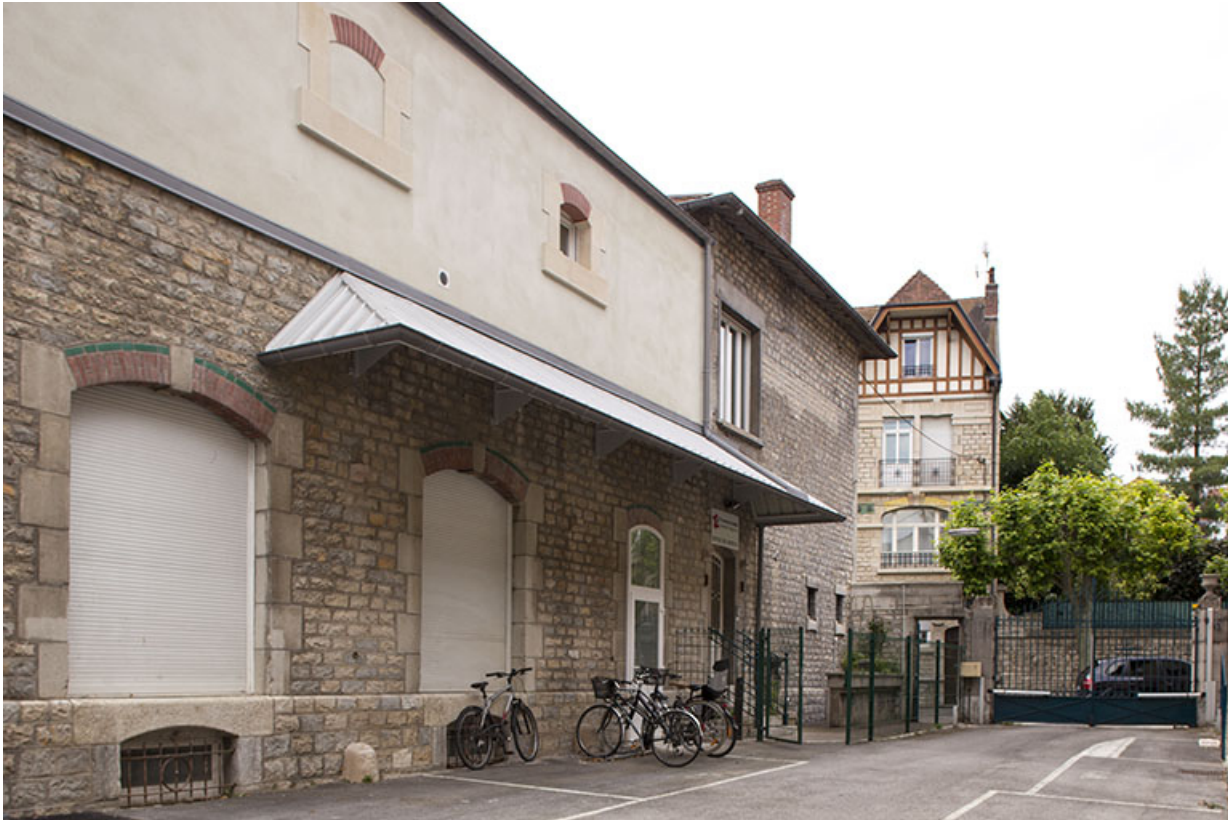
Entrepôt : façade antérieure de trois quarts gauche.

25, Besançon, 1 ter et 3 rue Victor Delavelle