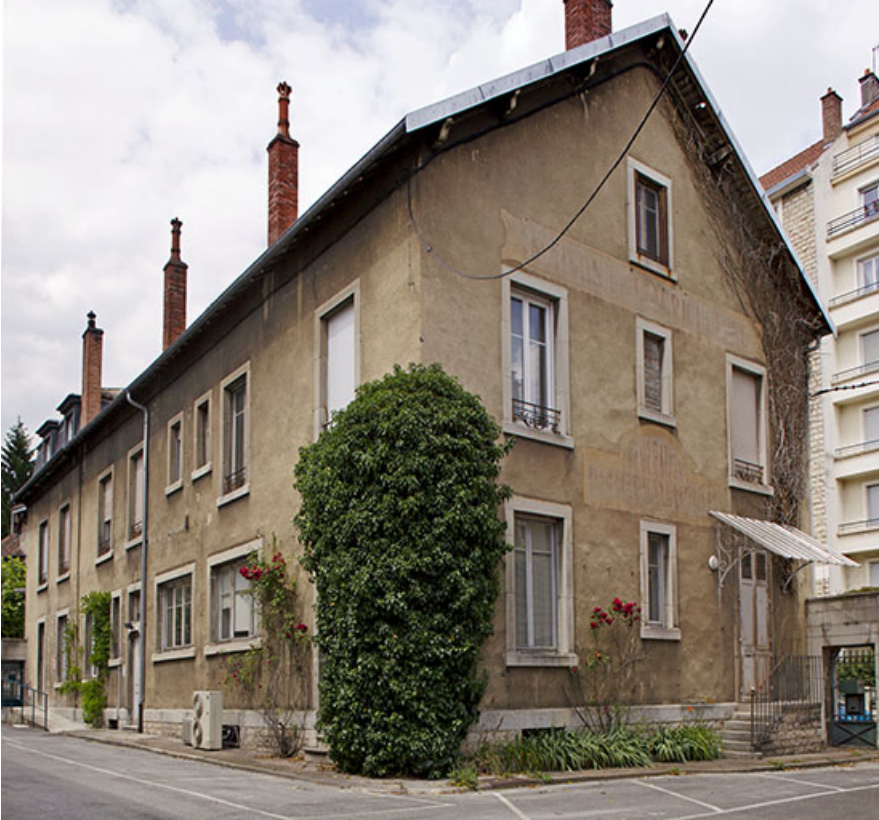
Bâtiment de l'administration : façades postérieure et latérale gauche.

25, Besançon, 1 ter et 3 rue Victor Delavelle