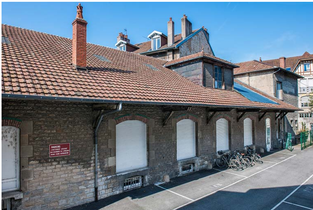
L'entrepôt avant sa surélévation en 2003 : façade antérieure de trois quarts gauche.

25, Besançon, 1 ter et 3 rue Victor Delavelle