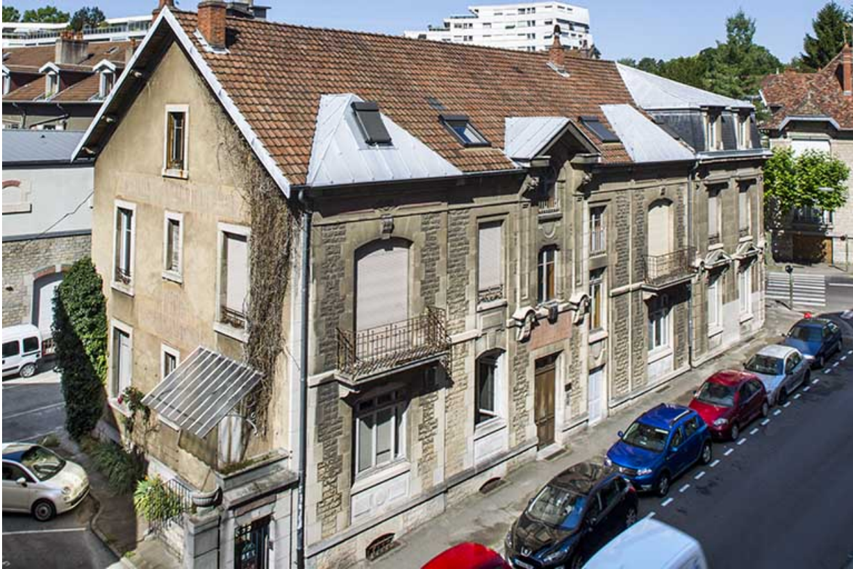
Bâtiment de l'administration : vue plongeante sur la façade antérieure (côté rue Delavelle).

25, Besançon, 1 ter et 3 rue Victor Delavelle