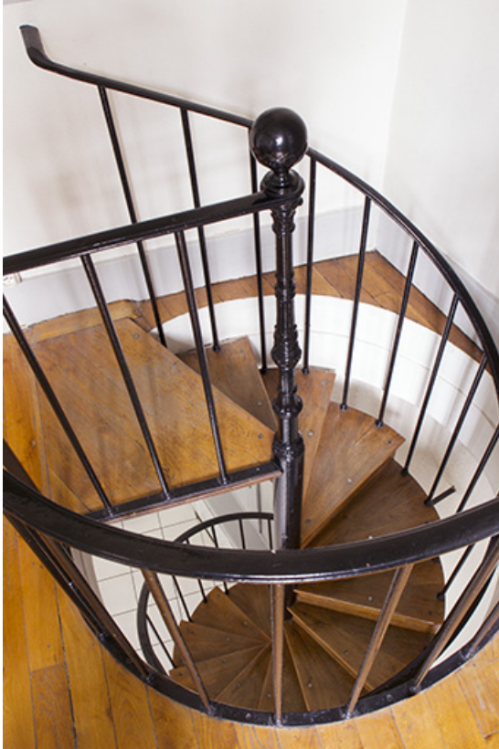
Entrepôt, rez-de-chaussée : escalier en vis, vu en plongée.

25, Besançon, 1 ter et 3 rue Victor Delavelle