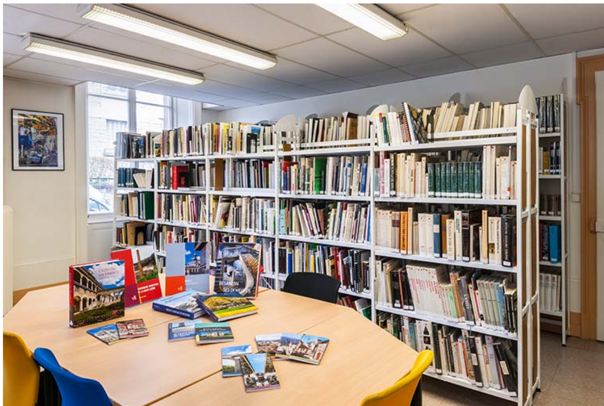
Bâtiment de l'administration, rez-de-chaussée : ancienne salle de réunion (actuel centre de documentation du service Inventaire et Patrimoine).

25, Besançon, 1 ter et 3 rue Victor Delavelle