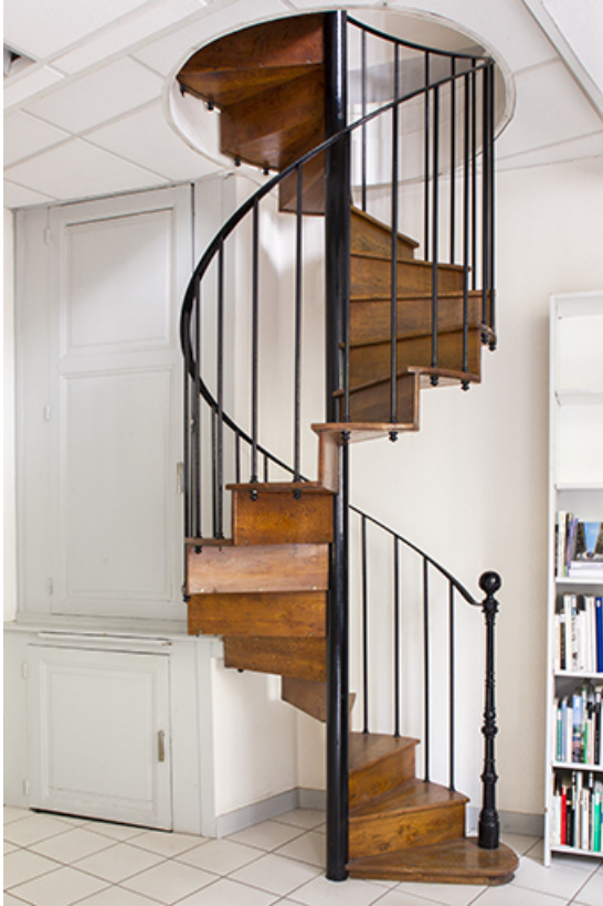
Entrepôt, rez-de-chaussée : escalier en vis pour l'accès à l'étage.

25, Besançon, 1 ter et 3 rue Victor Delavelle