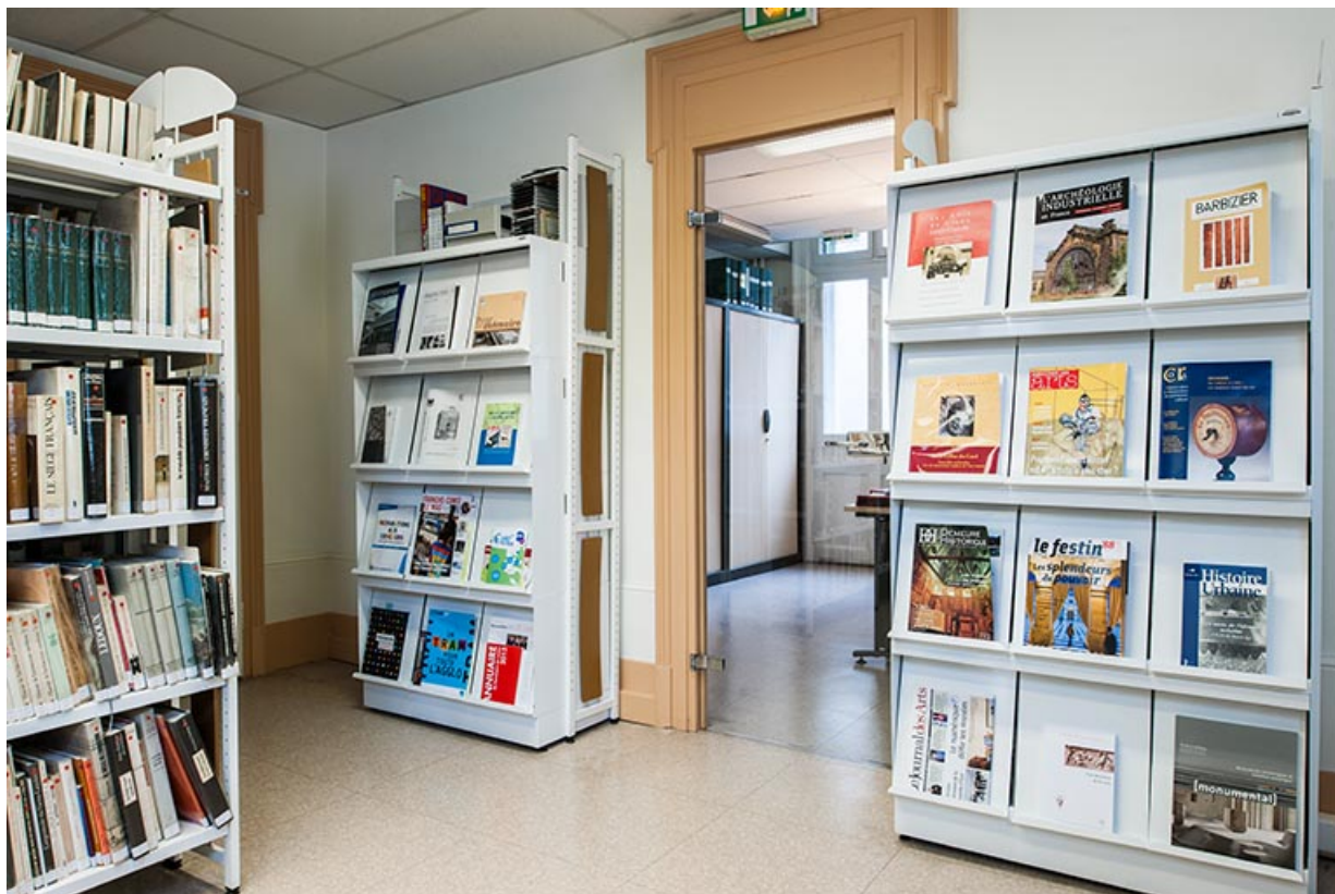
Bâtiment de l'administration, rez-de-chaussée : ancienne salle de réunion (actuel centre de documentation du service Inventaire et Patrimoine).

25, Besançon, 1 ter et 3 rue Victor Delavelle