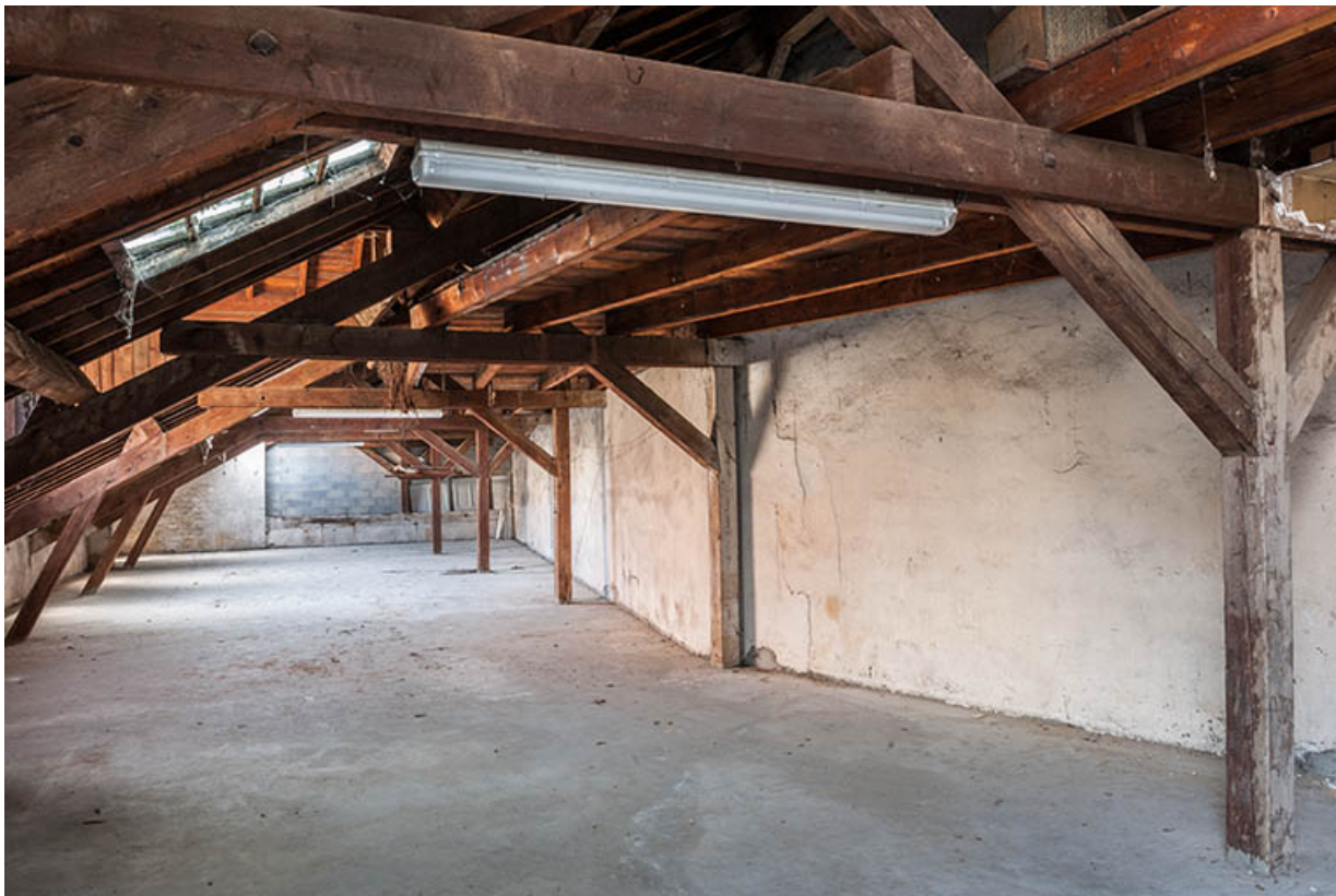
L'entrepôt avant sa surélévation en 2003 : la charpente depuis l'entrée.

25, Besançon, 1 ter et 3 rue Victor Delavelle