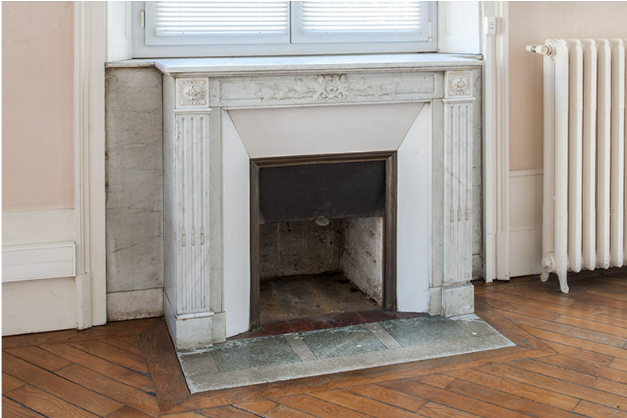
Bâtiment de l'administration, 1er étage : cheminée de l'ancien salon.

25, Besançon, 1 ter et 3 rue Victor Delavelle