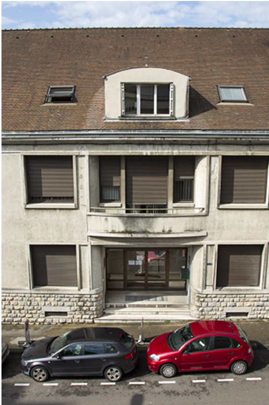
Siège de la Caisse régionale de Crédit agricole : vue plongeante sur l'entrée principale (côté rue Delavelle). 25, Besançon, 1 ter et 3 rue Victor Delavelle