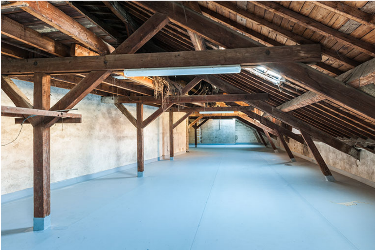
L'entrepôt en cours de surélévation en 2003 : couche d'étanchéité appliquée sur le sol de l'étage en surcroît. 25, Besançon, 1 ter et 3 rue Victor Delavelle