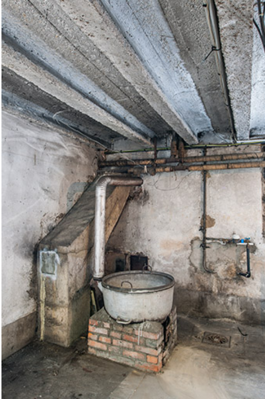
Bâtiment de l'administration, sous-sol : buanderie et son chaudron à lessive.

25, Besançon, 1 ter et 3 rue Victor Delavelle