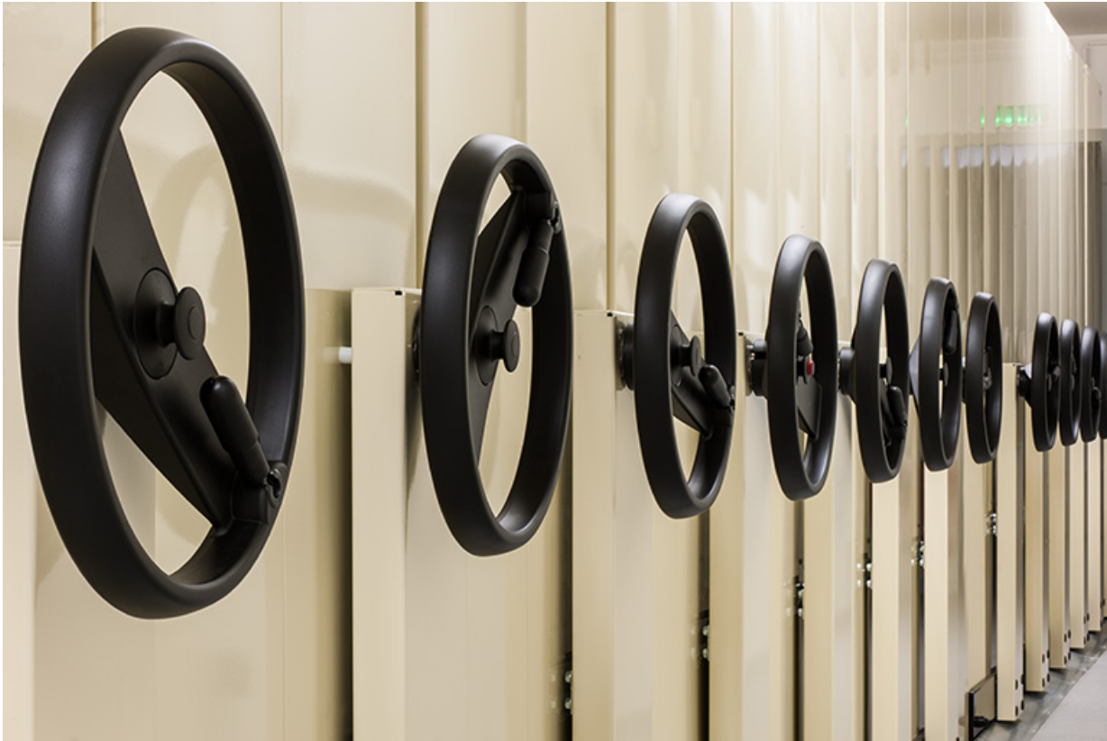
Entrepôt, 1er étage (partie surélevée) : volants des rayonnages mobiles.

25, Besançon, 1 ter et 3 rue Victor Delavelle