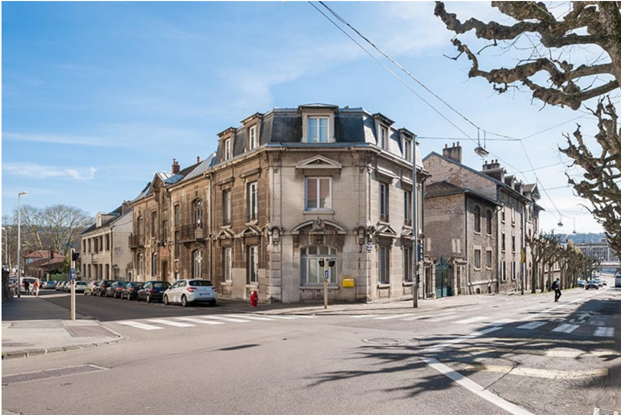
Vue d'ensemble du site, depuis le nord.

25, Besançon, 1 ter et 3 rue Victor Delavelle