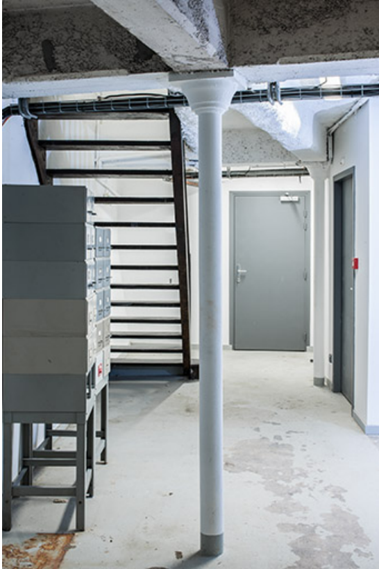
Entrepôt, soubassement : poteau en fonte et charpente en béton.

25, Besançon, 1 ter et 3 rue Victor Delavelle