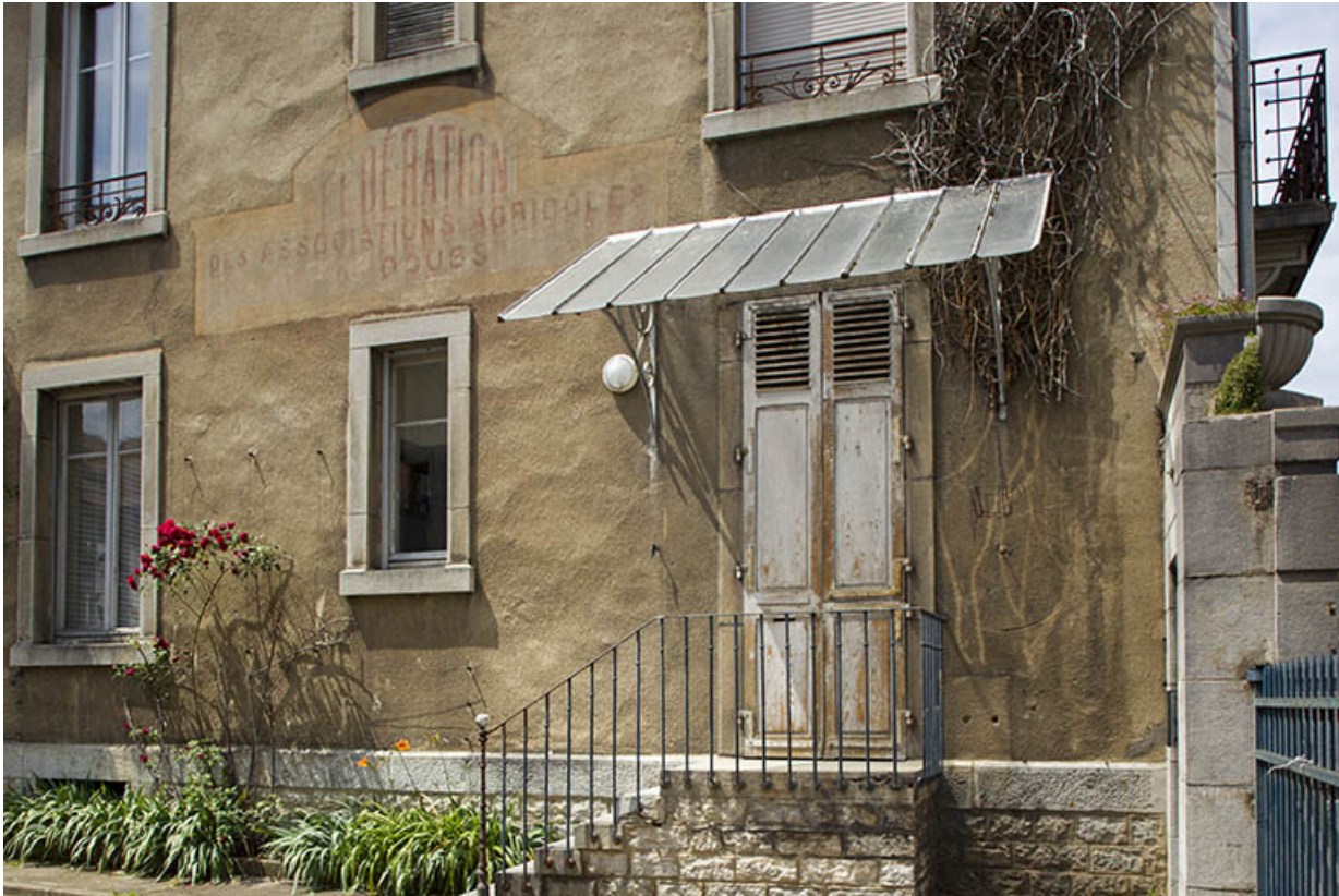
Bâtiment de l'administration : entrée sur la façade latérale gauche.

25, Besançon, 1 ter et 3 rue Victor Delavelle