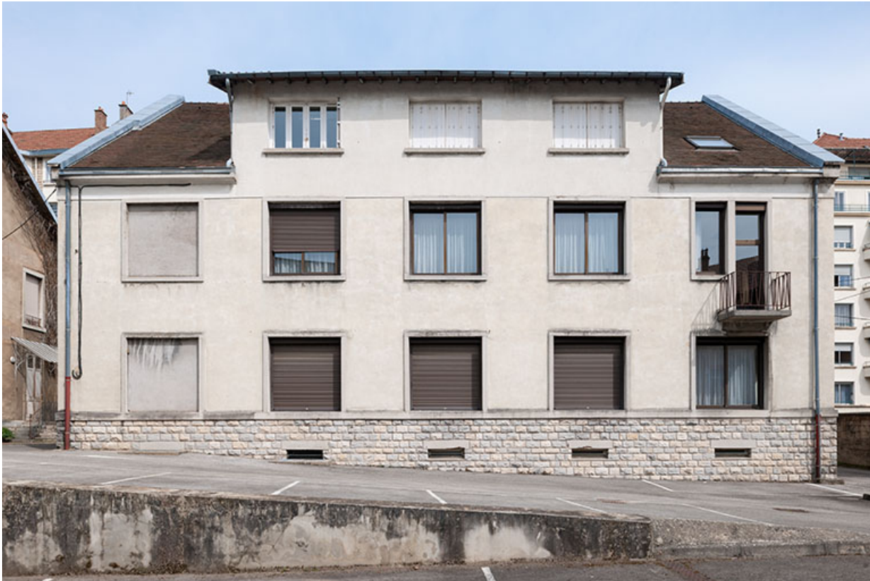
Siège de la Caisse régionale de Crédit agricole : façade postérieure.

25, Besançon, 1 ter et 3 rue Victor Delavelle