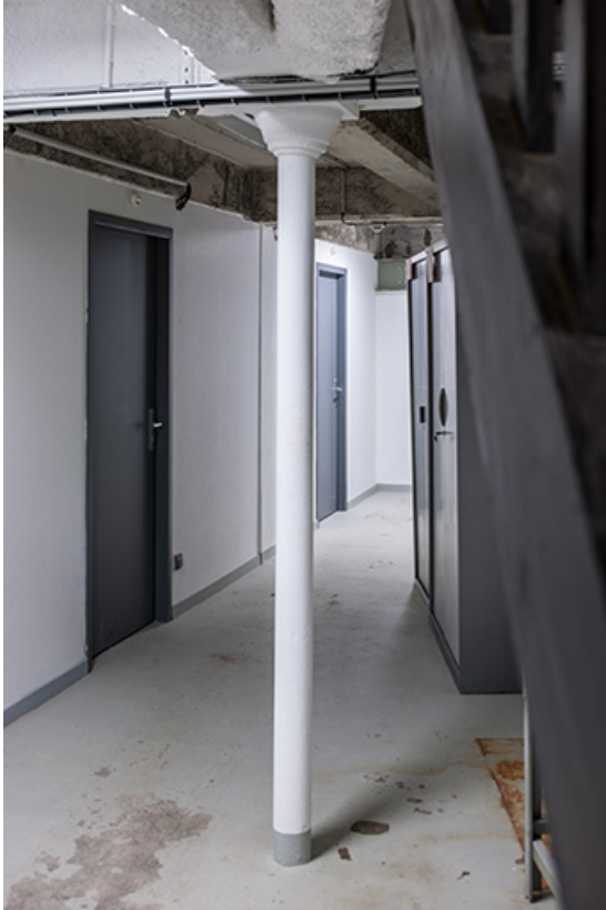
Entrepôt, soubassement : charpente en béton et poteau en fonte.

25, Besançon, 1 ter et 3 rue Victor Delavelle