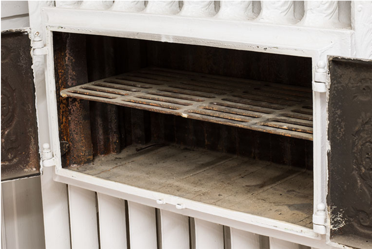
Bâtiment de l'administration, 1er étage : radiateur à chauffe-plat, détail du chauffe-plat.

25, Besançon, 1 ter et 3 rue Victor Delavelle