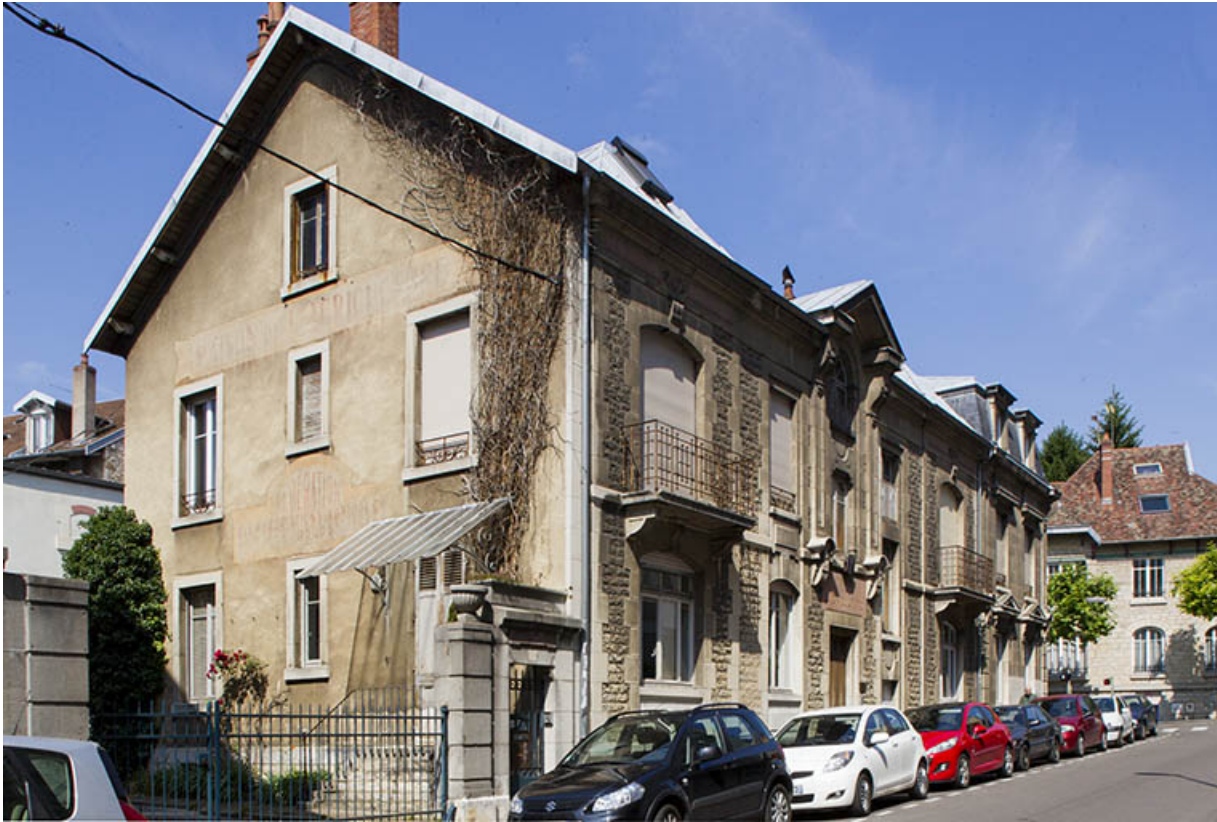
Bâtiment de l'administration : façade antérieure (rue Delavelle), de trois quarts gauche.

25, Besançon, 1 ter et 3 rue Victor Delavelle