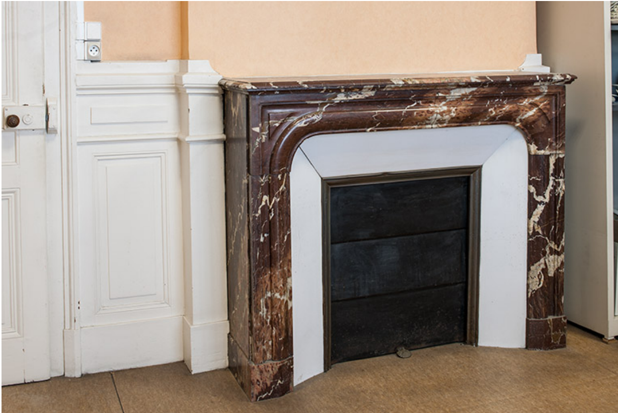
Bâtiment de l'administration, 1er étage : cheminée de l'ancienne salle à manger.

25, Besançon, 1 ter et 3 rue Victor Delavelle