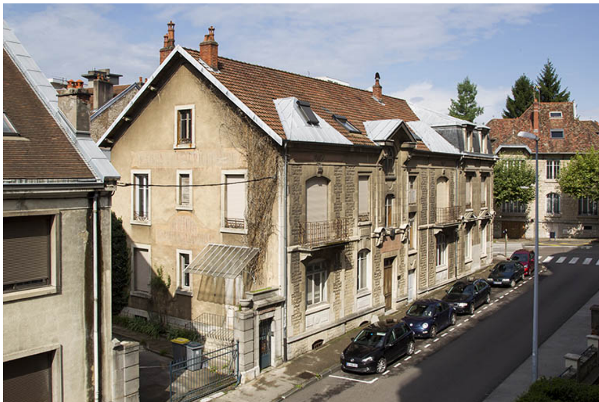
Bâtiment de l'administration : vue plongeante sur la façade antérieure (côté rue Delavelle).

25, Besançon, 1 ter et 3 rue Victor Delavelle