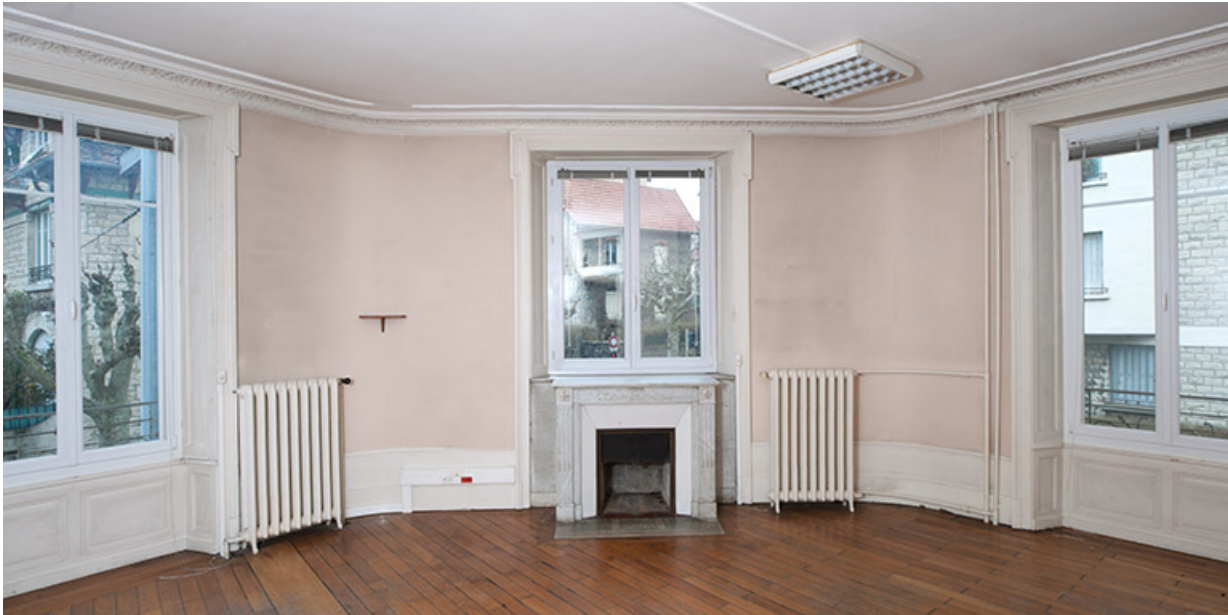
Bâtiment de l'administration, 1er étage : ancien salon puis salle de réunion.

25, Besançon, 1 ter et 3 rue Victor Delavelle