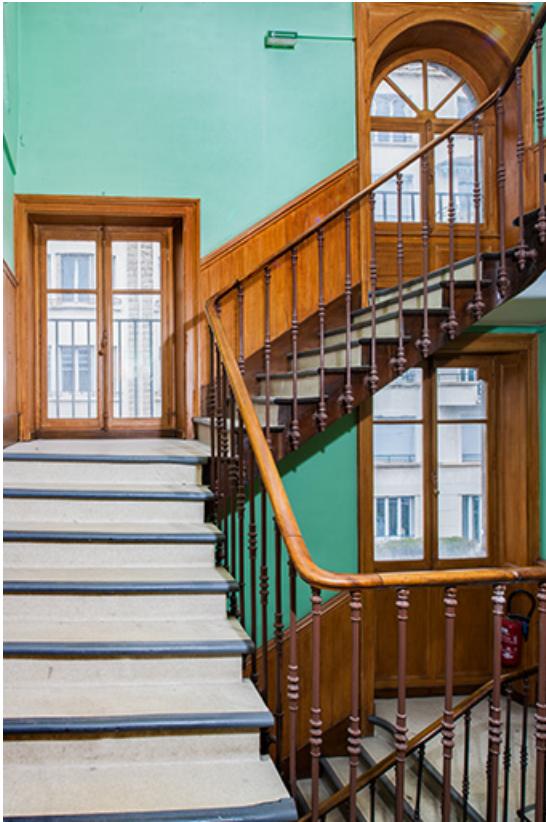
Bâtiment de l'administration, cage d'escalier : volées du 1er au 2e étage.

25, Besançon, 1 ter et 3 rue Victor Delavelle