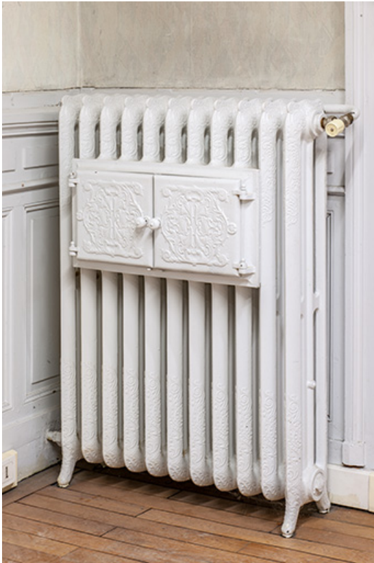
Bâtiment de l'administration, 1er étage : radiateur à chauffe-plat.

25, Besançon, 1 ter et 3 rue Victor Delavelle