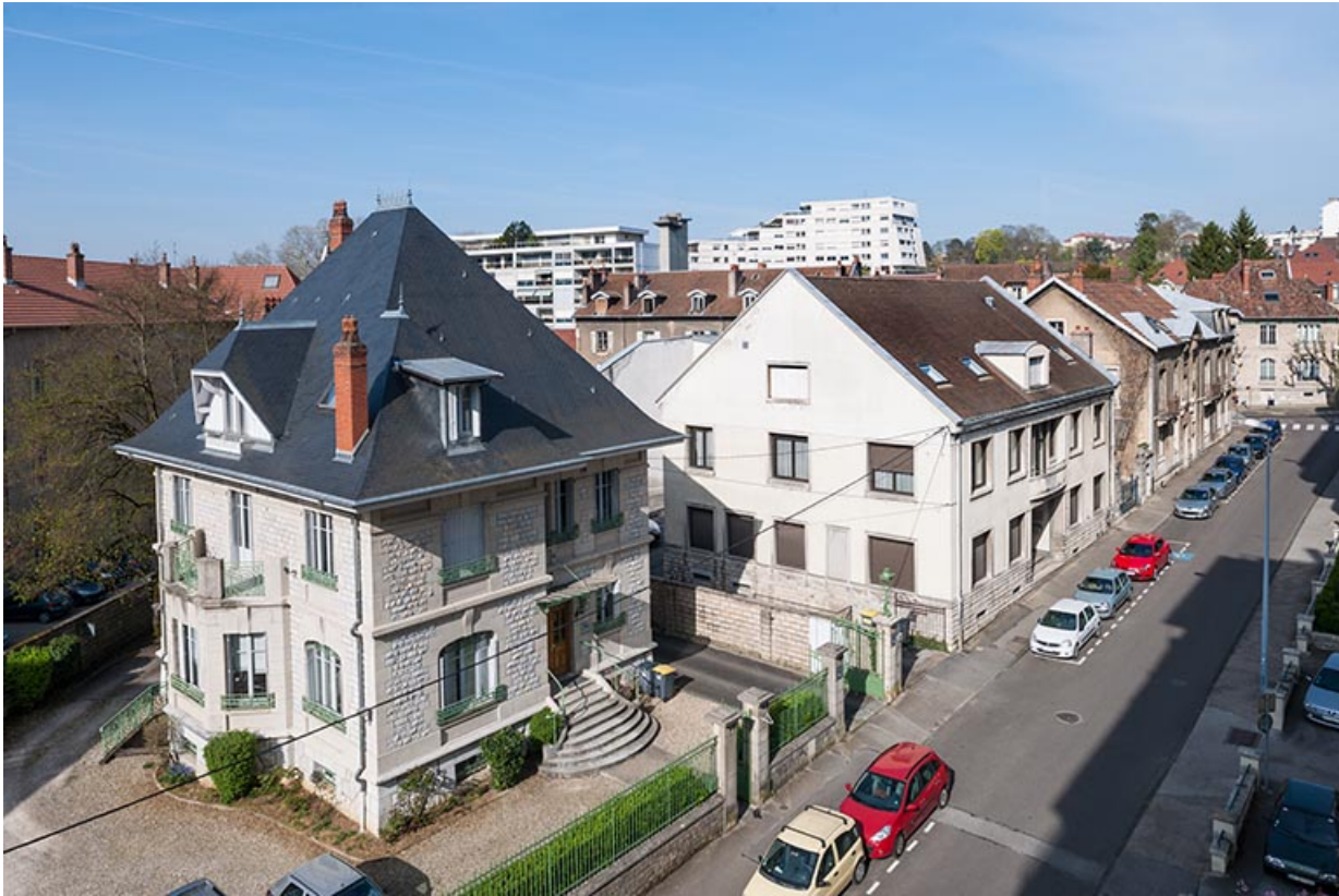
Vue d'ensemble plongeante, depuis l'est.

25, Besançon, 1 bis rue Victor Delavelle