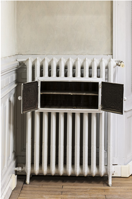
Bâtiment de l'administration, 1er étage : radiateur à chauffe-plat, avec chauffe-plat ouvert. 25, Besançon, 1 ter et 3 rue Victor Delavelle