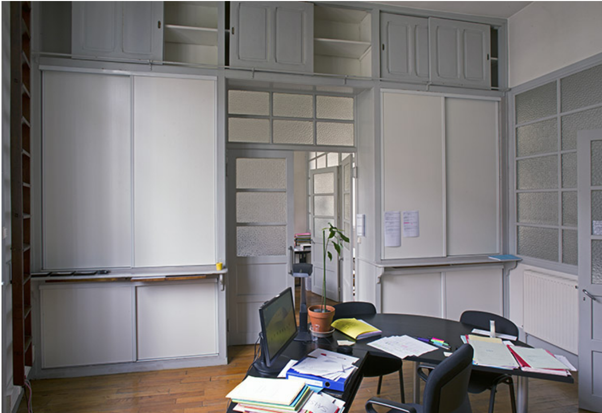
Entrepôt, 1er étage : l'un des bureaux.

25, Besançon, 1 ter et 3 rue Victor Delavelle