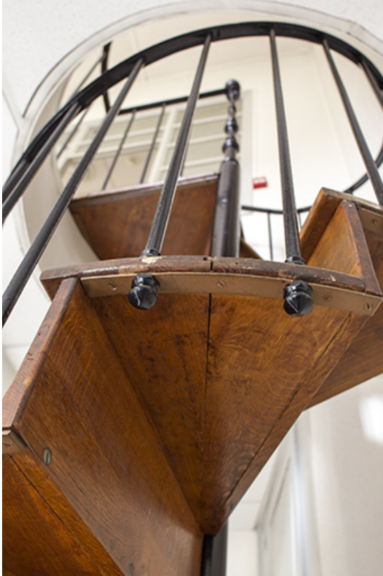
Entrepôt, rez-de-chaussée : escalier en vis, vu en contre-plongée.

25, Besançon, 1 ter et 3 rue Victor Delavelle