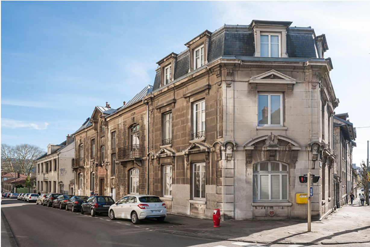
Bâtiment de l'administration : façade sur la rue Delavelle, depuis le nord.

25, Besançon, 1 ter et 3 rue Victor Delavelle