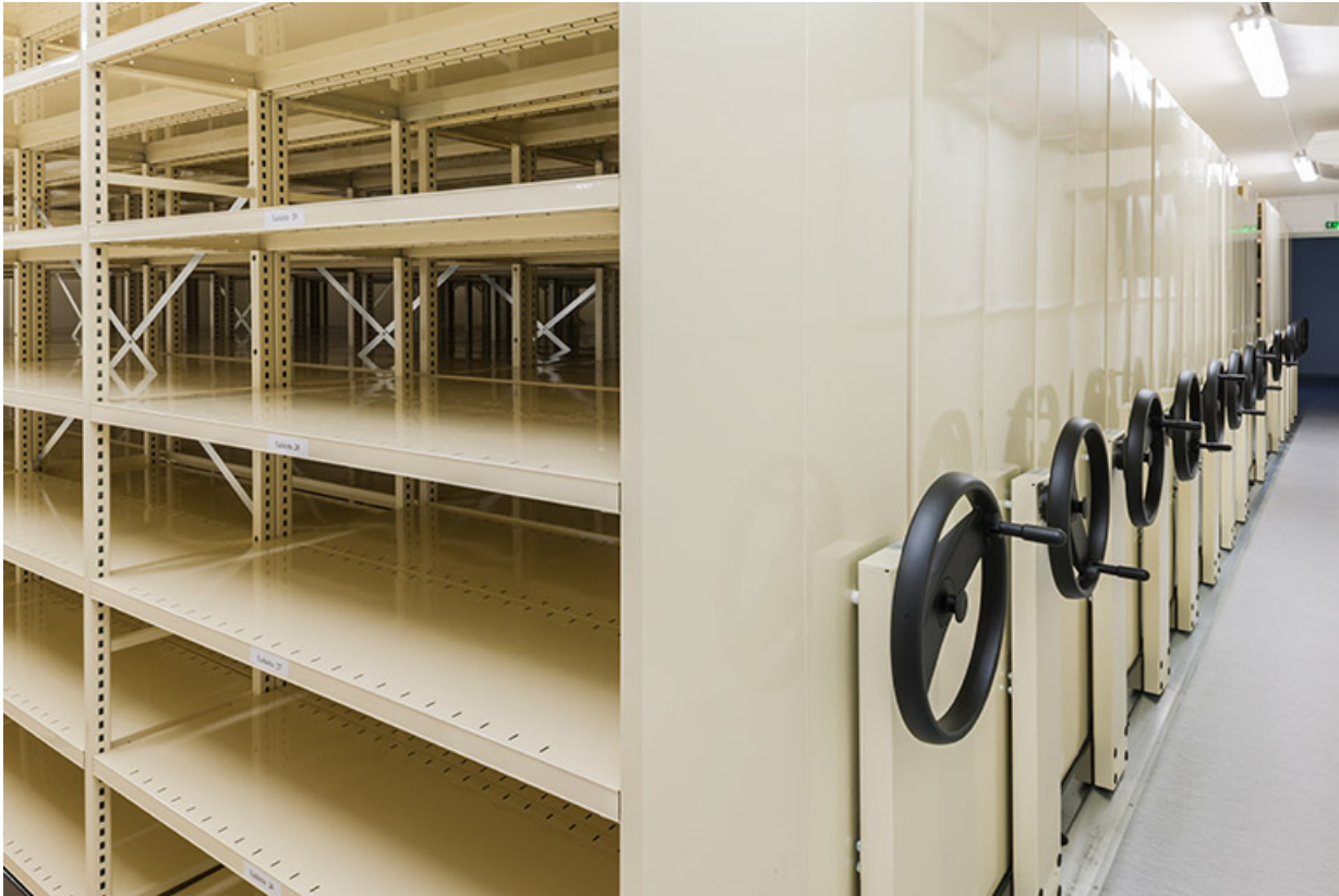
Entrepôt, 1er étage (partie surélevée) : rayonnages mobiles pour l'archivage.

25, Besançon, 1 ter et 3 rue Victor Delavelle