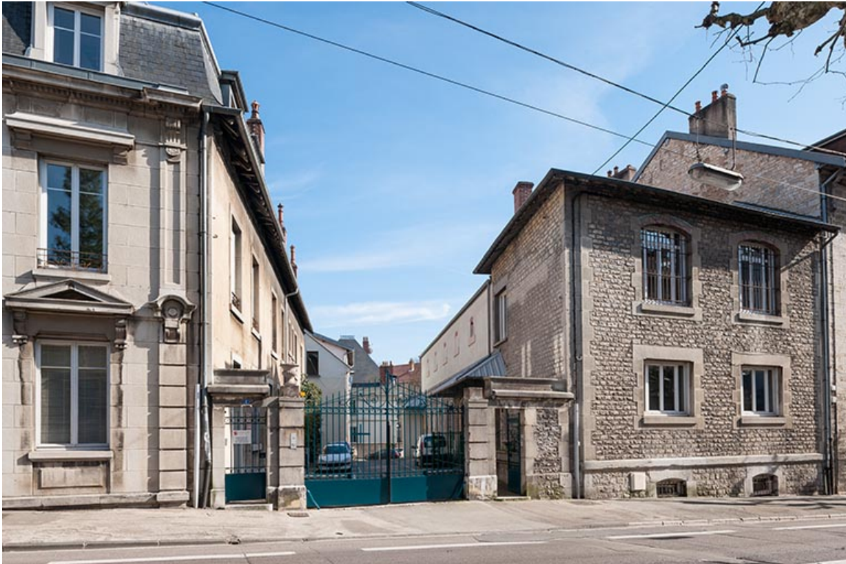
Entrée du site sur l'avenue Denfert-Rochereau.

25, Besançon, 1 er et 3 rue Victor Delavelle