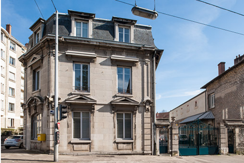
Bâtiment de l'administration : façade sur l'avenue Denfert-Rochereau. 25, Besançon, 1 ter et 3 rue Victor Delavelle