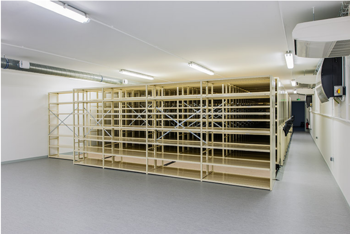
Entrepôt, 1er étage (partie surélevée) : salle d'archivage, depuis le fond de la pièce.

25, Besançon, 1 ter et 3 rue Victor Delavelle