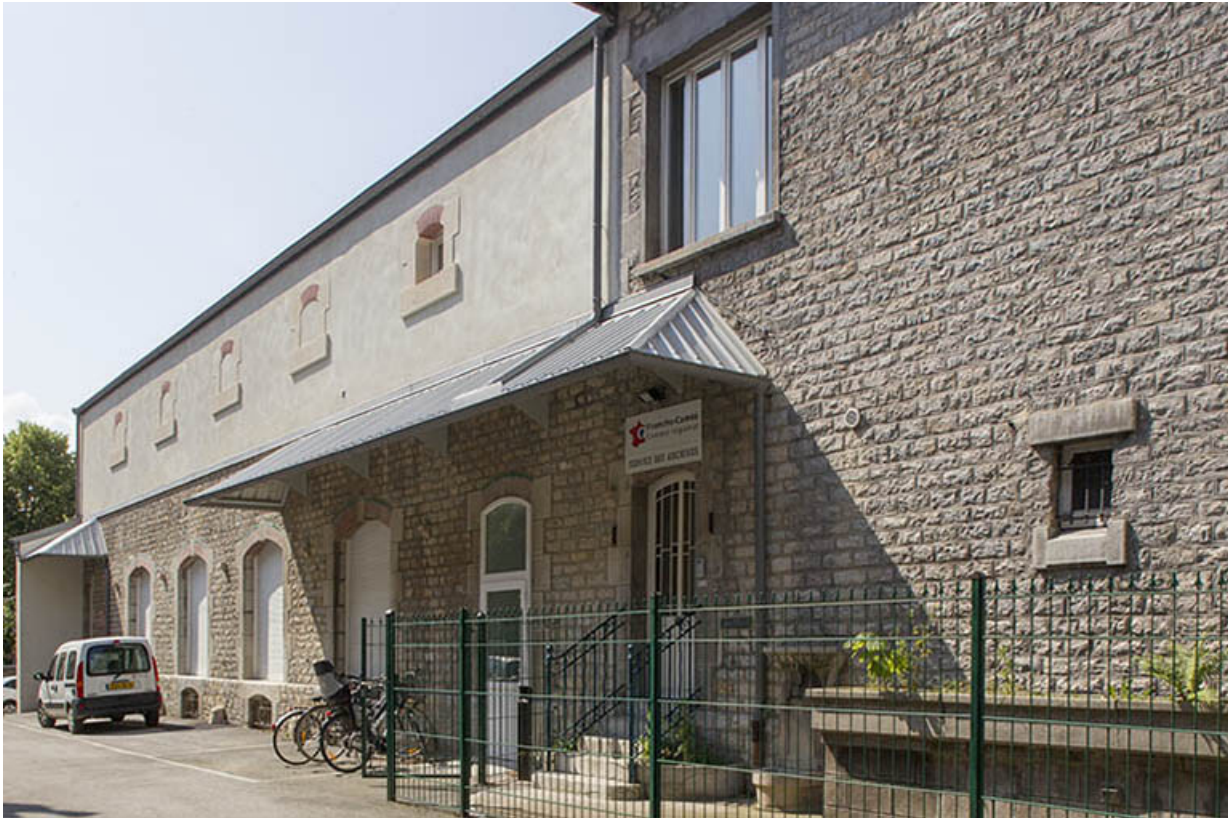
Entrepôt : façade antérieure de trois quarts droite (depuis l'entrée de la cour). 25, Besançon, 1 ter et 3 rue Victor Delavelle