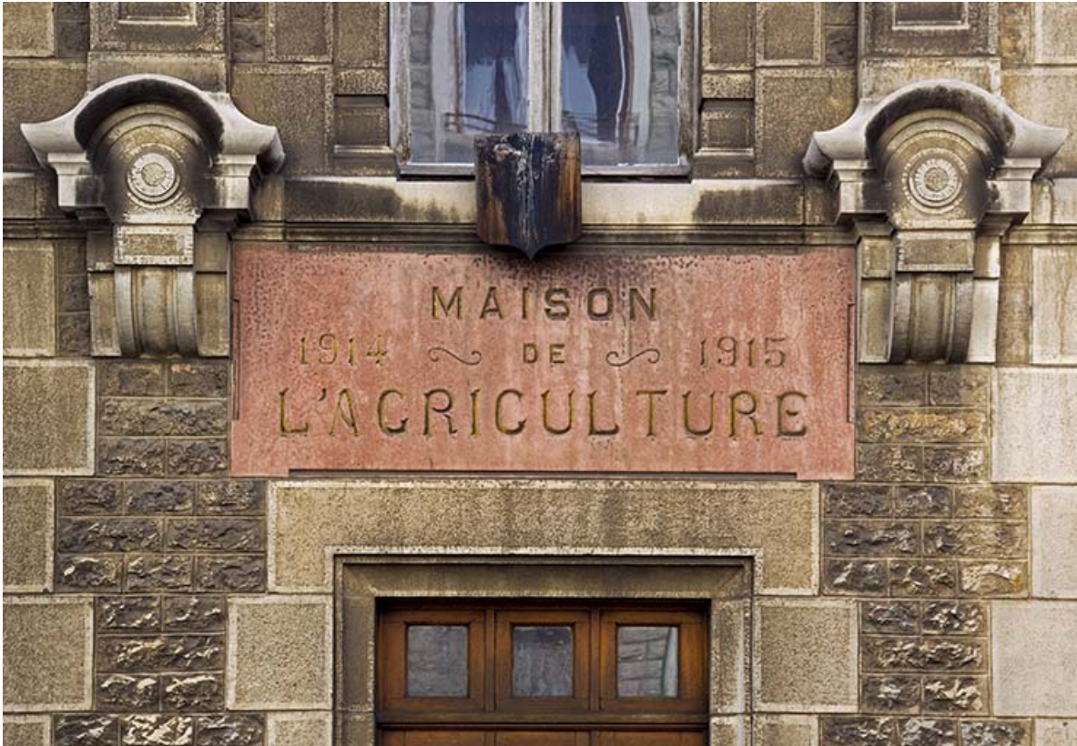
Bâtiment de l'administration : inscription surmontant l'entrée principale (façade antérieure).

25, Besançon, 1 ter et 3 rue Victor Delavelle