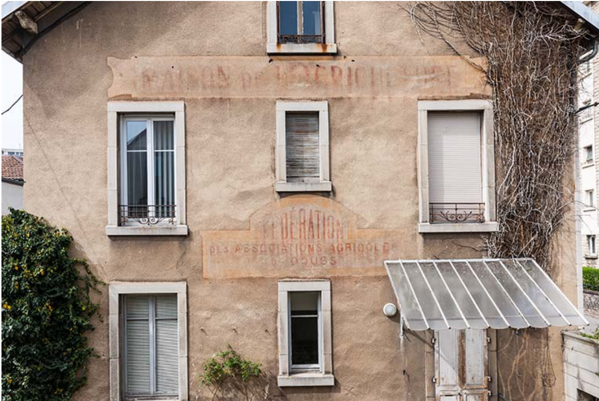
Bâtiment de l'administration : inscriptions sur la façade latérale gauche.

25, Besançon, 1 ter et 3 rue Victor Delavelle