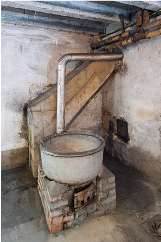
Bâtiment de l'administration, sous-sol : chaudron à lessive.

25, Besançon, 1 ter et 3 rue Victor Delavelle