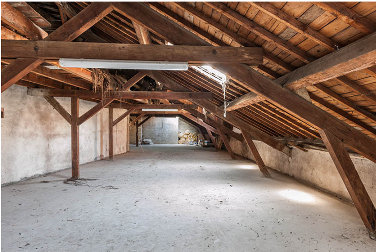
L'entrepôt avant sa surélévation en 2003 : la charpente depuis le fond de l'étage en surcroît.

25, Besançon, 1 ter et 3 rue Victor Delavelle