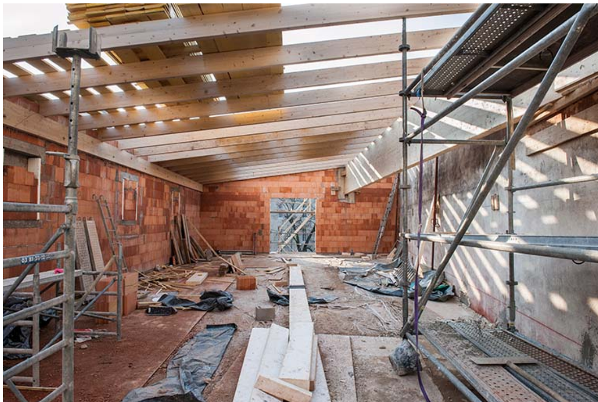
L'entrepôt en cours de surélévation en 2003 : intérieur de l'étage en surcroît depuis l'entrée.

25, Besançon, 1 ter et 3 rue Victor Delavelle