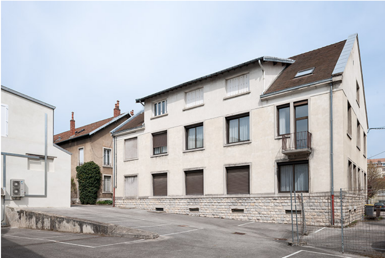
Siège de la Caisse régionale de Crédit agricole : façade postérieure, de trois quarts droite.

25, Besançon, 1 ter et 3 rue Victor Delavelle