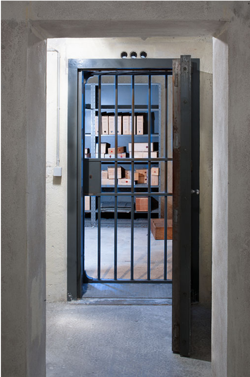
Siège de la Caisse régionale de Crédit agricole : l'ancienne salle forte.

25, Besançon, 1 er et 3 rue Victor Delavelle