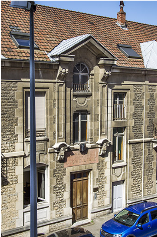
Bâtiment de l'administration : travée principale de la façade antérieure. 25, Besançon, 1 ter et 3 rue Victor Delavelle