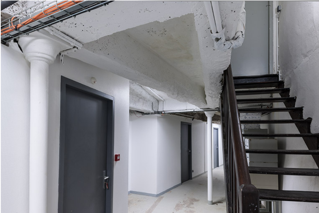
Entrepôt, soubassement : charpente en béton, poteaux en fonte et aménagements récents.

25, Besançon, 1 ter et 3 rue Victor Delavelle