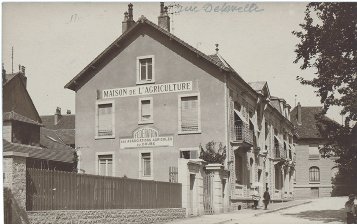
[La Maison de l'Agriculture, rue Delavelle à Besançon], 2e quart 20e siècle. 25, Besançon, 1 ter et 3 rue Victor Delavelle

[La Maison de l'Agriculture, rue Delavelle à Besançon], carte postale, s.n., s.d. [2e quart 20e siècle]. Document accessible sur internet ( http://memoirevive.besancon.fr/ )