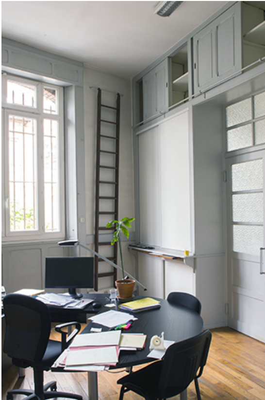
Entrepôt, 1er étage : l'un des bureaux.

25, Besançon, 1 ter et 3 rue Victor Delavelle