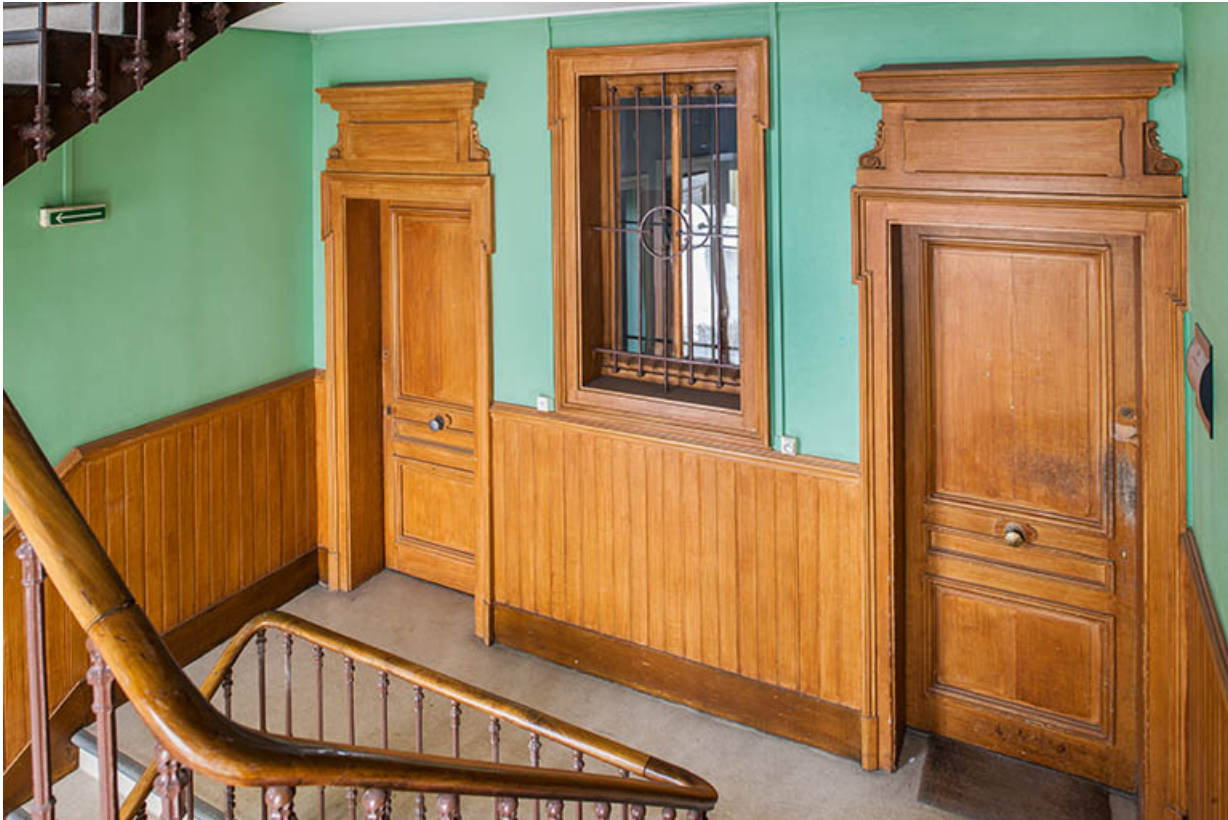
Bâtiment de l'administration, cage d'escalier : palier du 1er étage.

25, Besançon, 1 ter et 3 rue Victor Delavelle