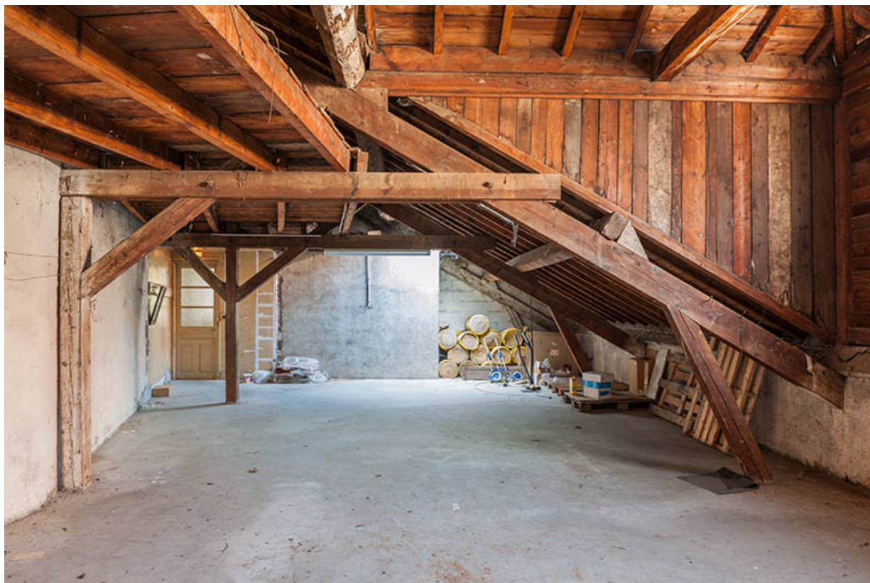
L'entrepôt avant sa surélévation en 2003 : la charpente près de l'entrée.

25, Besançon, 1 ter et 3 rue Victor Delavelle