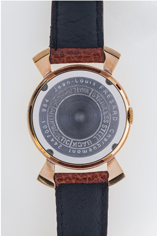
Montre Jean-Louis Frésard : inscriptions sur le fond. 25, Charquemont, 13 rue Jean Moulin