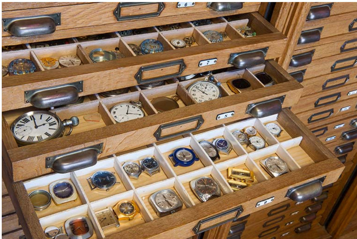
Layette d'horloger : tiroirs ouverts présentant montres et mouvements.