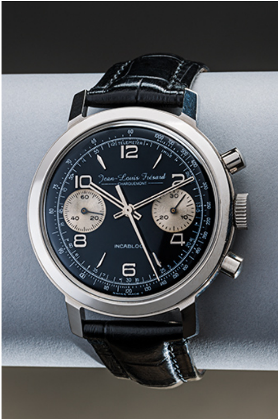
Montre Jean-Louis Frésard.