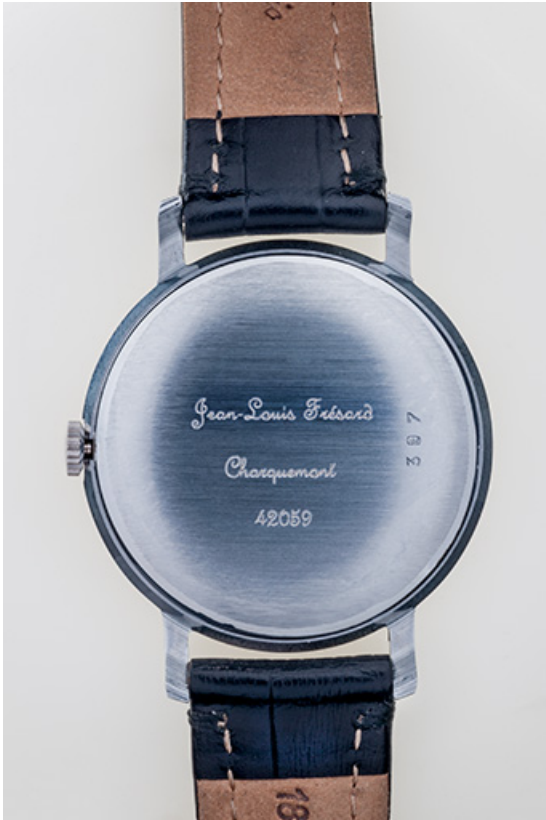
Montre Jean-Louis Frésard : inscriptions sur le fond.