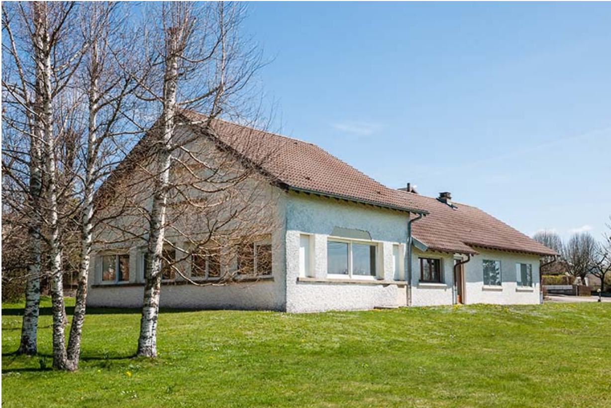
Vue d'ensemble, depuis l'ouest (façades postérieure et latérale gauche).