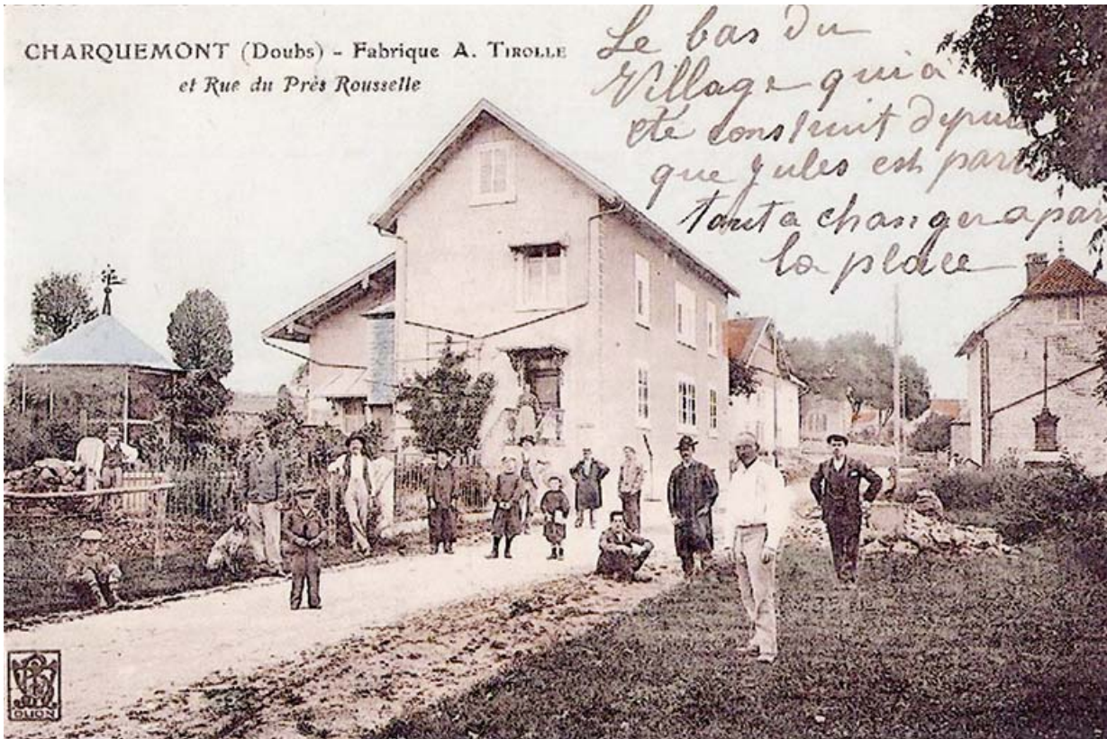
L'usine Amédée Tirolle puis Victorin Frésard (10-14 rue du Château) : Charquemont (Doubs) - Fabrique A. Tirolle et Rue du Près Rousselle, limite 19e siècle 20e siècle.