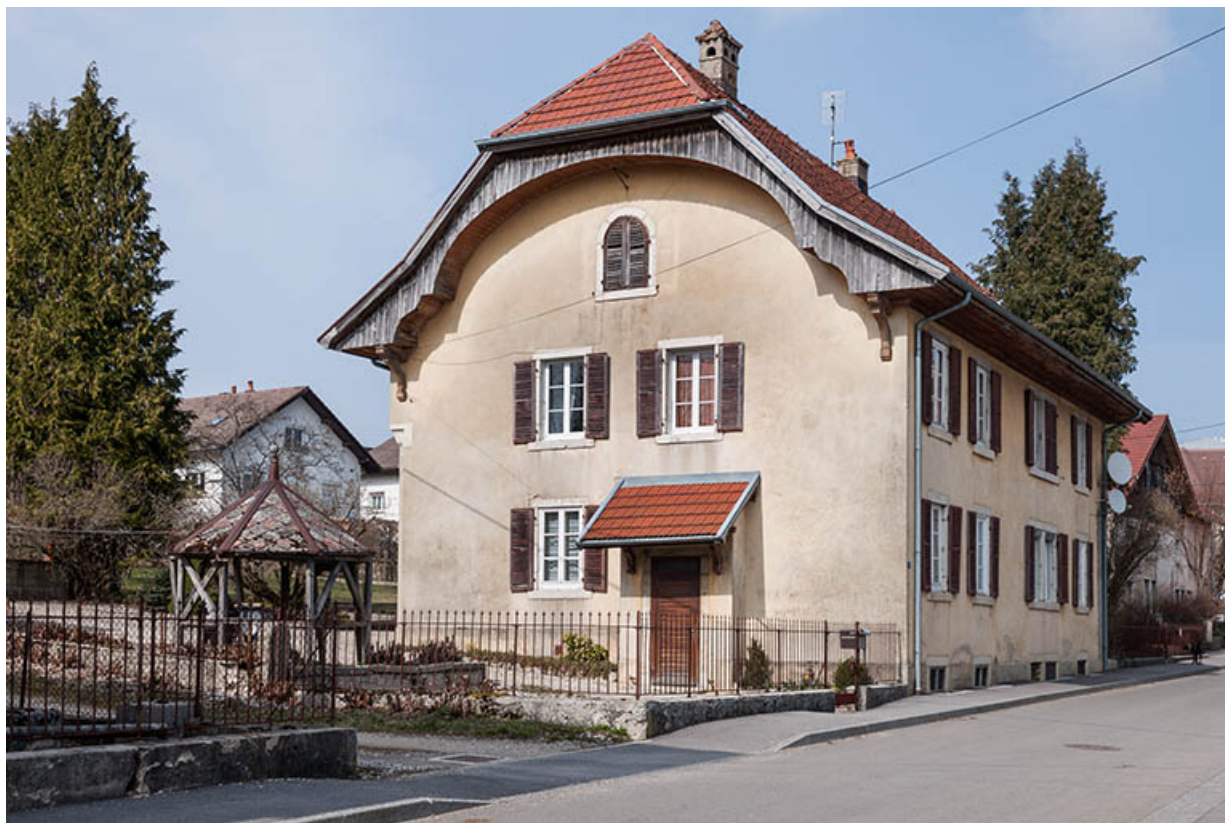
Logement patronal, de trois quarts gauche. 25, Charquemont, 10-14 rue du Château