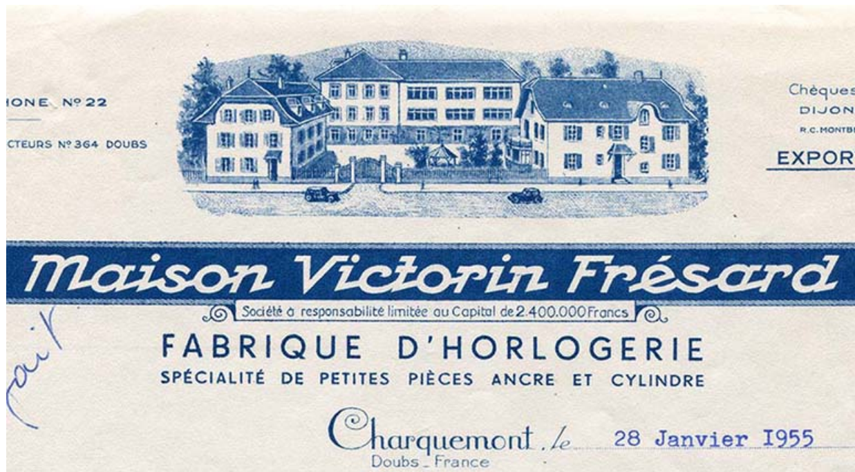
Papier à en-tête de la fabrique d'horlogerie Victorin Frésard : détail des bâtiments, 28 janvier 1955. 25, Charquemont, 10-14 rue du Château