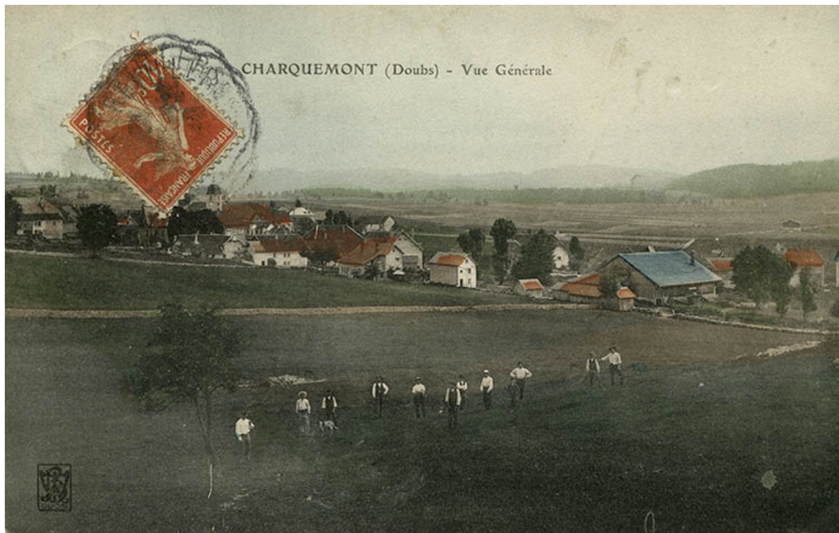
Charquemont (Doubs) - Vue générale [la rue du Château vue de l'ouest], entre 1904 et 1909. 25, Charquemont, 10-14 rue du Château