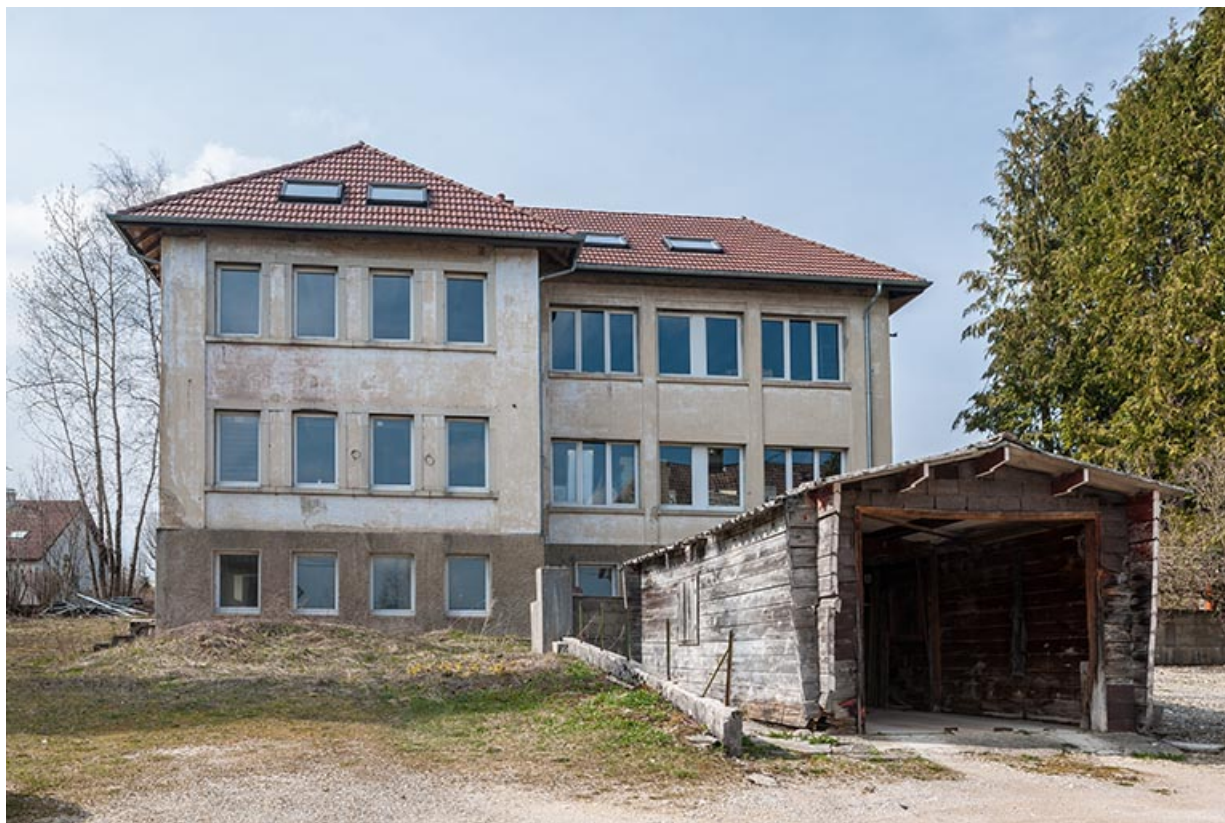
Usine : façade antérieure.