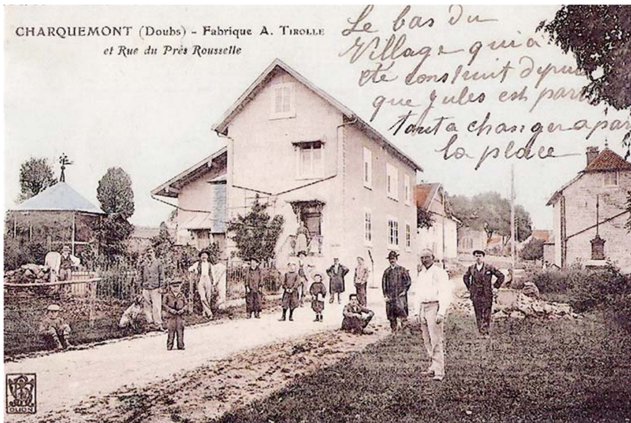
L'usine Amédée Tirolle puis Victorin Frésard (10-14 rue du Château) : Charquemont (Doubs) - Fabrique A. Tirolle et Rue du Près Rousselle, limite 19e siècle 20e siècle.