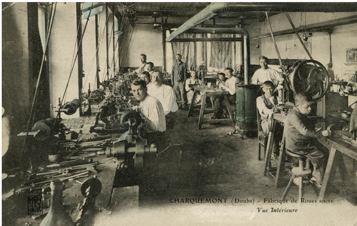
Charquemont (Doubs) - Fabrique de roues ancre [Tirolle]. Vue intérieure, limite 19e siècle 20e siècle. 25, Charquemont, 10-14 rue du Château