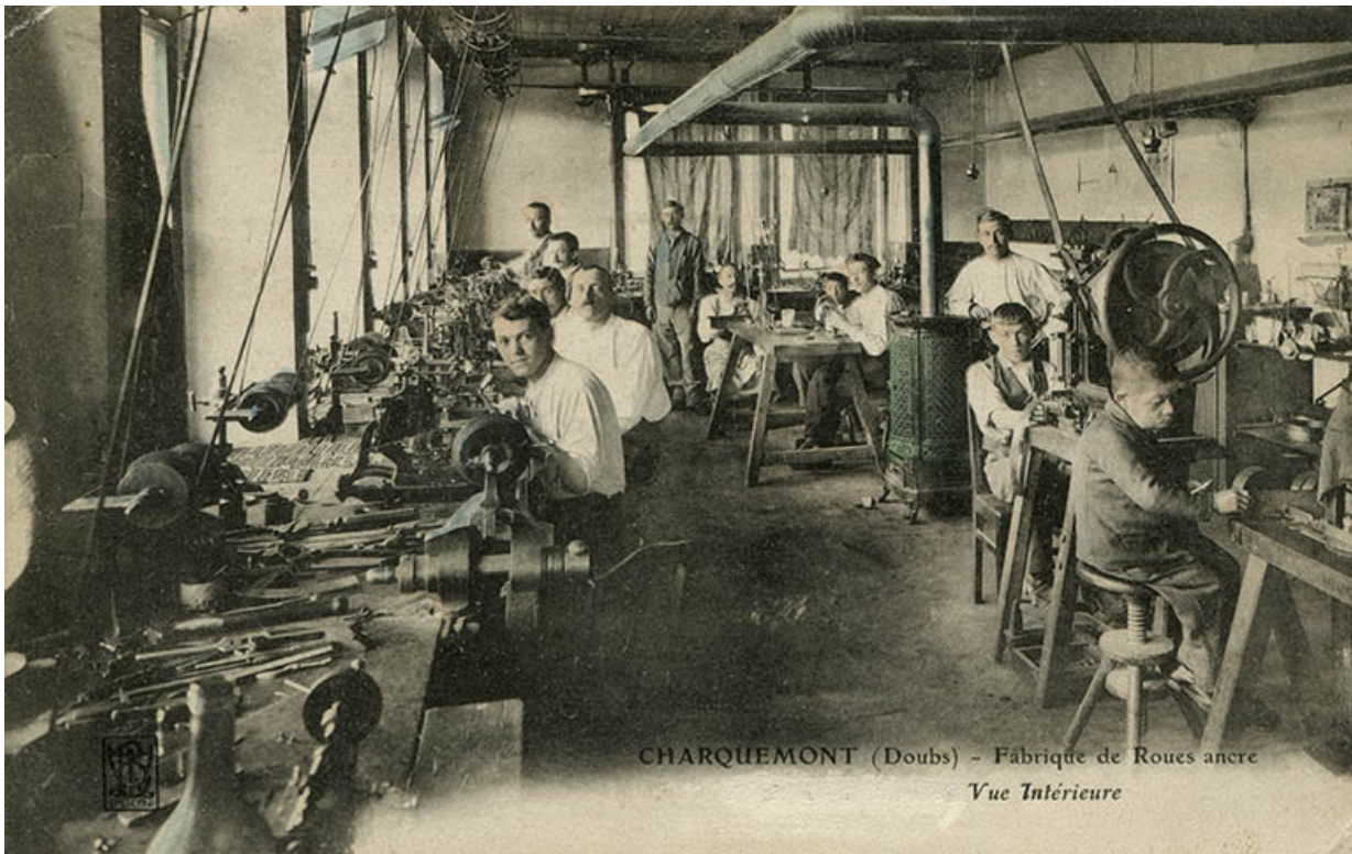
Charquemont (Doubs) - Fabrique de roues ancre [Tirolle]. Vue intérieure, limite 19e siècle 20e siècle. 25, Charquemont, 10-14 rue du Château