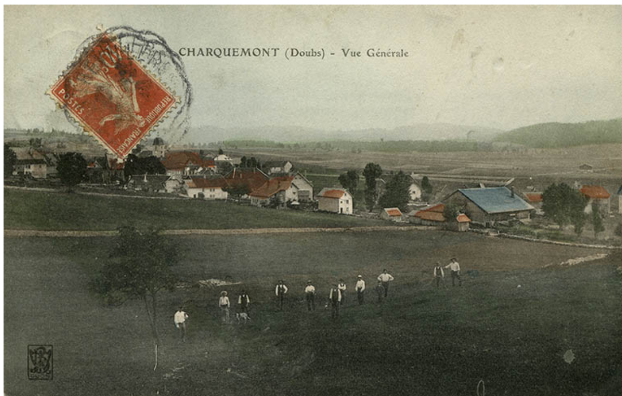
Charquemont (Doubs) - Vue générale [la rue du Château vue de l'ouest], entre 1904 et 1909. 25, Charquemont, 10-14 rue du Château