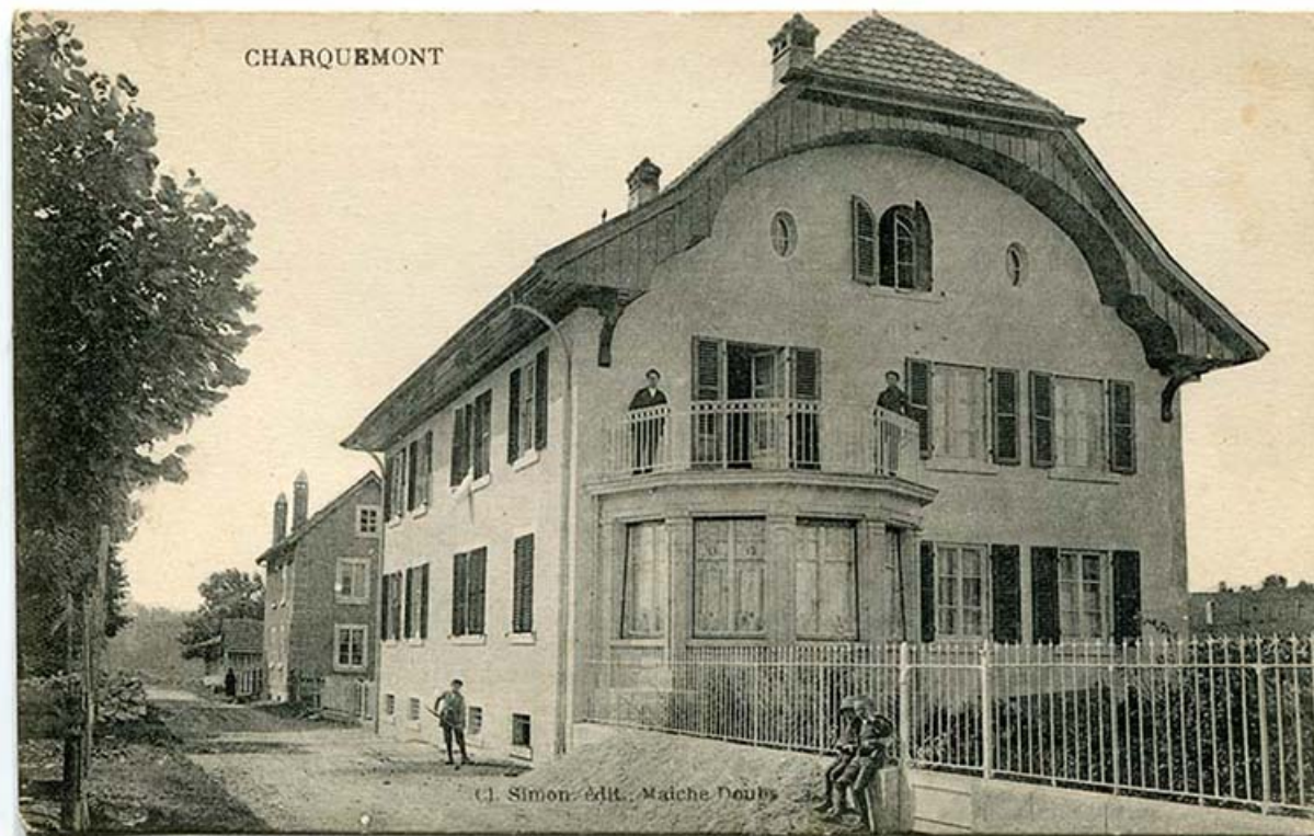
Charquemont [la maison de Victorin Frésard, rue du Château, vue de trois quarts droite], 1er quart 20e siècle 25, Charquemont, 10-14 rue du Château