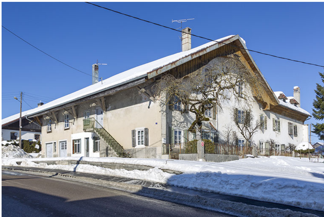
Vue d'ensemble, depuis le sud : façades antérieure et latérale gauche de la ferme, en hiver.