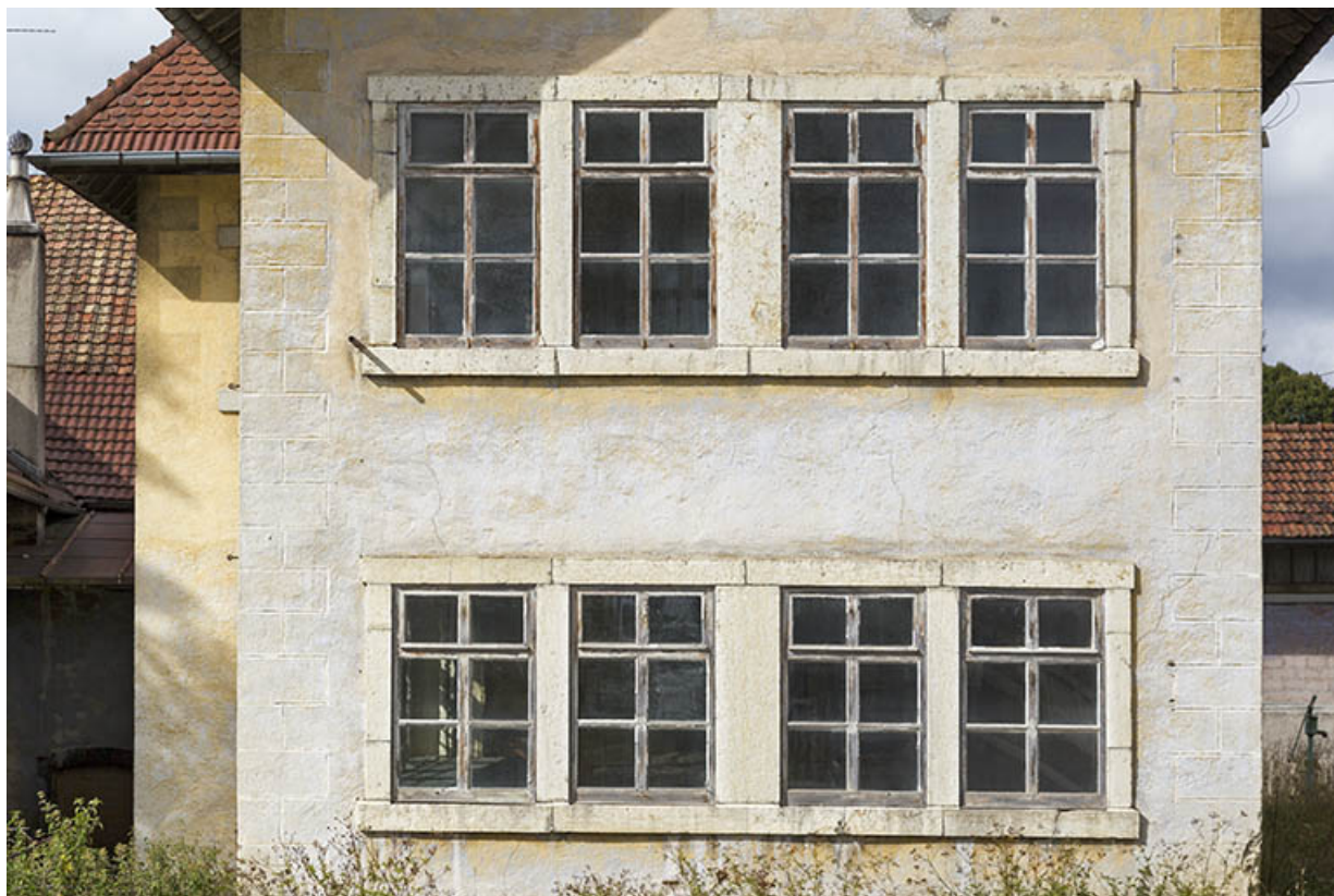
Usine, façade latérale gauche : fenêtres multiples des deux niveaux.