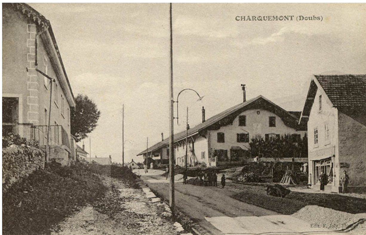
Charquemont (Doubs) [la ferme d'Aster Frésard], 1ère moitié 20e siècle. 25, Charquemont, 9 Grande Rue