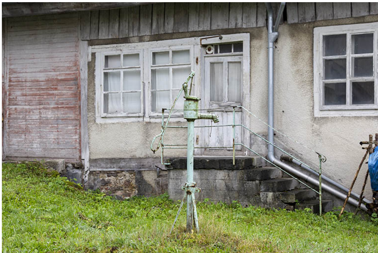
Façade latérale droite : entrée et pompe à eau. A gauche, la porte d'accès au fenil. 25, Charquemont, 9 Grande Rue