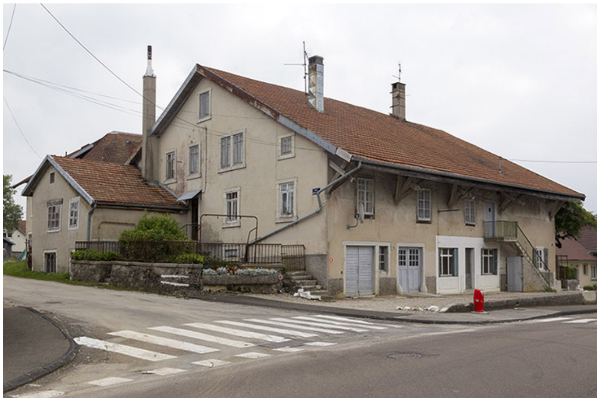
Vue d'ensemble, depuis le nord-ouest : façades postérieure et latérale gauche de la ferme.