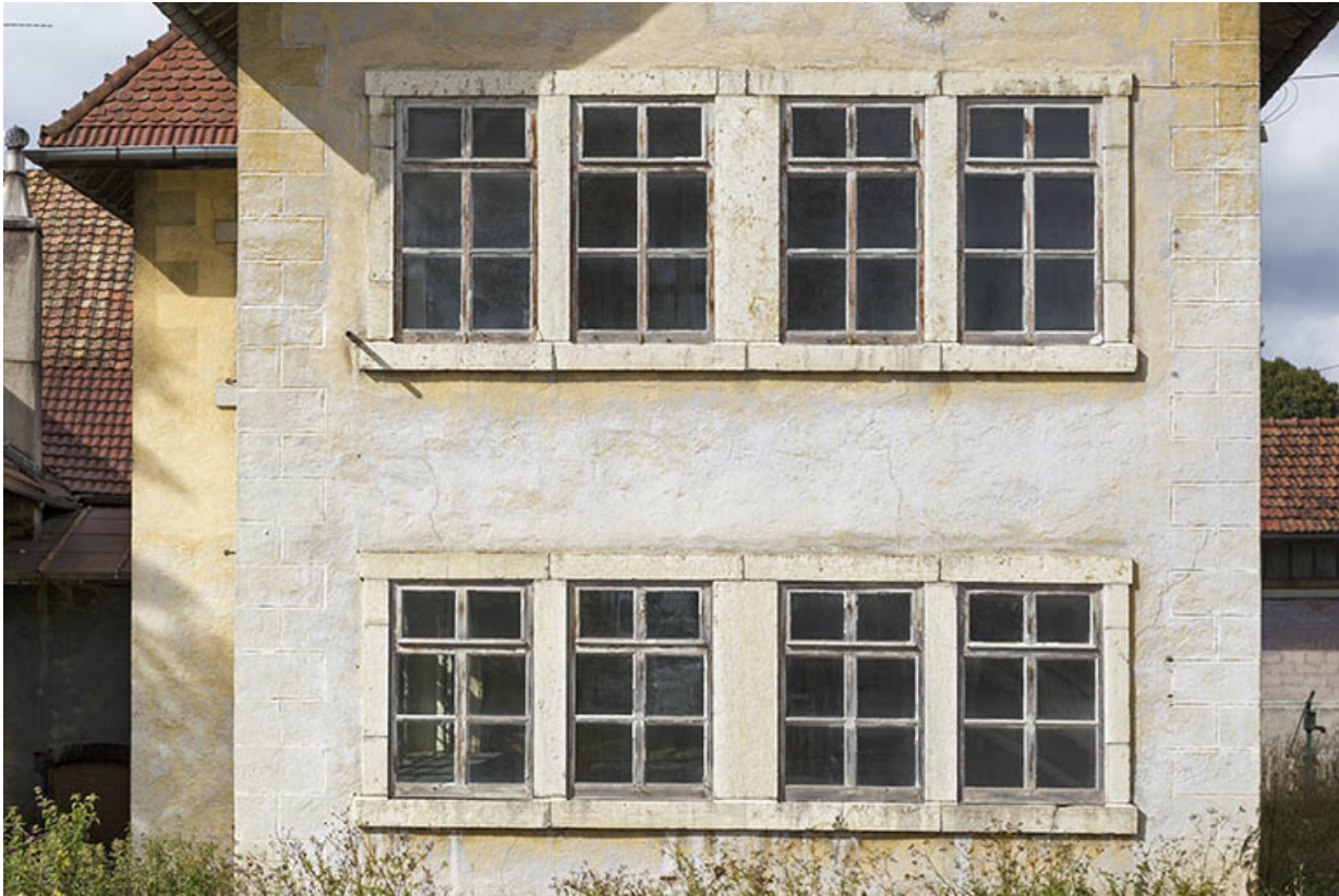
Usine, façade latérale gauche : fenêtres multiples des deux niveaux.