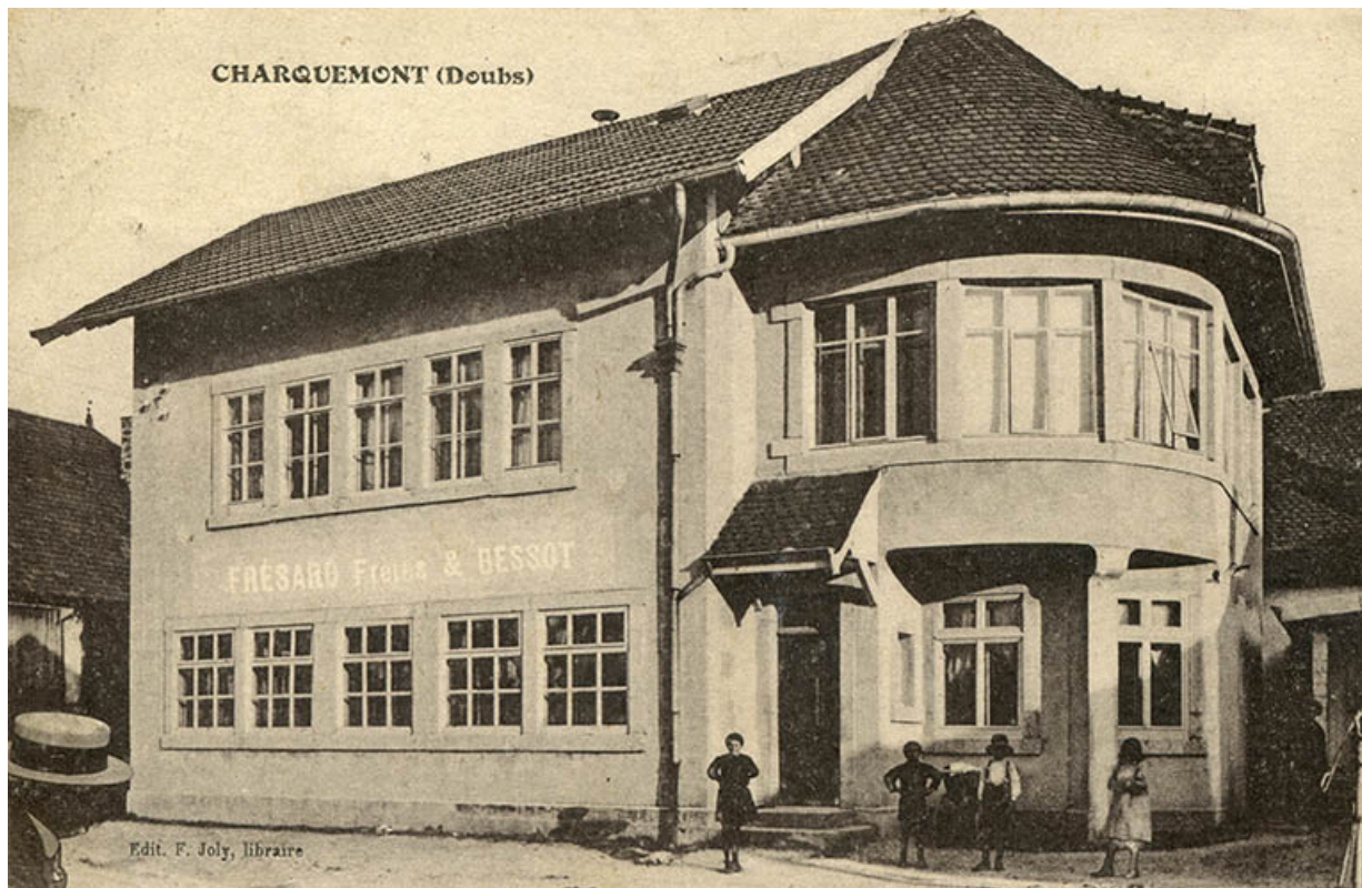
Charquemont (Doubs) [l'usine Frésard Frères et Bessot], entre 1911 et 1927. 25, Charquemont, 9 Grande Rue