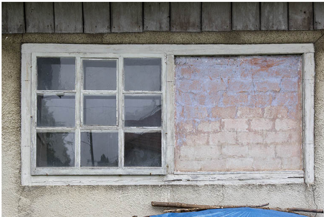
Façade latérale droite : fenêtres.