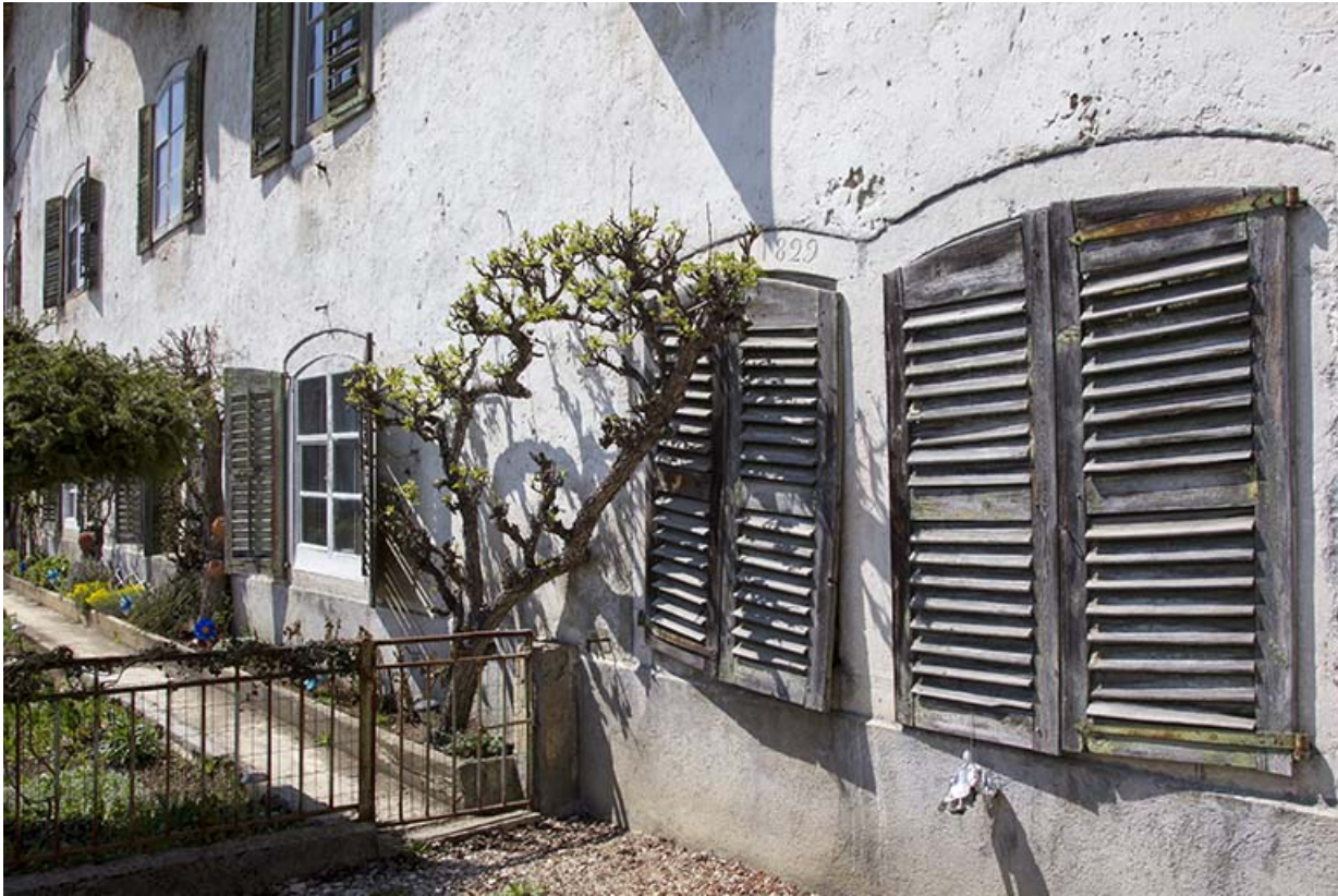
Façade antérieure : fenêtres horlogères à linteau délardé en arc segmentaire. 25, Charquemont, 9 Grande Rue