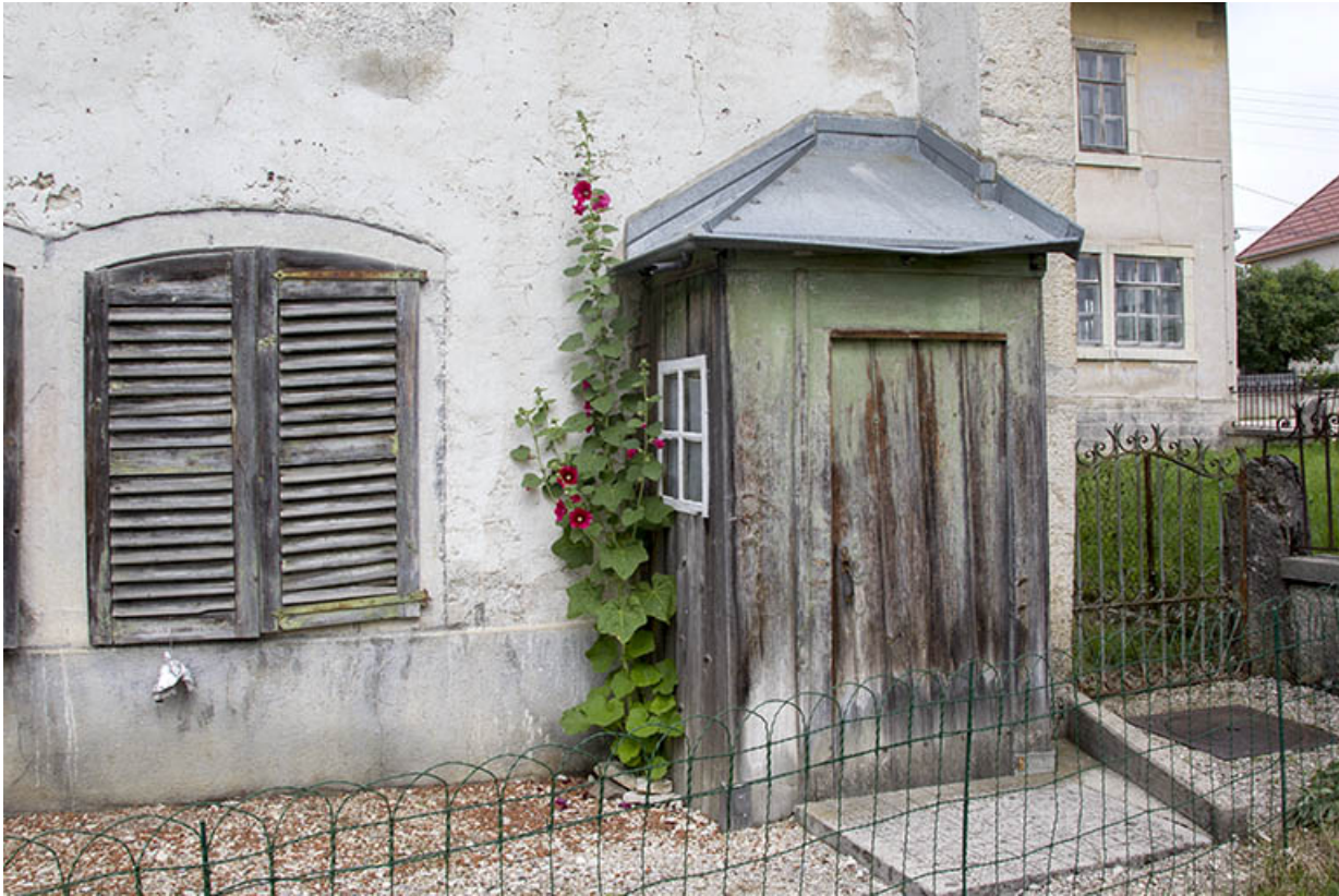
Façade antérieure : fenêtre du rez-de-chaussée et édicule.