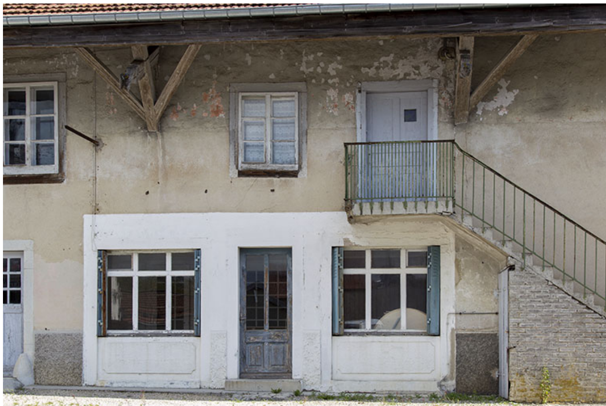
Façade latérale gauche : entrées au rez-de-chaussée et à l'étage. 25, Charquemont, 9 Grande Rue