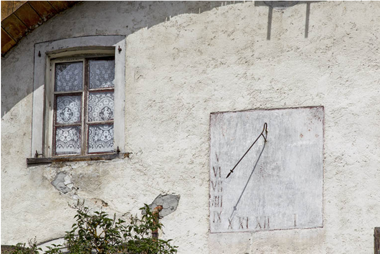
Façade antérieure : cadran solaire.