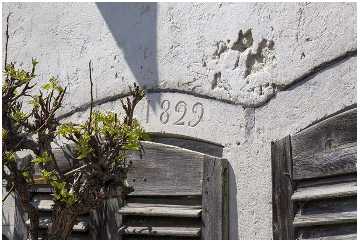
Façade antérieure : date inscrite sur le linteau d'une fenêtre du rez-de-chaussée. 25, Charquemont, 9 Grande Rue