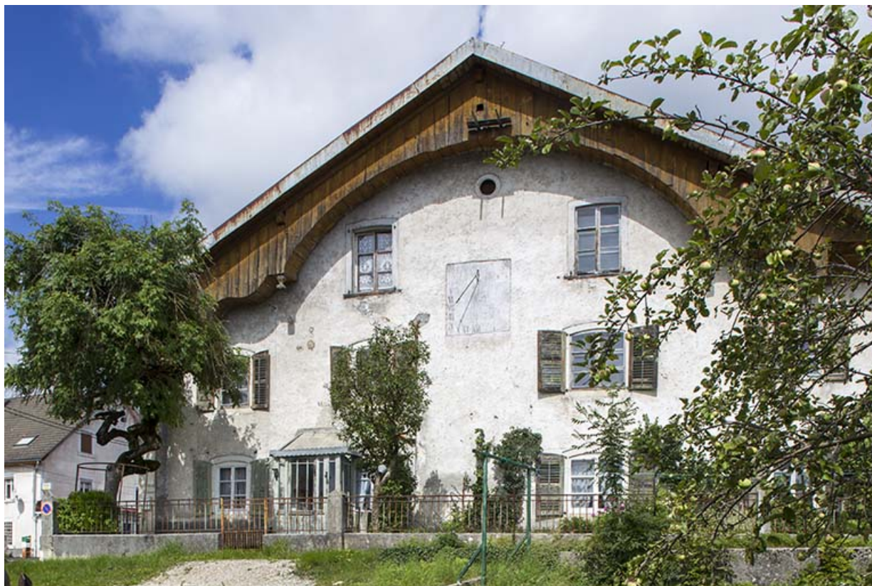
Façade antérieure. 25, Charquemont