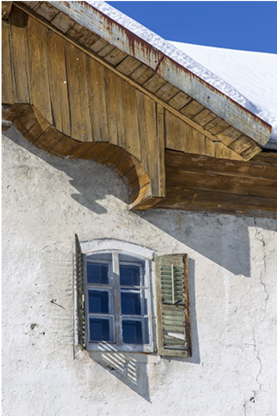
Façade antérieure : extrémité droite de la lambrichure et fenêtre. 25, Charquemont, 9 Grande Rue