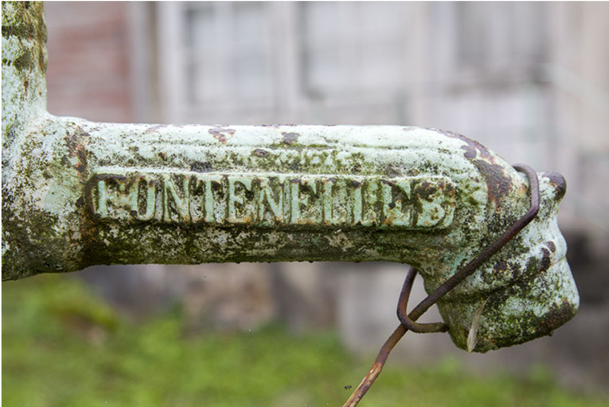
Pompe à eau : lieu de fabrication (Les Fontenelles).