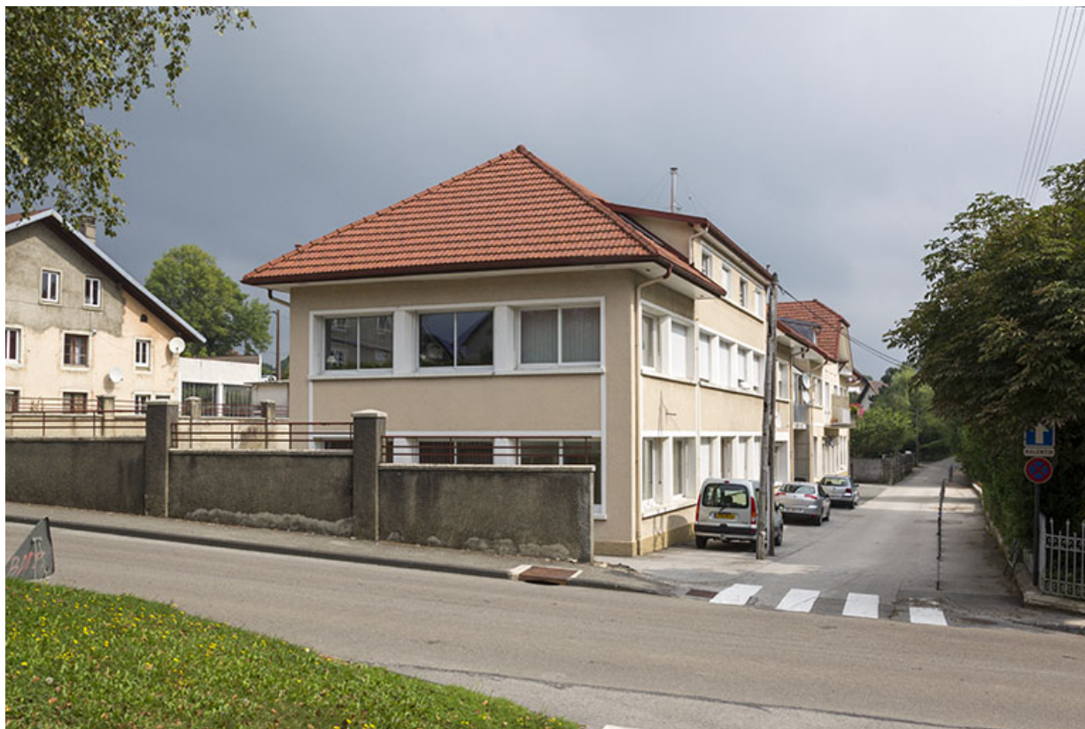
Vue d'ensemble, depuis le sud-ouest (façade latérale gauche).