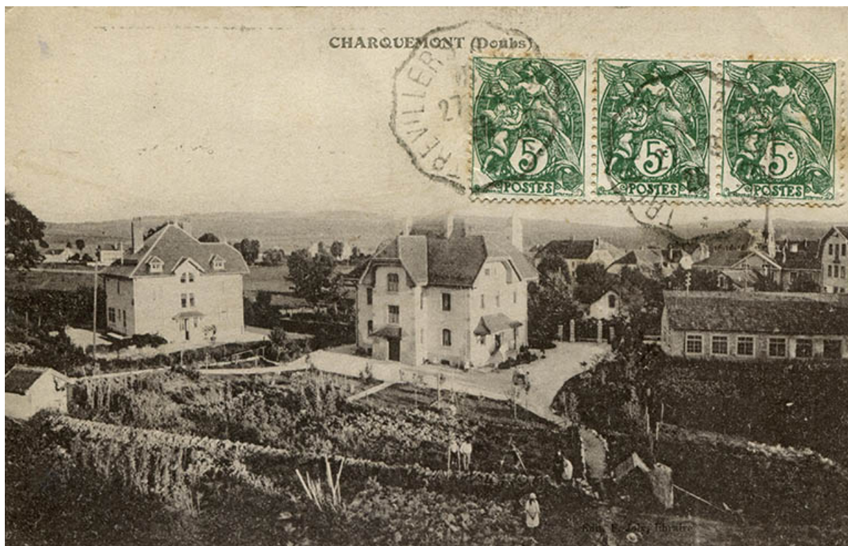
Charquemont (Doubs) [la rue Cuvier vue du nord], 1er quart 20e siècle (après 1918). 25, Charquemont, 4 rue Cuvier