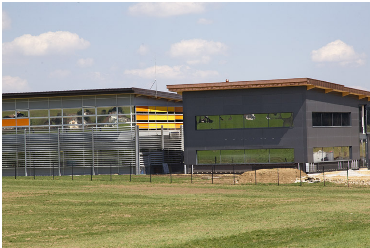
Atelier de 2013 et extrémité de celui de 2002.