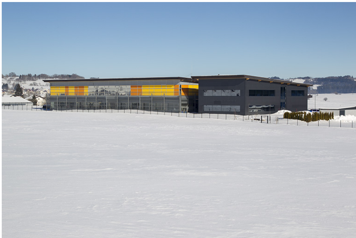
Une usine de 2002 (Sexer Loyrette Architecture) : usine de balanciers-spiraux Frésard Composants (4 rue Pierre Frésard). 25, Charquemont, 4 rue Pierre Frésard