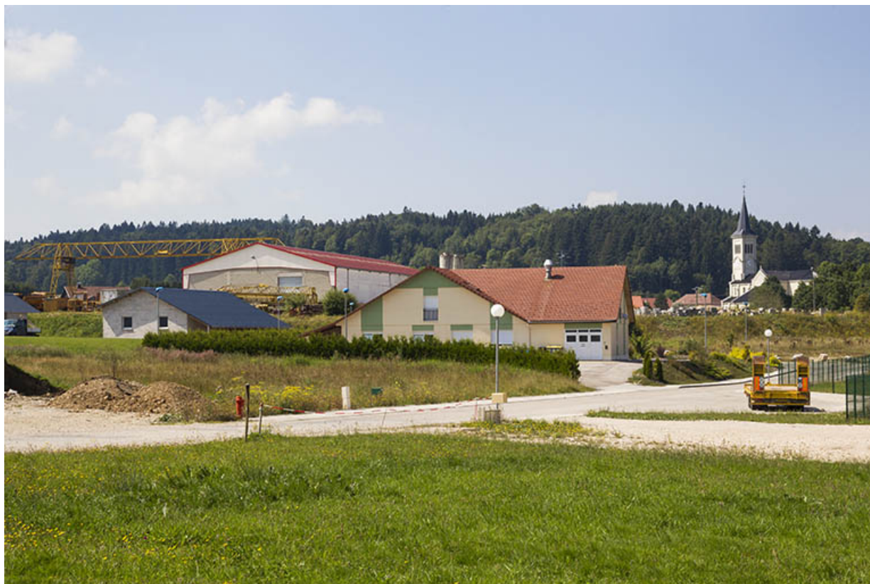
Vue d'ensemble, depuis l'est (façade postérieure).

25, Frambouhans, 14a rue des Louvières, lieudit : ZA la Baume