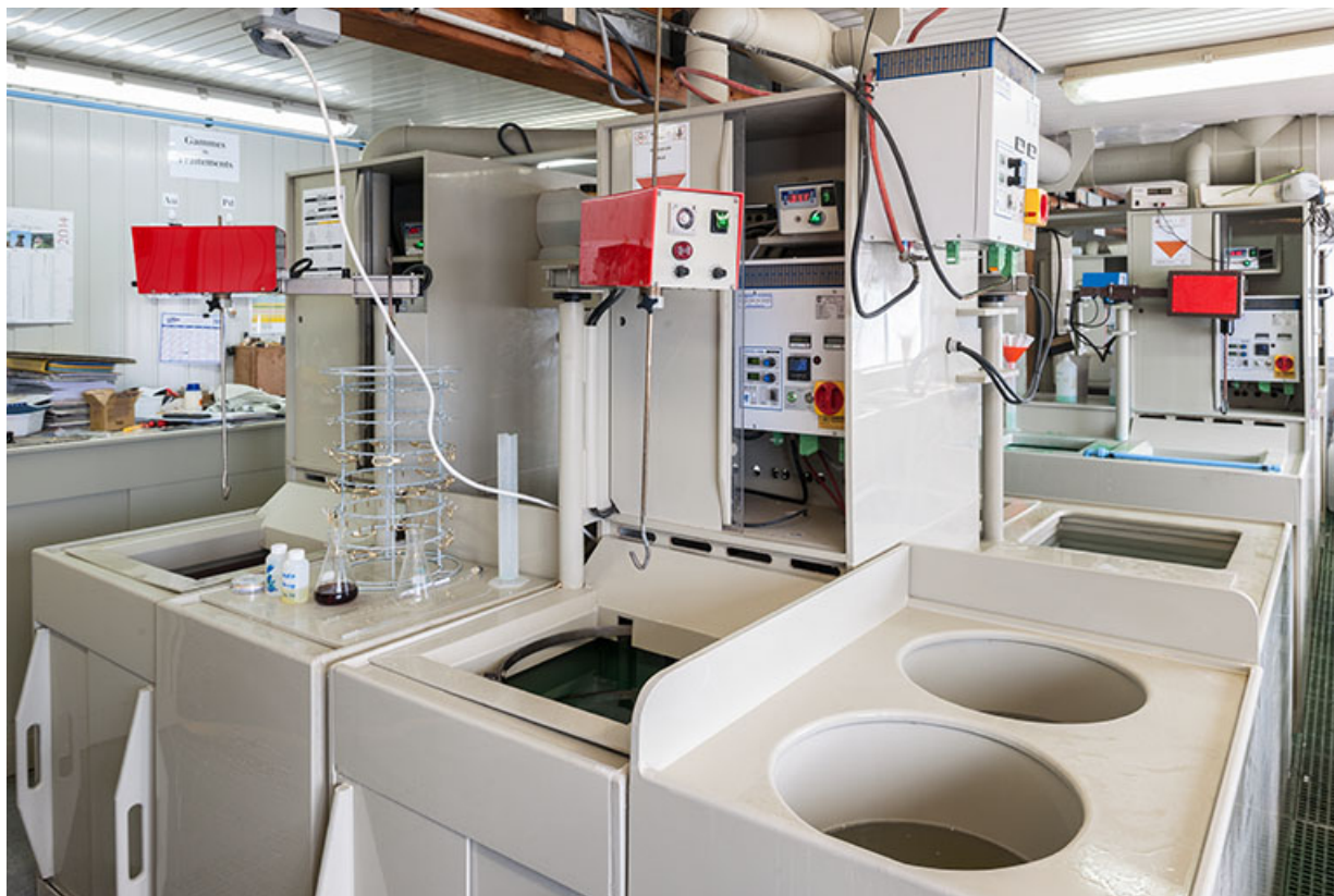
Usine : atelier de galvanoplastie. 25, Frambouhans, 4 rue de la Velle