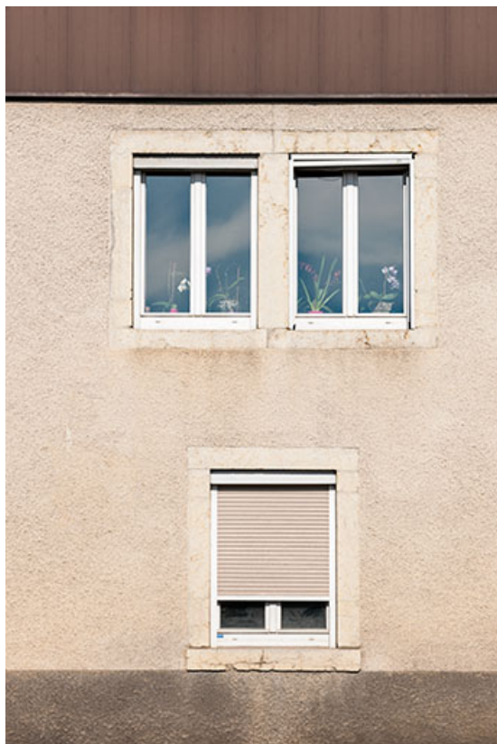
Ferme : fenêtres horlogères sur la partie droite de la façade antérieure. 25, Frambouhans, 4 rue de la Velle