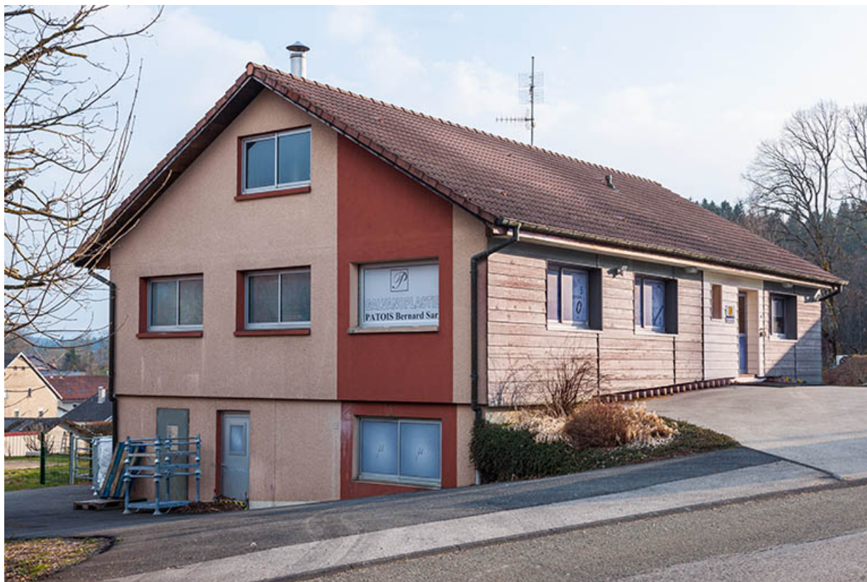
Usine : façade antérieure, de trois quarts gauche. 25, Frambouhans, 4 rue de la Velle