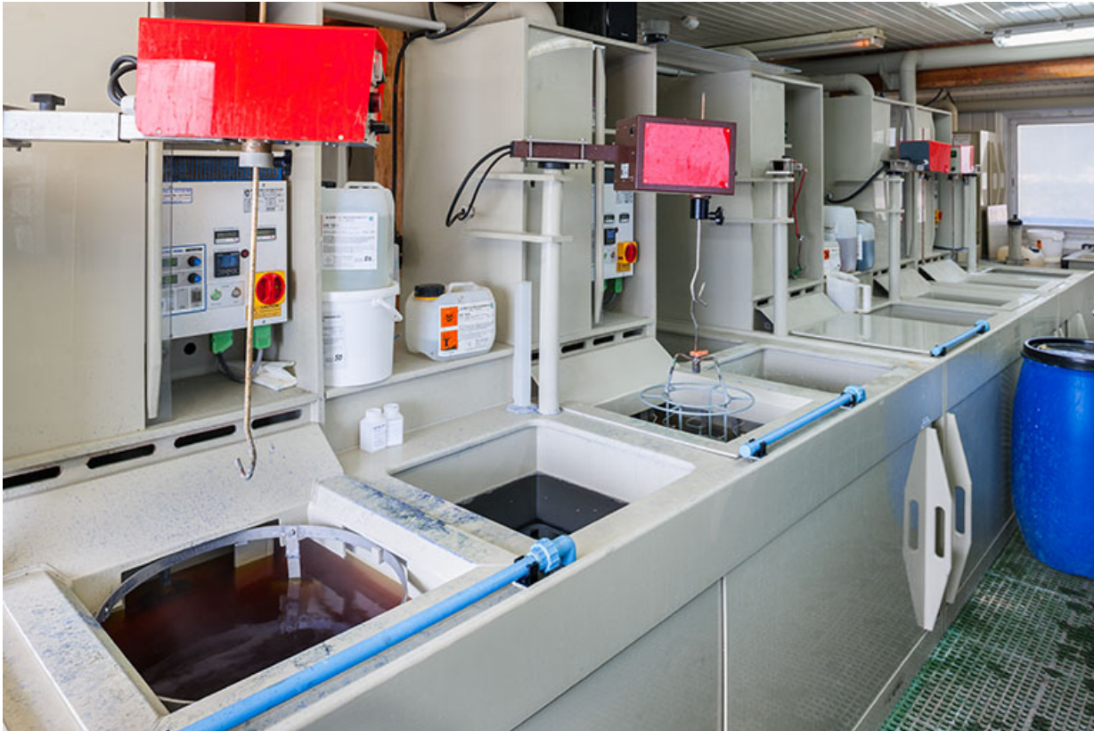
Usine : atelier de galvanoplastie (installations de l'îlot central depuis l'angle est). 25, Frambouhans, 4 rue de la Velle