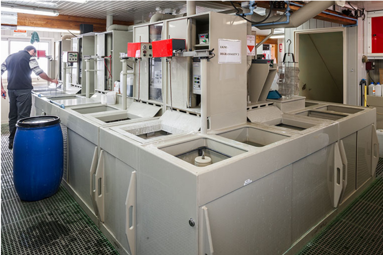
Usine : atelier de galvanoplastie (installations de l'îlot central depuis l'angle nord). 25, Frambouhans, 4 rue de la Velle