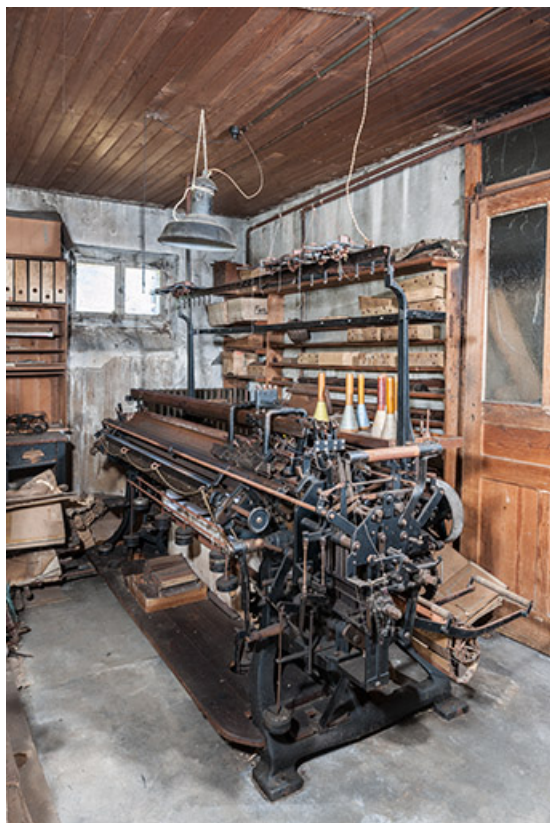
Machine à tricoter à plat.