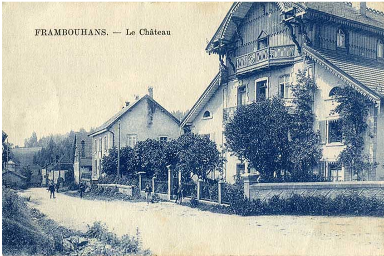
Frambouhans. - Le Château, carte postale, 1ère moitié 20e siècle (avant le 15 janvier 1928). 25, Frambouhans, 2 rue de la Bonneterie