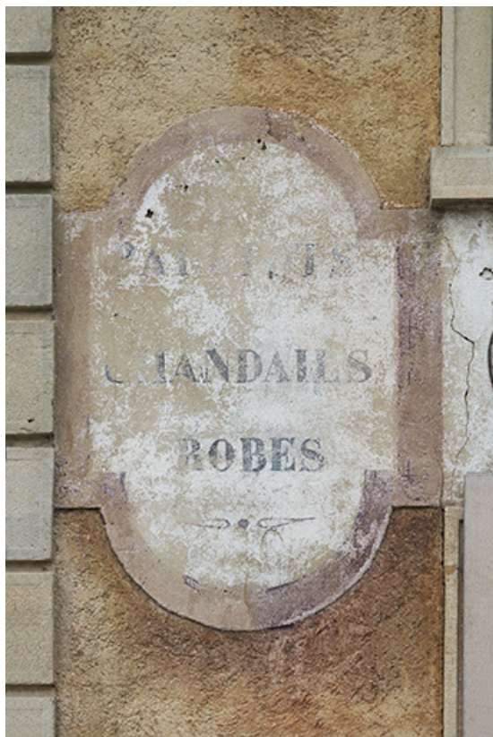
Usine : inscription, côté gauche de la façade antérieure. 25, Frambouhans, 2 rue de la Bonneterie