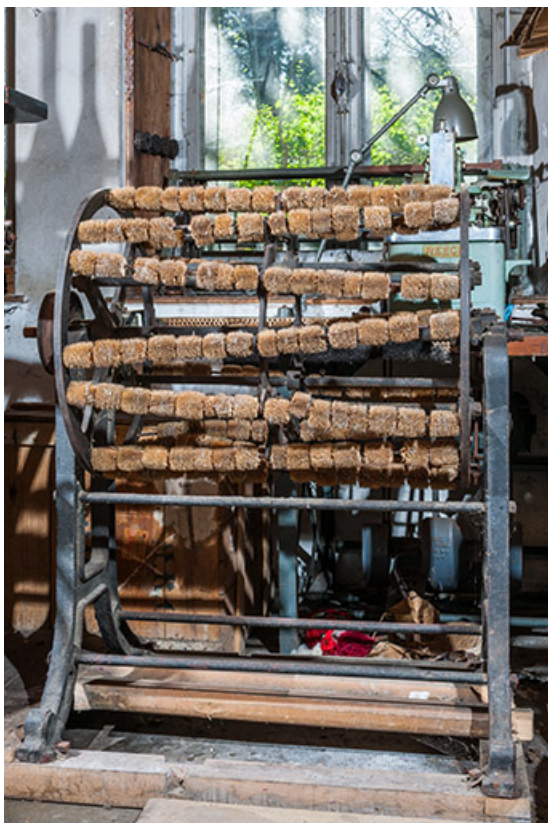
Machine à carder rotative.