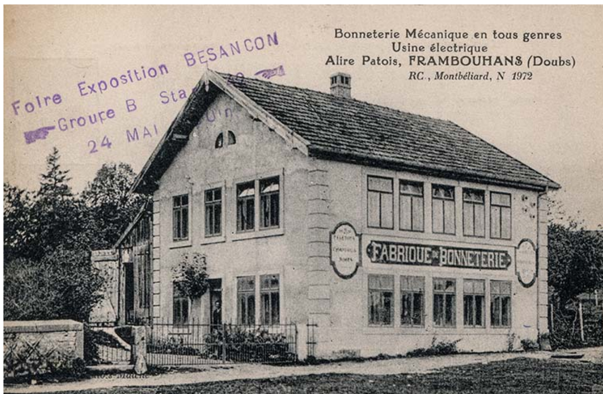
Bonneterie mécanique en tous genres. Usine électrique. Alire Patois, Frambouhans (Doubs) [...], entre 1920 et 1924 25, Frambouhans, 2 rue de la Bonneterie