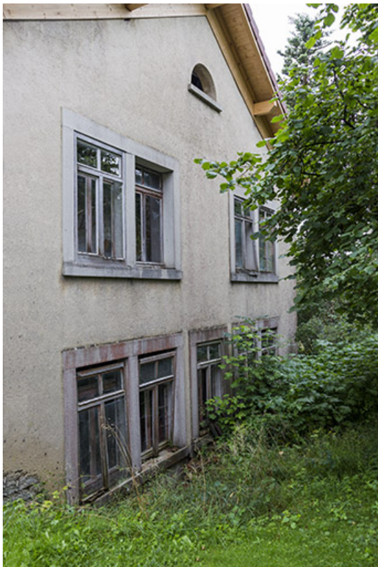
Usine : façade postérieure, de trois quarts gauche. 25, Frambouhans, 2 rue de la Bonneterie