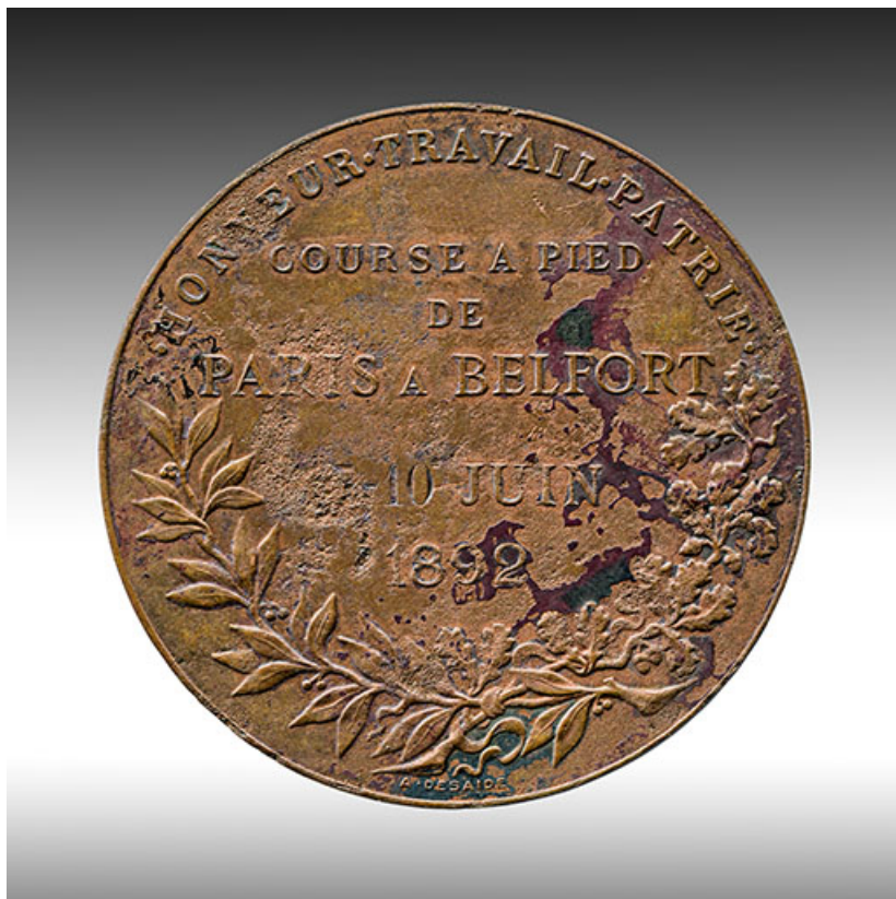
Médaille décernée à Jules Patois pour sa participation à la course à pied de Paris à Belfort du 5 au 10 juin 1892 (revers). 25, Frambouhans, 2 rue de la Bonneterie