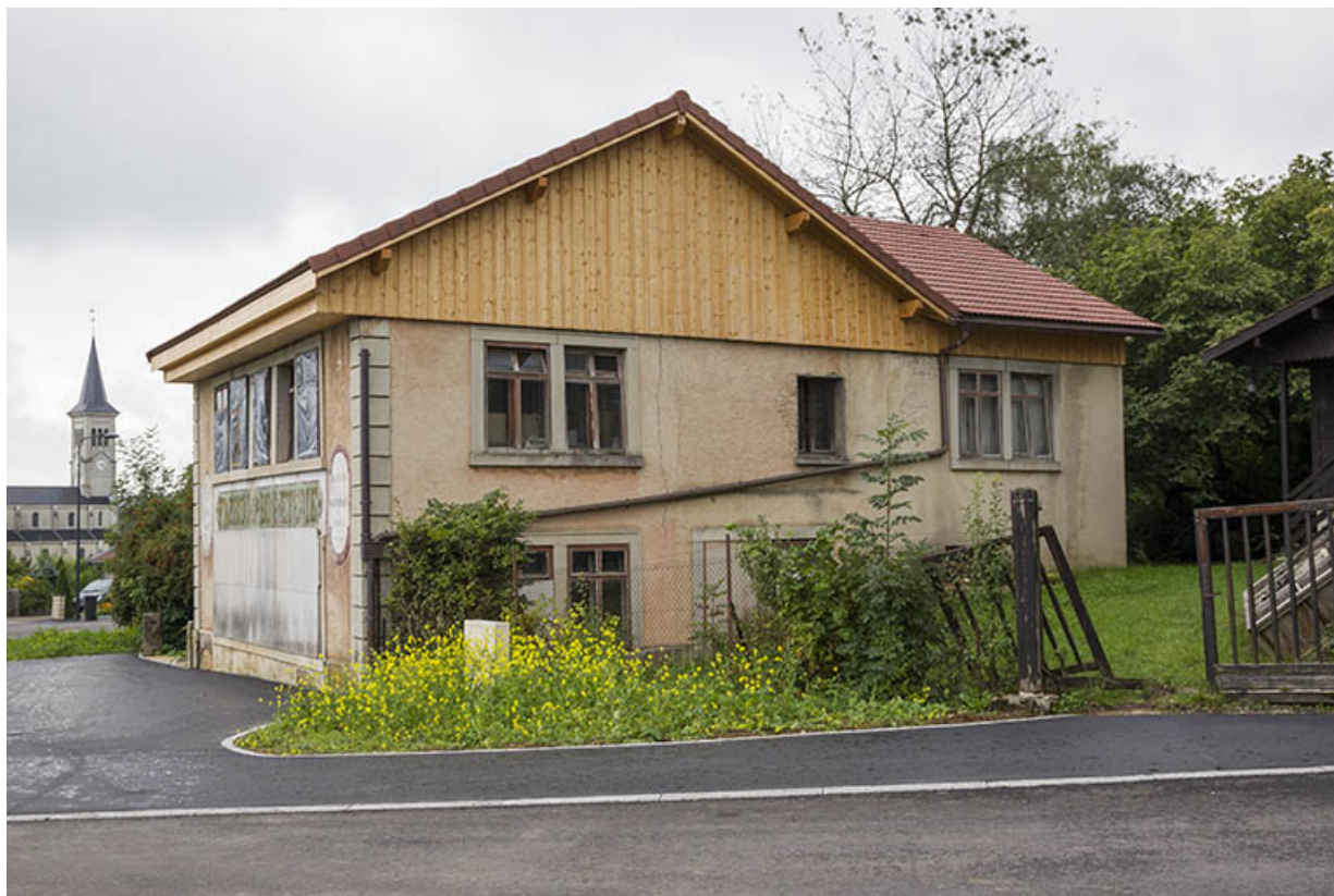
Usine : façade latérale droite (vue d'ensemble).