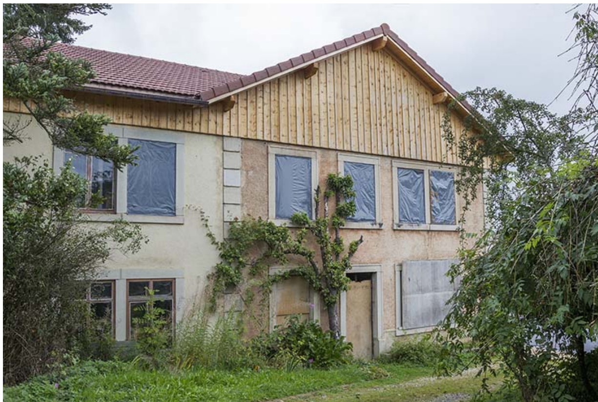
Uisne : façade latérale gauche (entrée).