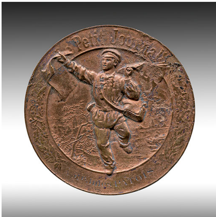
Médaille décernée à Jules Patois pour sa participation à la course à pied de Paris à Belfort du 5 au 10 juin 1892 (avers). 25, Frambouhans, 2 rue de la Bonneterie