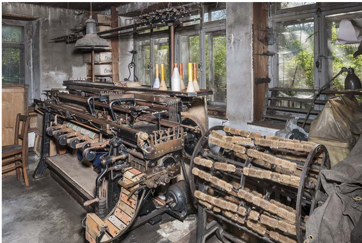
Machine à tricoter à plat (métier à mailles retournées Stoll & C°, à gauche) et machine à carder rotative (à droite). 25, Frambouhans, 2 rue de la Bonneterie