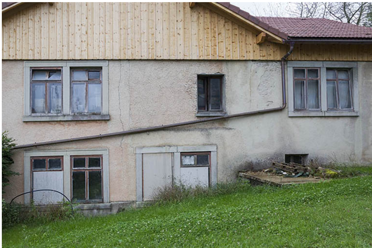
Usine : façade latérale droite.