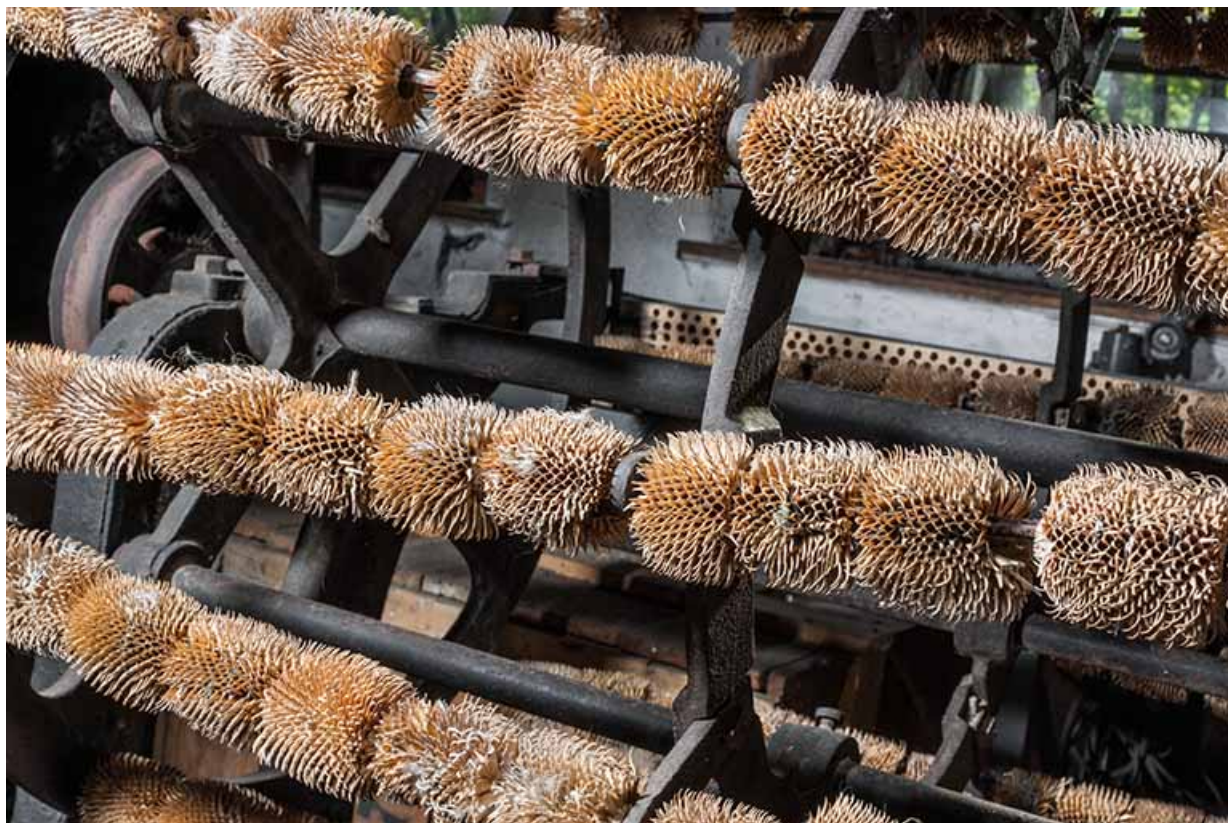
Machine à carder rotative : les cardères à foulon.