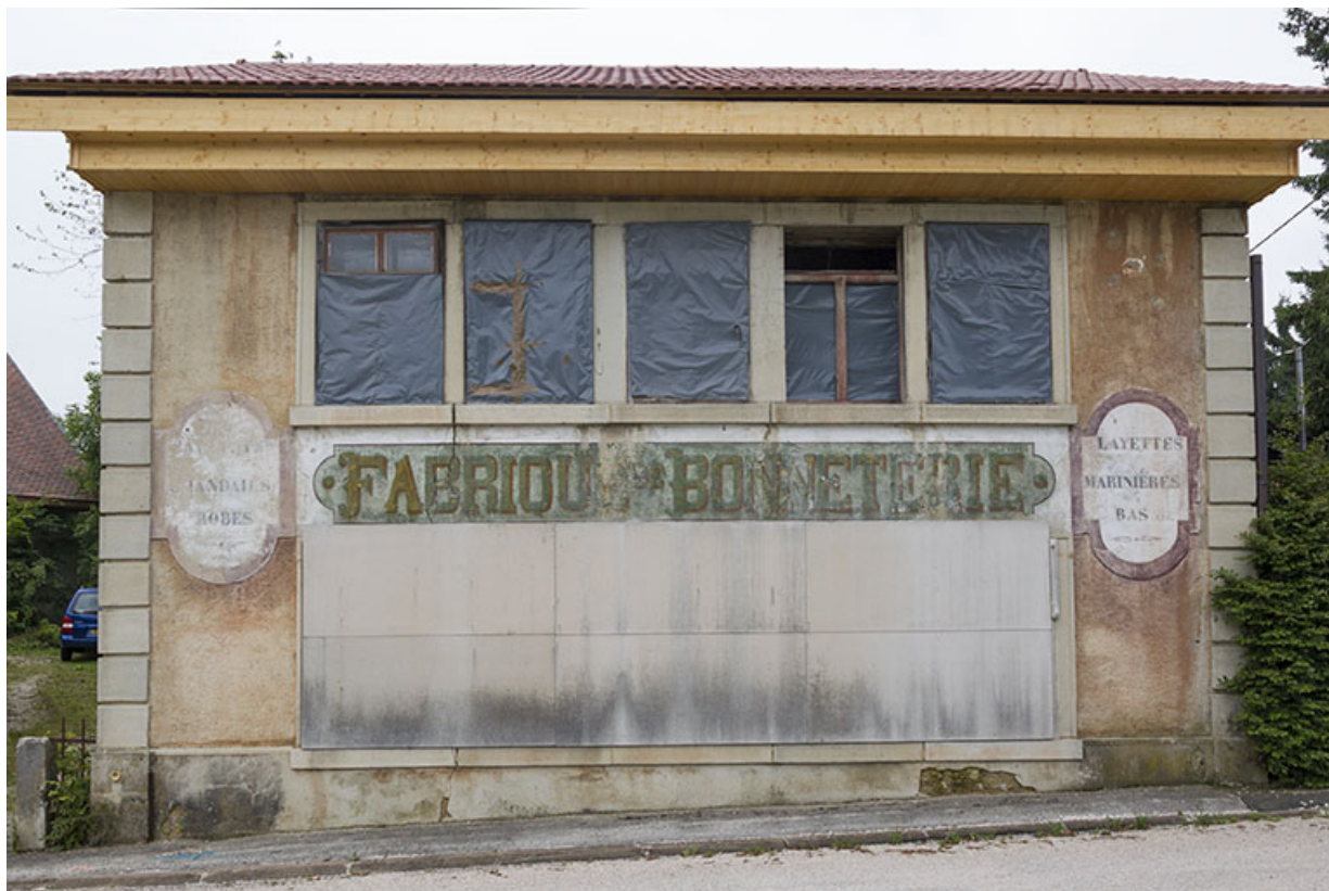
Usine : façade antérieure.