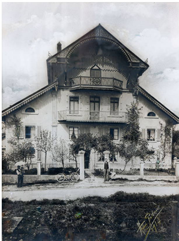
[Vue d'ensemble de l'ancienne ferme après surélévation], 1914 25, Frambouhans, 2 rue de la Bonneterie