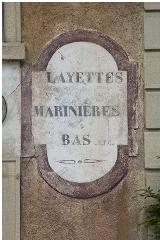
Usine : inscription, côté droit de la façade antérieure. 25, Frambouhans, 2 rue de la Bonneterie