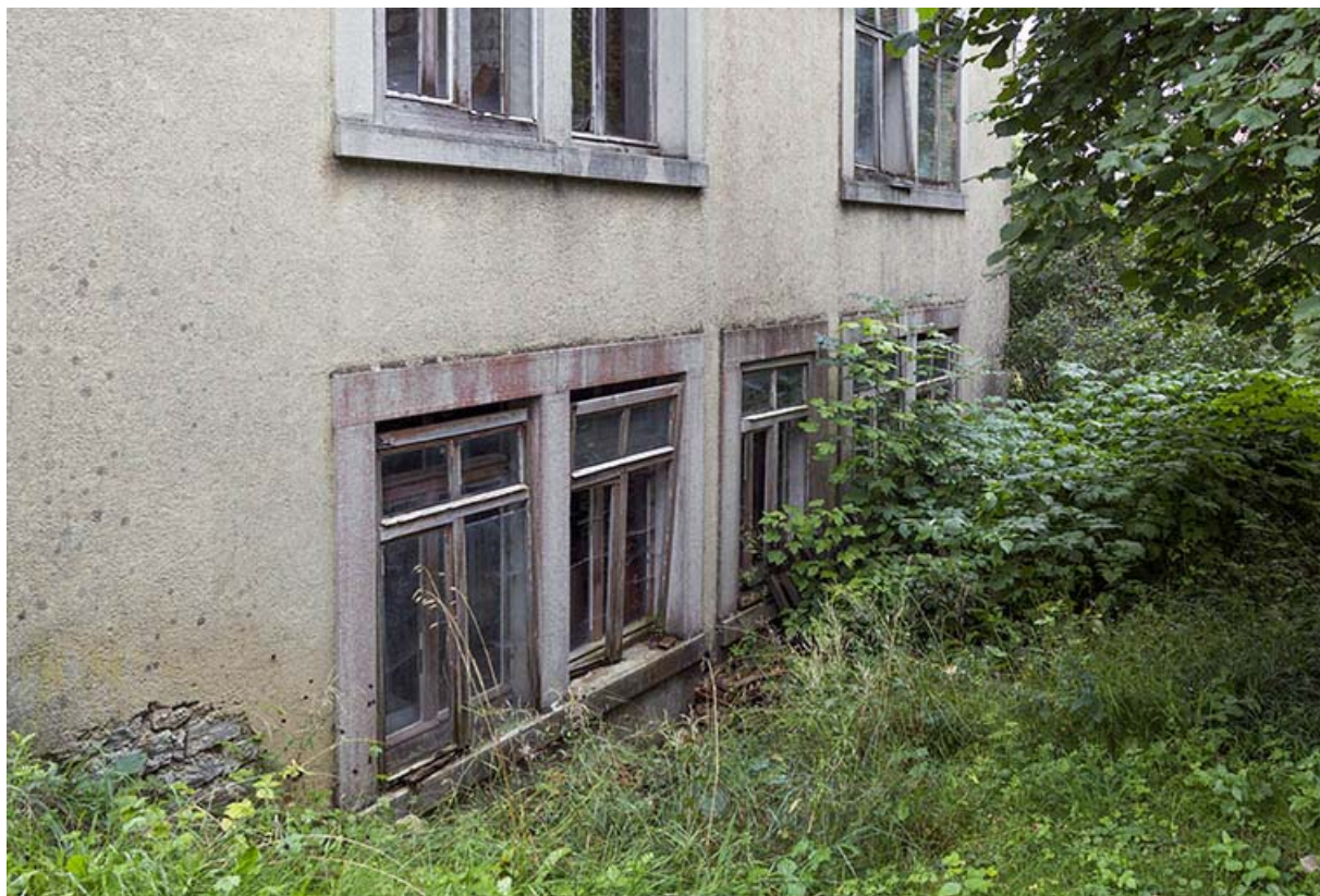
Usine : fenêtres de la façade postérieure, au rez-de-chaussée.