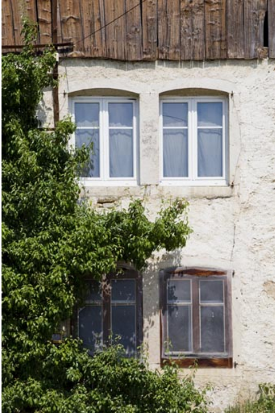
Travée de fenêtres doubles en façade.