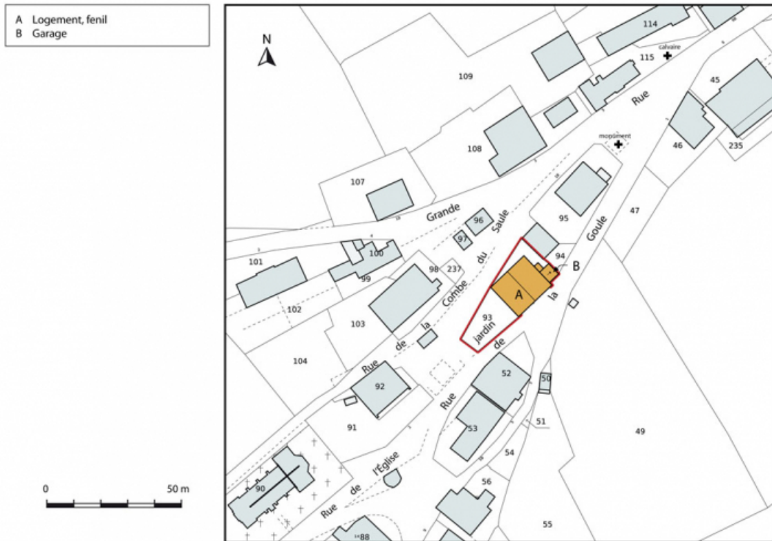
Plan-masse et de situation. Extrait du plan cadastral, 2013, section AC. 25, Charmauvillers, 2 rue de la Goule