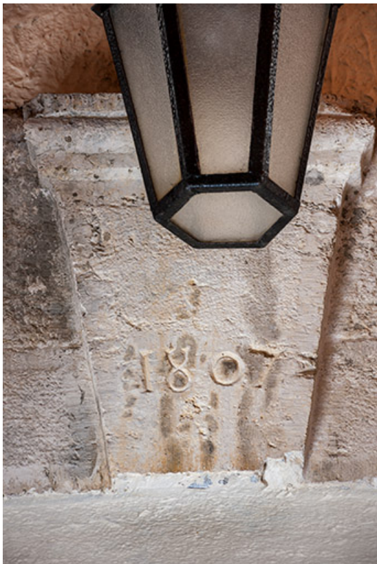
Ferme : date 1807 sur le linteau de l'entrée principale. 25, Fournet-Blancheroche, 3-5 rue Ulysse Robert