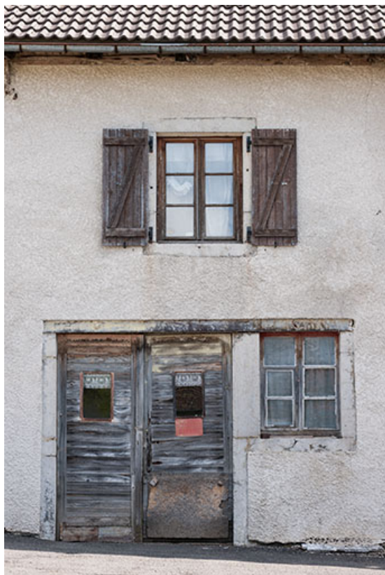
Ferme : porte et fenêtres sur la face latérale gauche. 25, Fournet-Blancheroche, 3-5 rue Ulysse Robert