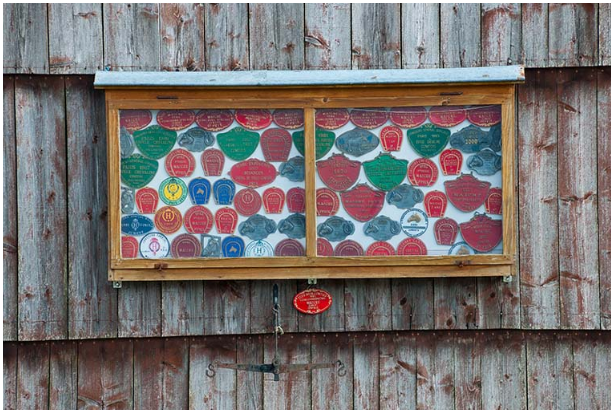
Ferme : prix obtenus lors de concours chevalins, fixés sur la façade postérieure.

25, Fournet-Blancheroche, 3-5 rue Ulysse Robert