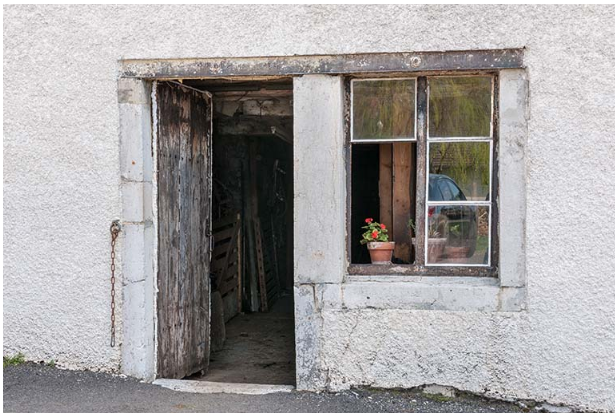
Ferme : porte et fenêtre sur la face latérale gauche.

25, Fournet-Blancheroche, 3-5 rue Ulysse Robert