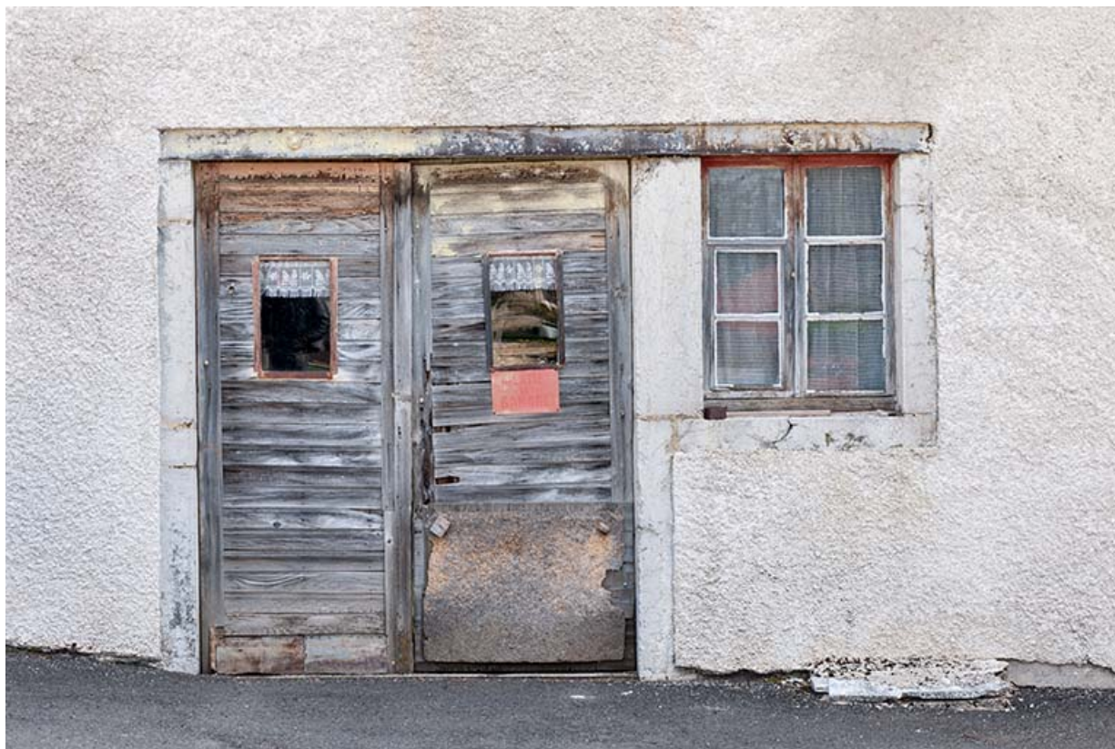
Ferme : porte et fenêtre sur la face latérale gauche.

25, Fournet-Blancheroche, 3-5 rue Ulysse Robert