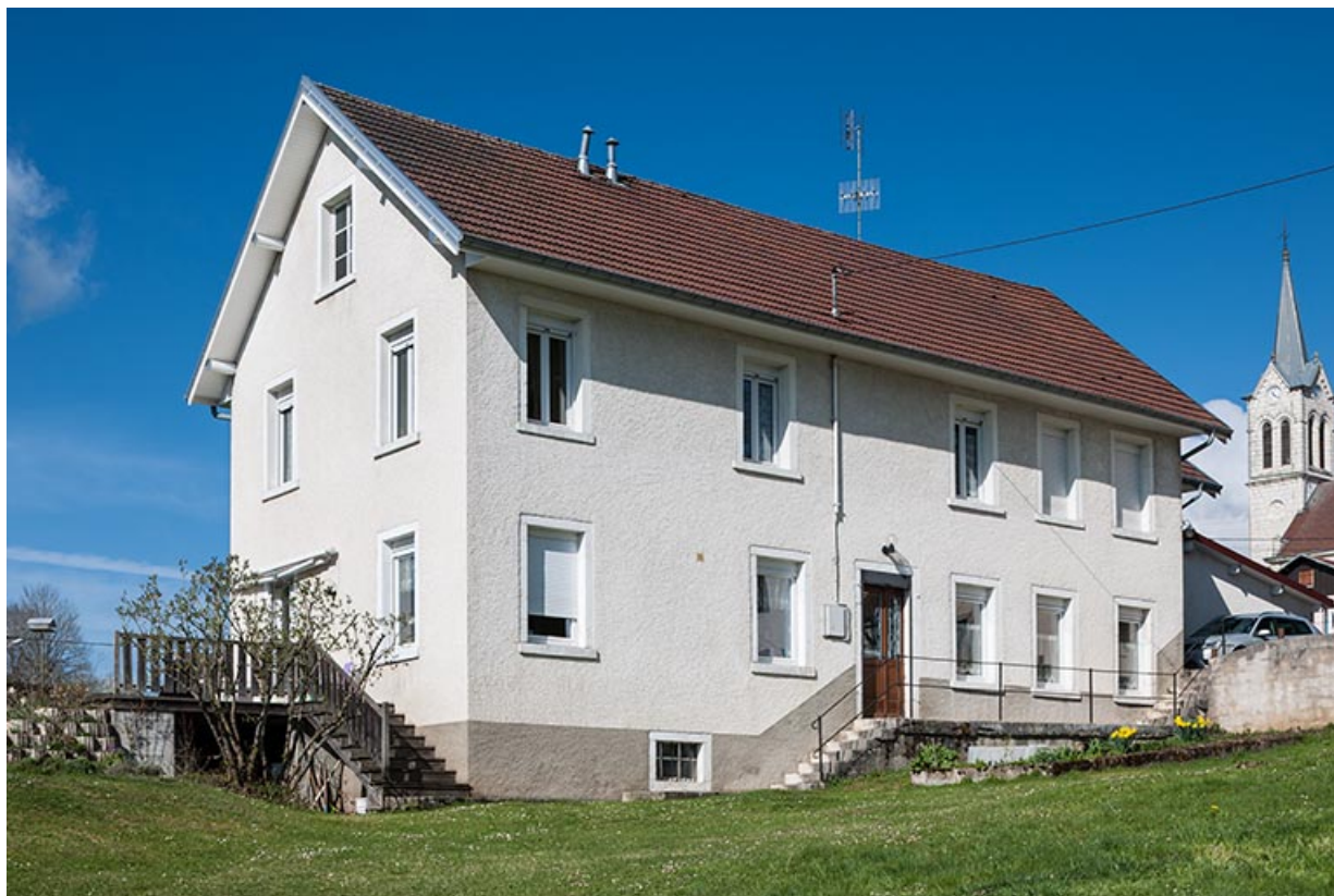
Atelier : façade antérieure, de trois quarts gauche.

25, Fournet-Blancheroche, 3-5 rue Ulysse Robert