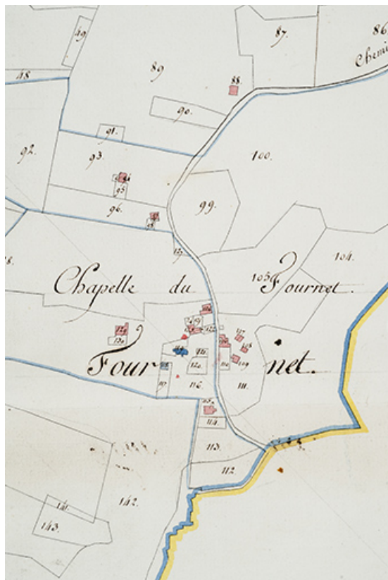
Plan-masse et de situation en 1811. Extrait du Plan cadastral parcellaire de la commune de Fournet [...] Section B du Fournet. 25, Fournet-Blancheroche, 3-5 rue Ulysse Robert