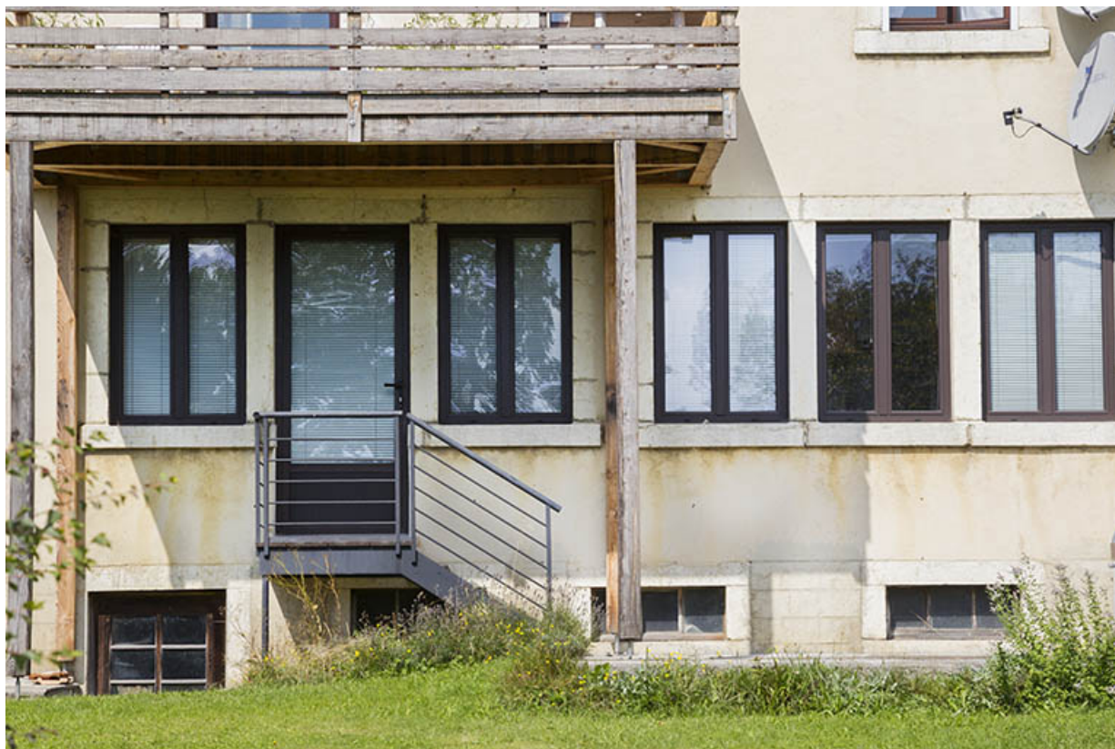
Façade postérieure : fenêtres de l'atelier.