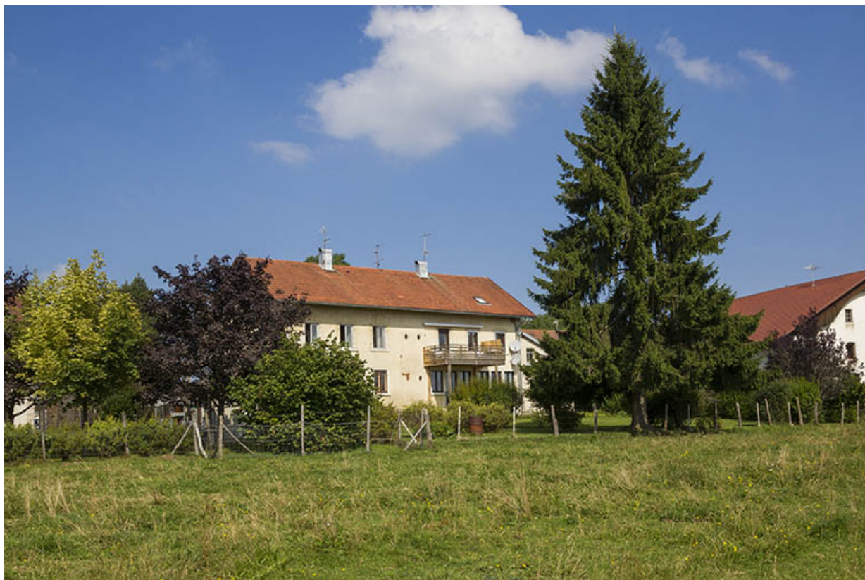
Vue d'ensemble, depuis l'est (façade postérieure).