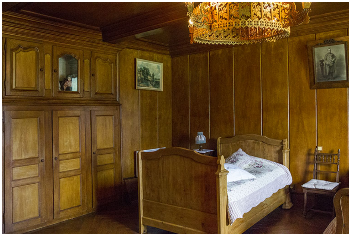
Partie sud : ancien salon ("poêle") transformé en chambre à coucher. 25, Les Écorces, 17 et 17 bis Grande Rue