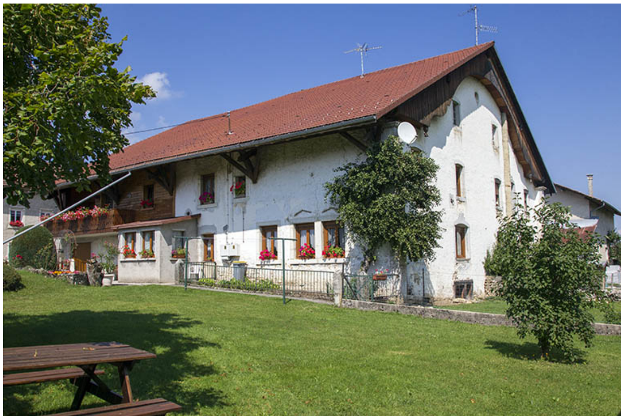
Façade sud, de trois quarts droite.

25, Les Écorces, 17 et 17 bis Grande Rue