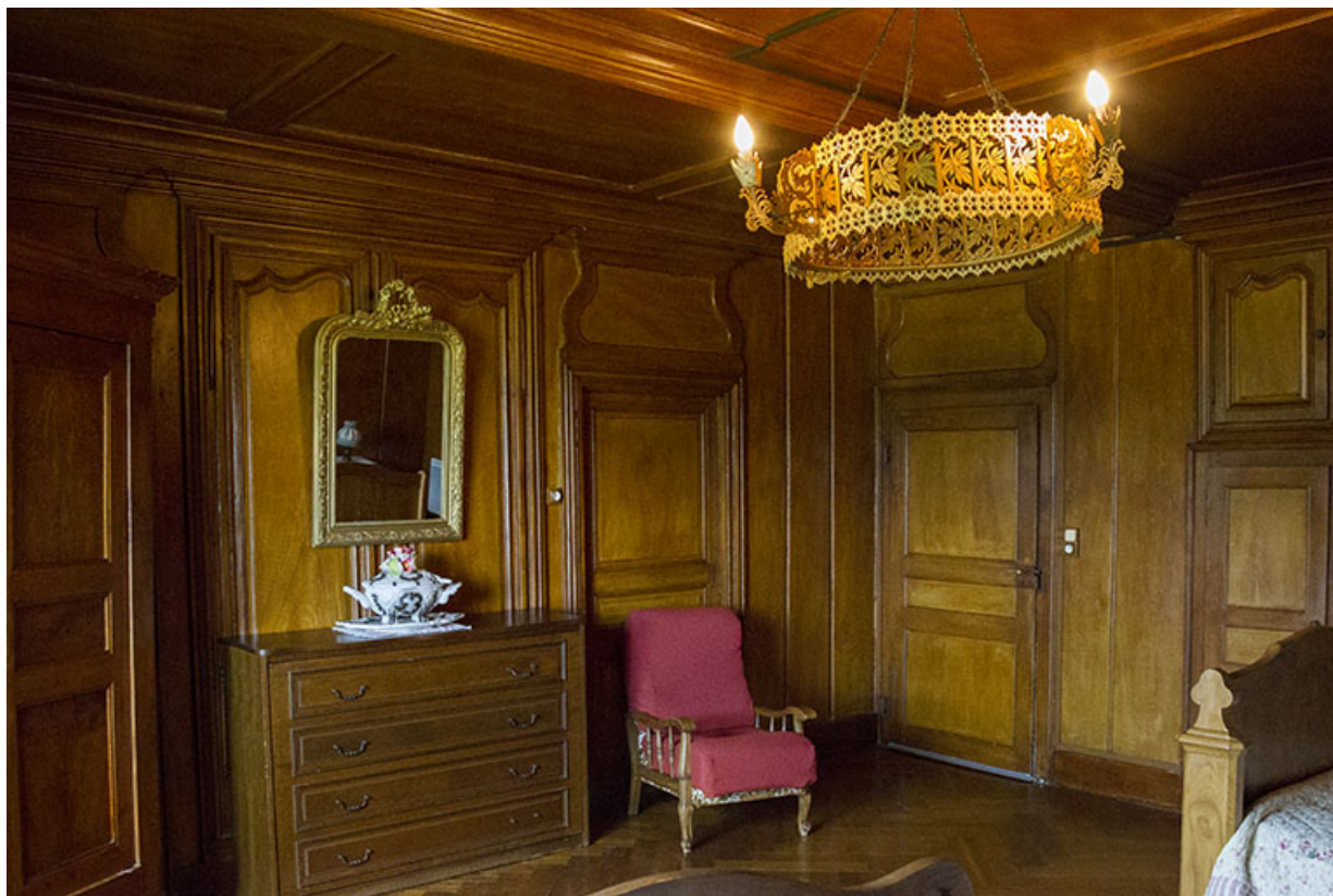
Partie sud : ancien salon ("poêle") transformé en chambre à coucher. 25, Les Écorces, 17 et 17 bis Grande Rue