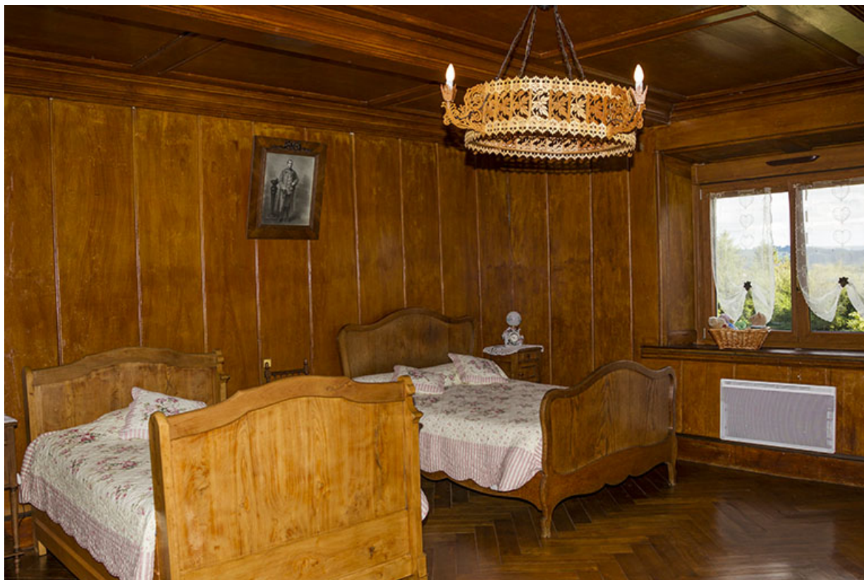
Partie sud : ancien salon ("poêle") transformé en chambre à coucher.

25, Les Écorces, 17 et 17 bis Grande Rue