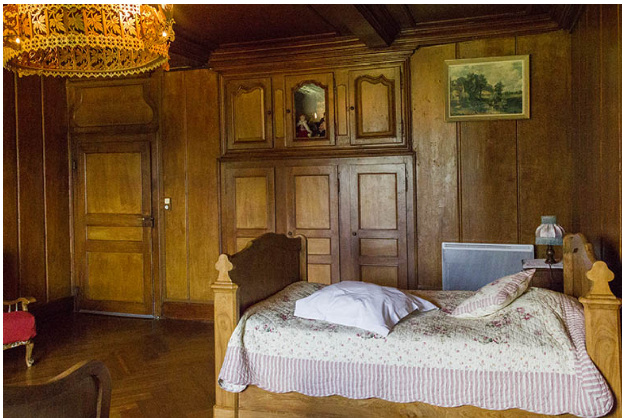
Partie sud : ancien salon ("poêle") transformé en chambre à coucher. 25, Les Écorces, 17 et 17 bis Grande Rue