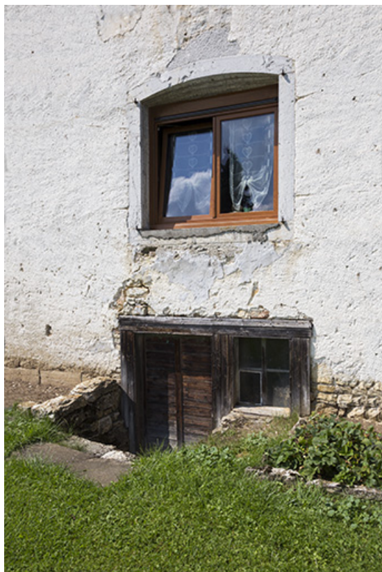
Façade est : accès au sous-sol et fenêtre de l'ancien salon.

25, Les Écorces, 17 et 17 bis Grande Rue