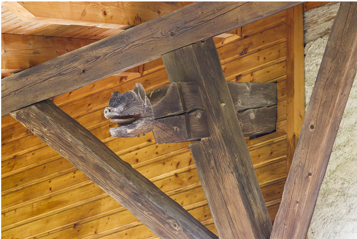
Façade sud : extrémité sculptée d'une pièce de la charpente supportant la toiture débordante. 25, Les Écorces, 17 et 17 bis Grande Rue