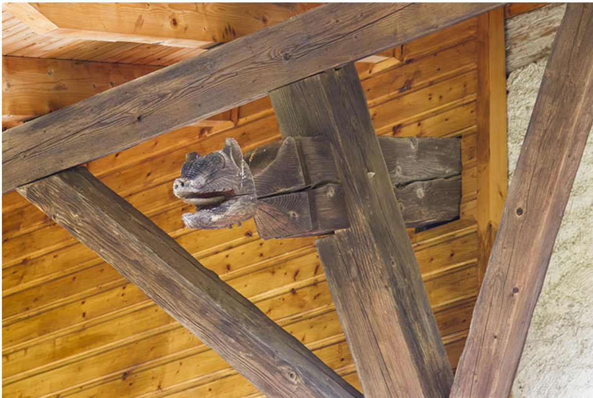
Façade sud : extrémité sculptée d'une pièce de la charpente supportant la toiture débordante. 25, Les Écorces, 17 et 17 bis Grande Rue