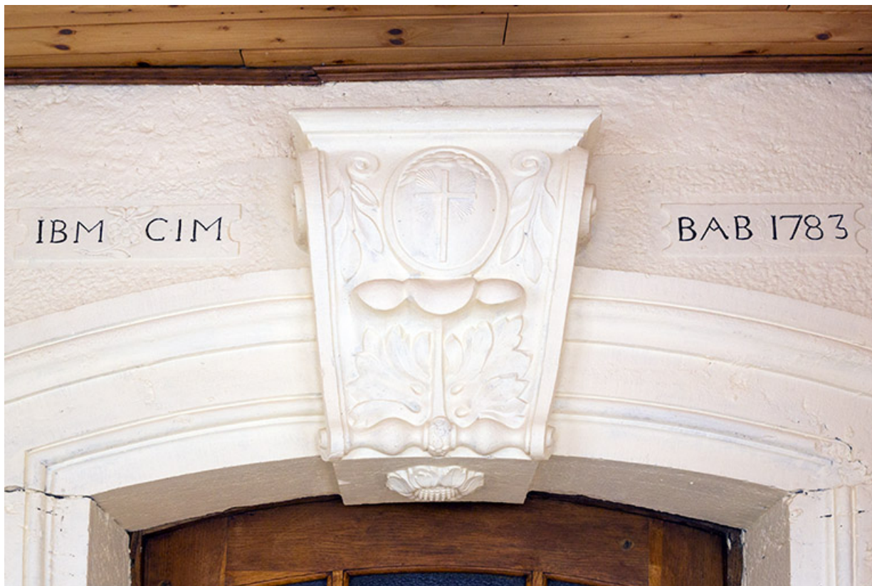
Façade sud : arc monolithe en béton avec sa fausse clef de voûte, des initiales et un chronogramme. 25, Les Écorces, 17 et 17 bis Grande Rue