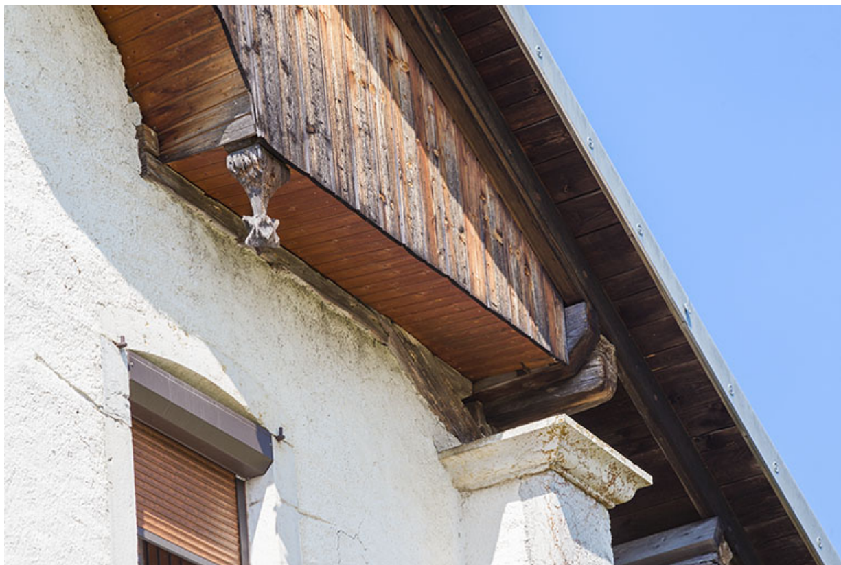
Façade est : chapiteau d'une coche et motif décoratif ornant l'extrémité pendante d'un poteau de la lambrichure. 25, Les Écorces, 17 et 17 bis Grande Rue