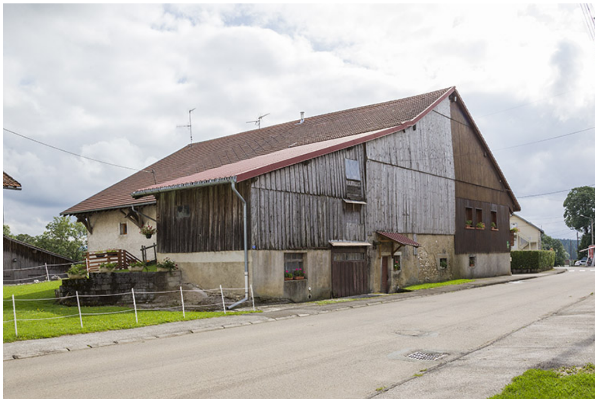
Partie nord côté rue, avec au premier-plan l'extension ancienne.

25, Les Écorces, 17 et 17 bis Grande Rue