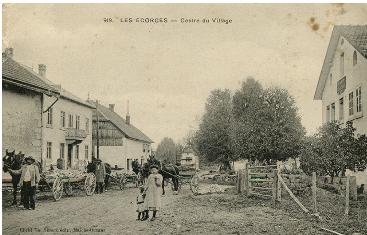
919. Les Ecorces - Centre du Village [façade antérieure, de trois quarts droite], 1er quart 20e siècle. 25, Les Écorces, 8 Grande Rue