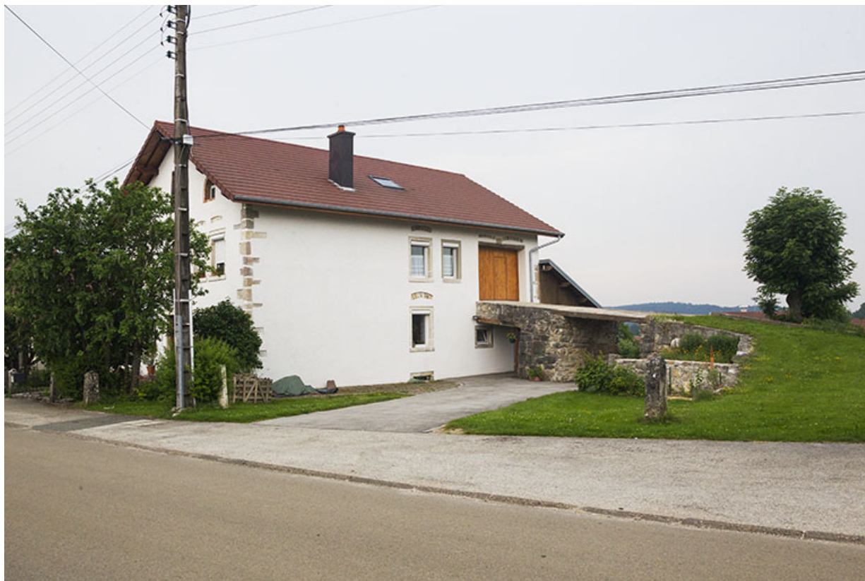
Façade latérale droite et pont de grange.