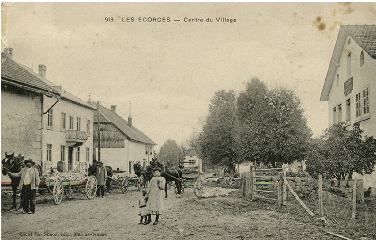
919. Les Ecorces - Centre du Village [façade antérieure, de trois quarts droite], 1er quart 20e siècle. 25, Les Écorces, 8 Grande Rue