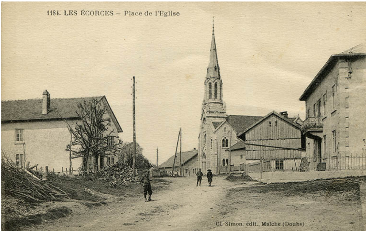
1184. Les Ecorces - Place de l'Eglise [façades antérieure et latérale gauche], limite 19e siècle 20e siècle. 25, Les Écorces, 8 Grande Rue