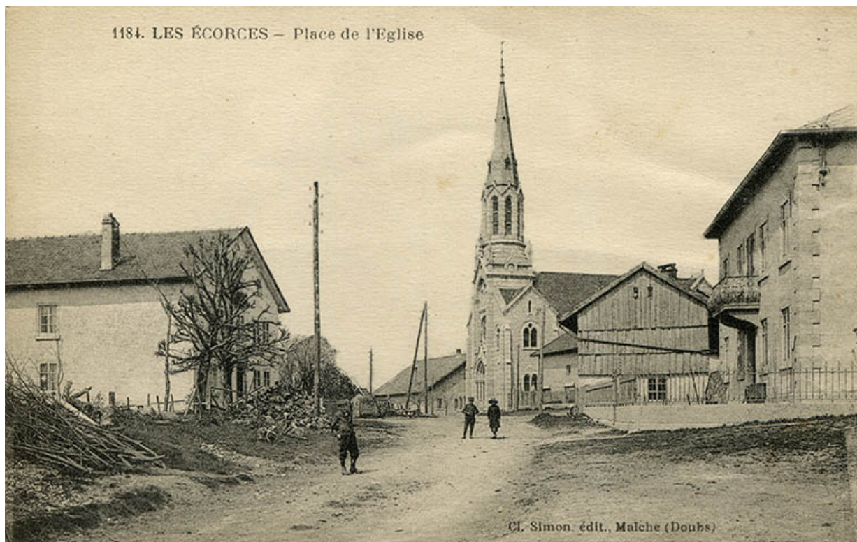
1184. Les Ecorces - Place de l'Eglise [façades antérieure et latérale gauche], limite 19e siècle 20e siècle. 25, Les Écorces, 8 Grande Rue