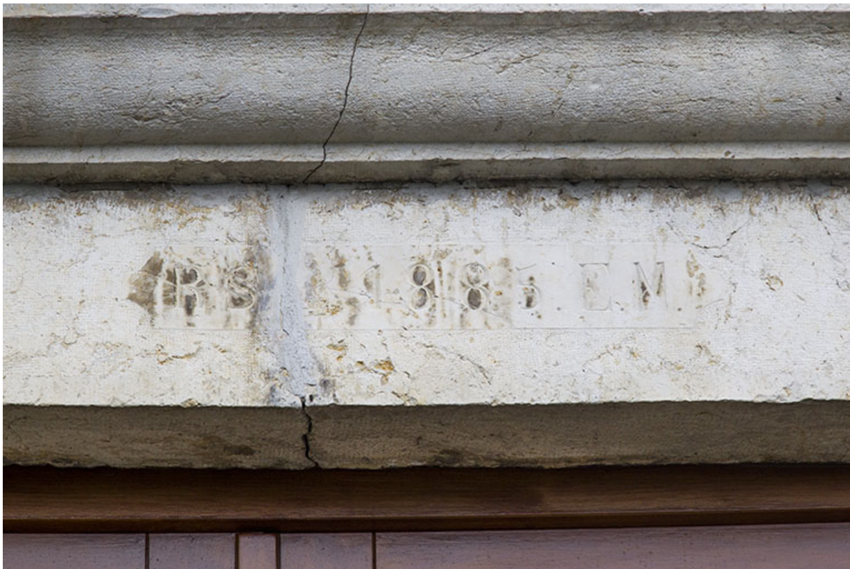
Linteau de l'entrée daté.