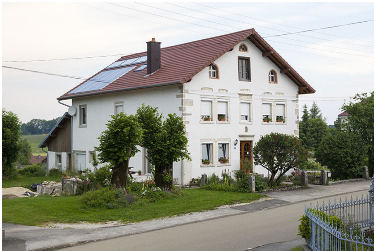
Vue d'ensemble, de trois quarts gauche. 25, Les Écorces, 8 Grande Rue