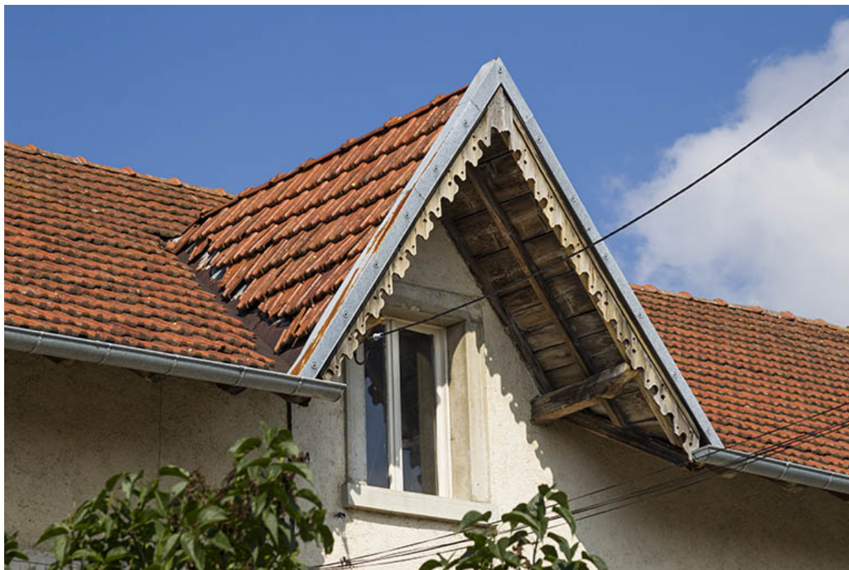
Maison au 14 Grande Rue : lucarne sur la façade antérieure.