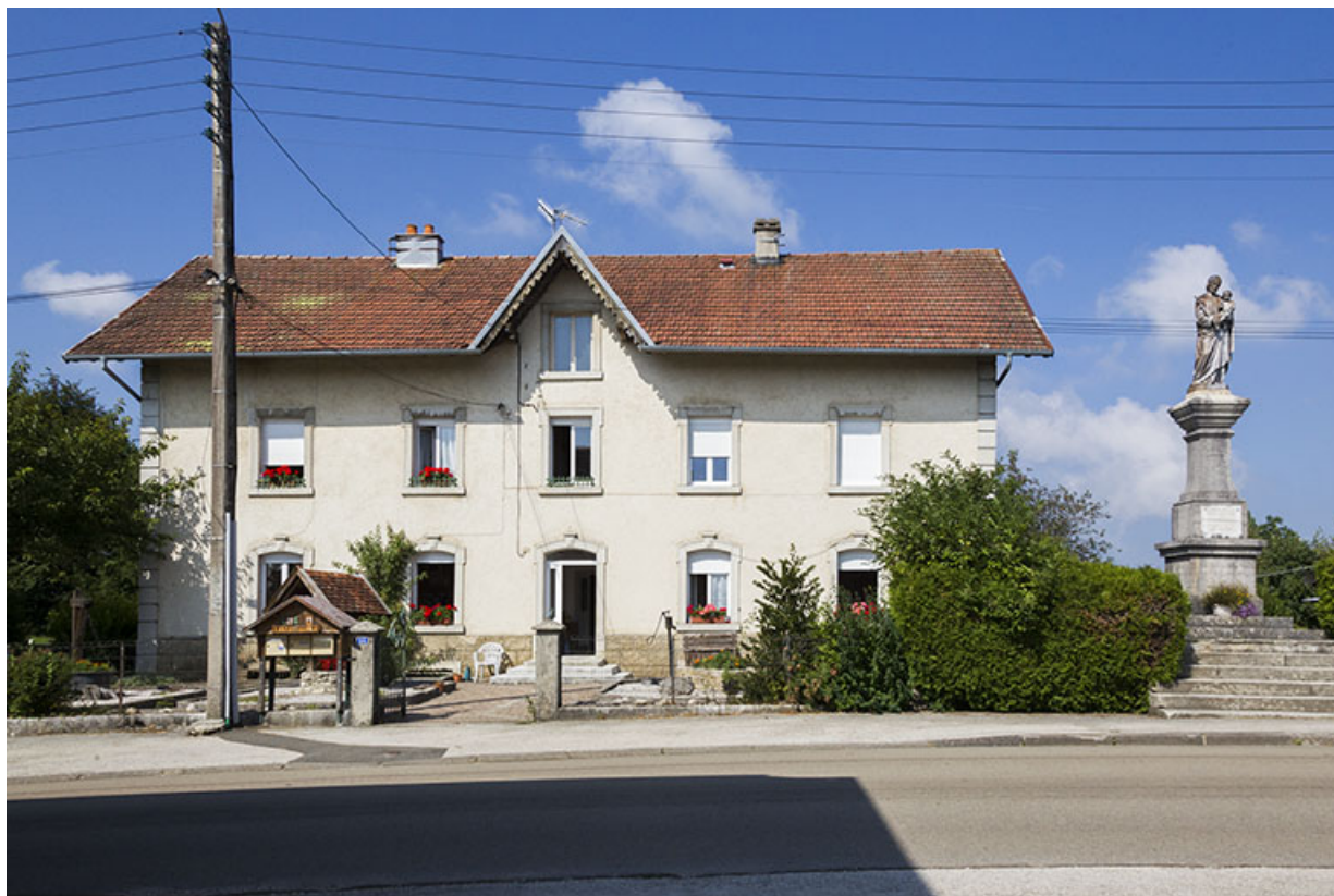
Maison au 14 Grande Rue : façade antérieure.