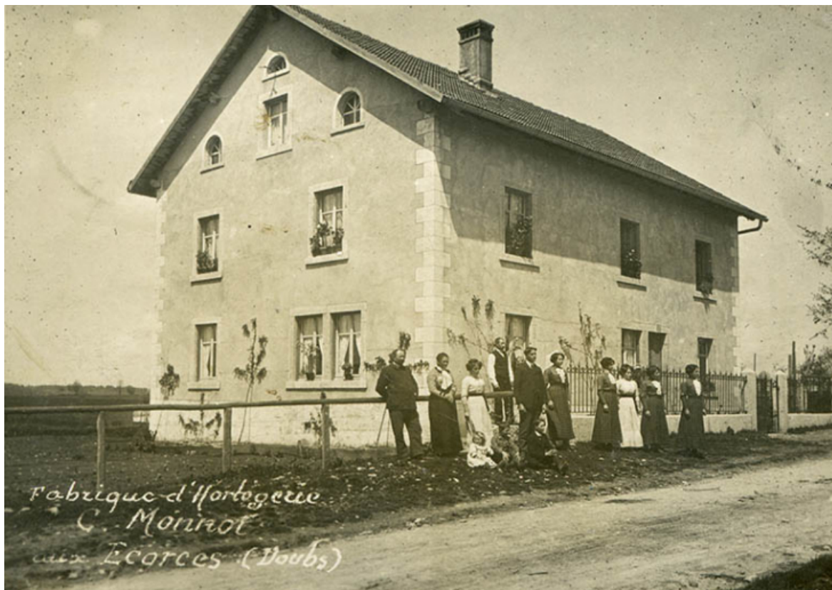
Fabrique d'horlogerie C. Monnot aux Écorces (Doubs) [le bâtiment vu de trois quarts gauche], 1er quart 20e siècle (avant 1912). Constant Monnot (à gauche) et sa famille (Laurent est visible à l'arrière-plan). 25, Les Écorces, 12, 14 Grande Rue