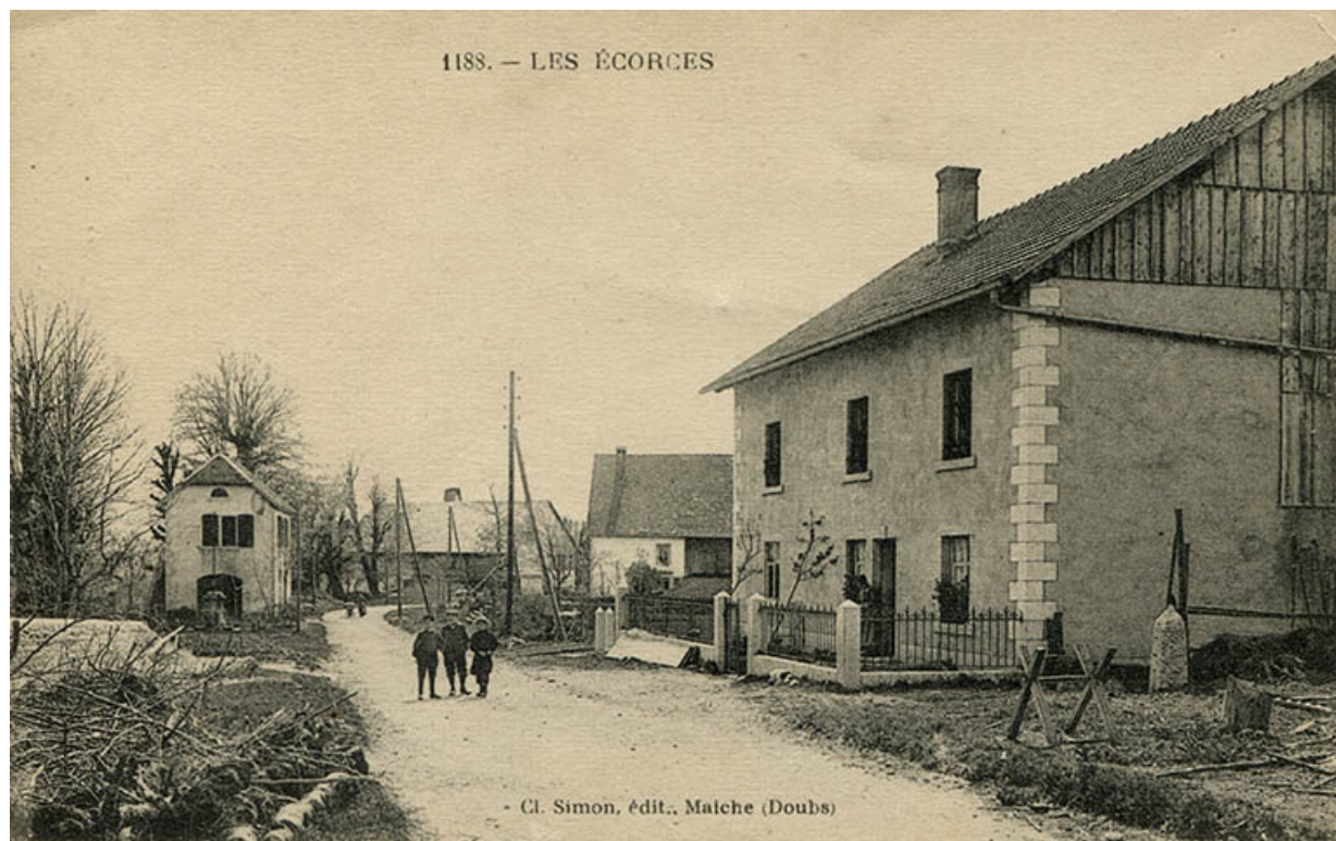
1188. - Les Écorces [la fabrique C. Monnot vue de trois quarts droite], 1er quart 20e siècle (avant 1914). 25, Les Écorces, 12, 14 Grande Rue