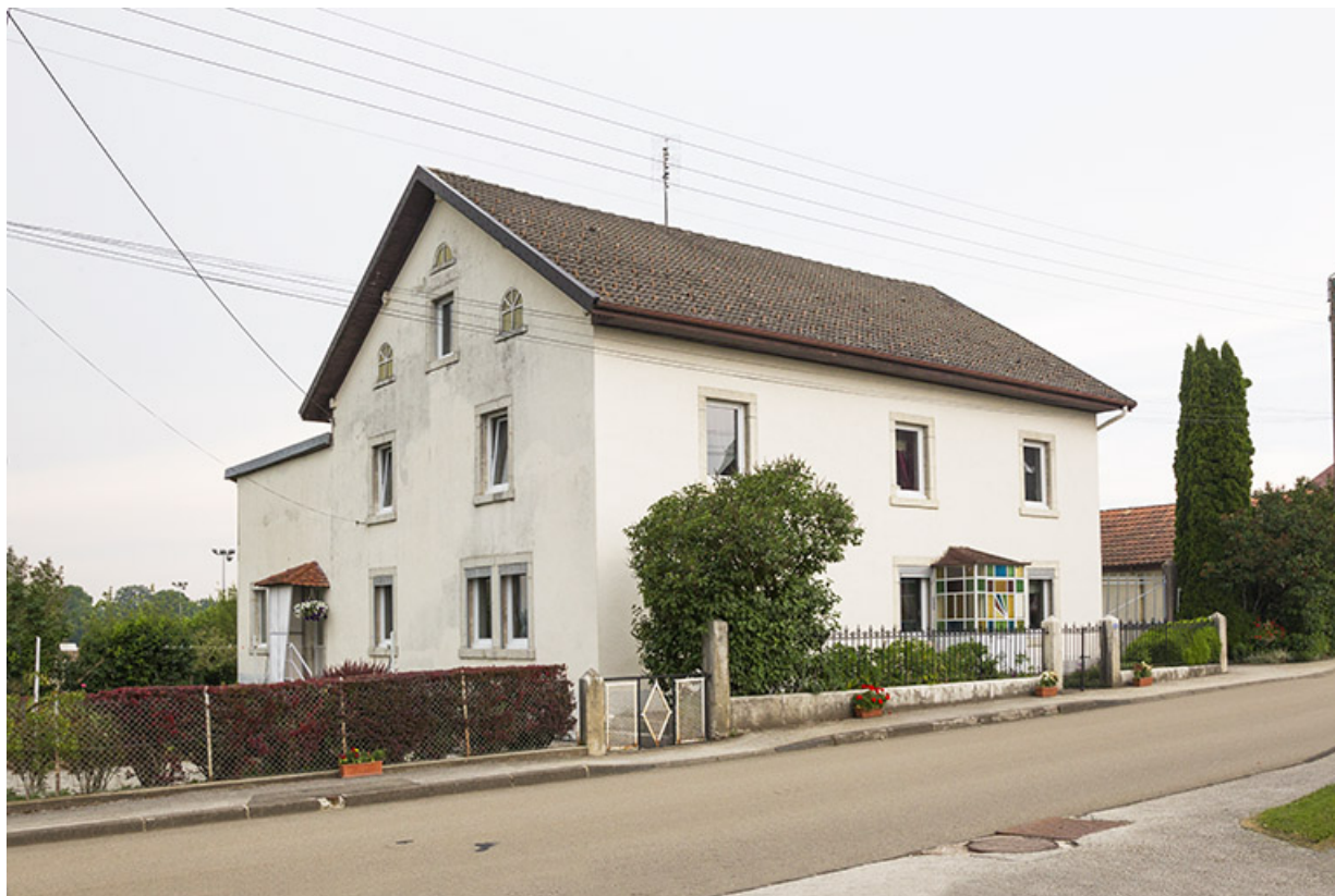
Maison au 12 Grande Rue : façades antérieure et latérale gauche.