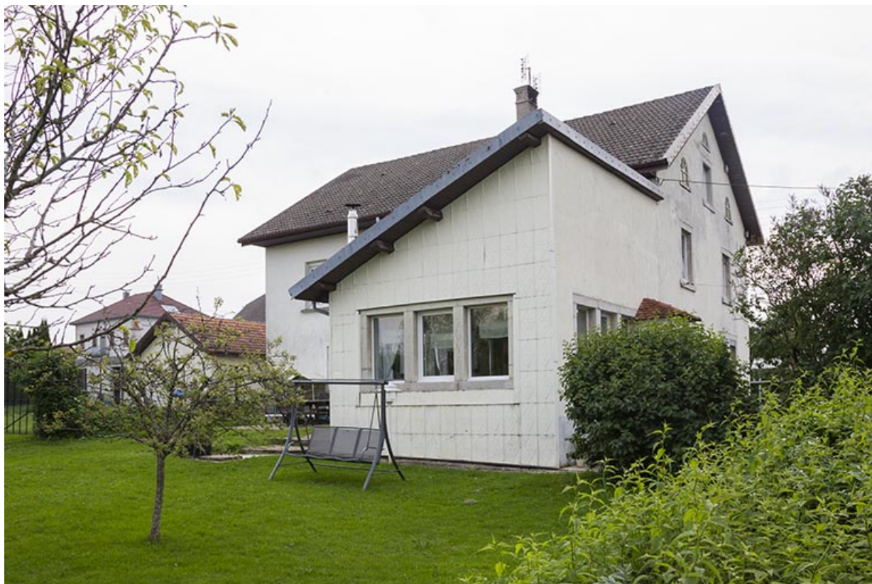
Maison au 12 Grande Rue : atelier de 1914.