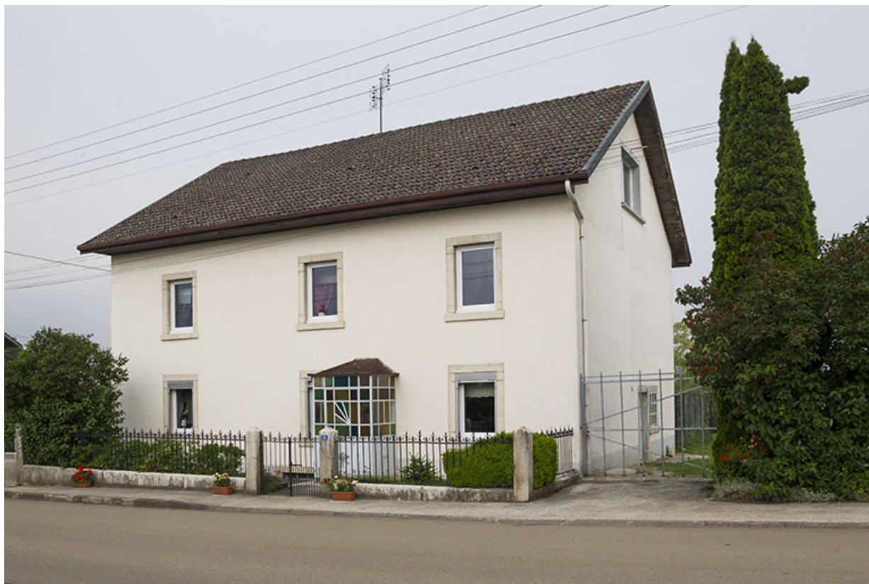
Maison au 12 Grande Rue : façade antérieure.