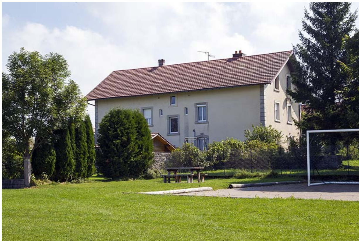
Maison au 14 Grande Rue : façades postérieure et latérale gauche. 25, Les Écorces, 12, 14 Grande Rue