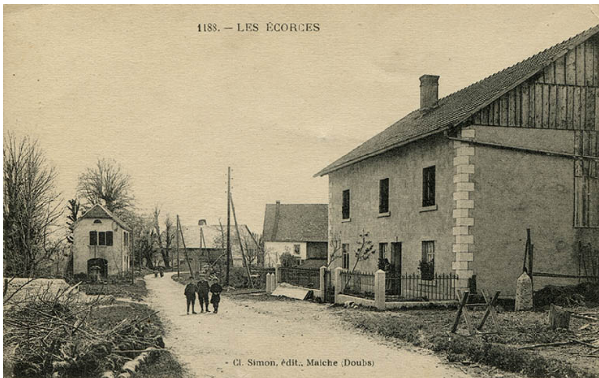
1188. - Les Écorces [la fabrique C. Monnot vue de trois quarts droite], 1er quart 20e siècle (avant 1914). 25, Les Écorces, 12, 14 Grande Rue