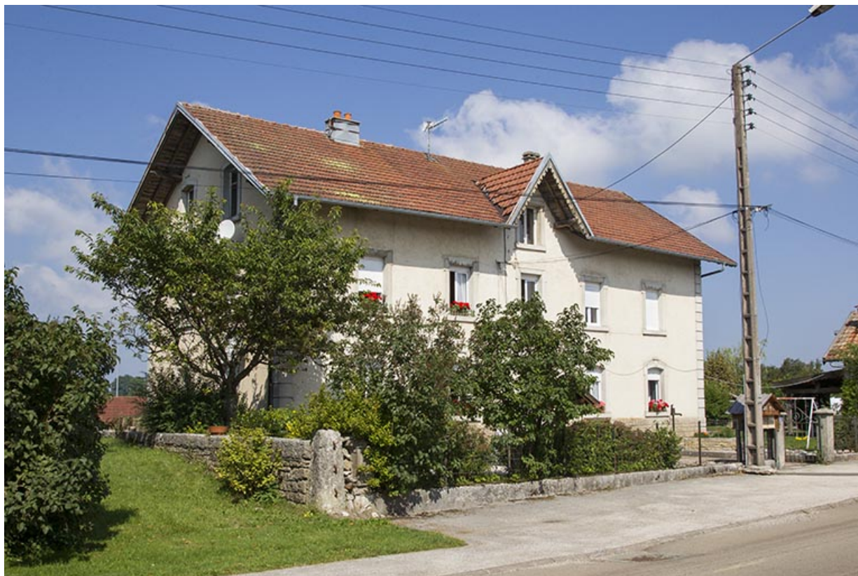
Maison au 14 Grande Rue : façades antérieure et latérale gauche.