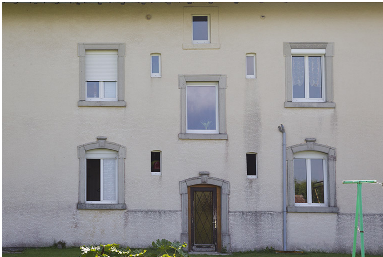
Maison au 14 Grande Rue : baies de la façade postérieure.