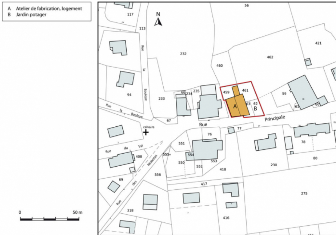
Plan-masse et de situation. Extrait du plan cadastral, 2013, section AI. 25, Les Bréseux, 38 rue Principale