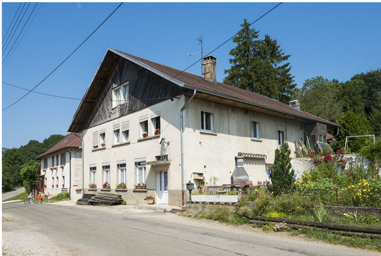
Vue d'ensemble, de trois quarts droite.