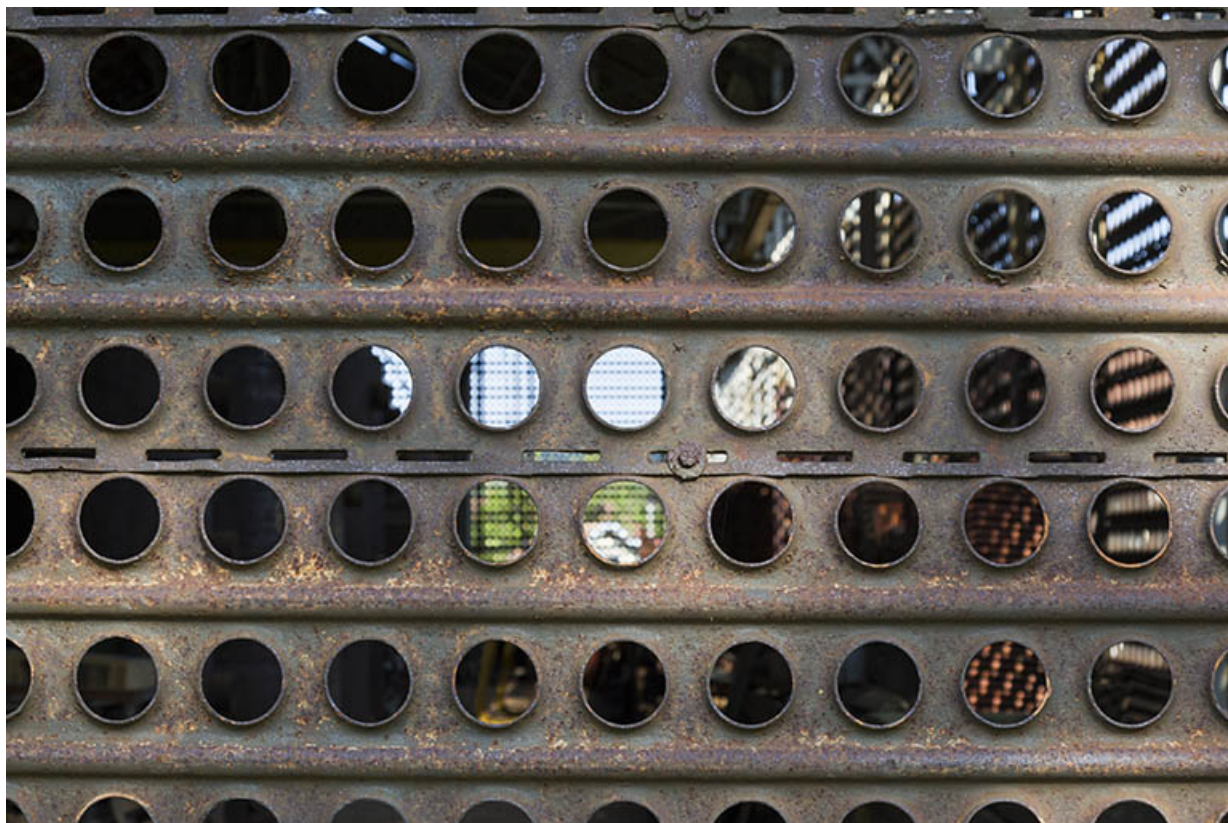
Site rue du Jura : détail d'une plaque de désensablement fermant l'entrepôt industriel. 25, Tréviillers, 11 rue du Jura