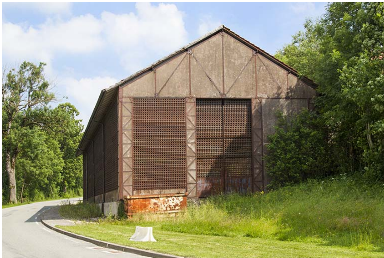
Site rue du Jura : entrepôt industriel, vu depuis l'atelier de fabrication. 25, Tréviillers, 11 rue du Jura