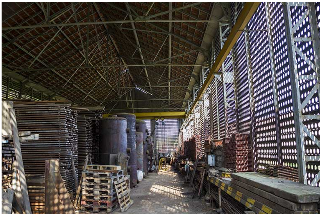
Site rue du Jura : intérieur de l'entrepôt industriel.