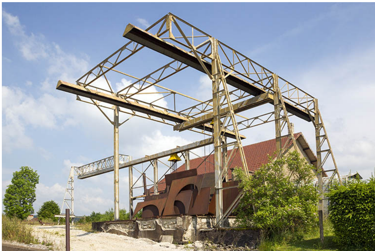
Site rue du Contremont : portique de manutention.