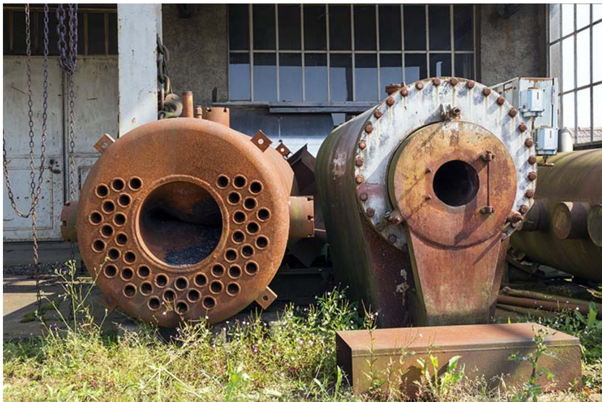
Site rue du Contremont : chaudières à vapeur. 25, Tréviillers, 11 rue du Jura