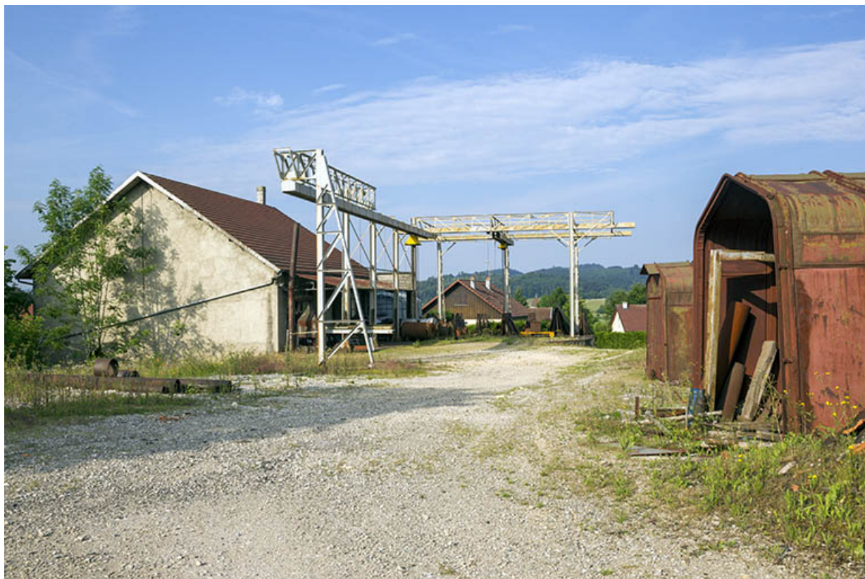
Site rue du Contremont : atelier de fabrication et portique, depuis le nord-est. 25, Tréviillers, 11 rue du Jura