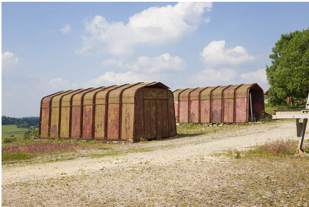
Site rue du Contremont : bâtiments métalliques à parois inclinées Fillod. 25, Tréviillers, 11 rue du Jura