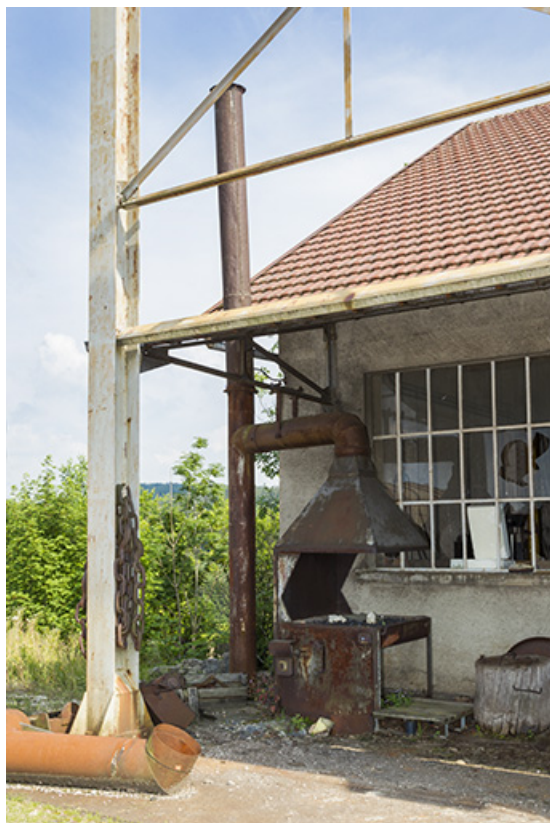
Site rue du Contremont : forge extérieure. 25, Tréviillers, 11 rue du Jura