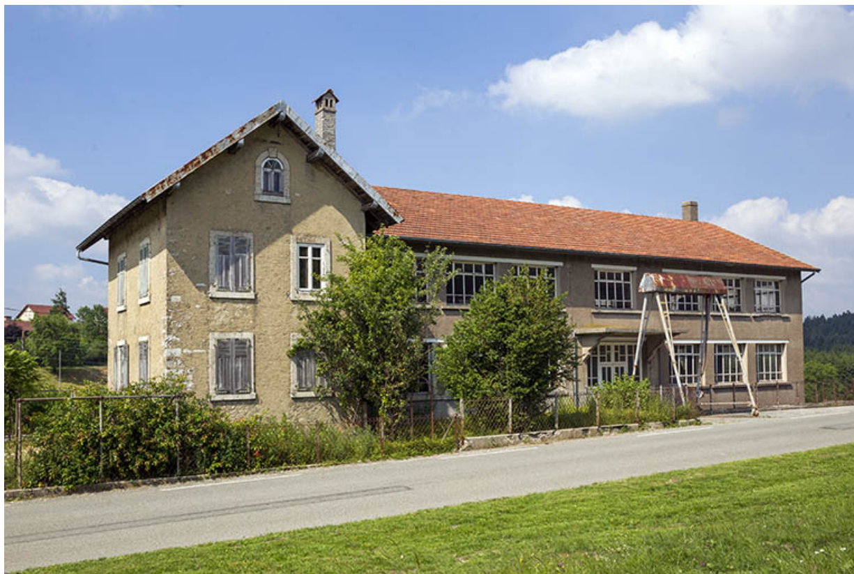
Site rue du Jura : logement, atelier de fabrication et portique (façade antérieure de trois quarts gauche). 25, Tréviillers, 11 rue du Jura