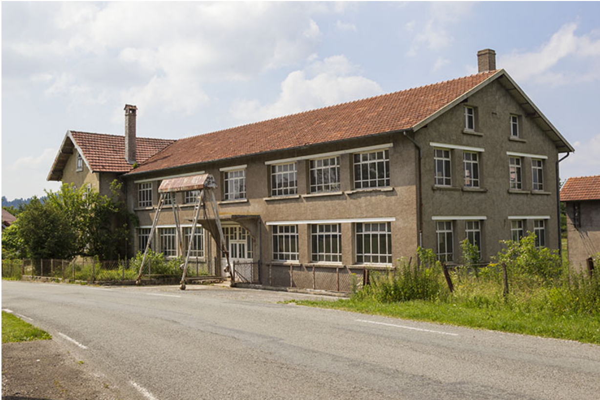
Site rue du Jura : atelier de fabrication et portique (façade antérieure de trois quarts droite). 25, Trévillers, 11 rue du Jura