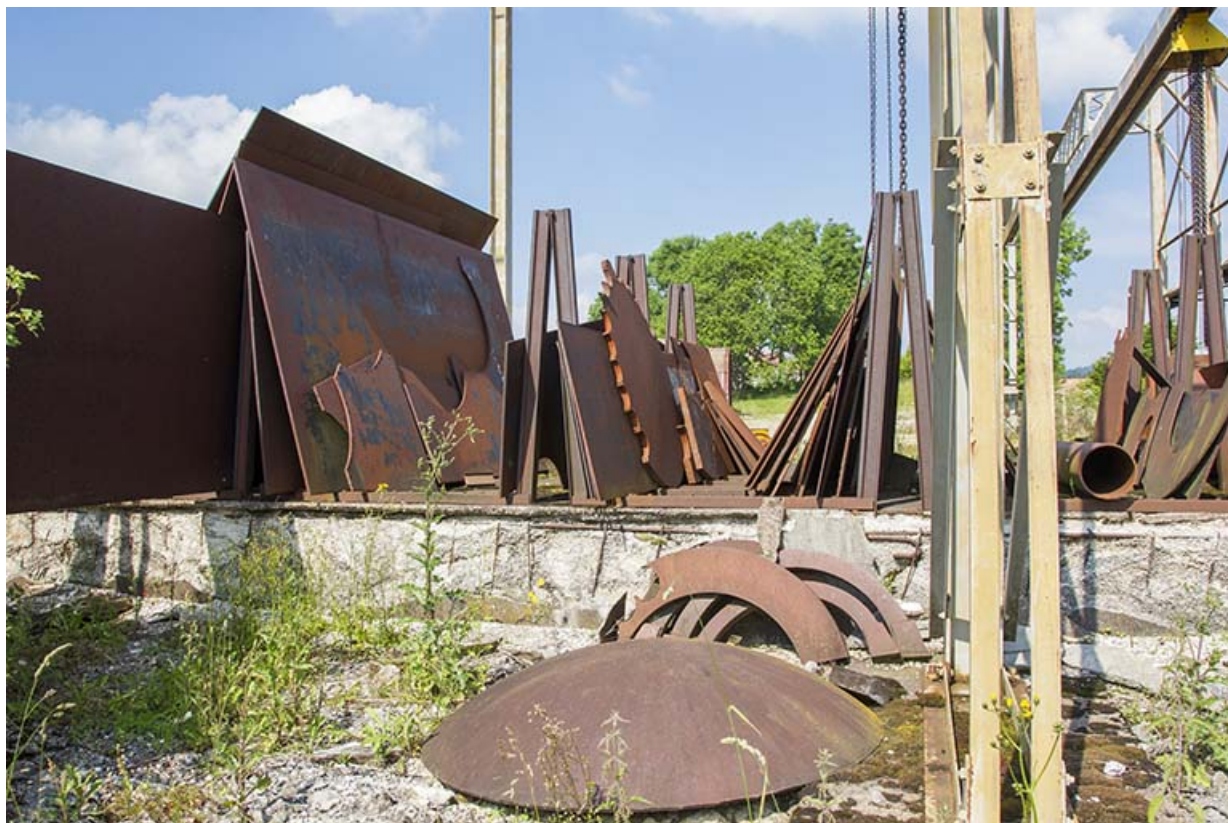
Site rue du Contremont : stock de plaques métalliques.