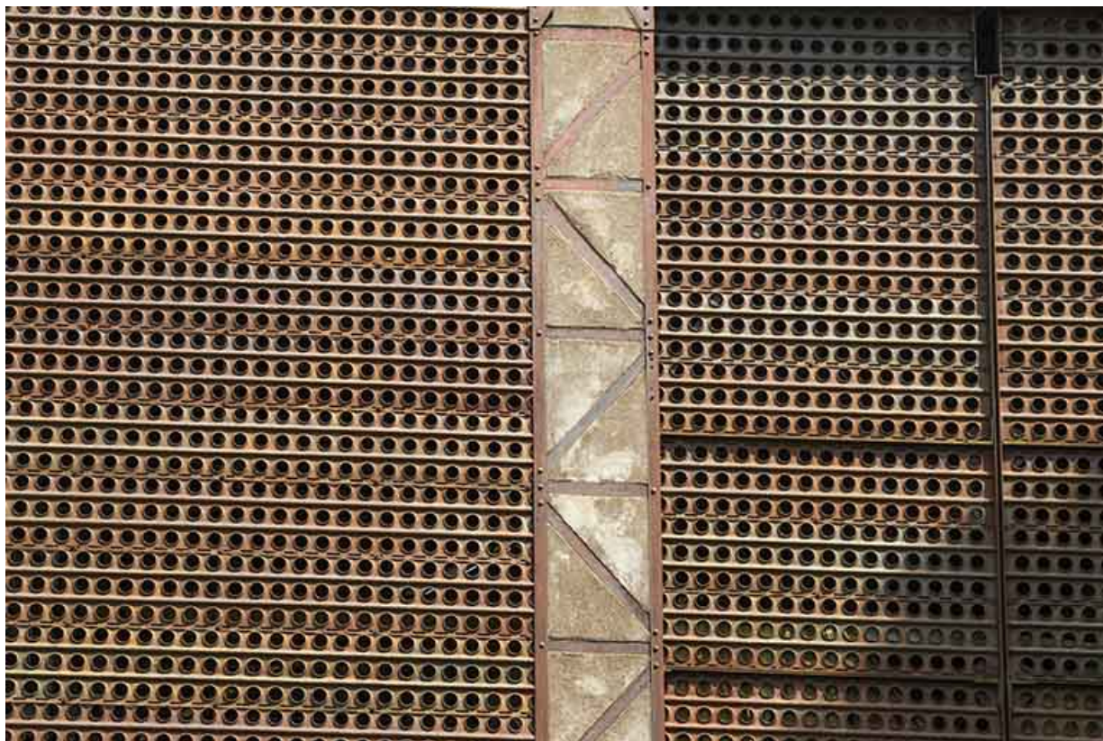
Site rue du Jura : paroi de l'entrepôt industriel (plaques de désensablement). 25, Tréviillers, 11 rue du Jura