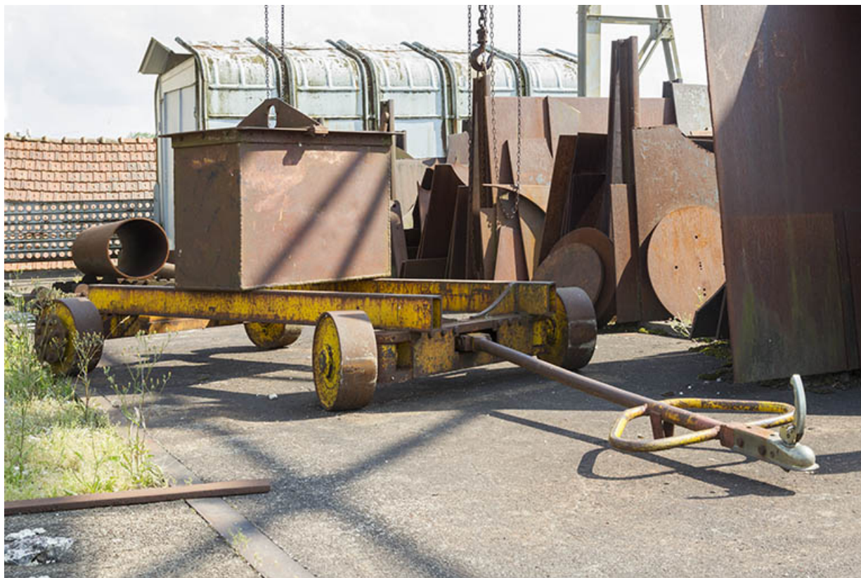
Site rue du Contremont : stock de plaques métalliques et chariot. 25, Tréviillers, 11 rue du Jura