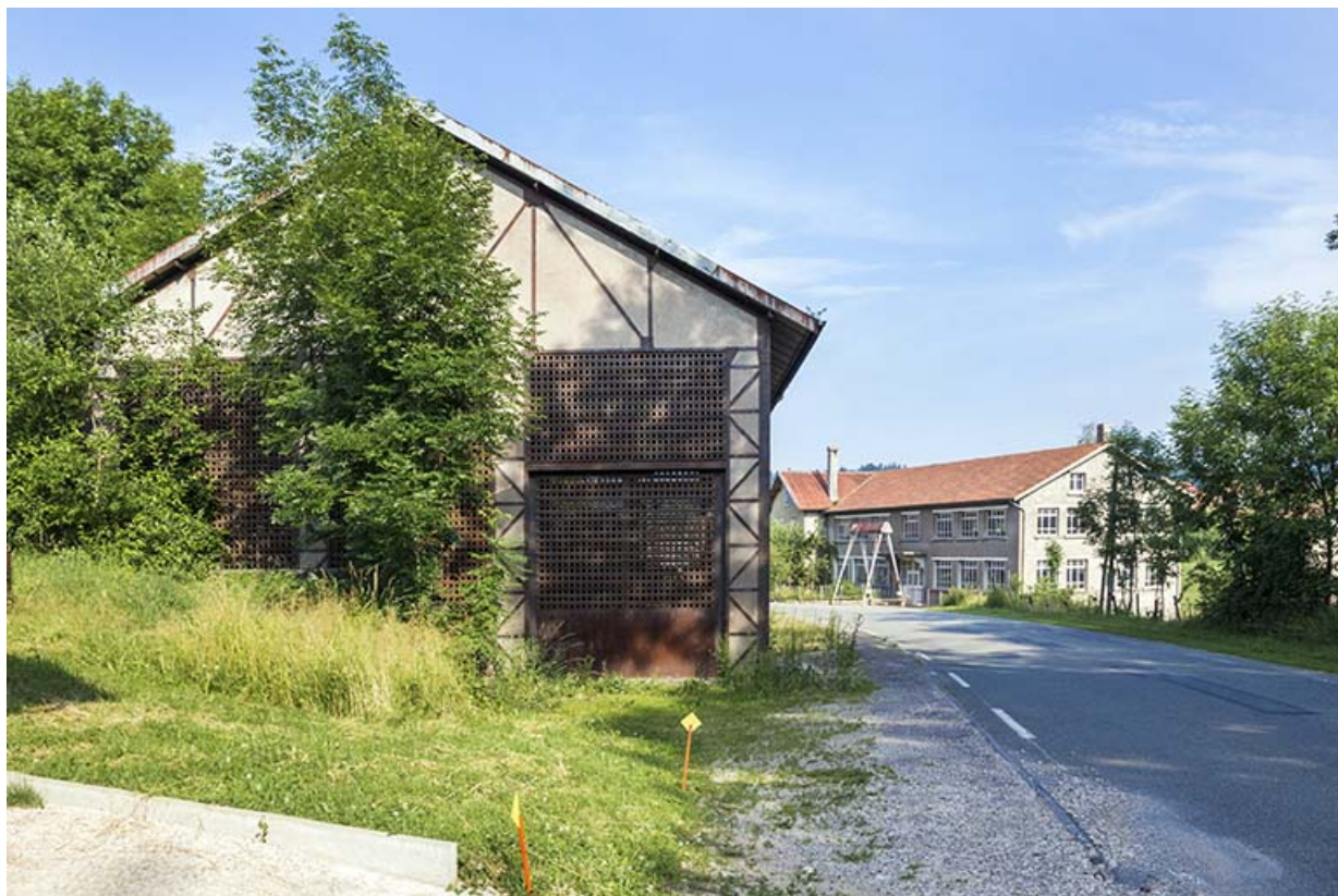
Site rue du Jura : vue d'ensemble depuis l'est. 25, Trévilleurs, 11 rue du Jura