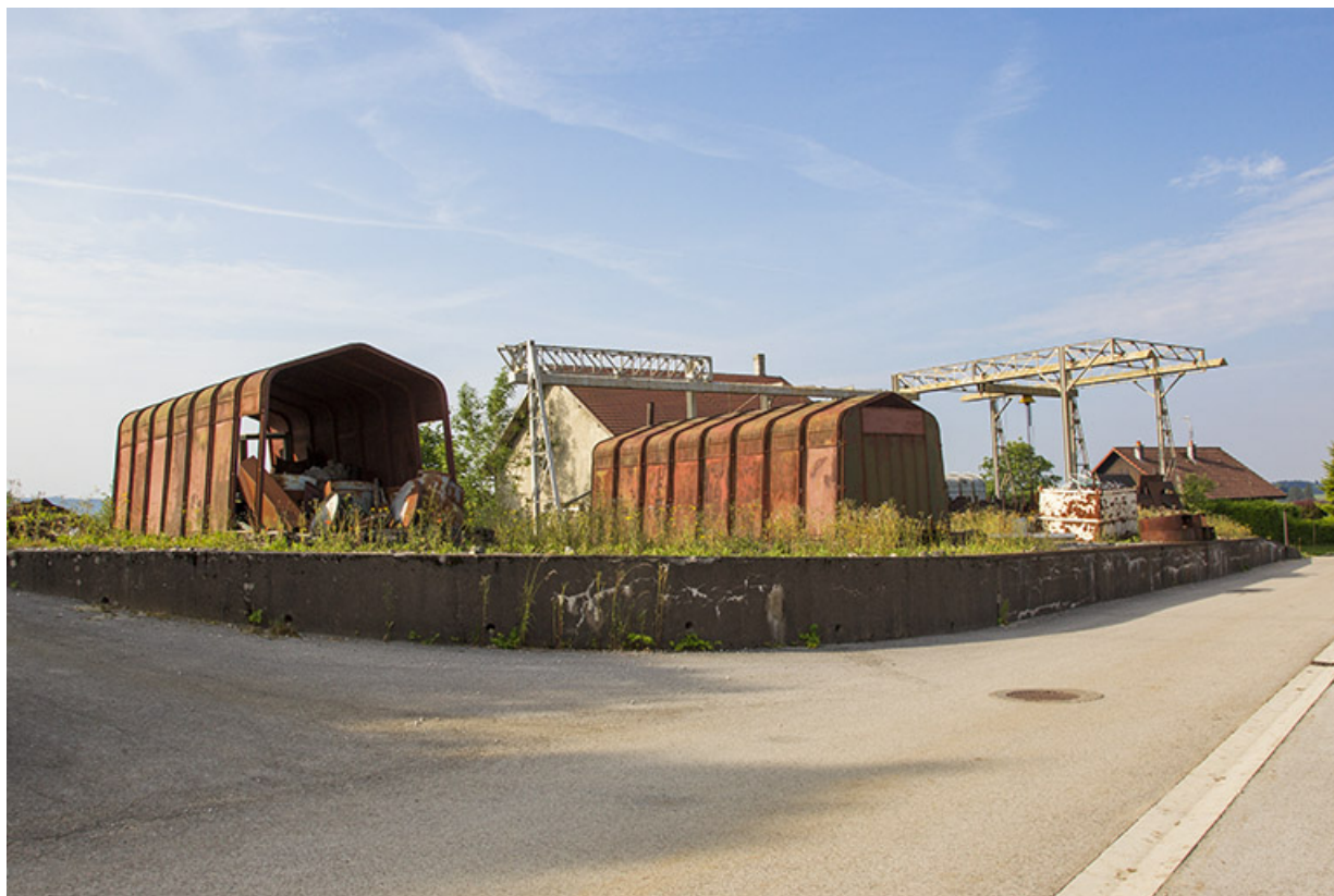
Site rue du Contremont : vue d'ensemble depuis le nord. Au premier plan, les bâtiments métalliques à parois inclinées Fillod. 25, Trévillers, 11 rue du Jura