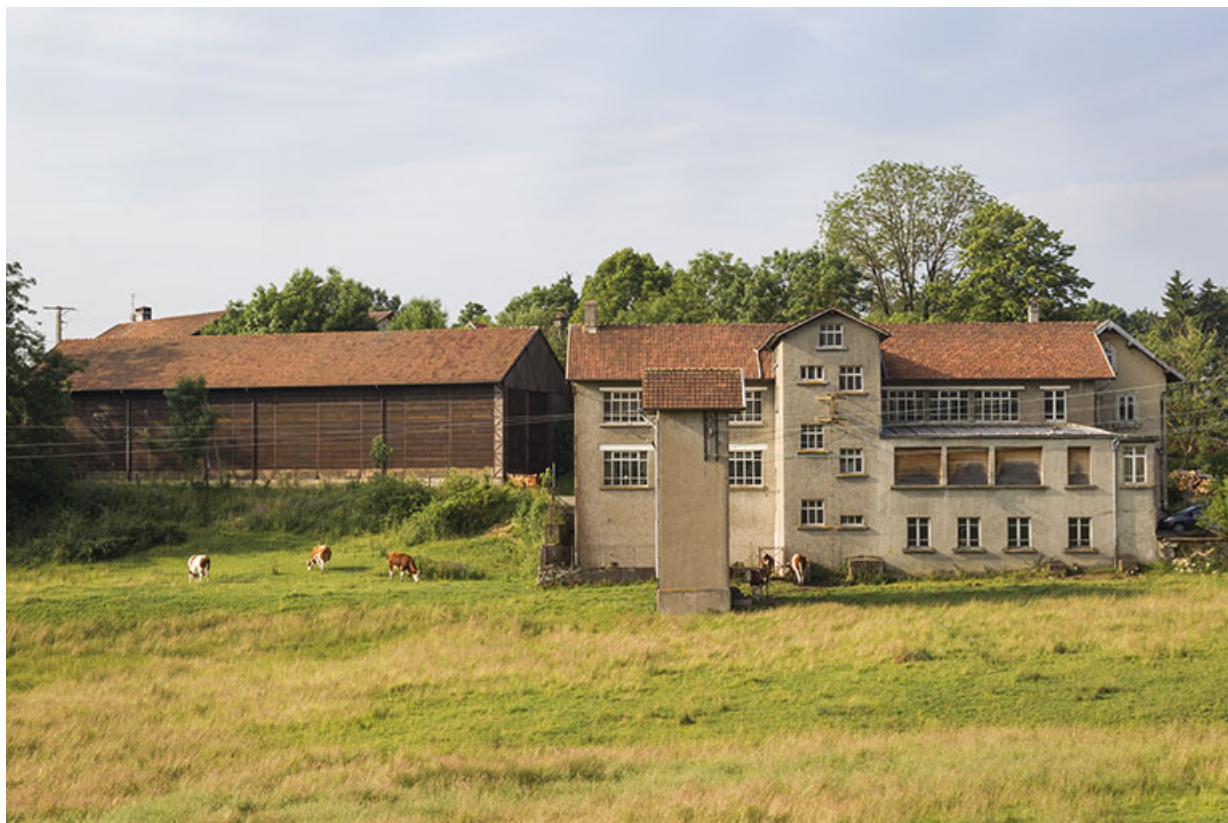
Site rue du Jura : vue d'ensemble depuis le nord.