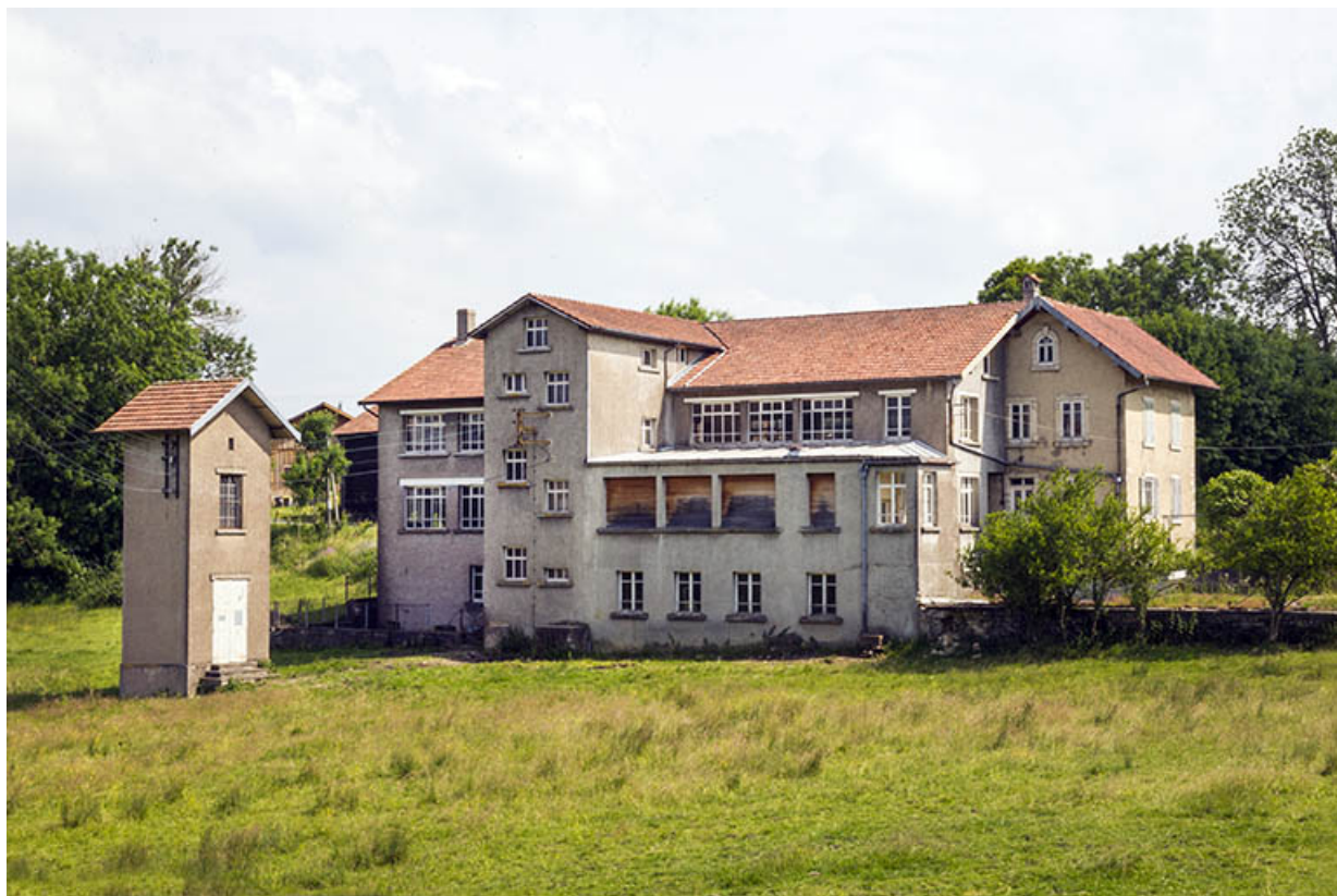
Site rue du Jura : atelier de fabrication et logement (façade postérieure). 25, Tréviillers, 11 rue du Jura