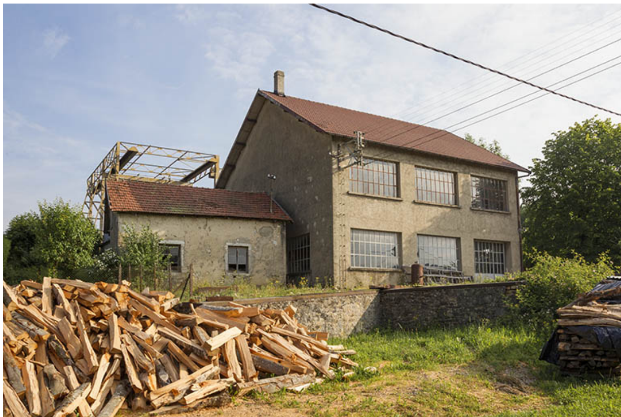
Site rue du Contremont : atelier de fabrication et ancien logement, depuis le sud (façade postérieure). 25, Tréviillers, 11 rue du Jura