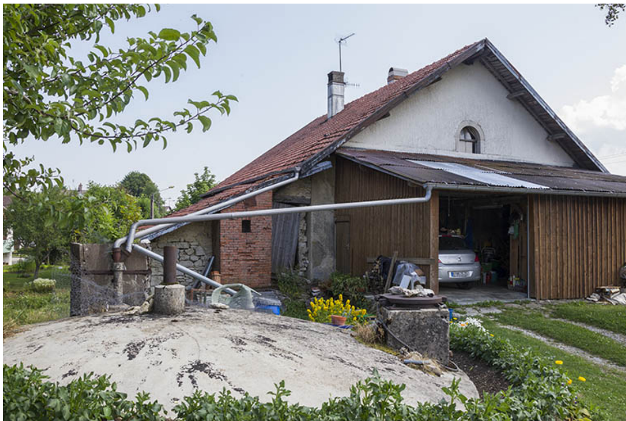
Façade latérale gauche, avec la citerne au premier plan.