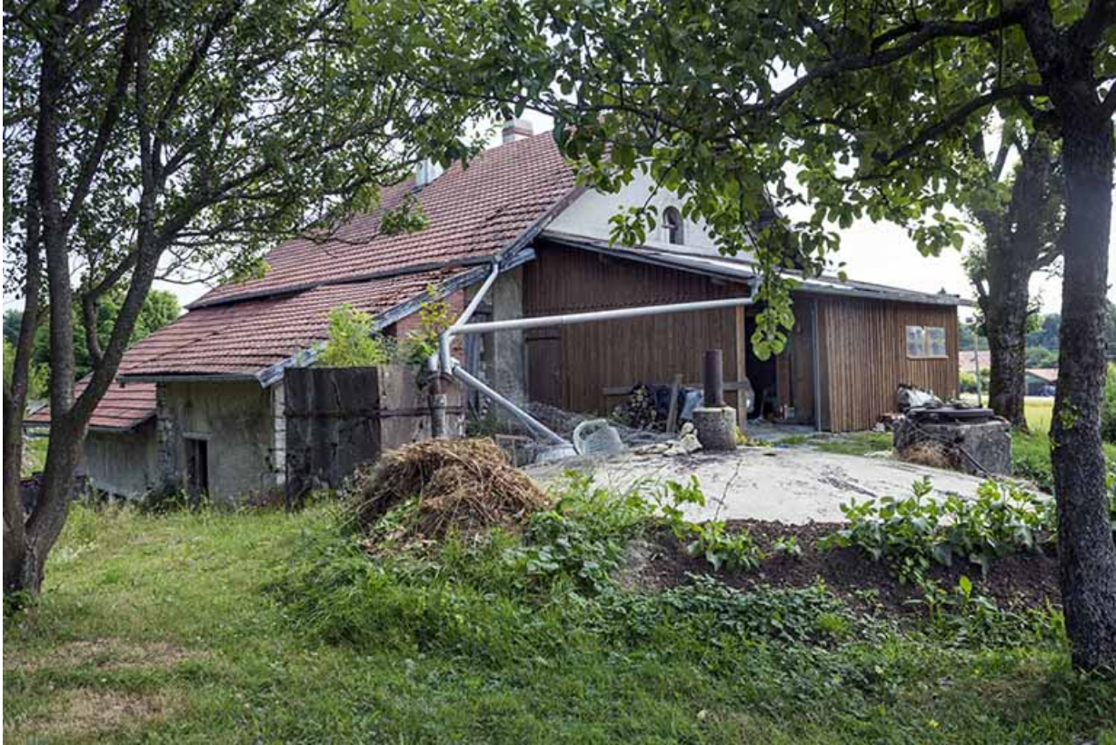
Façades postérieure et latérale gauche. Au premier plan, la citerne.