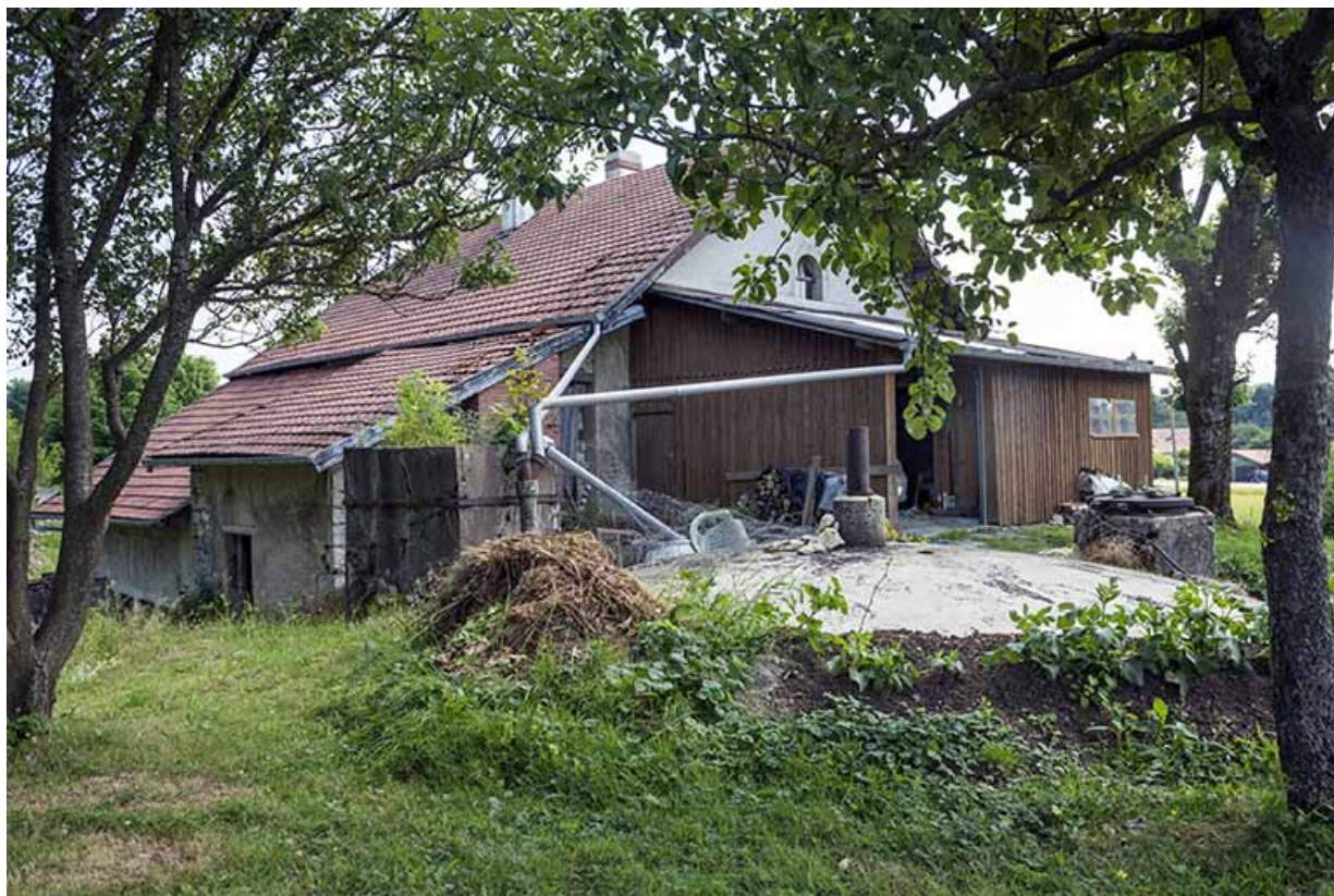
Façades postérieure et latérale gauche. Au premier plan, la citerne. 25, Cernay-l'Église, 1 rue du Stade