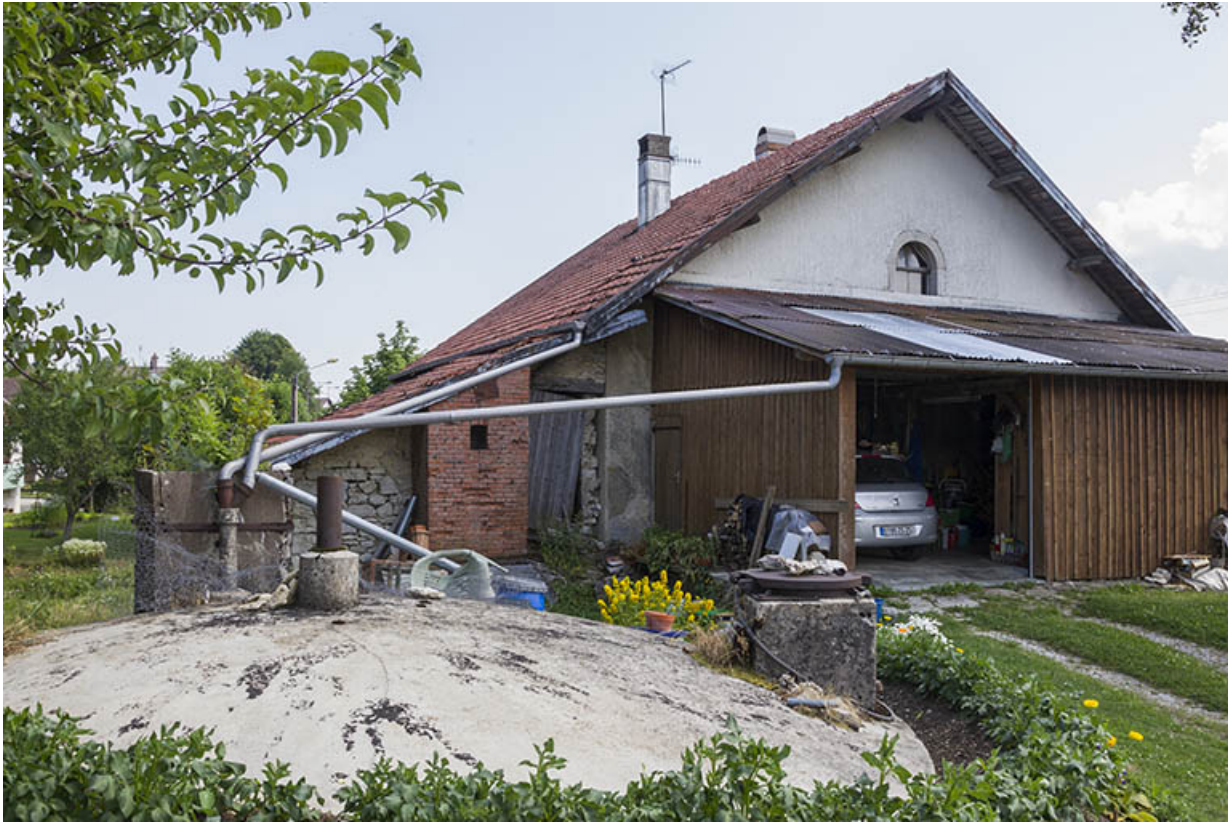
Façade latérale gauche, avec la citerne au premier plan.