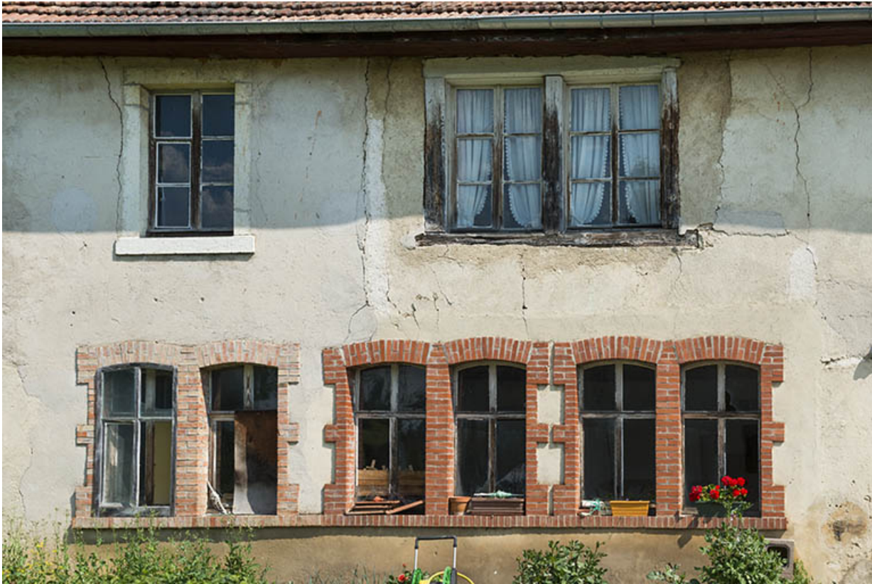
Fenêtres horlogères sur la façade antérieure.

25, Les Bréseux, 11 rue de l' Abbé Comment