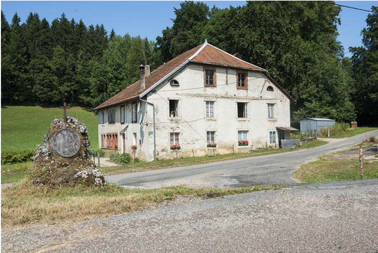
Vue d'ensemble, depuis l'est (façades antérieure et latérale droite).

25, Les Bréseux, 11 rue de l' Abbé Comment