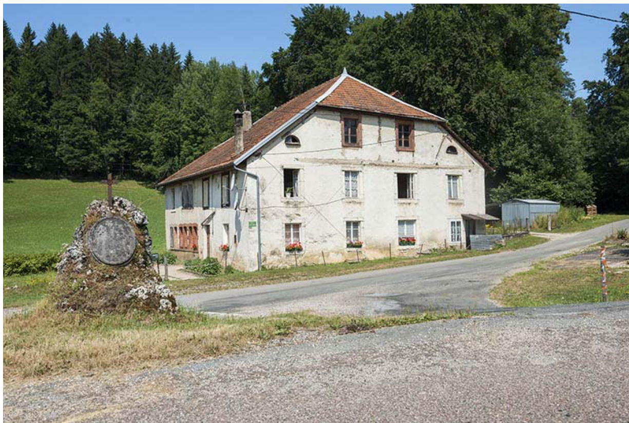
Vue d'ensemble, depuis l'est (façades antérieure et latérale droite).

25, Les Bréseux, 11 rue de l' Abbé Comment