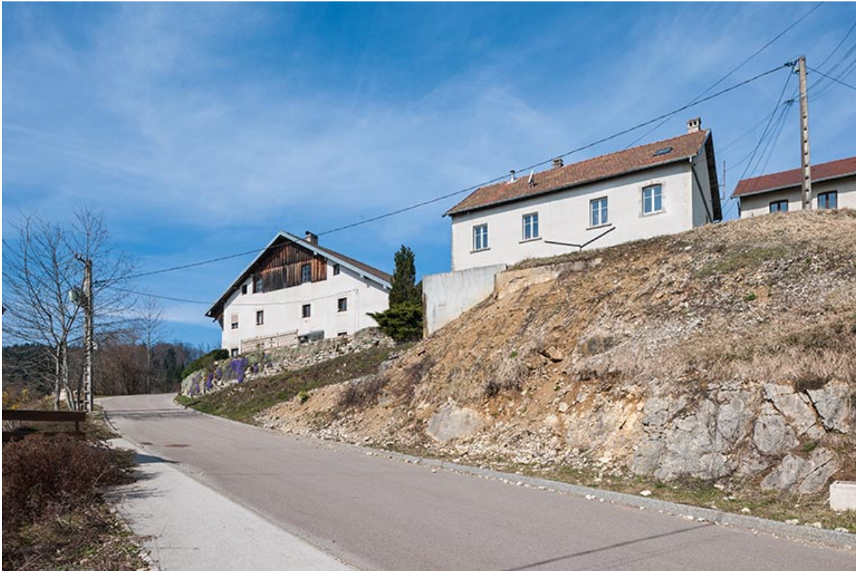
Vue d'ensemble, depuis l'est.