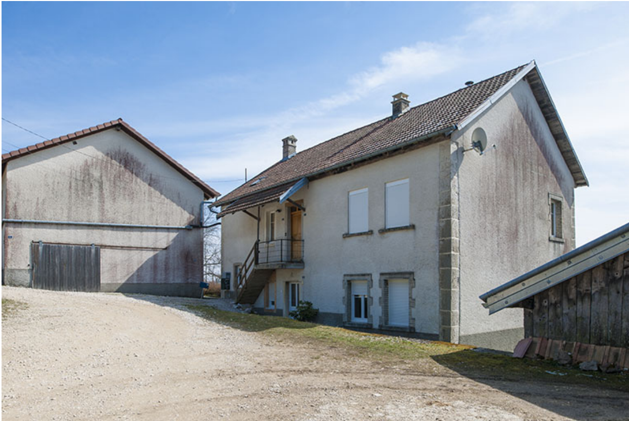
Atelier de fabrication et logement, côté cour.