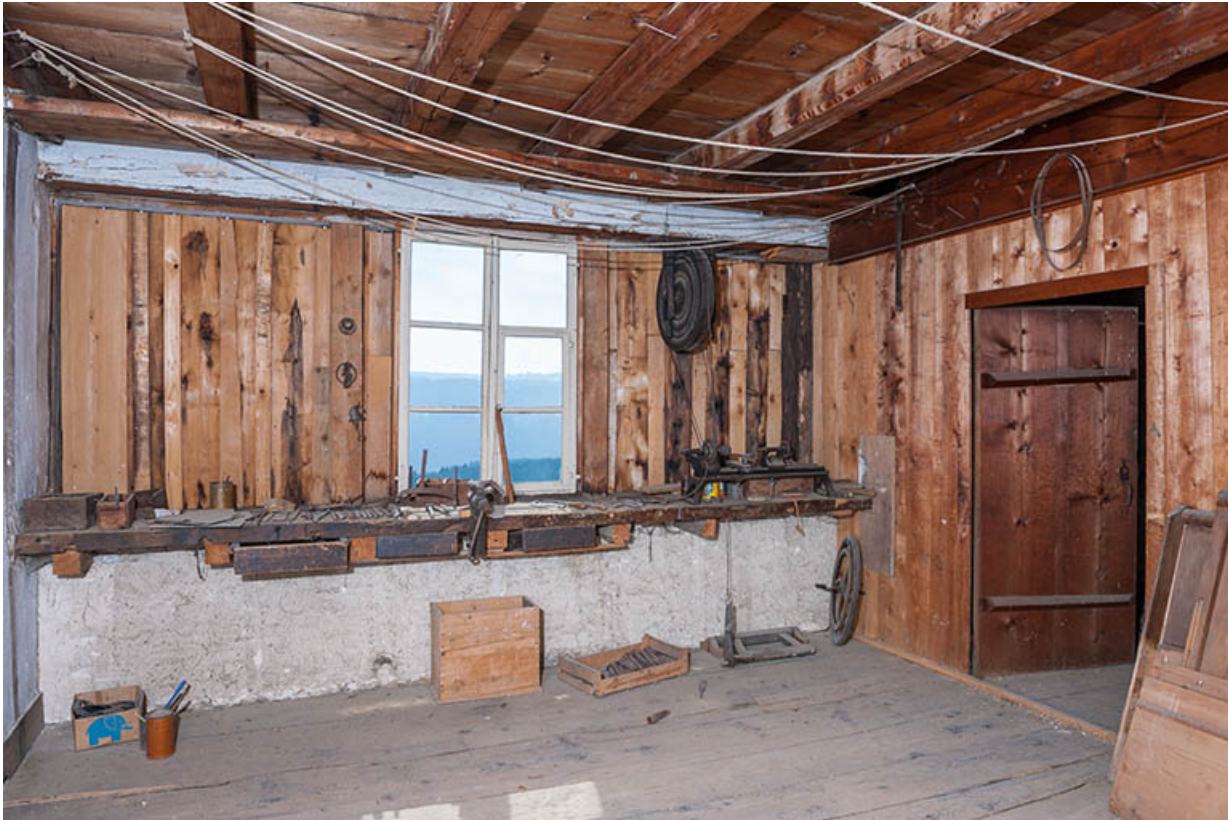
Ferme : atelier à l'étage en surcroît.