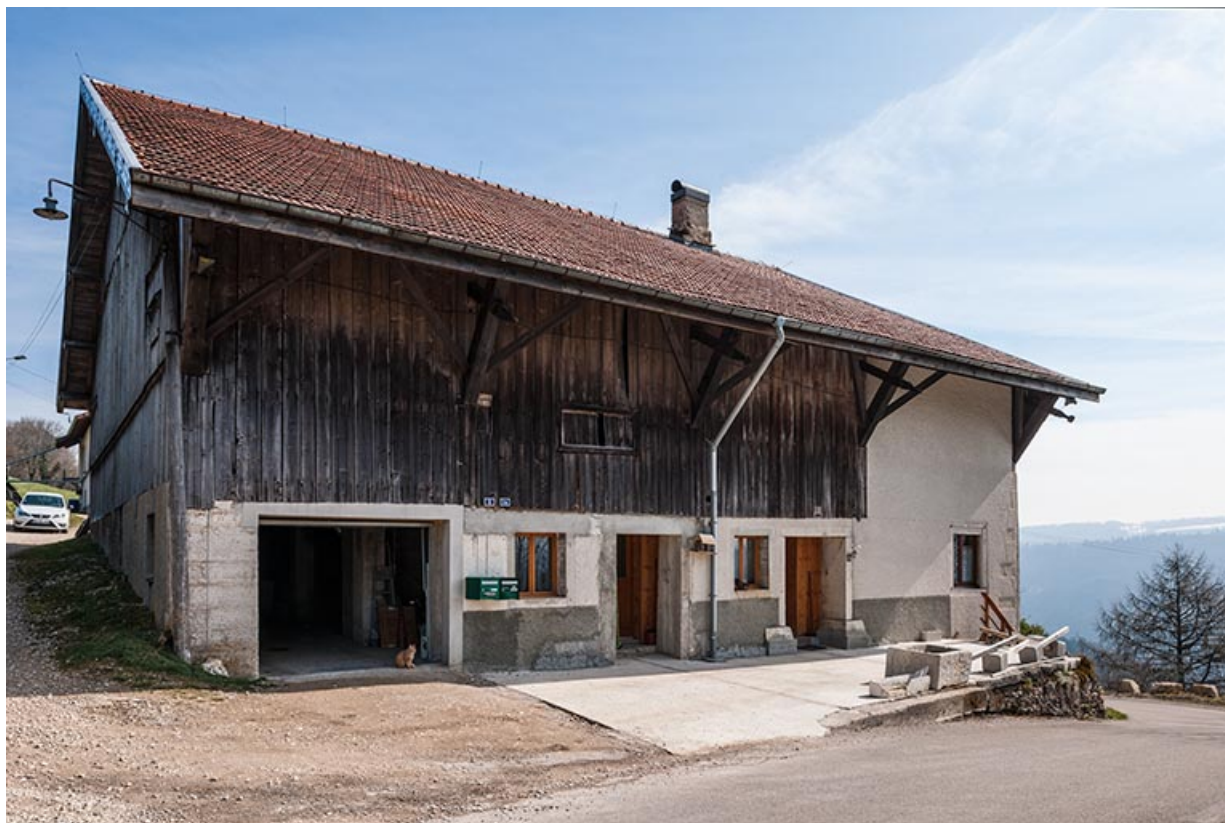
Ferme : façade latérale gauche. 25, Charmauvillers, lieudit : le Seud