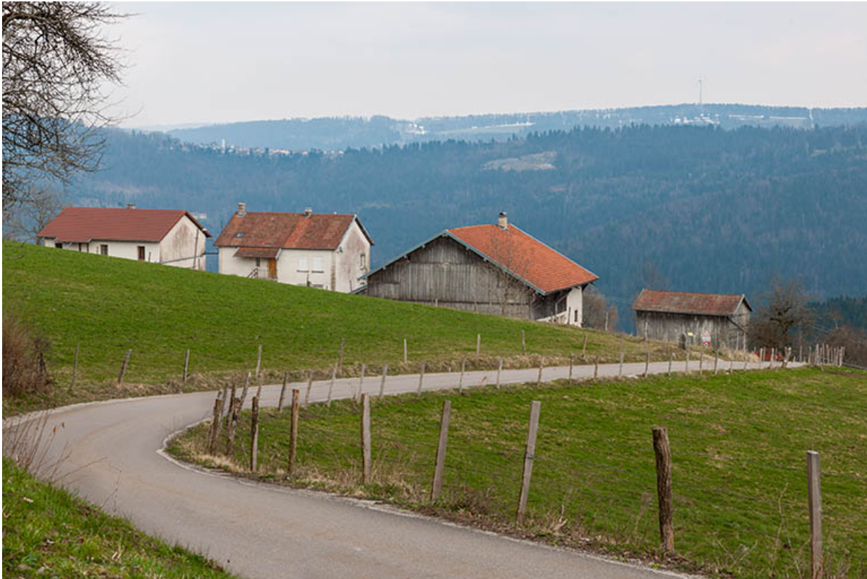
Vue d'ensemble du site, depuis le nord-ouest.