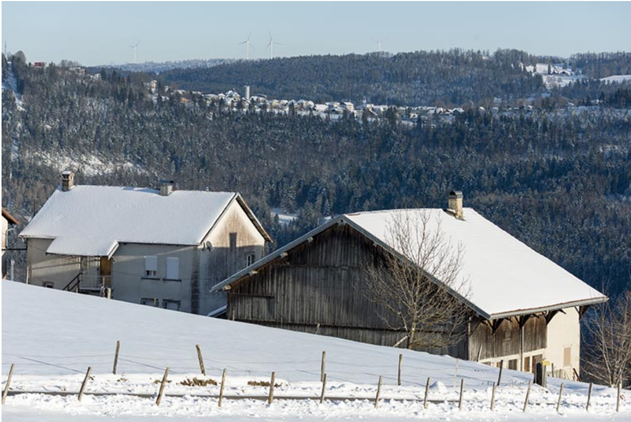
Ferme et logement en hiver, depuis l'ouest.