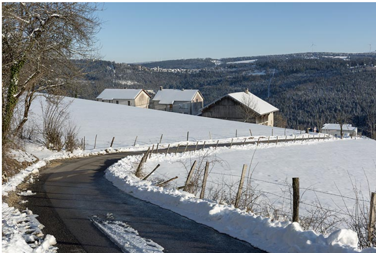
Vue d'ensemble du site en hiver, depuis le nord-ouest.