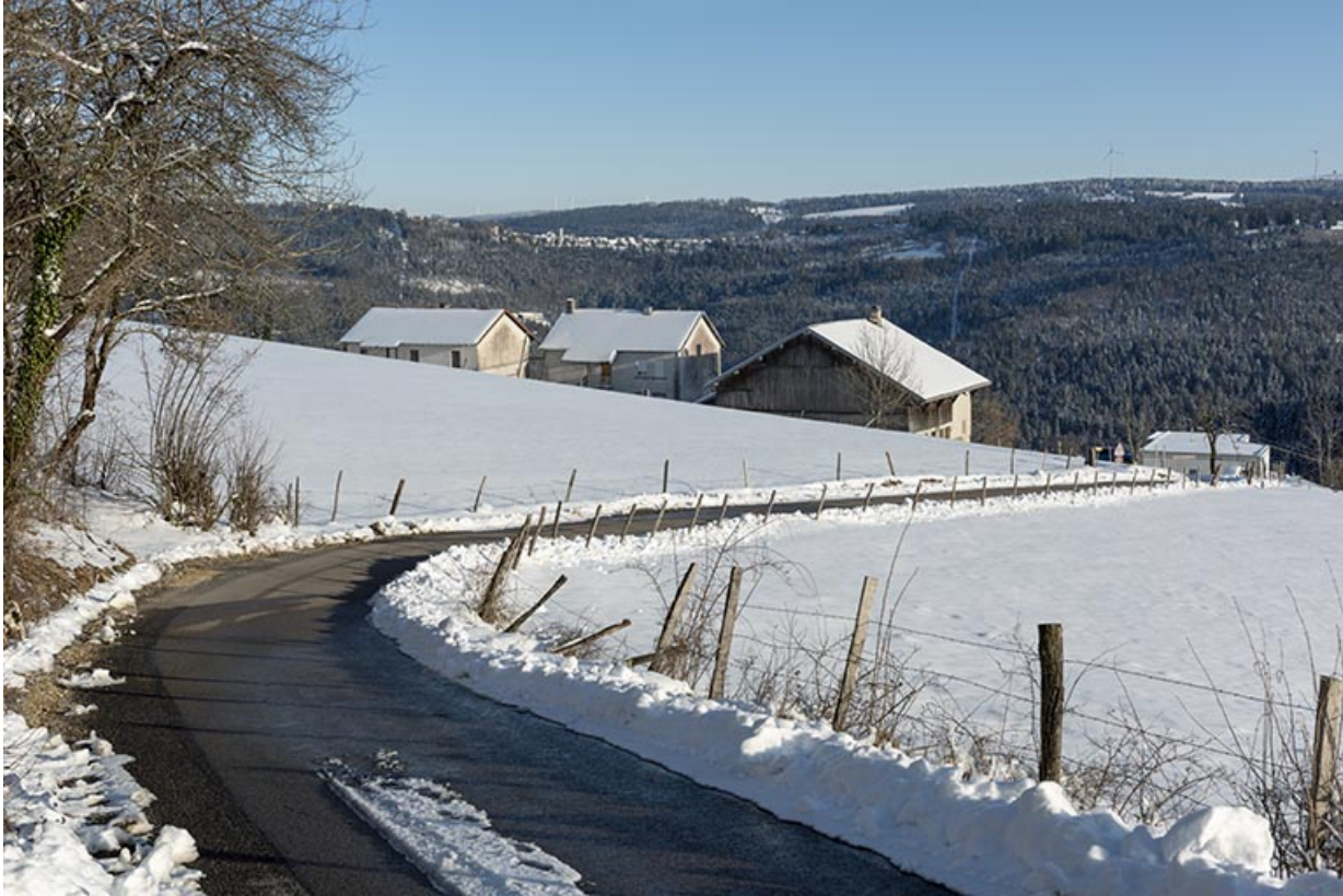
Vue d'ensemble du site en hiver, depuis le nord-ouest.