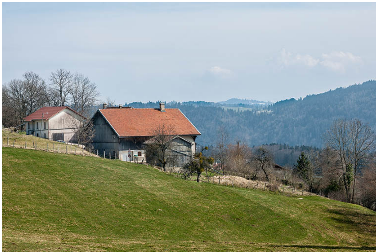
Garage, ferme et logement, depuis l'ouest.