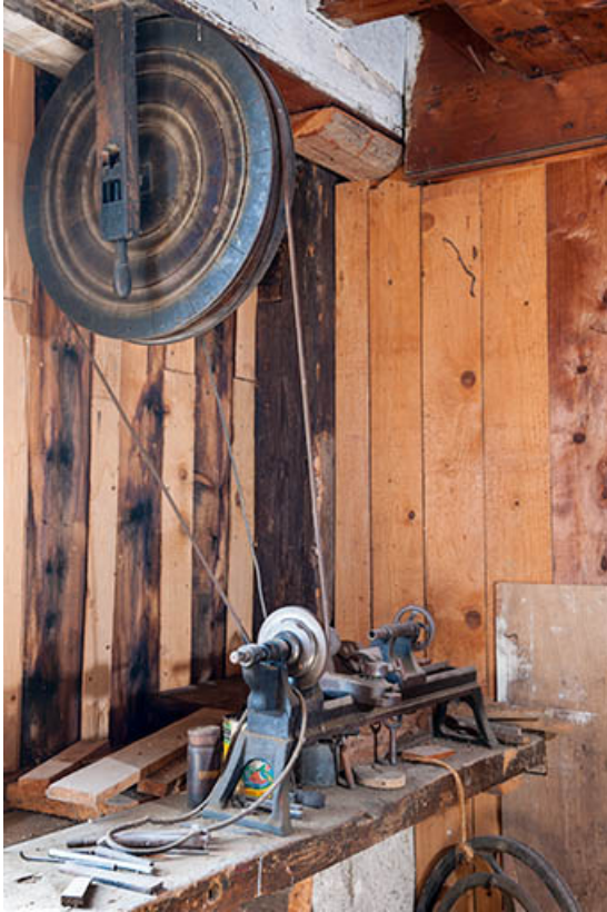
Ferme : tour à bois à marchepied de l'atelier. 25, Charmauvillers, lieudit : le Seud