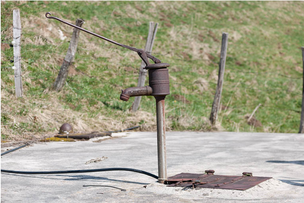
Pompe à eau Renaud, des Fontenelles.