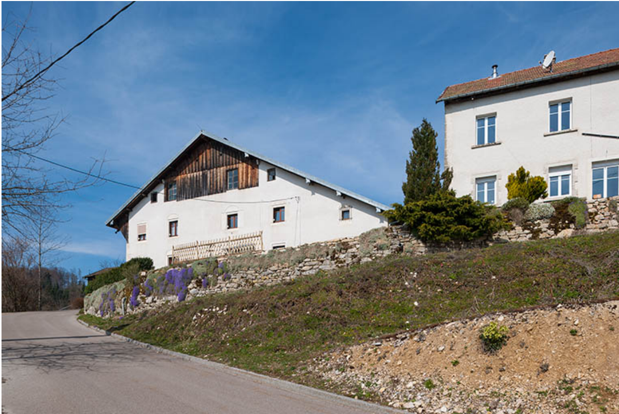
Ferme et atelier de fabrication, depuis l'est.