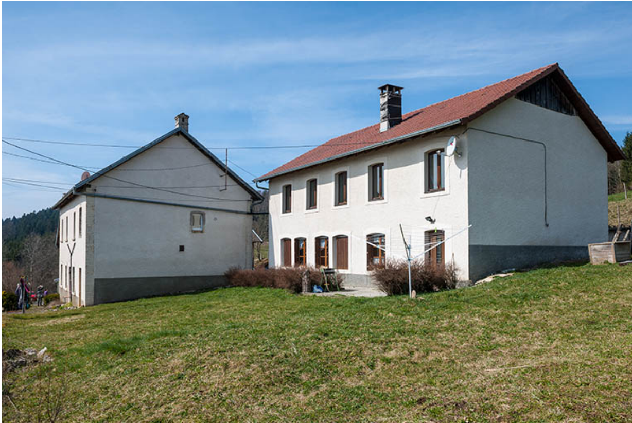
Atelier de fabrication et logement, côté vallée.