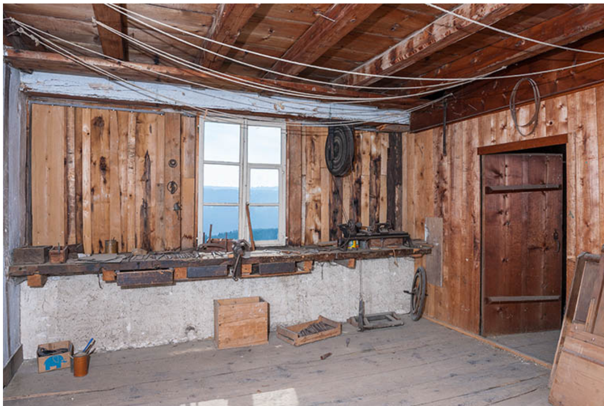
Ferme : atelier à l'étage en surcroît.