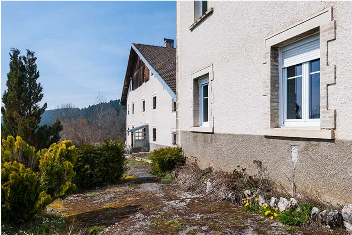
Atelier de fabrication : fenêtres au rez-de-chaussée.