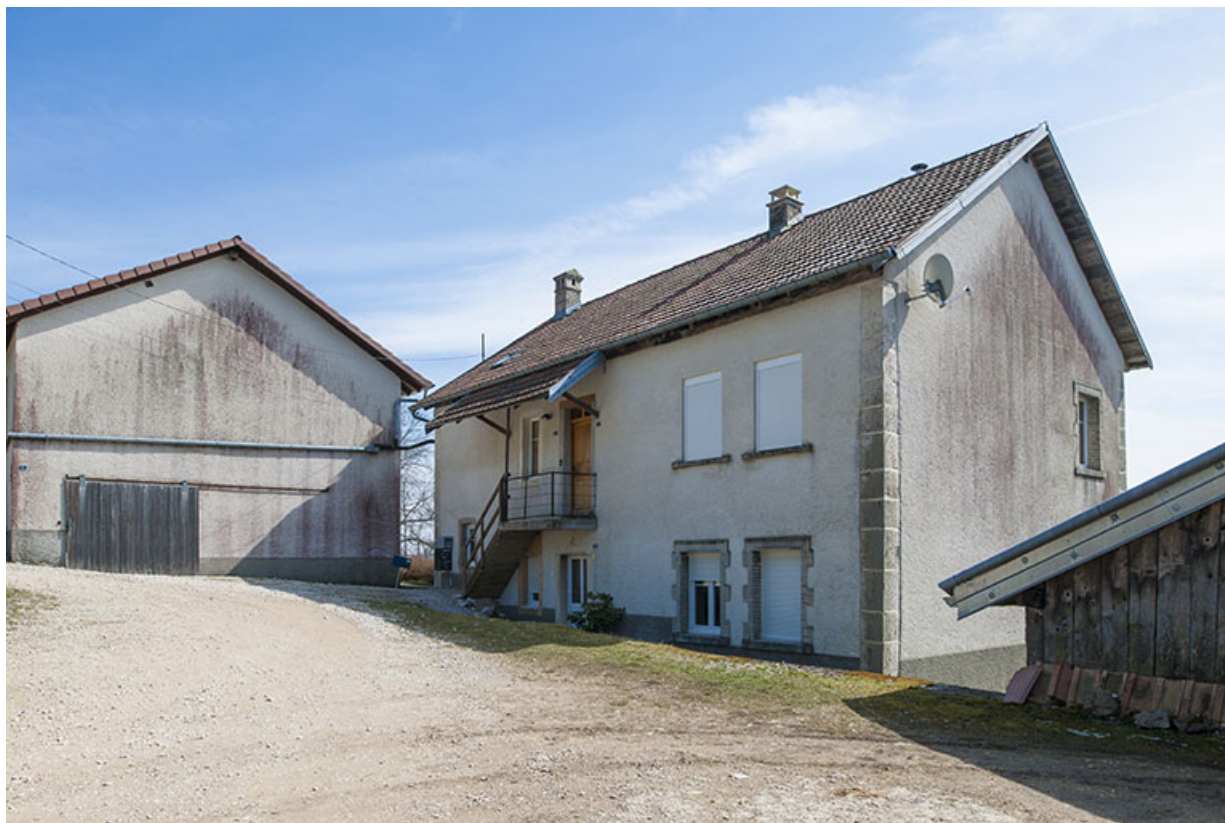
Atelier de fabrication et logement, côté cour. 25, Charmauvillers, lieudit : le Seud