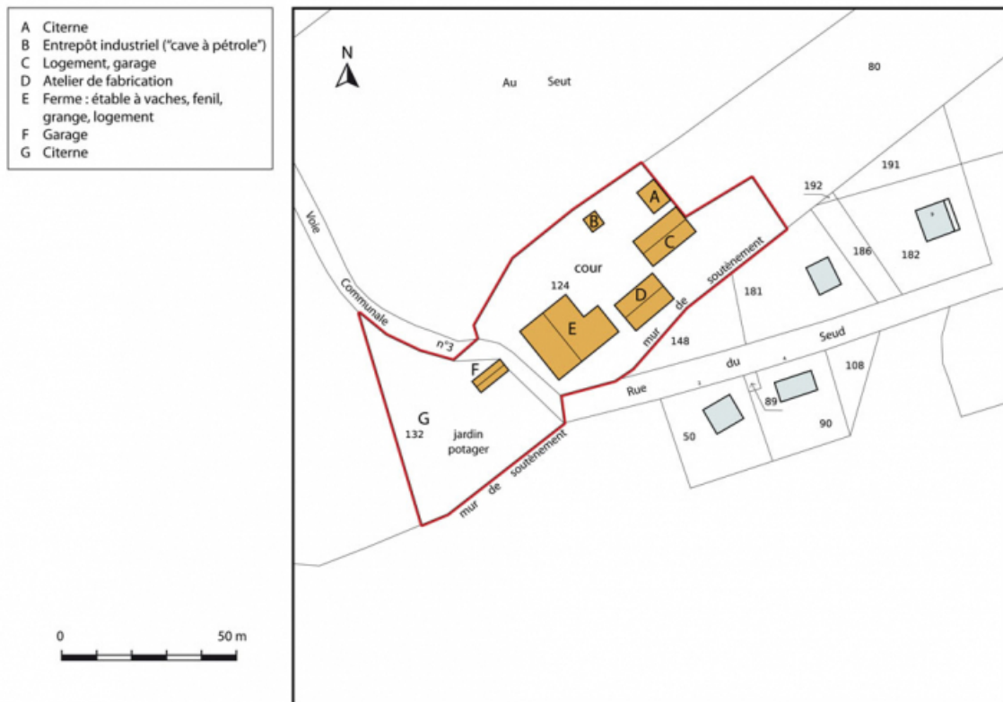
Plan-masse et de situation. Extrait du plan cadastral, 2013, section A. 25, Charmauvillers, lieu-dit : le Seud