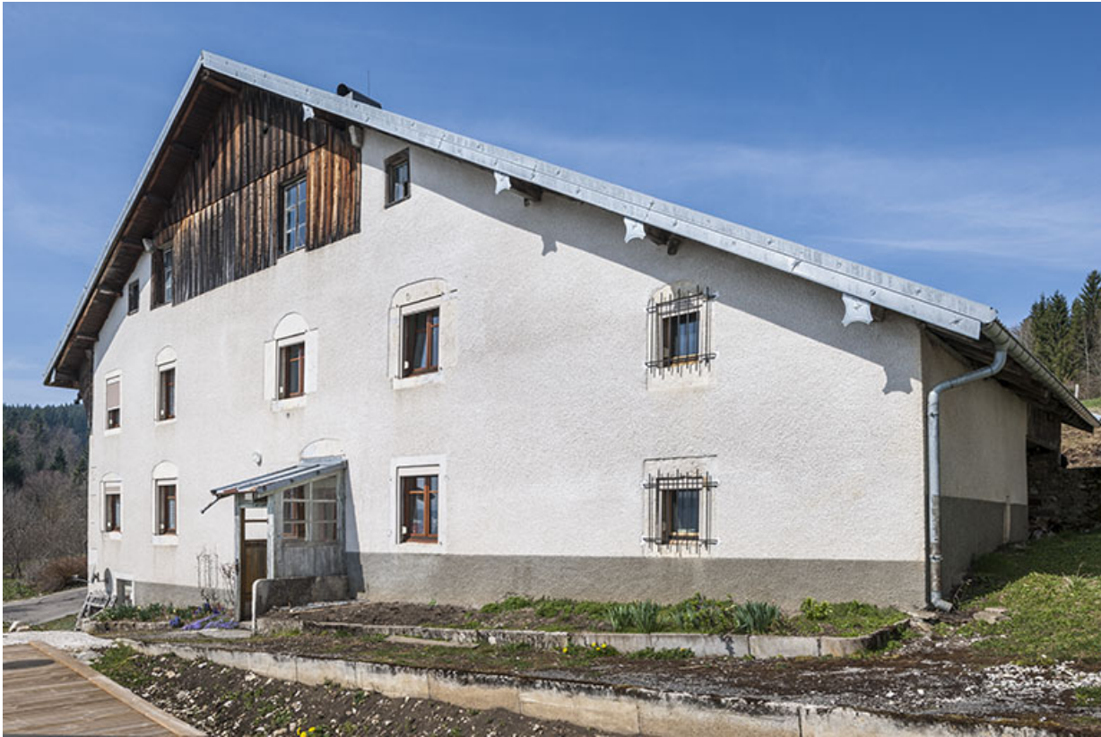
Ferme : façade antérieure, de trois quarts droite.