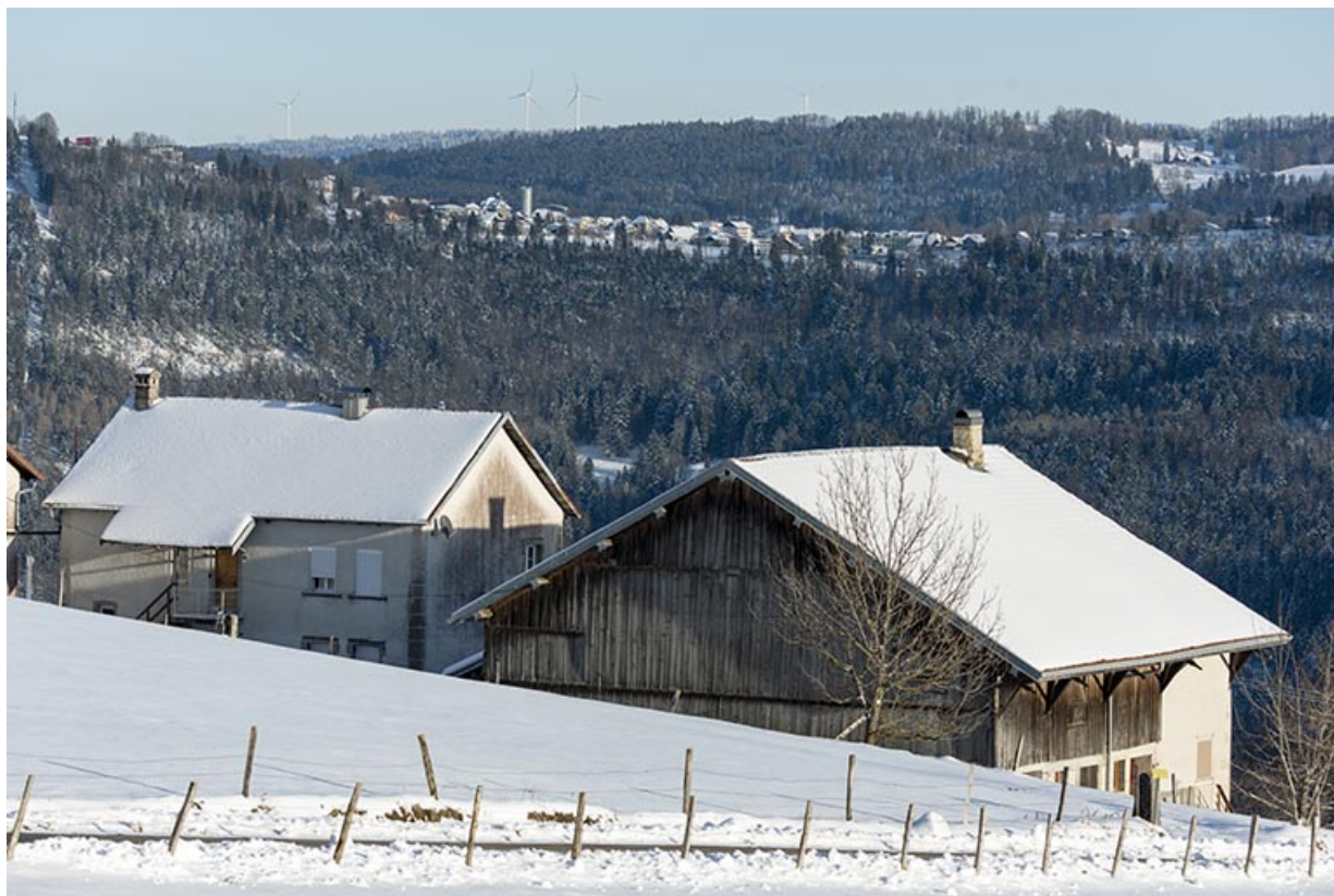
Ferme et logement en hiver, depuis l'ouest.