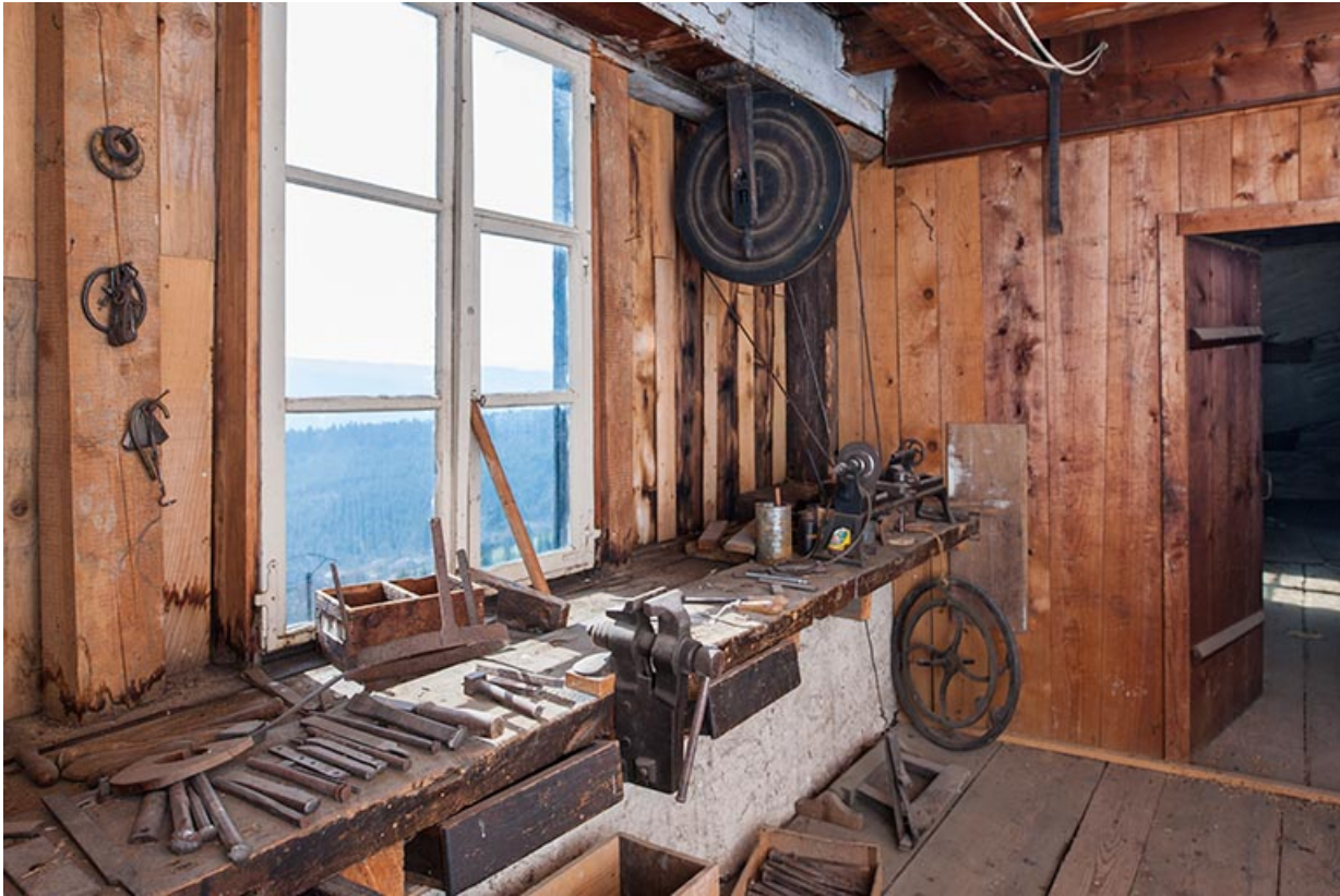
Ferme : établi et tour à bois à marchepied de l'atelier.