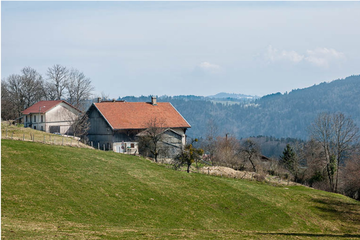
Garage, ferme et logement, depuis l'ouest.