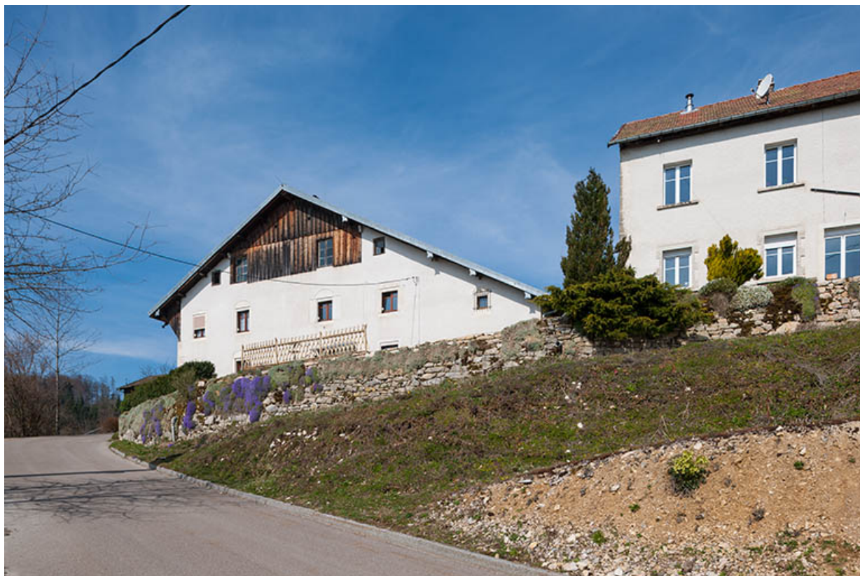
Ferme et atelier de fabrication, depuis l'est. 25, Charmauvillers, lieudit : le Seud