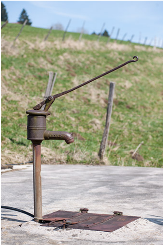
Pompe à eau Renaud, des Fontenelles.