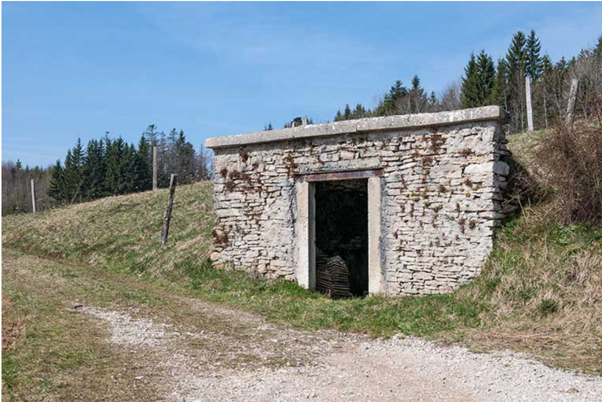
Entrepôt (" cave à pétrole ").