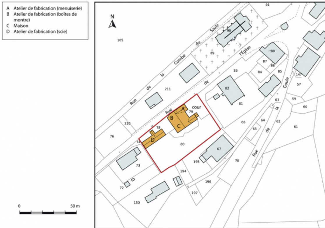
Plan-masse et de situation. Extrait du plan cadastral, 2013, section AC. 25, Charmauvillers, 5 rue de l'Église