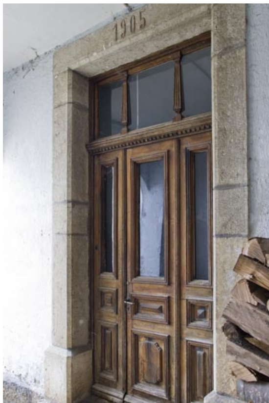
Entrée de l'usine (façade latérale droite). 25, Charmauvillers, 7 Grande Rue