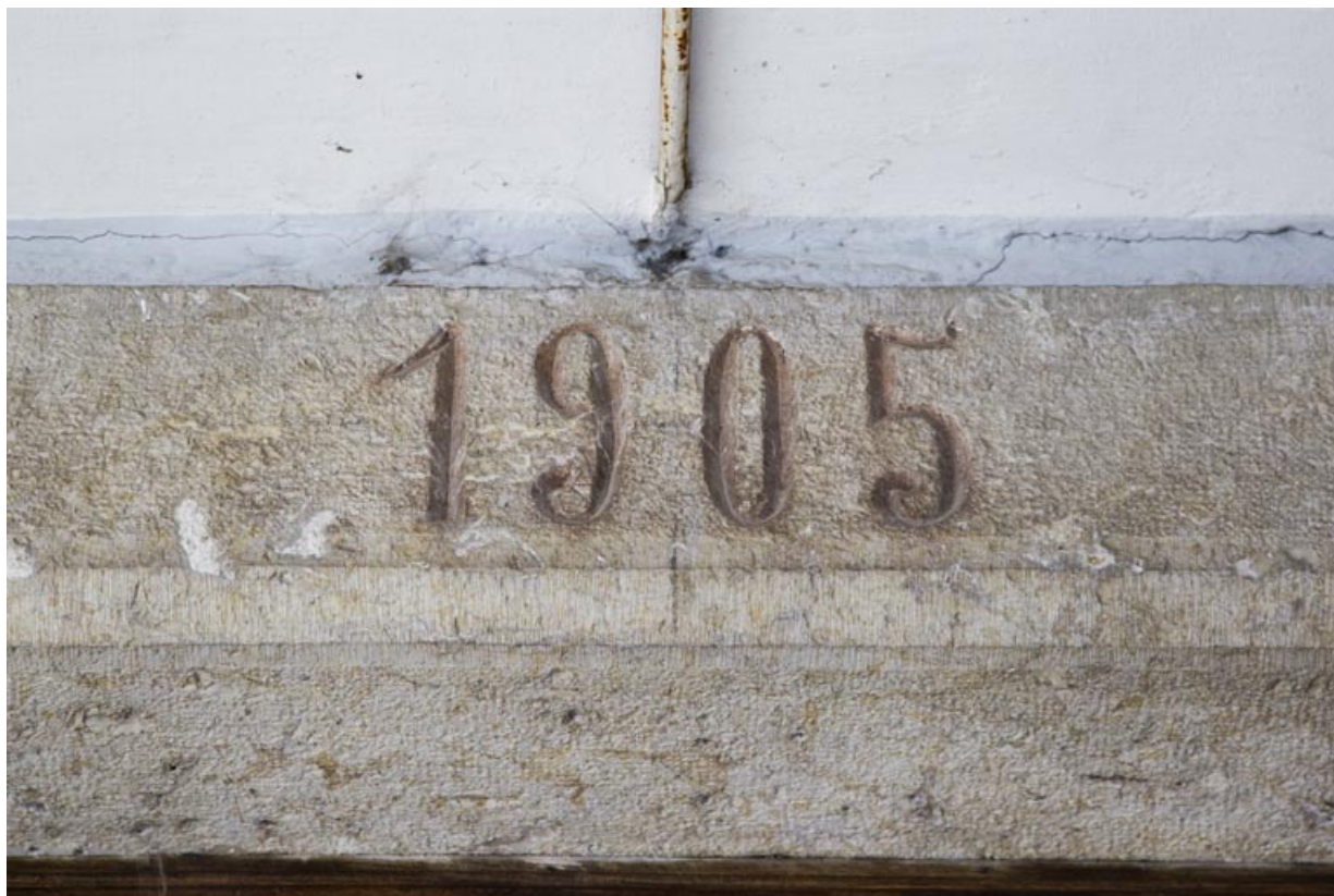
Date 1905 gravée sur le linteau de l'entrée de l'usine.