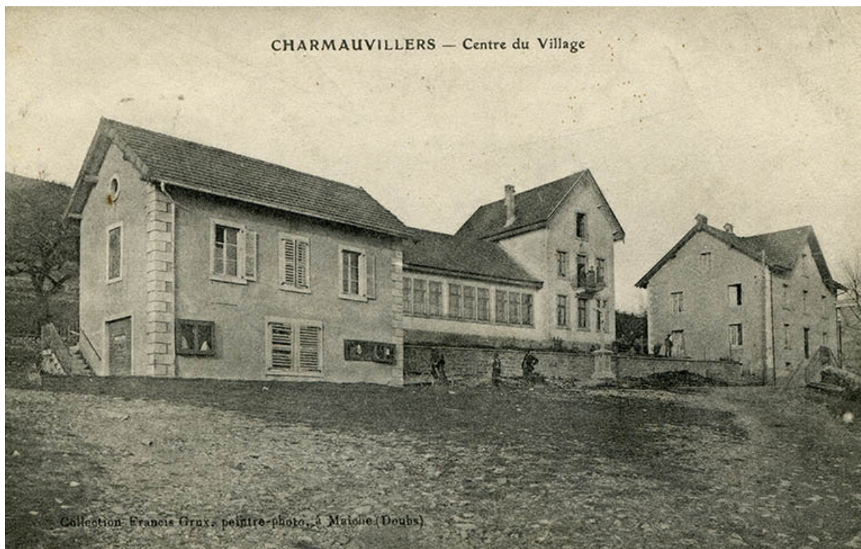
Charmauvillers - Centre du village, 1er quart 20e siècle (avant 1909). 25, Charmauvillers, 7 Grande Rue