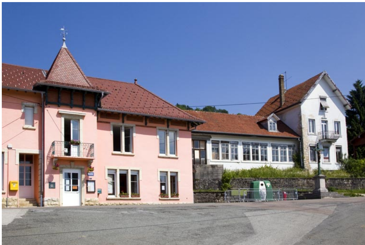
Vue d'ensemble depuis le sud. 25, Charmauvillers, 7 Grande Rue