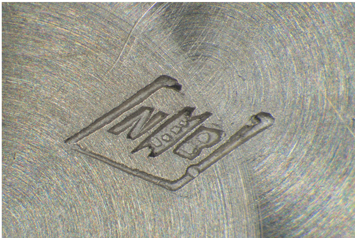
Poinçon de maître de la société Bourgeois et Nappey.