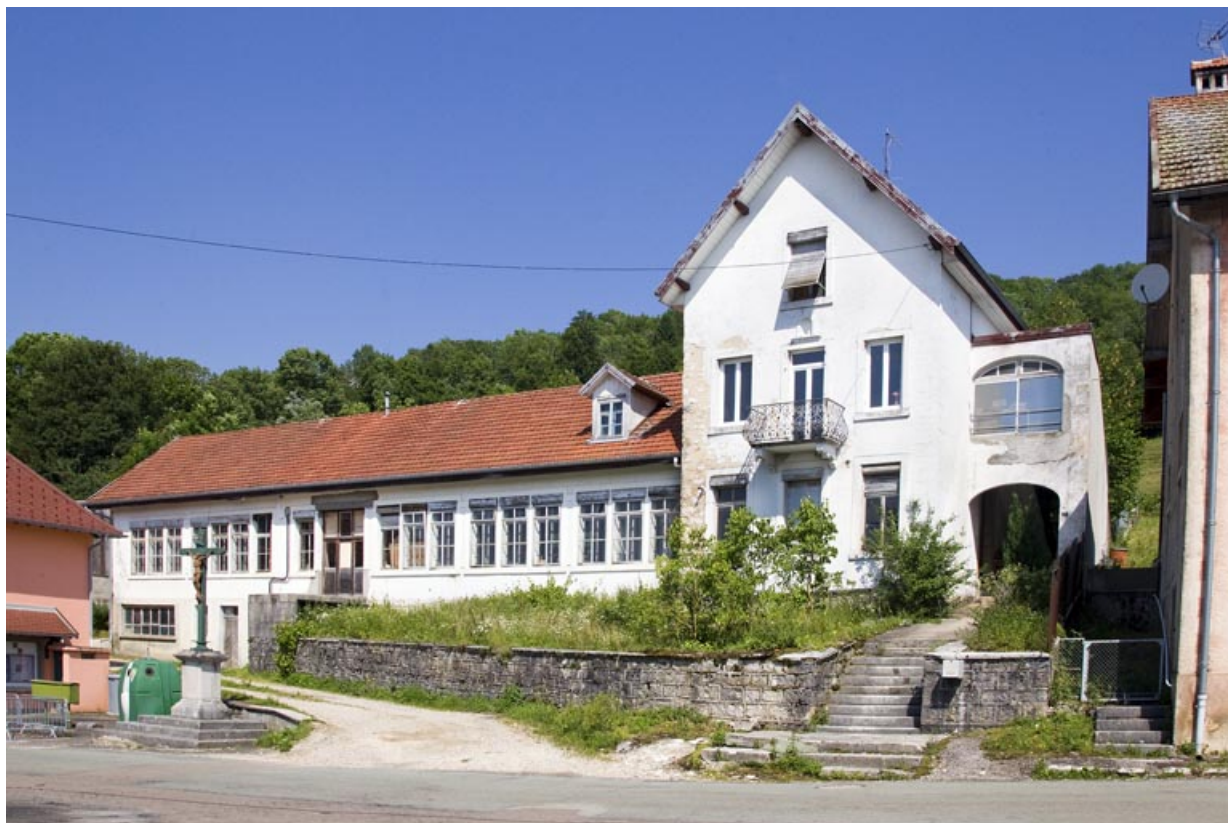
Usine de boîtes de montre Nappey Frères, à Charmauvillers.