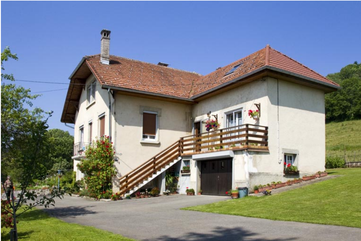
Vue d'ensemble de trois quarts droite.