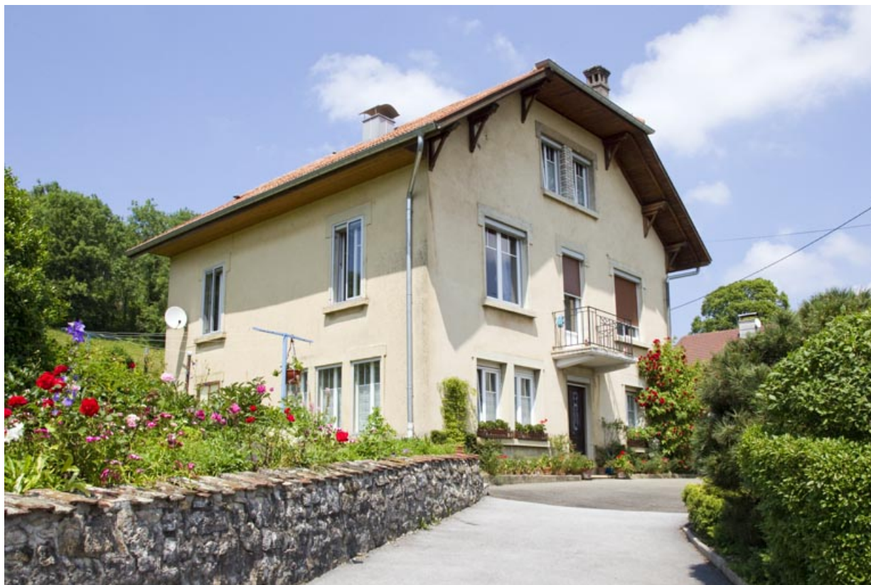
Vue d'ensemble de trois quarts gauche.