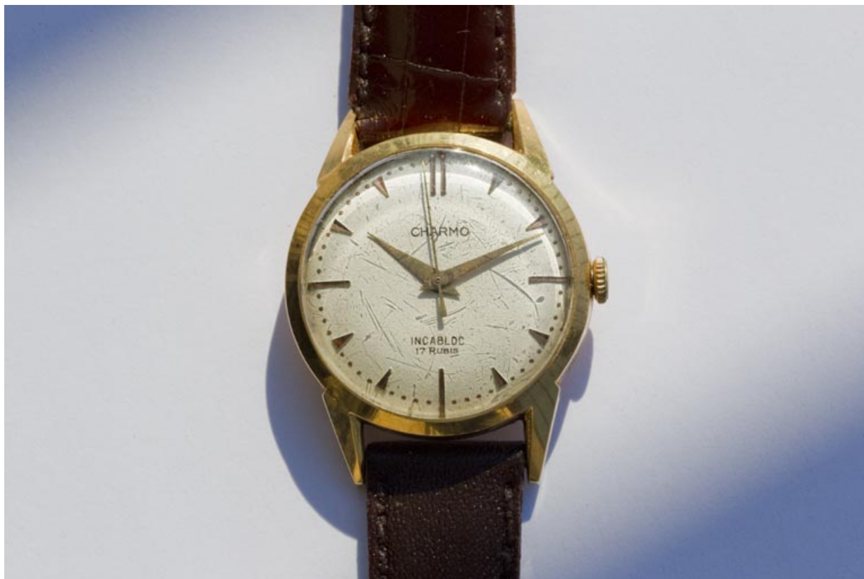
Montre de marque Charmo fabriquée dans l'atelier (éclairage rasant). 25, Charmauvillers, 11 Grande Rue