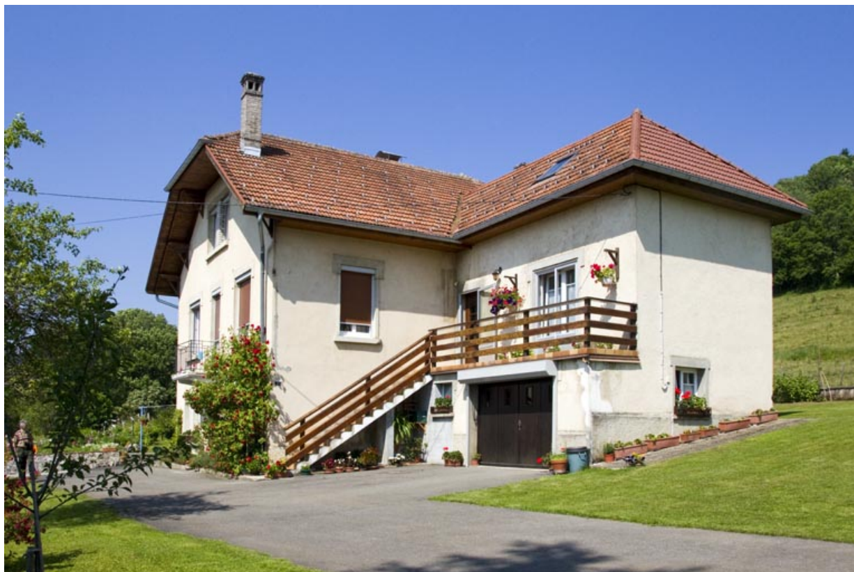
Vue d'ensemble de trois quarts droite.