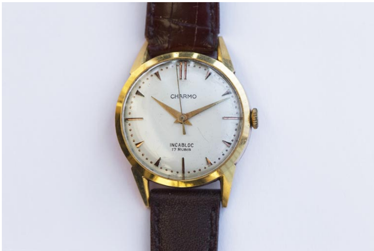
Montre de marque Charmo fabriquée dans l'atelier.