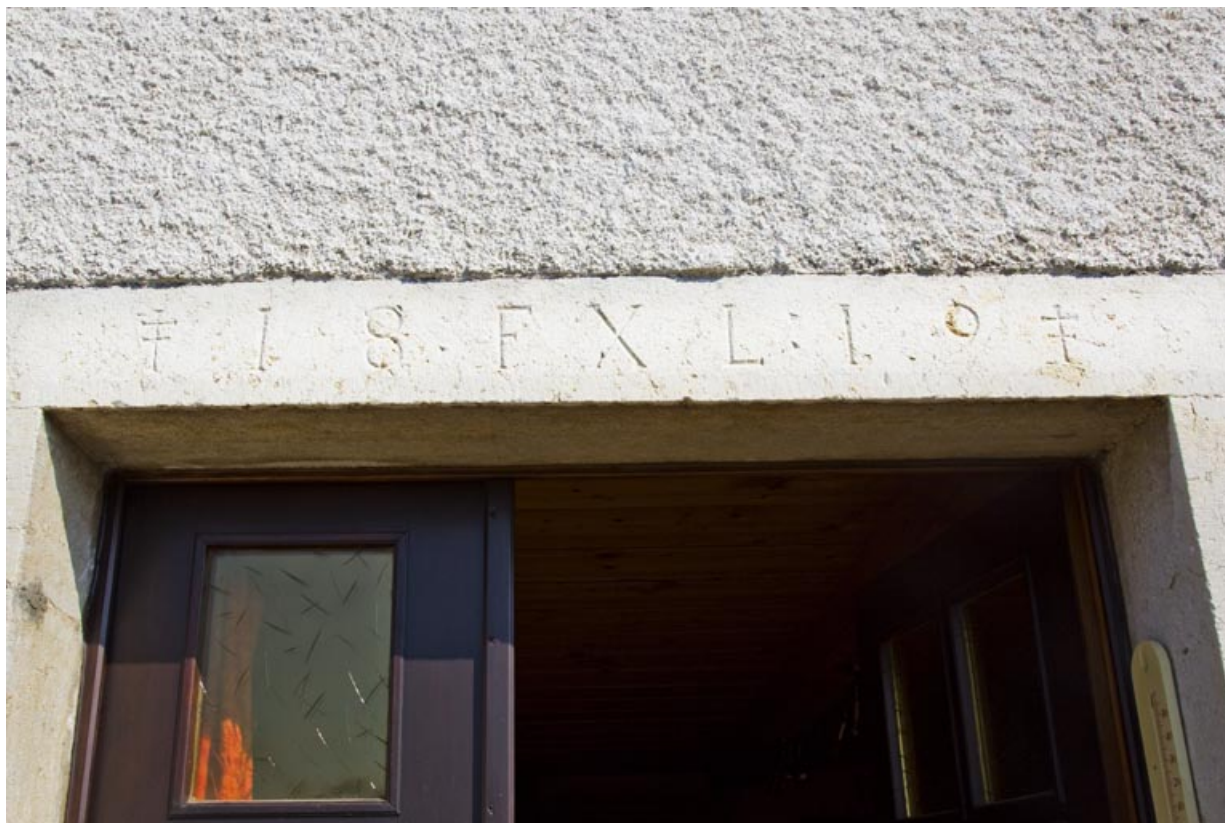
Linteau de la porte principale de l'habitation, portant la date 1819. 25, Charmauvillers, 17 Grande Rue