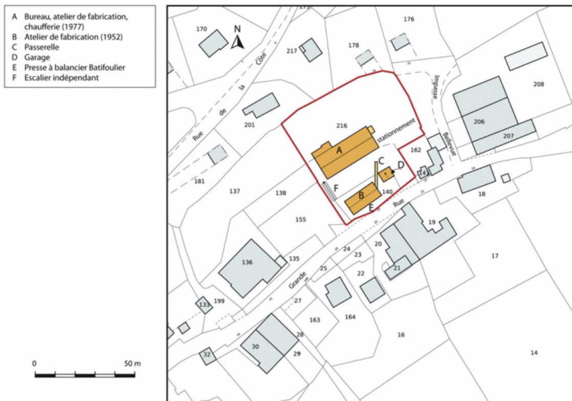
Plan-masse et de situation. Extrait du plan cadastral, 2013, section AC. 25, Charmauvillers, 23-25 Grande Rue