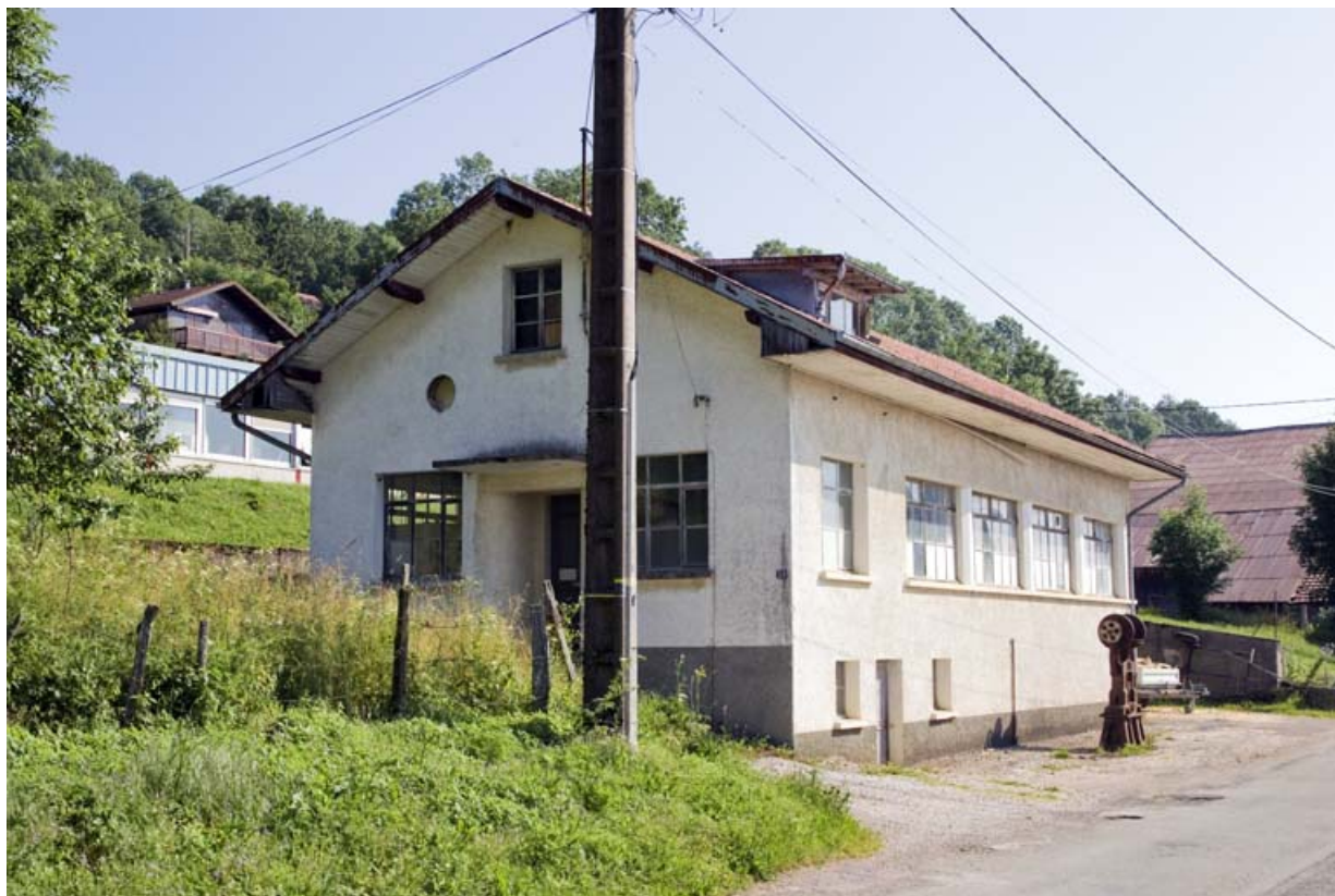
Atelier d'origine, de trois quarts gauche.