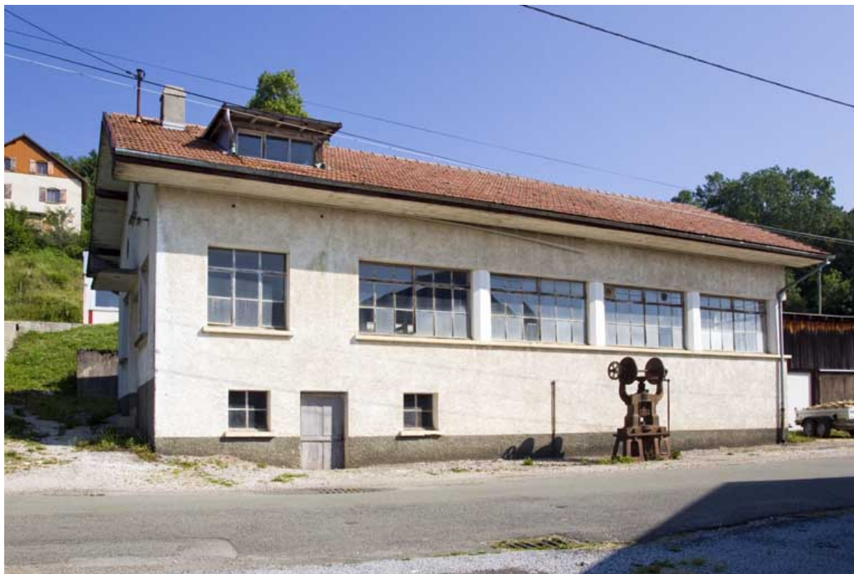
Atelier d'origine : façade antérieure.